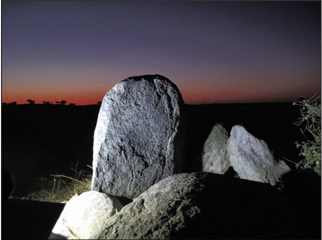
Anta do Telhal: vista geral do monumento