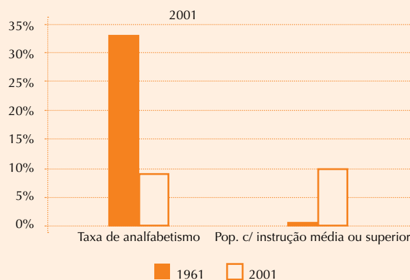
Figura n.º 2 – Evolução dos níveis de instrução em Portugal