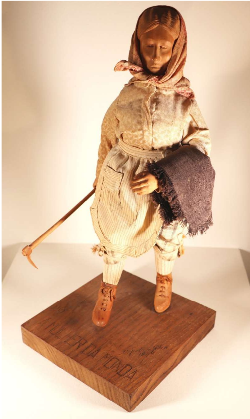
Figura 6. A mulher da monda

Fomos inicialmente alertados, para este ainda vasto conjunto de peças escultóricas, devido ao estado de abandono em que se encontrava a coleção que, encaixotada e esquecida, se amontoava numa das dependências da Junta de Freguesia de Alcáçovas. Depois dum primeiro contacto telefónico e exploratório, para confirmar a sua existência, conseguimos visitar e fotografar a coleção alguns dias depois. As peças, já fora das caixas onde originariamente se guardariam, mas descuidadas, cheias de pó e atacada de xilófagos exibiam-se em mesas e estantes. À data, em abril de 2021, sugerimos aos responsáveis pela Junta de Freguesia que procedessem a uma urgente desparasitação das peças porque os xilófagos atacavam, ferozmente, sobretudo as bases das peças, maioritariamente obtidas em sobre e azinho, menos resistentes do que a madeira