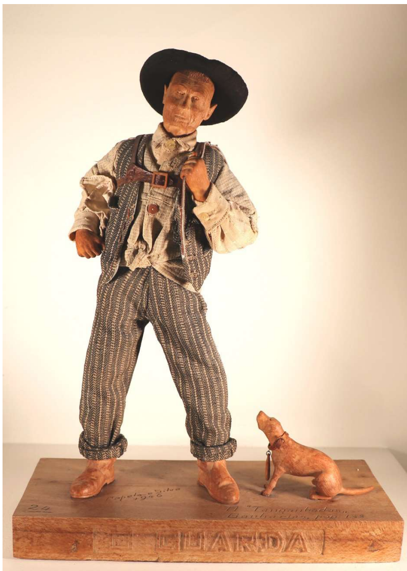
Figura 13. O Tanganhadas

ratinhos a jorna a cobrar, conseguiam trabalho e matar a fome a si e aos seus, com a chegada das máquinas, primeiro a vapor e depois a gasóleo só lhes restou uma solução, emigrar, ou para Lisboa ou para lá dos Pirenéus. E no Alentejo, hoje despovoado já não se ouvem os cantares melancólicos dos ranchos de ceifeiras que Capela e Silva tão bem conheceu e que em prosa descreveu e em madeira de bucho esculpiu. Hoje no profundo silêncio da planície alentejana apenas, de tempos a tempos, se ouve o ronronar de alguma máquina agrícola, entre as monótonas paisagens de monocultura de olivais e amendoais regados pelas águas retidas do Guadiana e do Caia e, de quando em vez, o som abafado de algum chocalho pendurado de algum gado que ainda sobrevive neste Alentejo que já despovoado, agora lentamente se desertifica.