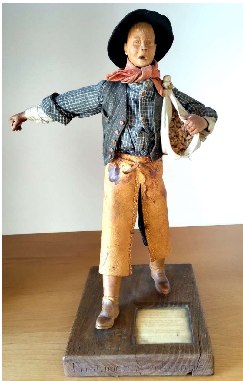
Figura 12. O sementeiro

Se consideramos os textos de José Capela e Silva inscritos no espírito neorrealista que marca, de forma indelével a escrita interventiva e de denúncia das condições de trabalho dos camponeses alentejanos, a sua escultura que complementa a sua escrita, deve ser considerada no âmbito da arte hiper-realista, tal o pormenor e rigor com que a executa.