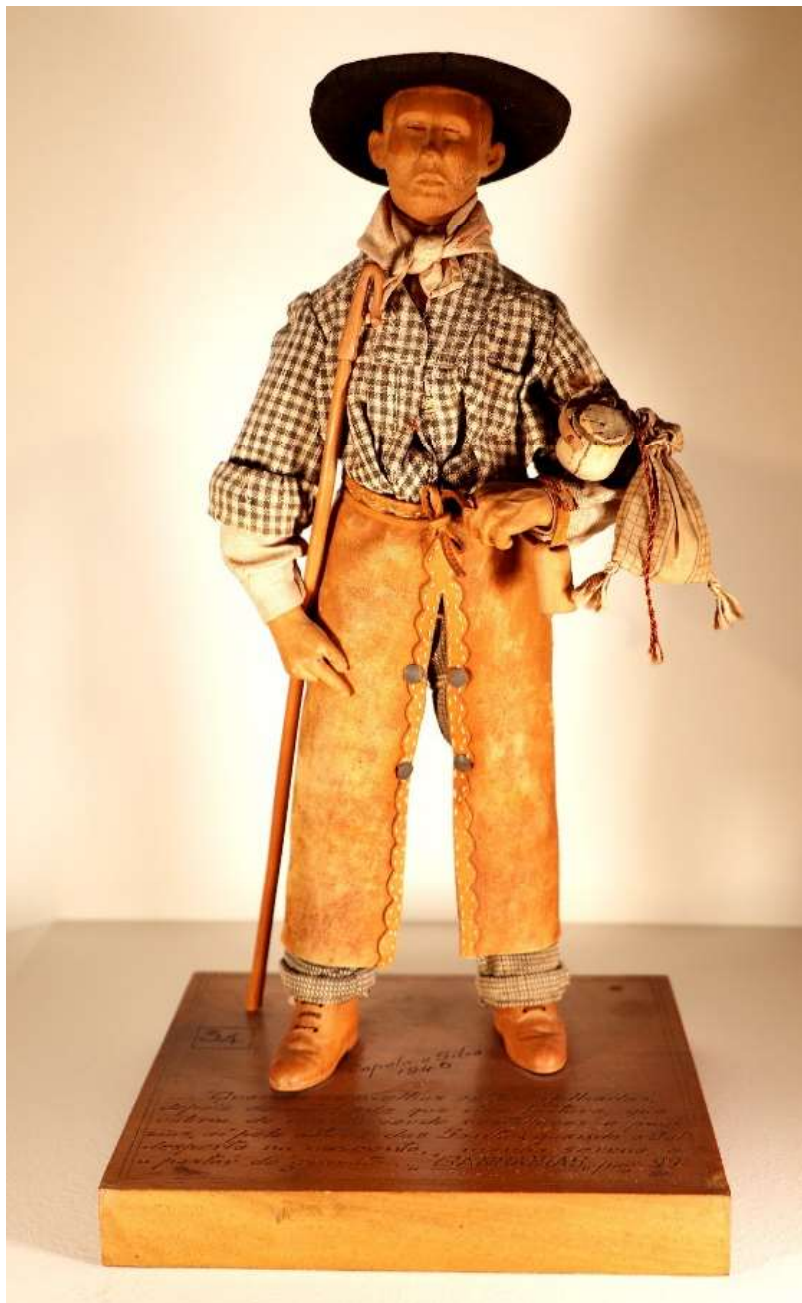
Figura 8. O pastor