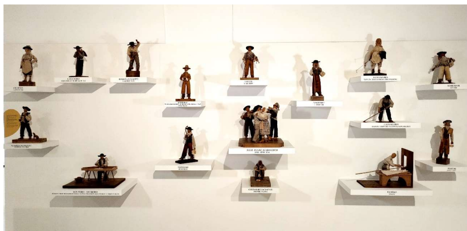
Figura 14. Peças de José Capela e Silva expostas no Museu de Elvas