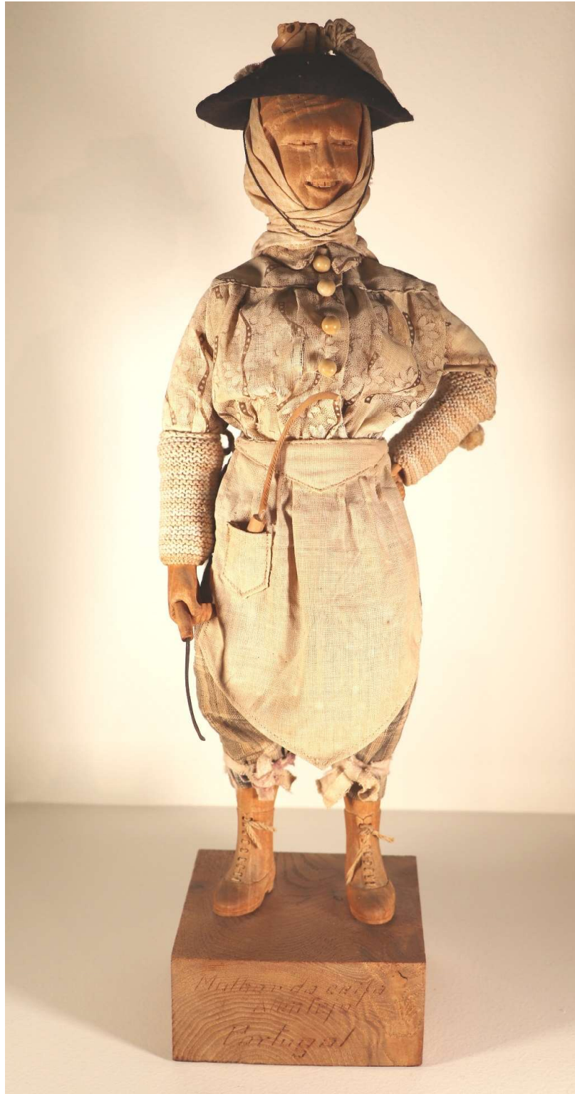
Figura 4. A ceifeira