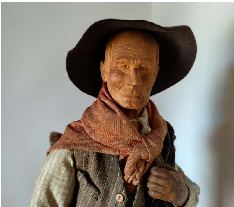
Figura 9. O porqueiro

Neste breve estudo que aqui apresentamos haverá que reconhecer que ainda muitas dúvidas subsistem