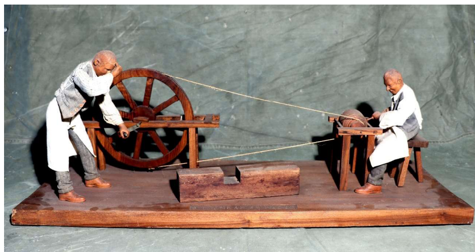
Figura 2. Abegão e ajudante ao torno

Pelos textos que produziu, quer em livros, quer em artigos de revistas ou jornais, Capela e Silva através da sua sensibilidade social, dá-nos uma visão do sofrimento atroz do trabalho do campo, especialmente das mulheres, que ainda muito antes do raiar do Sol já se aprontavam para a labuta, durante as mondas e especialmente das ceifas, sob um sol abrasador, que durava até que, no horizonte o avermelhado da estrela que nos alumia, se despedia depois de mais um dia de intenso calor. A descrição do esforço durante o árduo trabalho da ceifa, na altura de maior calor, desempenhado, maioritariamente por mulheres, que de corpo partido pela cintura segavam o mais rente possível os caules da planta do trigo. Capela e Silva descreve, com arguto pormenor e elevada sensibilidade social, essa labuta infundável sob o escaldante sol do Alentejo e denuncia os impropérios que o capataz constantemente bradava ao rancho de mulheres, mas especialmente às mais novas, que menos habituadas a estas tarefas viam as suas forças descaírem ao ponto de colapsarem sob a indiferença de quem nelas mandava. O restolho tinha de ficar o mais rente possível, obrigando a que mais baixo se segasse o trigo. Mulheres e homens partidos pela cintura debruçavam-se, quase rente ao solo, febrilmente para acompanhar o ritmo imposto pelo manajeiro. Ajudava a passar melhor o tempo e aliviar o esforço tremendo o canto, mais dolente ou mais alegre que os ranchos continuamente entoavam.