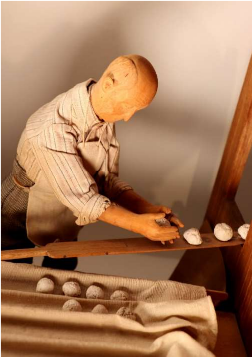
Figura 7. O padeiro

Em Évora, pertença do Município, existem duas peças que terão ficado nesta cidade na sequência da exposição que aqui se realizou com a obra escultórica de Capela e Silva, que decorreu de 23 de junho a 2 de julho, de 1979, onde se reuniram cinquenta peças do autor. A exposição foi promovida pelos Serviços de Turismo da Câmara Municipal de Évora e pelo Grupo Pró-Évora. Editou-se, na ocasião, um breve folheto alusivo ao autor e à sua obra. Posteriormente, viemos a identificar outra peça na sede da Entidade Regional de Turismo do Alentejo e Ribatejo, proveniente do acervo do museu de Artesanato. Também, na sua terra adotiva, Santa Eulália, na sede da Junta de Freguesia viemos encontrar uma única peça, mais um Semeador, que faria parte duma coleção mais alargada que, entretanto, foi incorporada no Museu de Arqueologia e Antropologia de Elvas. Em conversa informal, junto ao balcão dum café de Santa Eulália, enquanto