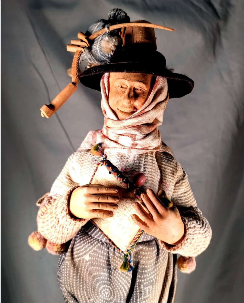
Figura 3. Ceifeira em dia de acabamento