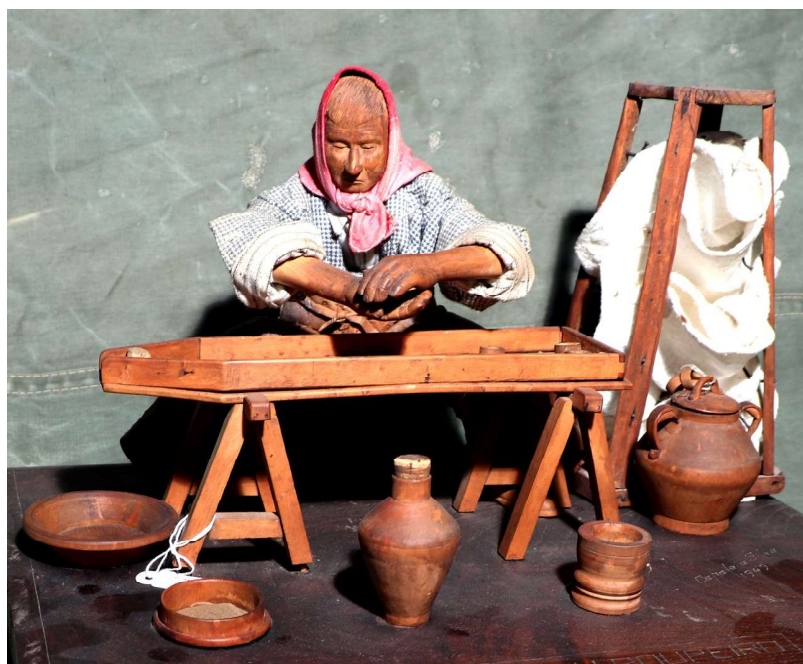
Figura 11. A roupeira