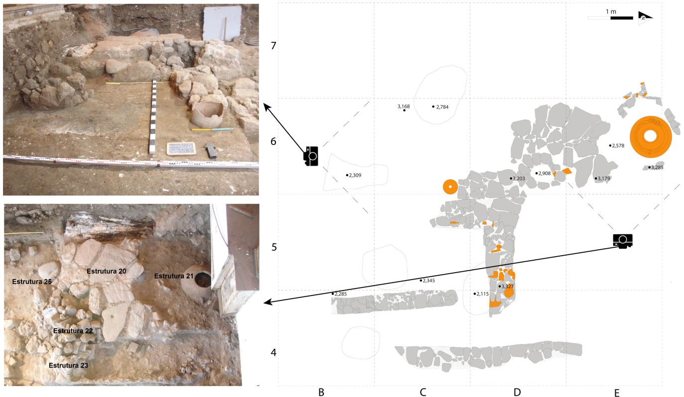
Figura 2. Estruturas romanas identificadas durante a intervenção na Igreja do Espírito Santo (adaptado de Ferreira 2010).

proveniente das intervenções arqueológicas na Igreja, trata-se de um exemplar quase completo, grafitado e decorado (Fig.2, nº 2).