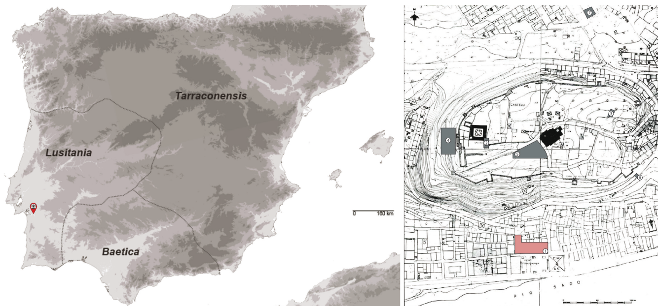
Figura 1. Localização de Salacia e do contexto arqueológico em estudo.

sença maioritária de ânforas lusitanas, consequência natural da existência de um importante complexo de produção anfórico na região (Pimenta et alii 2016; Pimenta, Sepúlveda e Ferreira 2015).