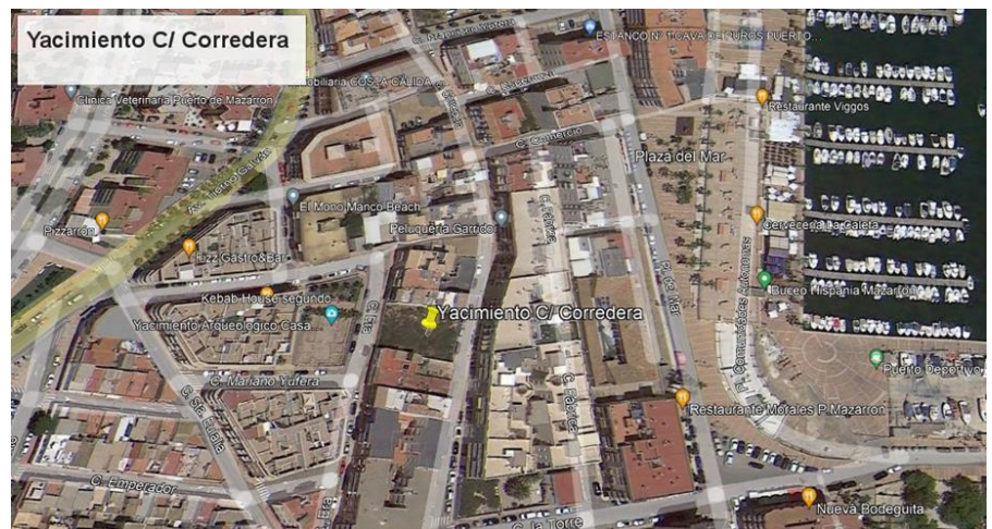
Figura 1. Situación de la zona.

Con la retirada de los niveles superficiales de relleno, se documentó una fase perteneciente al período constructivo de época contemporánea, con una ocupación ininterrumpida, donde se presenta un panorama muy completo de la evolución histórica de la ciudad entre los siglos I a. C. - VII d. C. al que hay que añadir la presencia de inhumaciones en fosa excavadas en la roca de base cuyas características son inéditas en este sector del casco