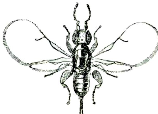
FIGURA 5. Ilustração, de uso livre, de uma vespa fêmea de Blastophaga psenes .

A reprodução sexuada das figueiras está dependente das vespas que as polinizam. A espécie Ficus carica L. é polinizada pelas vespas fêmeas da espécie Blastophaga psenes L. (FIGURA 5).