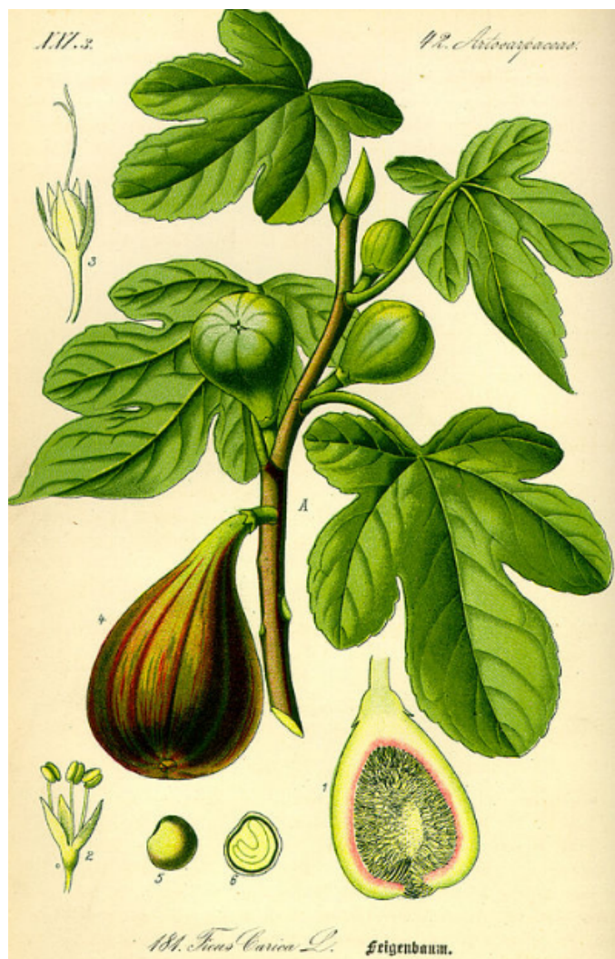
FIGURA 4. Ilustração, de uso livre, onde estão representados: A – ramo com folhas e síconos, 1 – sícono cortado longitudinalmente, 2 – flor masculina, 3 – flor feminina, 4 – sícono em fase avançada de maturação, 5 – aquênio, 6 – aquênio cortado longitudinalmente.

A reprodução sexuada das figueiras está dependente das vespas que as polinizam. A espécie Ficus carica L. é polinizada pelas vespas fêmeas da espécie Blastophaga psenes L. (FIGURA 5).