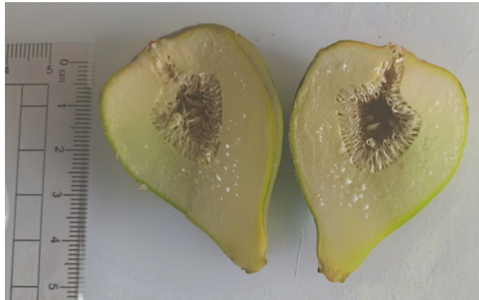
FIGURA 2. Corte longitudinal de sícono imaturo. Fotografia realizada, em Oeiras, a 17 de maio de 2022.

A inflorescência evolui para uma infrutescência carnuda e suculenta (FIGURA 3) constituída por aquênios – frutos secos, monospérmicos, nos quais a semente se une ao pericárpio por um só ponto 3 ( Flora Ibérica ).