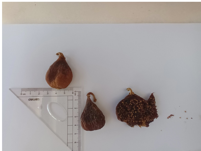
FIGURA 3. Síconos maduros desidratados. No sícono aberto são visíveis os aquênios, esféricos e de cor amarela. Ao lado estão alguns aquênios destacados da infrutescência e no extremo da fotografia está uma semente, de cor castanha. Fotografia realizada, em Oeiras, a 17 de maio de 2022.

A inflorescência evolui para uma infrutescência carnuda e suculenta (FIGURA 3) constituída por aquênios – frutos secos, monospérmicos, nos quais a semente se une ao pericárpio por um só ponto 3 ( Flora Ibérica ).