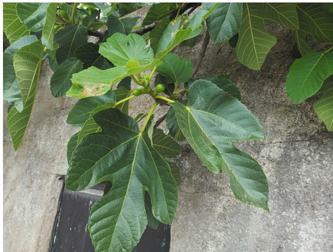
FIGURA 1. Ramo de figueira composto por várias folhas e diversos síconos. Fotografia realizada, em Oeiras, a 17 de maio de 2022.

A relação interespecífica de mutualismo obrigatório entre figueiras e vespas ocorre há, aproximadamente, 40 milhões de anos 1 , com benefícios para as diversas espécies do género Ficus L., família Moraceae , e para as espécies de vespas da família Agaonidae , ordem Hymenoptera . As figueiras são polinizadas pelas vespas e estas recebem, no interior dos figos, proteção e alimento para a sua descendência. O género Ficus inclui cerca de 850 espécies monoicas de trepadeiras, arbustos e árvores 2 , e cada uma tem uma espécie de vespa que a poliniza. As figueiras produzem síconos – inflorescências que, por maturação, se transformam em infrutescências (FIGURA 1).