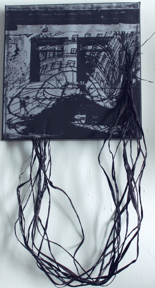
CELIA BRAGANÇA Mozambique, 1965