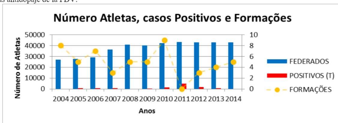
Gráfico 1- Análisis estadístico 1 : Porcentaje de resultados positivos de dopaje en función del número de formaciones educativas antidopaje de la FDV.

Después de consultar los mismos, detectamos que la información pretendida se encontraba limitada, o que condicio el estudio . En resumen, al analizar los datos se concluyó: En el año 2011 hasta el año 2014 existe un descenso en la toma de muestras, en el año 2011 se realizaron un total de 5.748 análisis y en 2014 sólo 3843 análisis. La razón por la cual esto sucede es de todo desconocida(ver el número total de muestras gráfico 3 y tabla 2).