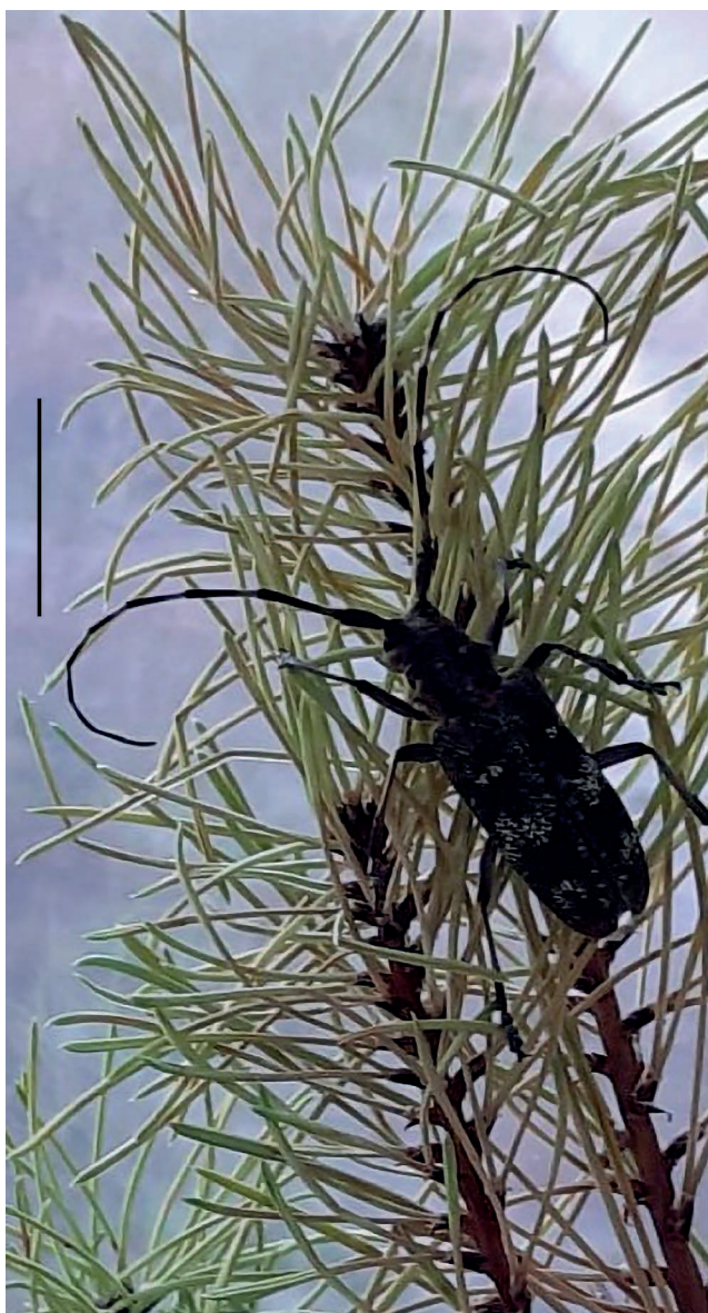
Figura 2 – Monochamus galloprovincialis , inseto-vetor do nemátode da madeira do pinheiro (barra = 1 cm).