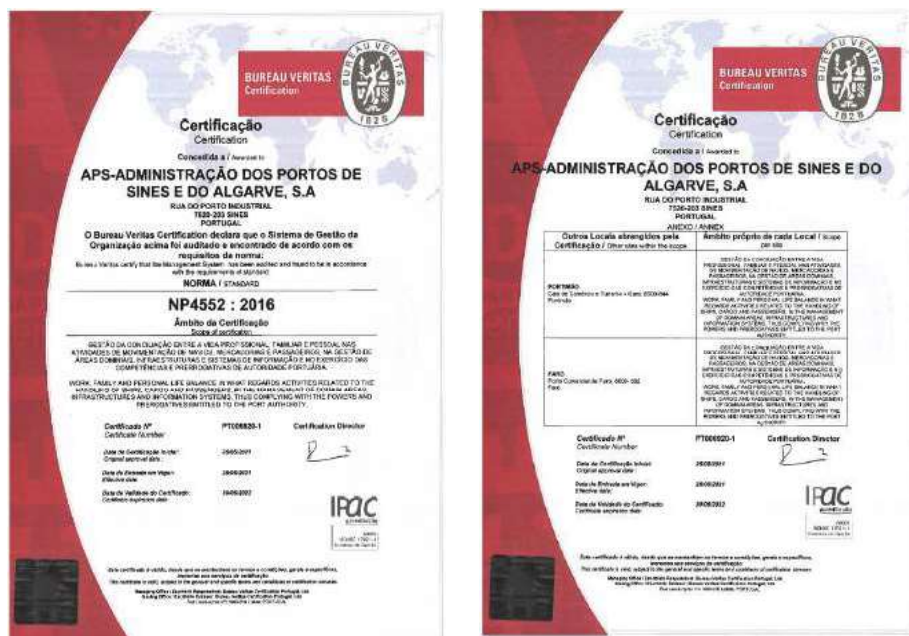
Figura 3 – Certificado pela Norma NP 4552:2016

Com a formulação das proposições de estudo pretende-se garantir o diagnóstico e o apoio à monitorização da execução de um Programa de Conciliação e de um Plano para a Igualdade, em adenda, que potenciase a manutenção do Sistema de Gestão da Conciliação, adentro do Sistema Integrado de Gestão (SI) da empresa, e que garantisse a certificação pela Norma NP 4552:2016, a qual se verificou em 25-05-2021 (Ver Figura 1).