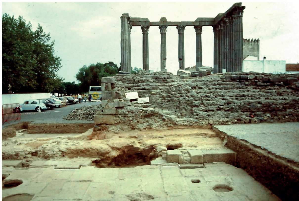
Fig. 2. Vista geral da intervenção conduzida por Theodor Hauschild na praça do templo de Évora.

muralha e o antigo achado de um Sátiro reclinado 9 que poderia fazer parte do programa da frons scaenae alegam a favor dessa possibilidade. Em contrapartida, a possibilidade de um anfiteatro corresponder ao desenho urbano da rua de S. Manços, a sul da Sé catedral 10 parece contraditada por recentes escavações arqueológicas 11 , na medida em que uma intervenção no Colégio dos Meninos do Coro permitiu identificar um laconicum de difícil atribuição, mas eventualmente pertencente a um espaço privado. Por este motivo, continua sem atribuição plausível a menção epigráfica de TRICIO. A/OPATRO / ON. SVBSEL em placa encontrada na Rua de Alcárcova de Cima 12 , relacionada com o topónimo de Rua da Selaria, nas proximidades.