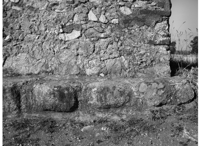
Fig. 5. Alicerces do aqueduto romano sob a estrutura do século XVI.

Na fase da “Évora gloriosa” seiscentista, já a pré-existência de um aqueduto monumental tinha suscitado uma acesa polémica literária, finalmente desfeita quando André de Resende empreendeu uma escavação que comprovou a presença de alicerces. Assim se legitimava a pretensão eborense de se construir uma estrutura análoga, símbolo de modernidade da urbe em renovação. Todavia, este episódio foi sempre entendido como mais uma das histórias forjadas por Resende, na medida em que o humanista eborense não hesitava em confundir factos com ficção. Os trabalhos de Francisco Bilou permitiram de modo minucioso comprovar a veracidade do relato resendiano 28 , definitivamente comprovando a existência de uma estrutura portante de água (Fig. 5). Mais elevado do que o próprio aqueduto seiscentista, atingia a praça do forum no Largo do Conde de Vila Flor, ou seja, muito próximo da cota mais elevada da urbe, com uma extensa rede de cloacas e canalizações conduzindo água a partir do specus central. Recentes escavações arqueológicas, ainda não publicadas, permitiram comprovar a existência de alguns pegões do aqueduto romano em zona extra-urbana.