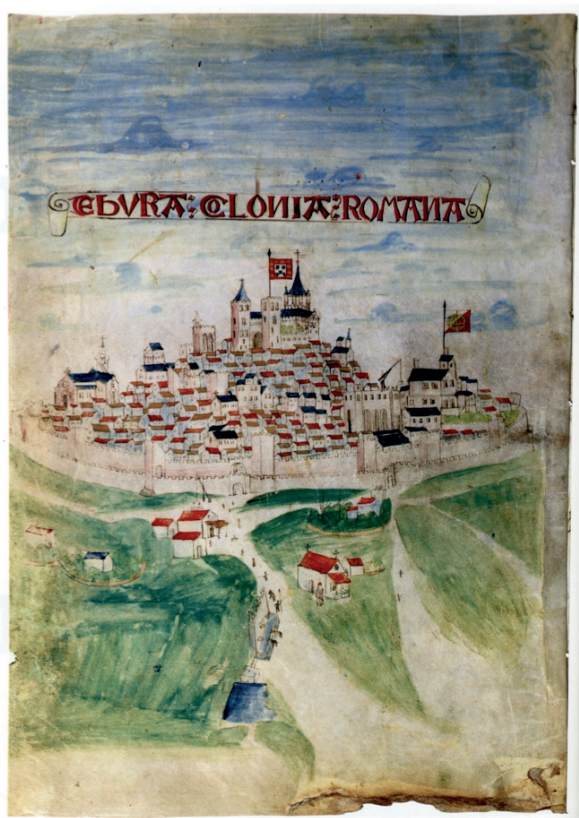
Fig. 1. Frontispício do foral de Évora (1501) – Biblioteca municipal de Évora.

Ebora Colonia Romana tem sido, ao longo de múltiplas épocas, o refúgio mítico no qual a cidade sempre se reconheceu. O foral da cidade (1501) (Fig. 1) é emblemático: na ilustração de capa lê-se esta legenda, uma designação que em época romana nunca foi atribuída, mas que mostra como neste forjar de uma presumida identidade se procurava a ambição de renovar a urbe, transformando-a na capital de um novo Portugal, moderno e cosmopolita 3 . Também por isso, torna-se a primeira cidade a beneficiar de uma monografia histórica, a História da Antiguidade da Cidade de Évora (1548), escrita por André de Resende, reflectindo modelos históricos que o autor vira aquando das suas passagens por Itália. Textos de variados autores foram desde então escritos combinando dados históricos com mitos e fantasias, tornando cada vez mais complexo distinguir a Ebora romana destas Évoras míticas , assim consolidando um notável paradoxo: esta é uma cidade sobre a qual muitos escreveram mas sobre a qual pouco se sabe. Veja-se que nos últimos quarenta anos ocorreram em Évora mais de 100 intervenções arqueológicas dirigidas por mais de 70 arqueólogos distintos, mas ainda está por fazer uma síntese que nos permita recuperar e conhecer a Ebora real que, talvez, ainda se esconda sob o empedrado das suas ruas.