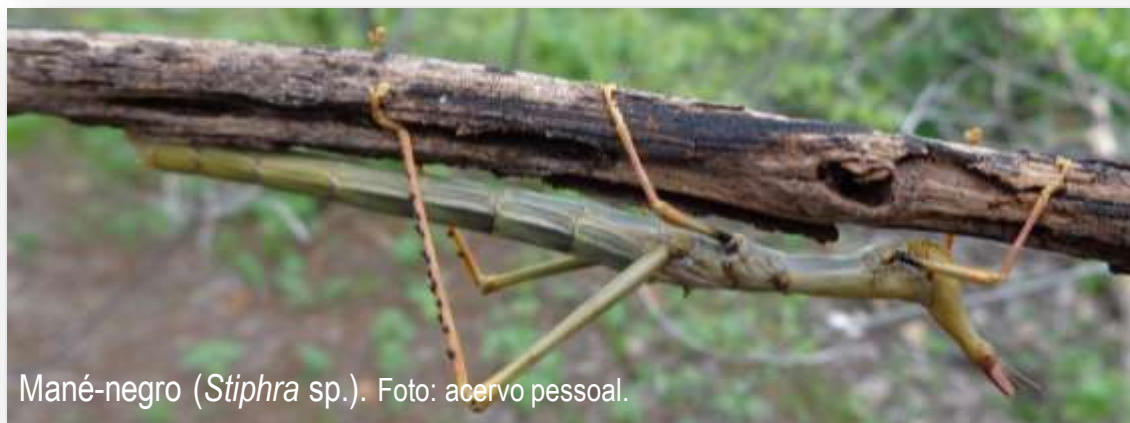
Mané-negro ( Stiphra sp.).