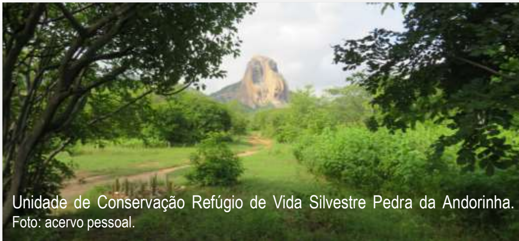
Unidade de Conservação Refúgio de Vida Silvestre Pedra da Andorinha.