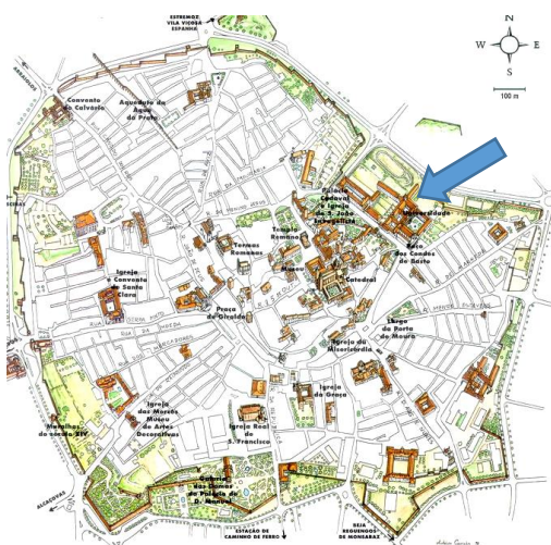
Mapa de Évora/Map of Évora