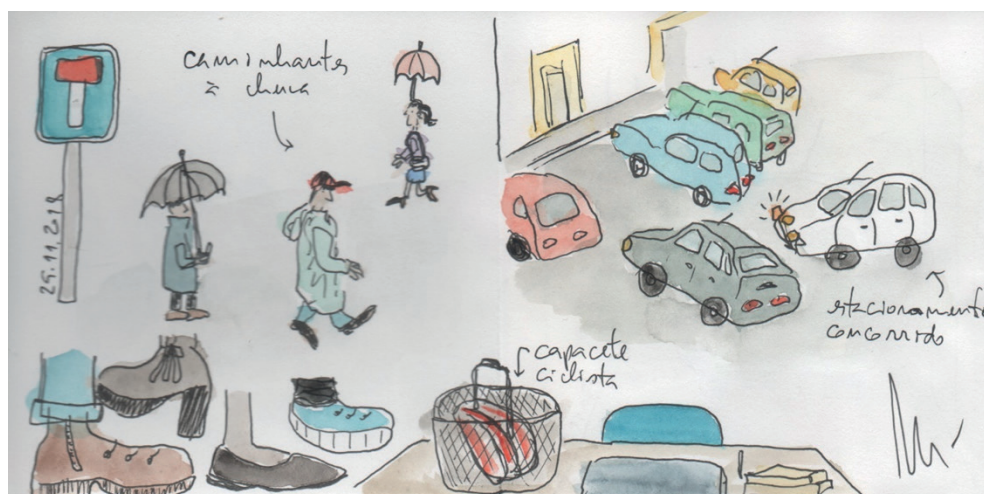
Figura 2 ▶ Caminhantes à chuva, capacete de ciclista e estacionamento concorrido