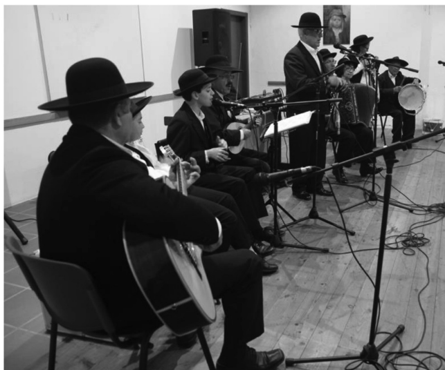
FIG. 5 – A Formação Atual do Grupo das Pedrinhas de Arronches