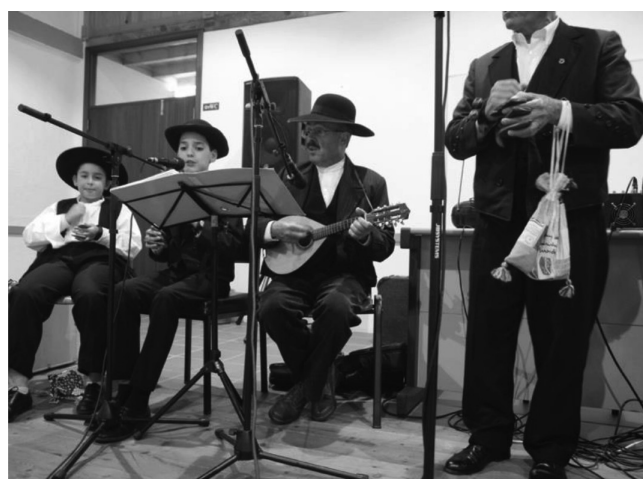
FIG. 6 – Detalhe das Diferentes Gerações de Tocadores de Pedrinhas

A origem do estilo Moda de Saias poder-se-á situar no século XVI como forma de dança palaciana, tendo no século XIX transformando-se em dança folclórica. Nos dias de hoje, a Moda de Saias é referida sob várias perspetivas: como um tipo de canção regional portuguesa; uma dança tradicional; uma forma de canto; ou até uma mistura das anteriores expressões. Para Giacometti e Lopes Graça, a Moda de Saias estava associada a despiques que aconteciam durante os trabalhos no campo aquando das colheitas, bem como em rituais de romance, podendo também ser dançadas em forma de roda em ocasiões de festa e descontração popular 4 5 .