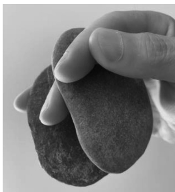
FIG. 1 – Castanholas de Pedra