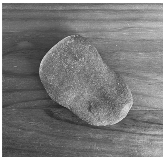
FIG. 3 – Seixo grauvaque de tocador de pedrinhas