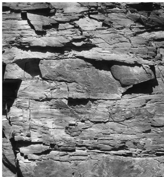
FIG. 2 – Detalhe de Rochas Grauvaque