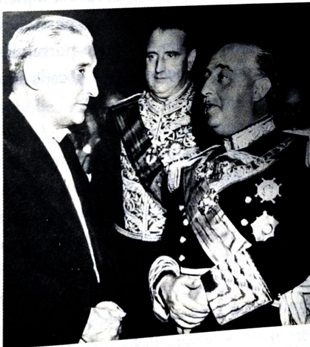
FIGURA 2 – Salazar y Franco, en el Palacio de Ajuda. Mundo Hispánico. Suplemento especial , p. 5.

Estamos, pues, ante un gran acontecimiento con una evidente finalidad propagandística, que contó con un monumental despliegue mediático y con una orquestada arquitectura oficial, en la cual, muy significativamente, sin embargo, Salazar se mantuvo siempre, con gran habilidad, en un segundo plano. Habían pasado diez años desde la conclusión de la Guerra Civil española y la firma del Tratado de No Agresión, así como veinte de la visita del mariscal Carmona a Madrid y Barcelona, circunstancia esta última presentada desde el relato oficial como motivo fundamental, en términos de retribución, del viaje de Franco.