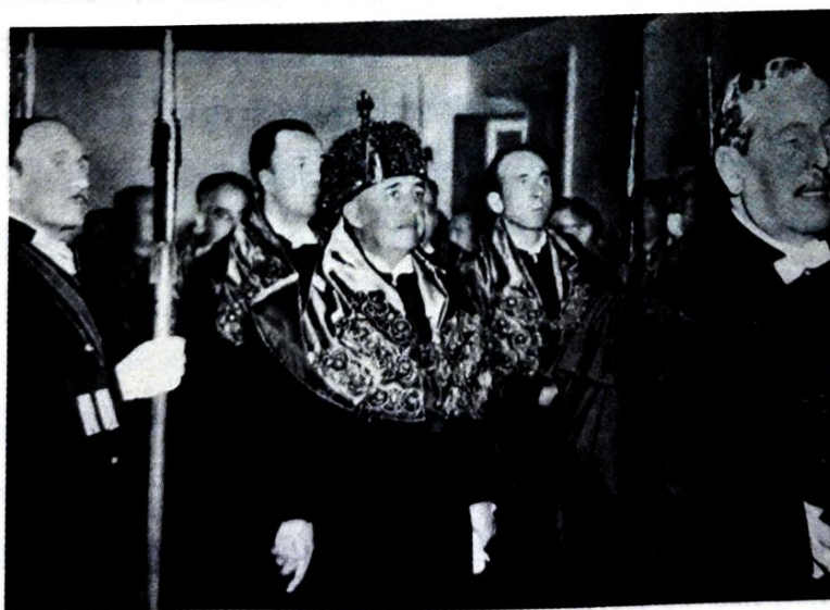
Figura 5. Francisco Franco, investido Doctor honoris causa Mundo Hispánico. Suplemento especial , pp. 8-9.

Ahora, 1949, aquel augurio lejano del poeta se había, decisivamente, convertido en realidad. Haciendo posible que un nuevo caudillo español fuese aclamado por Juventudes universitarias, por profesores, por todo el pueblo portugués. Con músicas y campanas. Había sucedido que, desde siglos, podía otra vez un español “tener Razón en Coimbra”. Sin distingo alguno. En forma simbólica de Capelo o doctoral birrete. Jamás he visto a Franco más emocionado, más estremecido que, en ese momento histórico. Consciente de su responsabilidad. Más que un Doctor parecía un místico. (Giménez Caballero, 1949b: 41)