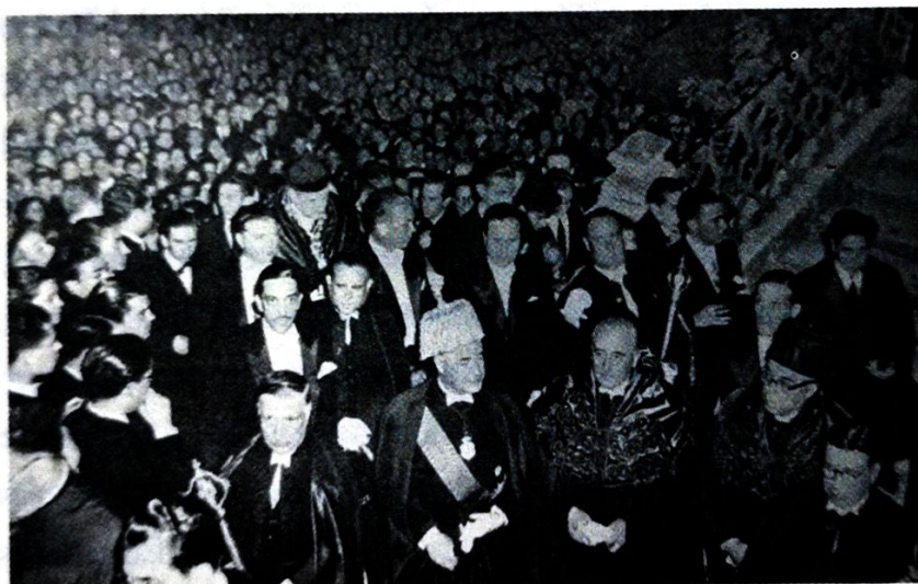
FIGURA 3 – Franco atravesando la Via Latina.

Universidad de Coimbra. La comitiva se había instalado en el Palace Hotel de Bussaco, de donde partió al inicio de la tarde en un Rolls cedido por el Estado portugués, que aparcó junto a la Porta Férrea, lugar desde el cual salió Franco para visitar la Capilla y la Biblioteca, punto de formación del cortejo que le acompañaría hasta la Sala dos Capelos. En las reuniones previas, preparatorias de la visita, se habían barajado tres nombres como posibles padrinos de Franco en el acto académico: el Presidente de la República, el Presidente del Consejo o el Cardenal Patriarca, resultando al fin ser este último el elegido.