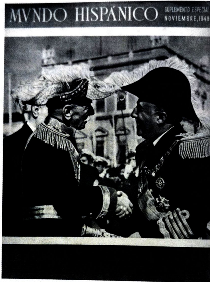
FIGURA 1 – Mundo Hispánico. Suplemento especial . Madrid, noviembre de 1949.

La visita de Estado no se limitó a Lisboa, sino que llevó al caudillo a un importante conjunto de lugares significativos de la geografía portuguesa. Durante los seis intensos días del viaje, Franco tuvo la oportunidad de conocer Mafra, Sintra, Estoril, Bussaco, Coimbra, Fátima, Leiria, Batalha y Alcobaca, todos ellos “lugares de memoria” con gran contenido histórico y simbólico (Sanz Hernando y Cabrera, 2019: 192). En muchos de ellos, como correspondía a la ocasión, se sucedieron las recepciones y los discursos públicos de homenaje al ilustre visitante, constituyendo las bases visibles de una concordia ibérica en la que se manifestaba la doble vertiente esencial del destino