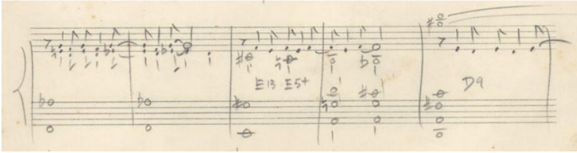
Fig. 4 – Trecho da partitura de Corcovado (Tom Jobim) (Jobim, 1963: c. 21 a 25).

No segundo acorde, tem-se outro exemplo de “cifragem aparente”. A cifra G#dim (G#°) na verdade está a disfarçar a dominante primária, o que pode ser justificado pelo facto do acorde G#° pertencer à mesma família que o B° 12 , ou seja, dominante primária de Dó maior (VII°). Convém, porém, citar que tanto no Songbook Tom Jobim (Fig. 5), quanto no Cancioneiro Jobim (Fig. 6), esse acorde aparece como G#°(b13) e G#dim7(b13), respectivamente, o que possibilita também outras explicações em relação à sua função de dominante. A primeira é considerar o G#°(b13) como uma “cifragem aparente” da dominante substituta 13 primária, ou seja, SubV7(#9) – no caso, Db7(#9)/Ab –, na segunda inversão e com a fundamental omitida. Uma segunda possibilidade, segundo Guest, seria atribuir à “cifra prática” 14 G#°(b13), a “intenção” do acorde G7(b9), ou seja, V7(b9) 15 (Guest, 2006, vol. 2, p. 114).