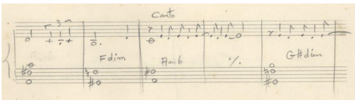
Fig. 3 – Trecho do manuscrito de Corcovado (Tom Jobim) (JOBIM, 1963: c. 11 a 15).

Na canção Corcovado (Tom Jobim), os dois primeiros acordes que dão suporte à melodia, formada inicialmente por apenas duas notas que se repetem, são um bom exemplo de que a opção do compositor pela “cifragem aparente”, ao que tudo indica, não deve ter ocorrido apenas em função da facilitação de leitura. No manuscrito original, partitura para piano (JOBIM, 1963), na tonalidade de Dó maior, Tom Jobim utilizou para os referidos acordes as cifras Am6 e G#dim (Fig. 3). O primeiro tem função de dominante secundária do V7. Nesse contexto, a cifra D7(9)/A, 10 ou simplesmente D7(9), representaria melhor a função do acorde, porém iria pressupor a presença da nota Ré na harmonia, sendo que a mesma foi omitida pelo compositor, estando presente apenas na melodia.