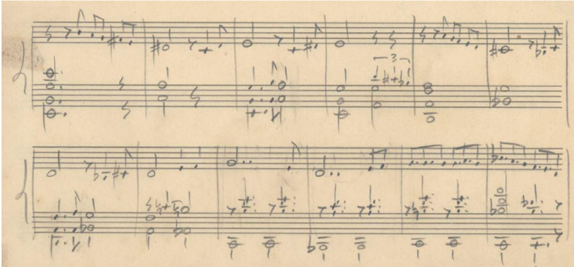
Fig. 16 – Trecho do manuscrito de Dindi (Tom Jobim e Aloysio de Oliveira) (Jobim, 1964).

Também na tonalidade de Dó maior, no Cancioneiro Jobim (Fig. 17) encontramos as mesmas “cifragens aparentes” Cm6 (c. 5-6) e Bbm6 (c. 9-10), em alternância com os acordes menores que estão a preparar: Em7 (IIIIm7) e Dm7 (IIIm7). Mais uma vez, surgem cifras Xm6 a disfarçar dominantes substitutas: SubV7(9)/III e SubV7(9)/II.