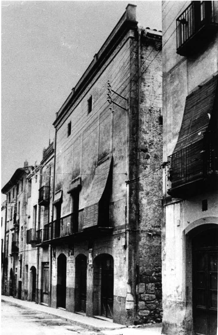
Façana principal de l'Ateneu (dècada de 1960).