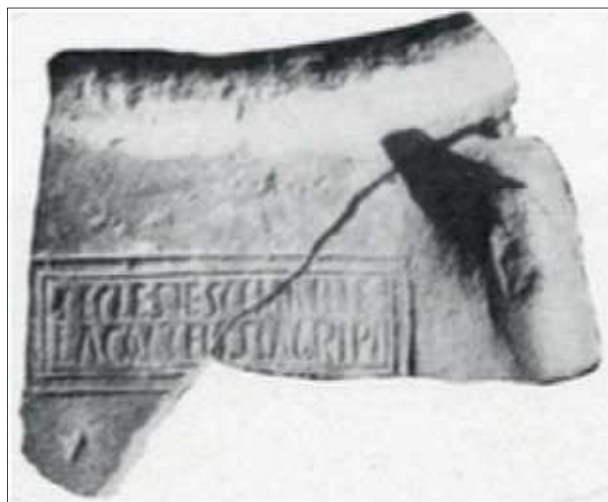
Figura 3. Inscrição em dolium de Monte da Salsa (Almeida 1962, fig. 301).

O elemento mais relevante, contudo, procede de um local próximo. Em Monte da Salsa (Serpa), uma das mais notáveis villae do Baixo Alentejo –todavia, severamente destruída pela plantação de olival intensivo– forneceu uma inscrição aposta no bojo de um dolium : ECLESIAE ESCE MARIE LACALTENSI AGRIFI (Almeida 1962, fig. 301) (fig. 3). Estes “potes estavam enterrados a 1,70 m ou 1,80 m de profundidade” no interior de um compartimen-