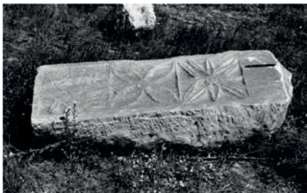
Figura 5. Elemento paleocristão semi-trabalhado encontrado in situ na pedreira de Horta Nova (Borba). Fotografia gentilmente cedida por Jorge de Oliveira obtida na década de 80.

cinas de laboração estavam em pleno funcionamento, o que ajuda a explicar a grande homogeneidade dos programas iconográficos e decorativos da zona emeritense.