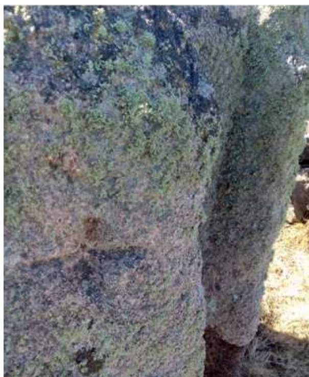
Figura 1. Peso de lagar da villa de Torre de Palma com cruz incisa numa das faces.

Neste âmbito de reforço produtivo, um dos dados mais relevantes encontra-se na villa de Monte do Meio (Beja). Em momento indeterminado instala-se um lagar (Peña Cervantes 2010, 888-890, com bibliografia), no qual um dos espaços sobrepõe-se a um pavimento de mosaico com tesselas de várias colorações com figuração de uma “divindade pagã” (Viana 1959, 40), sendo que o contrapeso é ele próprio a reutilização de um elemento arquitectónico ou escultórico em mármore. Embora o autor da notícia refira que esta e outras villae da zona foram “cristianizadas” (Viana 1959, 39) e terá tido longa ocupação, os dados não são claros. Todavia, no núcleo III, o espaço (da sala?) teve a figuração do mosaico central “propositadamente destruída, visto terem arrancado sómente [sic] as tessellae do emblema e preenchido com argamassa a cavidade resultante de tal extracção” (Viana 1959, 42), o que Abel Viana relaciona com a “cristianização dos moradores”. Se relacionarmos esta situação com a cronologia proposta para um dos mosaicos, “pois que uma moeda deste impe-