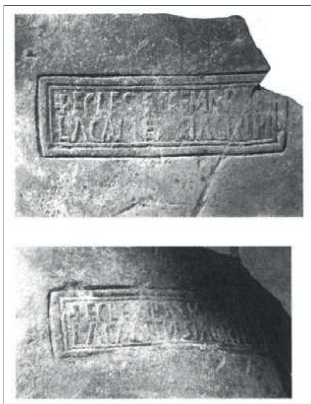
Figura 4. Inscrição em dolium de Monte da Salsa (Canto 1987, fig. 111).

abside semicircular” (Viana 1955, 4-5). Esta inscrição apresenta um excepcional paralelo no actual aglomerado urbano de Moura: ECLESIAE SANCTE MARIE LACALTENSI AGRIFI (Canto 1997, fig. 111 e 112) (fig. 4). Embora a pré-existência de Moura em época romana não esteja de todo clara, a área de dispersão dos vestígios na localidade parece configurar a existência de um aglomerado de grande importância. Sendo assim, e apesar da invocação Mariana levantar um conjunto de problemáticas in-