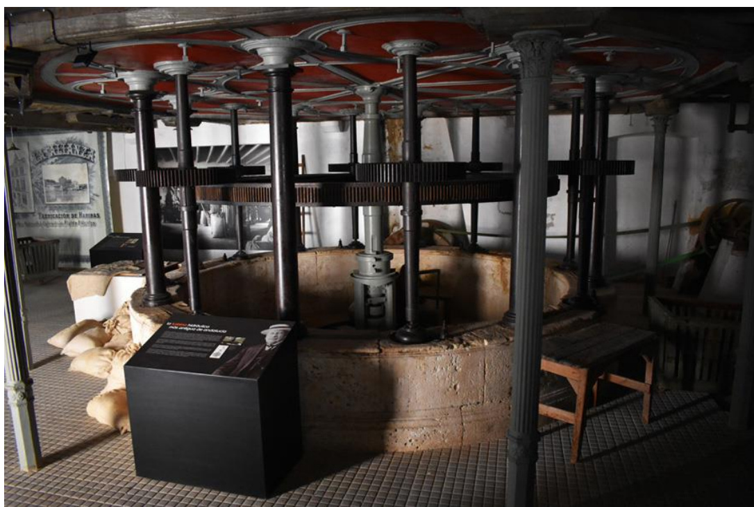
Figura 3. Turbina tipo Fontaine (1879). Antigua fábrica de harinas “San Cristobal”

2 de Mayo de 2019.