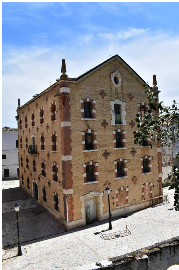
Figura 1. Antigua fábrica de harinas “San Cristobal”

Autora: Sheila Palomares Alarcón. 2 de Mayo de 2019.