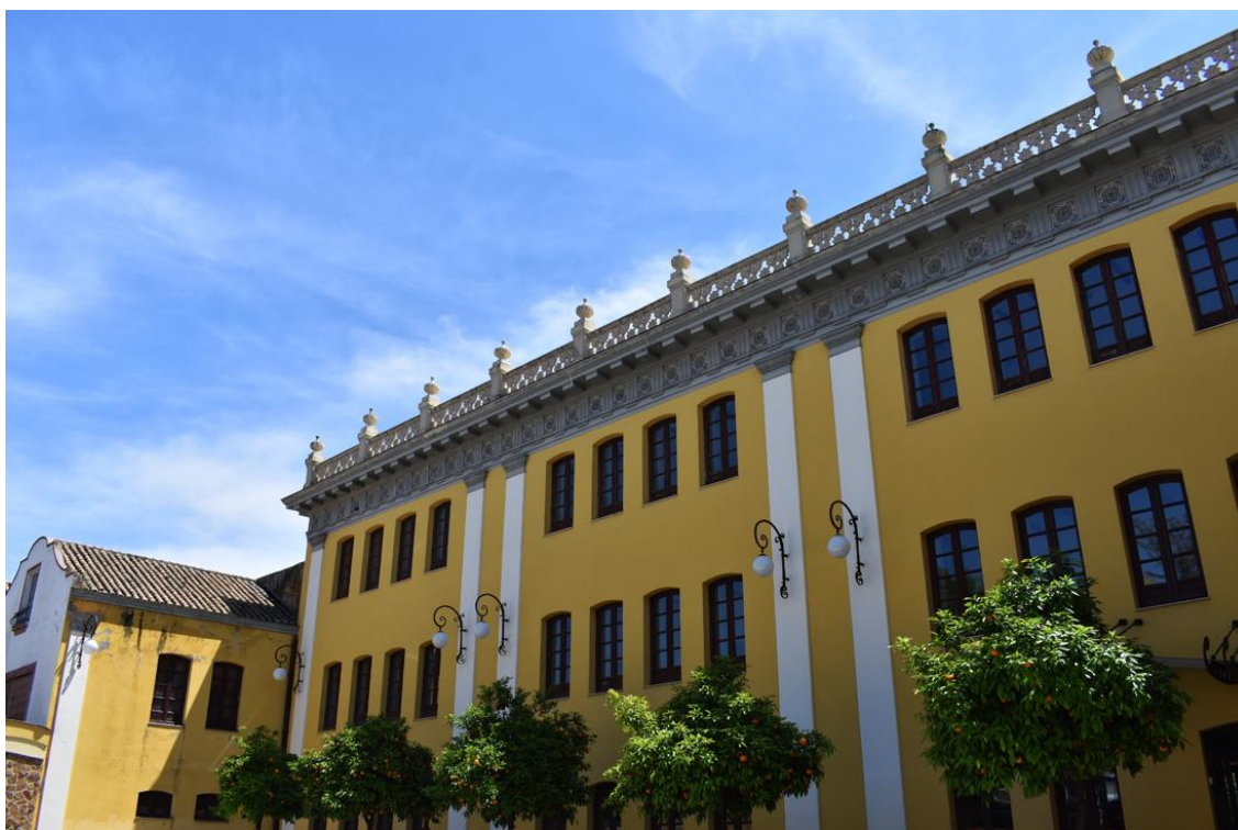
Figura 2. Antigua fábrica de harinas “Nuestra Señora del Carmen”

2 de Mayo de 2019.