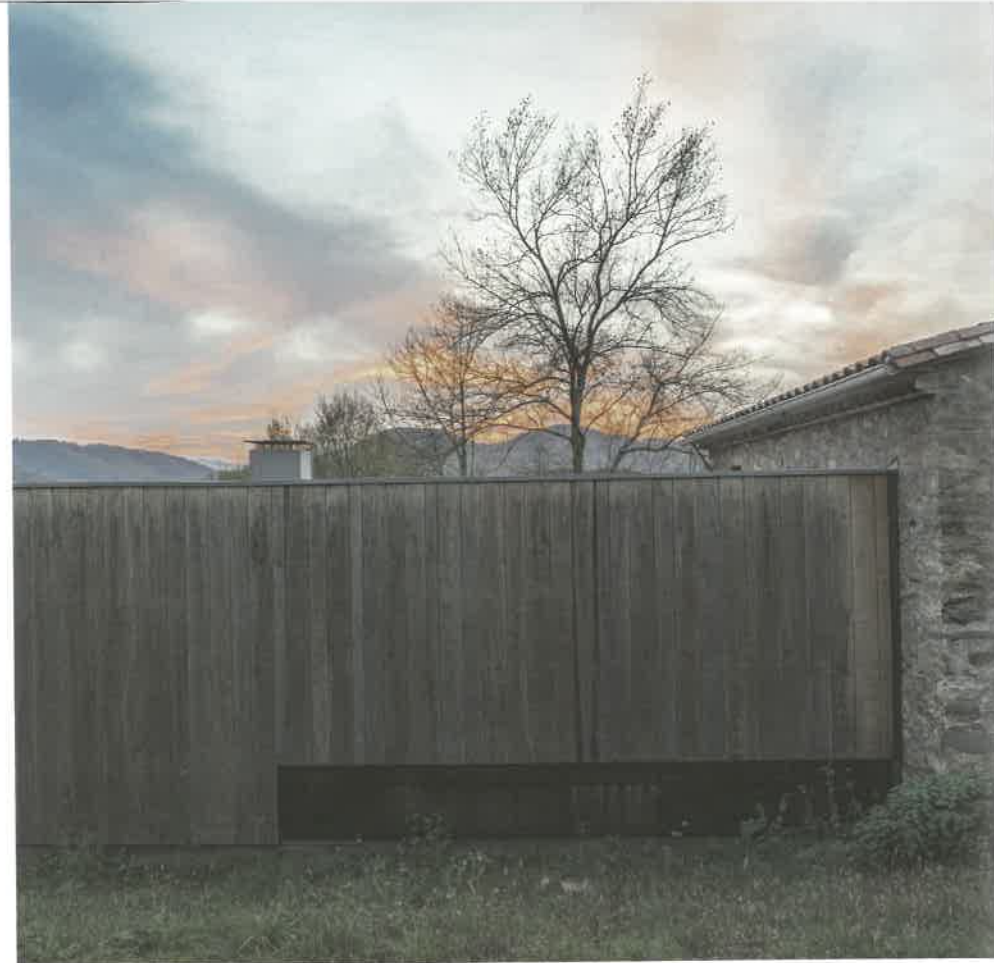
Pep Sau ©

The oldest secondary school in Portugal preserved its cultural and historical significance, as well as its educational and emotional value, through an intervention that updated the facility to ensure that it meets current educational needs.