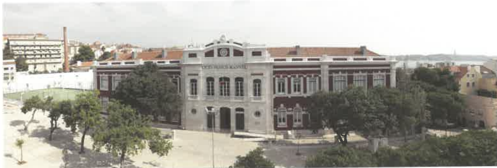
José Manuel ©