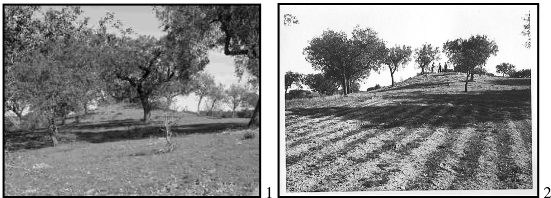
Fig. 4.2. Santa Cruz 2 (Mora). 1: Vista actual; 2: Foto de Manuel Heleno.

Muito à maneira da época, M. Heleno também escavou, sem qualquer elo de ligação aparente, monumentos e sítios de lhe pareciam interessantes e de que ia tendo conhecimento e autorização dos proprietários, de uma forma mais ou menos casuística.