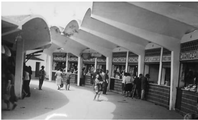
Mercado de abastos de Andújar. Interior. Detalle de voladizo 8 .

De esta manera, quedan los puestos interiores en un anillo intermedio con acceso tanto por el corredor al aire libre, como por el interior del espacio cubierto, además de un último anillo de puestos en isleta aislada alrededor de una fuente situada en el centro del espacio, que es el foco final desde los tres accesos. Se configuran estos puestos interiores en forma de habichuela en planta, muy común en la morfología de otros mercados de la época.