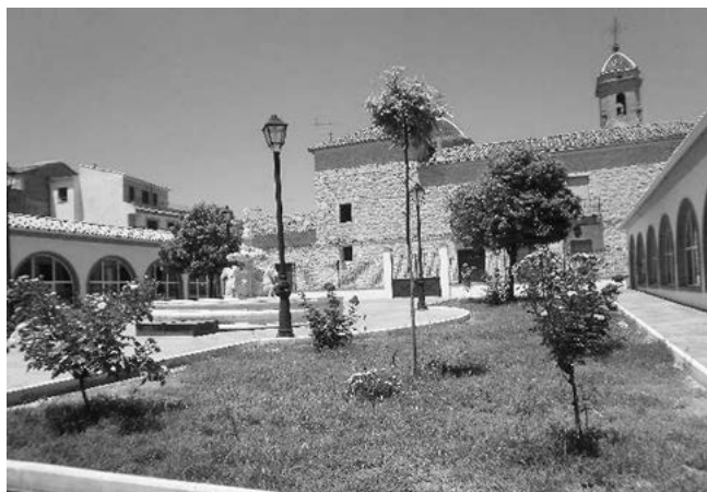
Mercado de abastos de Castellar 24 .