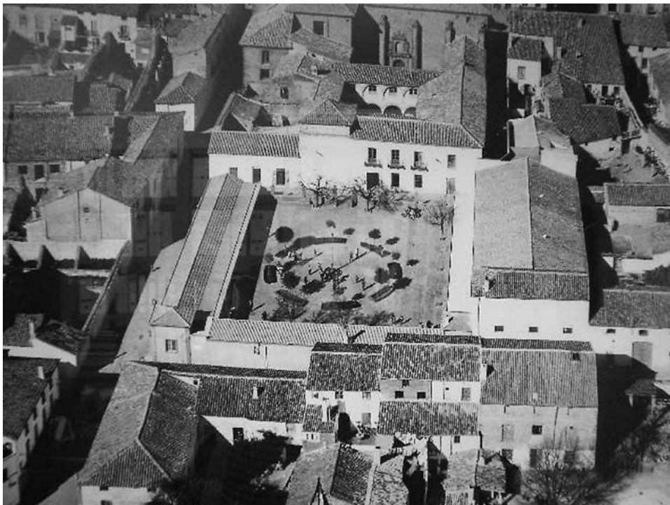
Mercado de abastos de Castellar. Vista aérea de mercado. Estado original 28 .

arquitectura moderna, y sin olvidar el valor añadido de los aspectos ornamentales historicistas y neo-populares. Aunque realiza reconstrucciones de todo tipo, hay que destacar la relación de mercados que ejecuta en los años 50, entre los que destaca el mercado de Castellar.