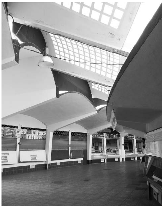
Mercado de abastos de Andújar. Interior. Estado actual 15 .

Durante el franquismo, las corrientes vanguardistas iniciadas en la época republicana fueron sustituidas, bien por una estética profundamente conservadora con toda clase de historicismos de corte triunfalista 16 muy en consonancia con la ideología política de la época, o bien por una regresión al regionalismo que se convirtió en el estilo más recurrente hasta finales de los años 50, fecha en la que se abre paso tímidamente la arquitectura que busca el retorno al Estilo Internacional. Es por tanto el mercado de abastos de Andújar una excepción estilística en este contexto.