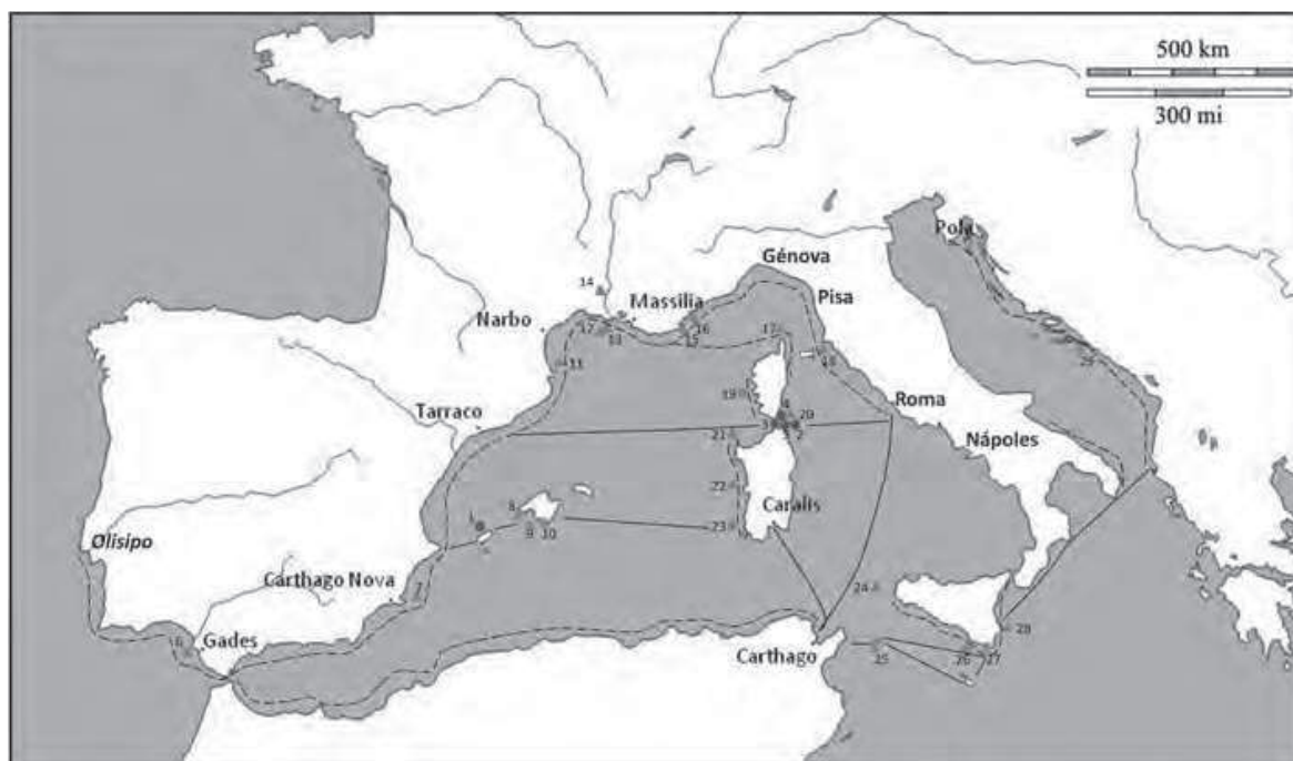
Figura 2 – Sítios de naufrágio referidos no texto e rotas de circulação das ânforas lusitanas no Mediterrâneo Ocidental. Alto Império: 1- San Antonio Abal/Grum de Sal; 2 - Punta Sardenha A; 3 - La Balise des Lavezzi; 4 - Lavezzi 1 e 5 - Lavezzi 3. Antiguidade Tardia: 6 - Sancti Petri; 7 - Escolletes 1; 8 - Cap Blanc; 9 - Cabrera I; 10 - Cabrera III; 11 - Port-Vendres 1; 12 - Planier 7; 13 - Catalans; 14 - Arles-Rhône 7; 15 - Pampelonne; 16 - Chrétienne D; 17 - Punta Vecchia 1; 18 - Punta Ala A; 19 - Porticcio A; 20 - Sud-Lavezzi 1; 21 - Cala Reale A; 22 - Mandriola A; 23 - Fontanamare A/Gonnesa; 24 - Levanzo 1; 25 - Scauri (Ilha de Pantelleria); 26 - Femina Morta; 27 - Randello; 28 - Marzameni F; 29 - Sobra.

Os naufrágios de Punta Vecchia 1 e Fontanamare A/Gonnesa Sito A evidenciam a existência de cargas aparentemente maioritárias de ânforas lusitanas do tipo Almagro 51c, acompanhadas por contentores norte-africanos ( Africana II), também eles associados ao transporte de preparados de peixe, e terra sigillata clara de produção tunisina (Leroy de La Brière 2006: 87; Leroy de La Brière e Meysen 2007: 88-89; Salvi e Sanna 2000; Dell’Amico, Faccena e Pallarés 2001-2002).