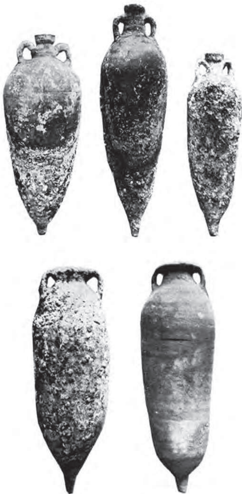
Figura 4 – Ânforas lusitanas do naufrágio de Sud-Lavezzi I (Liou 1982).