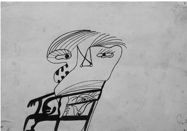
Desenho de António Paulo Tomaz, 1949