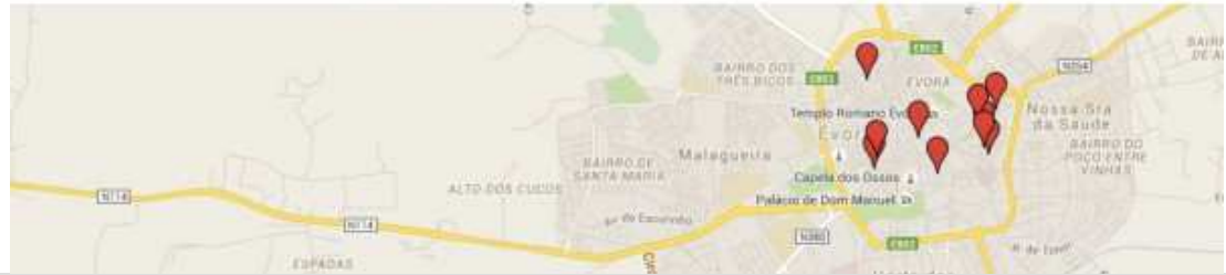
Figura 2 – Convite para a sessão pública de apresentação de resultados no âmbito do Projecto “(Por) Portas e Travessas. Quotidianos do Envelhecimento no Centro Histórico de Évora”.

Entrada Livre mas solicita-se inscrição prévia até 16 de Junho.