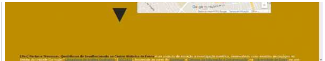
Figura 4 – Página web do Projecto “(Por) Portas e Travessas. Quotidianos do Envelhecimento no Centro Histórico de Évora”.

Por um lado, a existência de uma página na internet foi decisiva para referência e consulta por parte de qualquer pessoa interessada em conhecer o projecto e o seu contexto institucional, especialmente na fase de recrutamento de entrevistados e observação directa na rua. Por outro lado, a existência desta página envolveu os estudantes mais activamente no projecto, em grande medida como resultado da criação de um mapa interactivo, construído com o auxílio da ferramenta Google Map Maker , no qual todas as ruas (e travessas) foram assinaladas e referenciadas com dados dos estudantes envolvidos. Entre estes dados, e para além da designação do grupo e nome, os estudantes foram incentivados a criar (a rever em alguns casos), um perfil no LinkedIn . Deste modo, sempre que um visitante clica no mapa interactivo pode aceder sob a forma de hiperligação a uma pequena biografia do estudante e, eventualmente, dados de contacto.