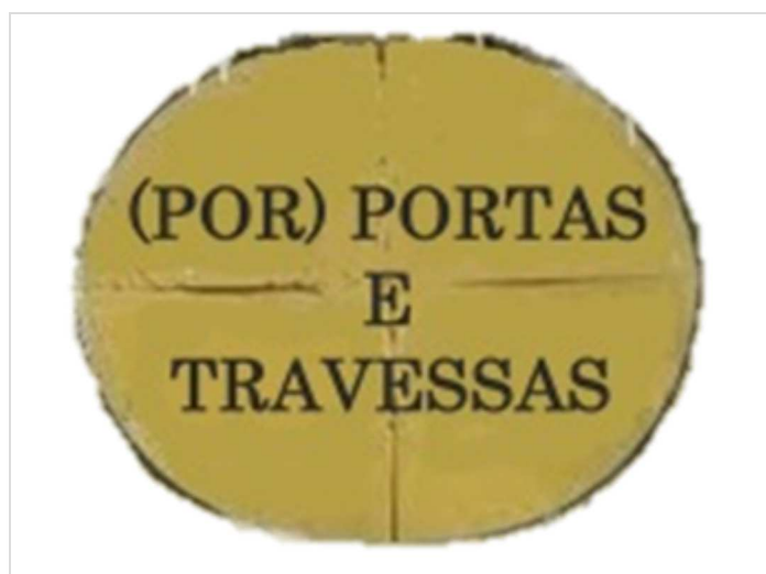
Figura 1 – Imagem do Projecto “(Por) Portas e Travessas. Quotidianos do Envelhecimento no Centro Histórico de Évora”.

Évora é uma cidade de média dimensão situada no sul de Portugal (Europa), cujo centro histórico é classificado Património Mundial da UNESCO desde 1986. Este foi o locus de investigação, já que Évora tem a peculiaridade de acomodar, dentro de seu pequeno centro histórico, rodeado por uma muralha medieval, a segunda mais antiga universidade de Portugal, precisamente a instituição de ensino superior a partir da qual se desenrolou a presente experiência de aprendizagem. Numa adaptação das tradicionais placas toponímicas em azulejaria da cidade, esta foi a imagem concebida especificamente para o projecto: