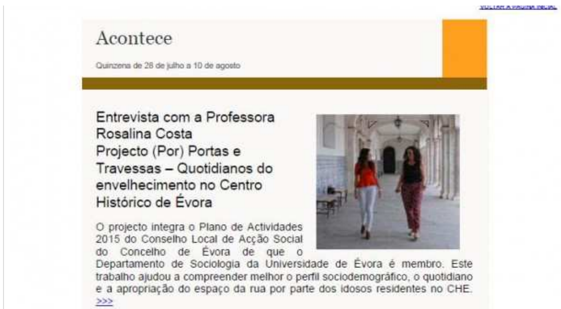
Figura 3 – Destaque na Newsletter “Évora Local” (28 de Julho a 10 de Agosto de 2015) sobre o Projecto “(Por) Portas e Travessas. Quotidianos do Envelhecimento no Centro Histórico de Évora”.