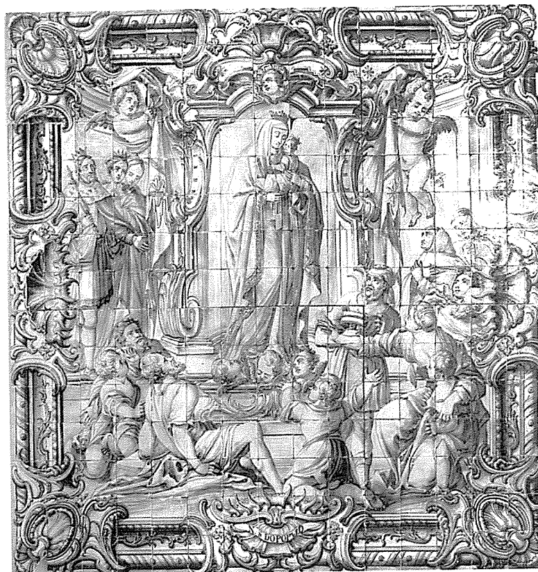
Caldas da Rainha, Hospital Termal, pormenor do painel de azulejo de N.ª Sr.ª do Pópulo

Apesar de se saber quão distante pode ser a realidade vivida daquela que a legislação pretendia criar, não deixa de ser sintomático o facto de os mendigos e vagabundos terem uma representação mínima nas instituições assistenciais do Portugal Moderno. As listas de pobres e dos presos subvencionados pelas Misericórdias só muito raramente os incluem e mesmo os hospitais, as mais abertas e menos selectivas instituições de caridade e assistência que nesse tempo existiram em Portugal, quase nunca os referem. Como é óbvio, a questão deve ser problematizada porquanto são conhecidos os usos sociais do sistema. Quer isto dizer, no caso em apreço, que é provável que mendigos e vagabundos tenham beneficiado dos recursos dos hospitais, que à partida lhes estavam vedados, fazendo-se registar como trabalhadores. Mas que a legislação teve alguns resultados práticos, é absolutamente inquestionável.