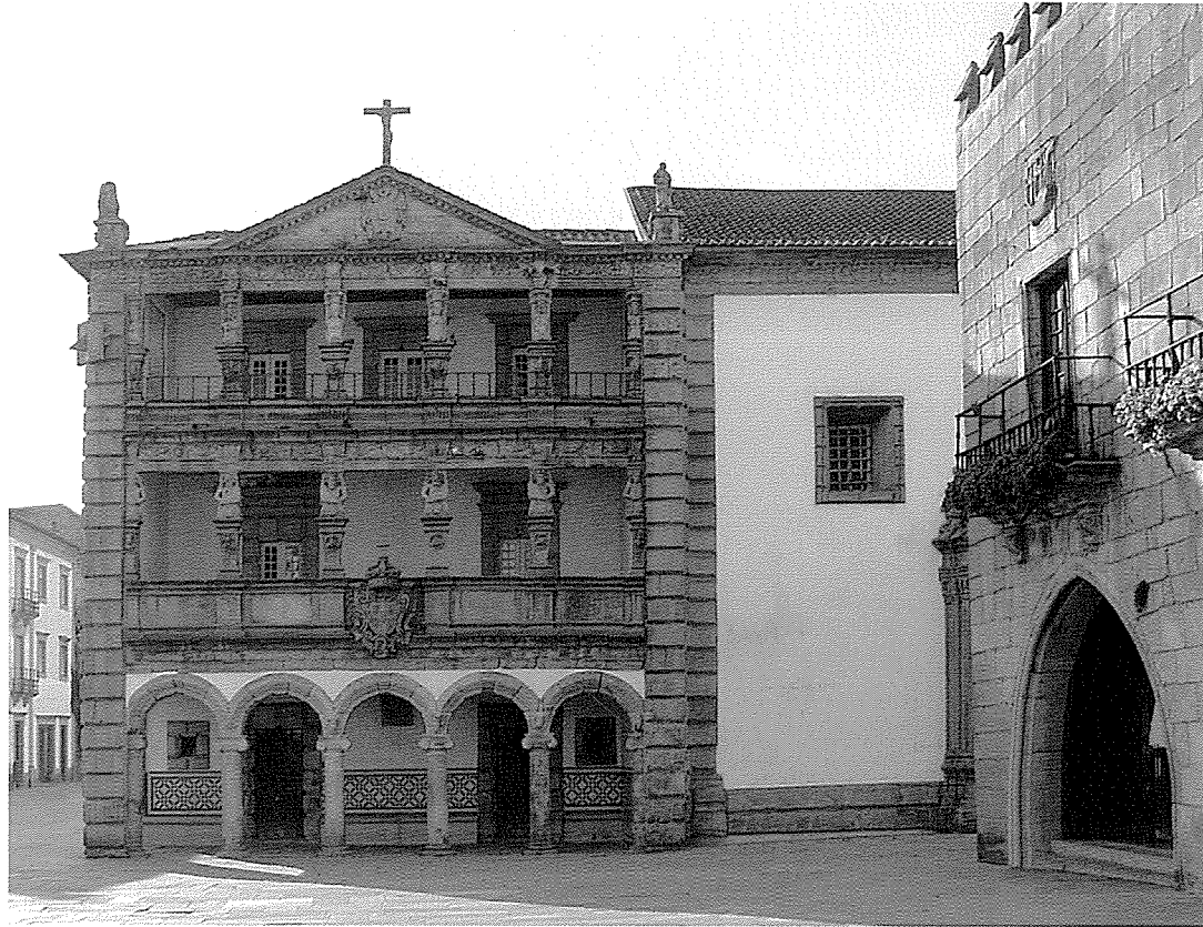
Viana do Castelo, Igreja e Hospital da Santa Casa da Misericórdia

liberdades excessivas que poderiam fazer perigar a boa administração da instituição e, finalmente, a imposição de apresentação anual de contas à Coroa (1551) 21 .