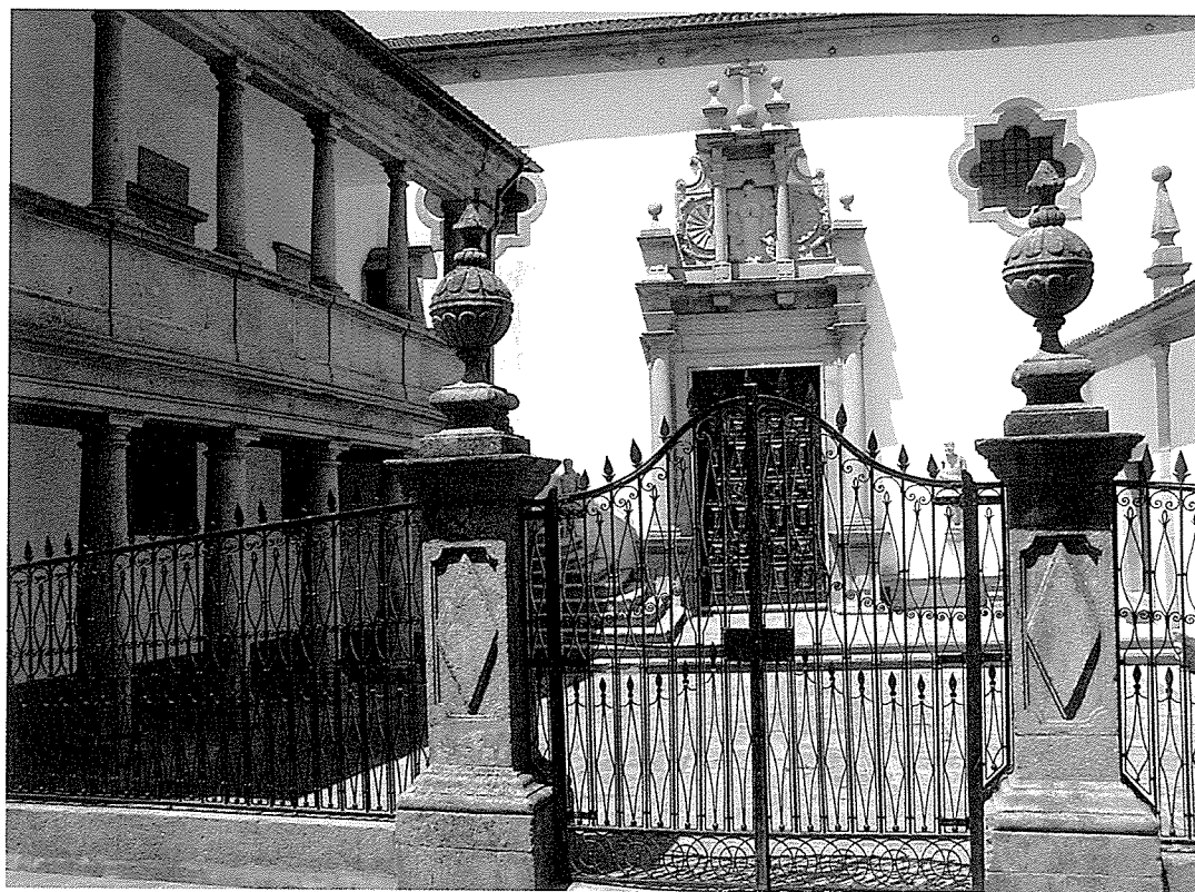
Ponte de Lima, Igreja e Hospital da Santa Casa da Misericórdia

A actividade legislativa daqui resultante é sobretudo filipina. Recordem-se três dos seus principais momentos: a lei de 1593, o diploma de 6 de Dezembro de 1603 e a provisão de 13 de Janeiro de 1615. O primeiro incumbe os provedores de Comarca de fiscalizar as Misericórdias impondo à lei efeitos retroactivos aos dez anos anteriores; o segundo procura travar, penalizando, os comportamentos lesivos dos responsáveis pelo património das Misericórdias e dos concelhos 23 , e finalmente o de 1615, que determina a realização de uma devassa à contabilidade das Santas Casas, com o objectivo de saberem se as que administravam hospitais «cumprem, em tudo as instituições e legados, a que rendas delles estejam applicadas, e se há d'isso algum escandalo» 24 . O novo Compromisso da Misericórdia de Lisboa, de 1618, deve, de resto, encarar-se como uma etapa, provavelmente a mais importante, deste processo. Este Compromisso, a par do novo regulamento do Hospital de Todos os Santos, de 1632, fecharia um ciclo de reformas administrativas que depois se tentaram implementar a nível nacional, apesar das muitas resistências e conflitos 25 .