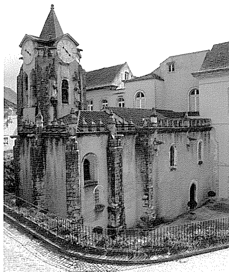
Caldas da Rainha, Igreja de N.ª Sr.ª do Pópulo