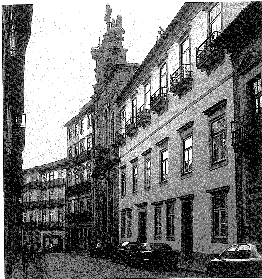
Porto, Igreja e Provedoria da Santa Casa da Misericórdia

É pois no diálogo com as leis contra a mendicância e vagabundagem e com o processo de reforma dos hospitais, ainda que em planos diferenciados, que melhor se compreende a criação das Misericórdias. Se outros indicadores não existissem que pudessem avaliar do sucesso imediato da implantação de uma ideia, bastavam os números: à morte de D. Manuel, em Dezembro de 1521, existiriam mais de setenta Misericórdias, espalhadas pela metrópole e pelos territórios ultramarinos; no final da dinastia de Avis seriam pelo menos cerca de duas centenas. Mais de trezentas em 1640. O que contribuiu para semelhante êxito? Indiscutivelmente, o apoio régio, a forma como foi organizado e concretizado e a capacidade de articulação entre as diferentes partes de um todo, ainda que isso tivesse implicado algumas reestruturações face às linhas de orientação inicialmente traçadas. Que significa semelhante afirmação? Que de facto se deve a D. Manuel I a arquitectura de um edifício que se caracterizaria pela longevidade e eficácia, se não a nível social, pelo menos na perspectiva do poder político.