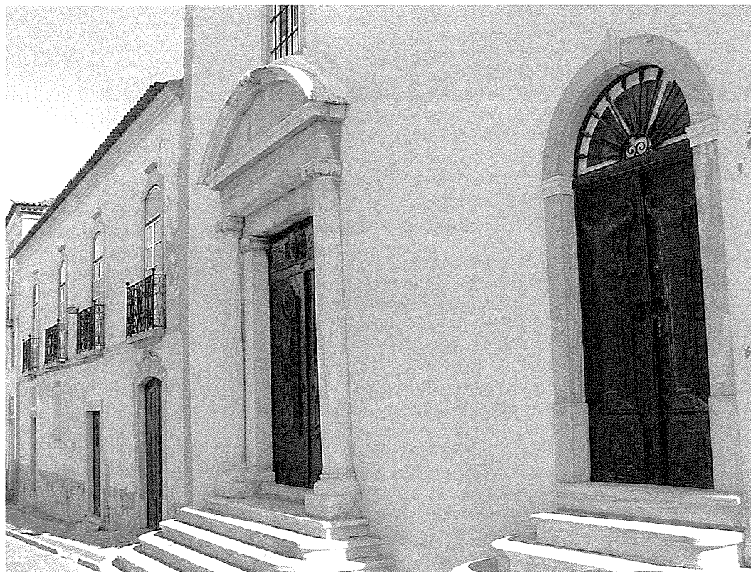
Portel, Igreja e Hospital da Santa Casa da Misericórdia

testadores”. A progressiva transferência dos hospitais para a tutela das Misericórdias, que se inicia por volta de 1559 mas que só se torna verdadeiramente efectiva depois de 1564, e com eles «todallas as (suas) rendas, foros, bens», teria um efeito multiplicador não só porque funcionava como incentivo a outras doações, como respondia à mudança solicitada pelos teóricos socais e autoridades políticas no sentido de direccionar a caridade dos fiéis para as instituições assistenciais em detrimento das esmolas avulsas e sem destino certo 15 .