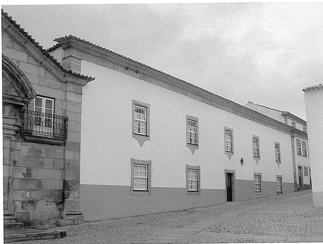
Almeida, Igreja e Hospital da Santa Casa da Misericórdia

Não podiam ser mais explícitos, pois, os termos da missiva que desaconselhava a anuência da Coroa às pretensões de Penafiel. Como também o são as razões que se decifram na decisão do monarca: “hey por