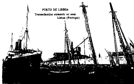
PORTO DE LISBOA Transtancios atracado ao cais Lisboa (Portugal)