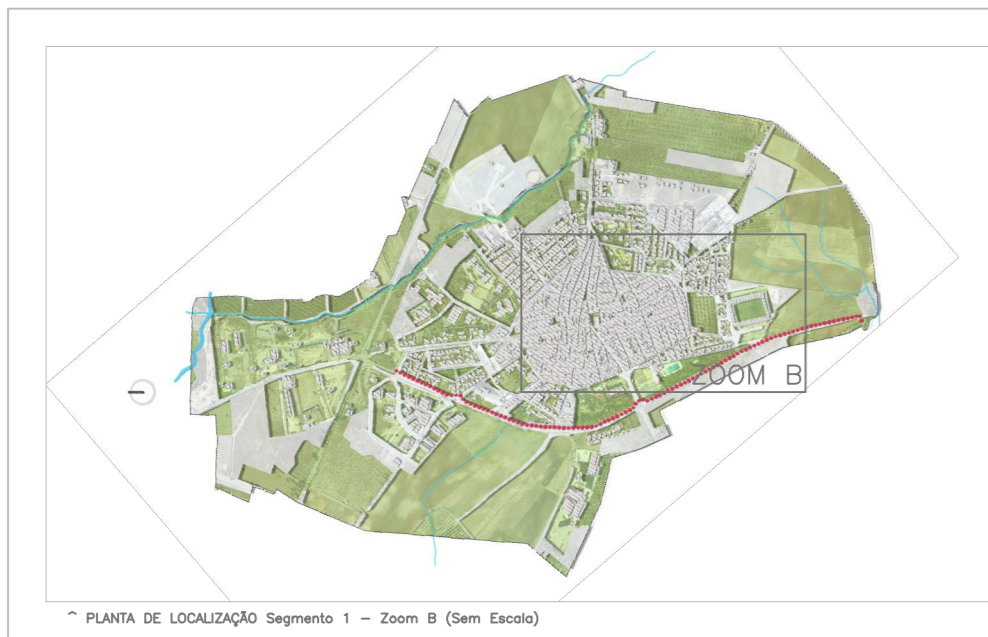
Planta de Localização Segmento 1 - Zona B (Sem Escala)