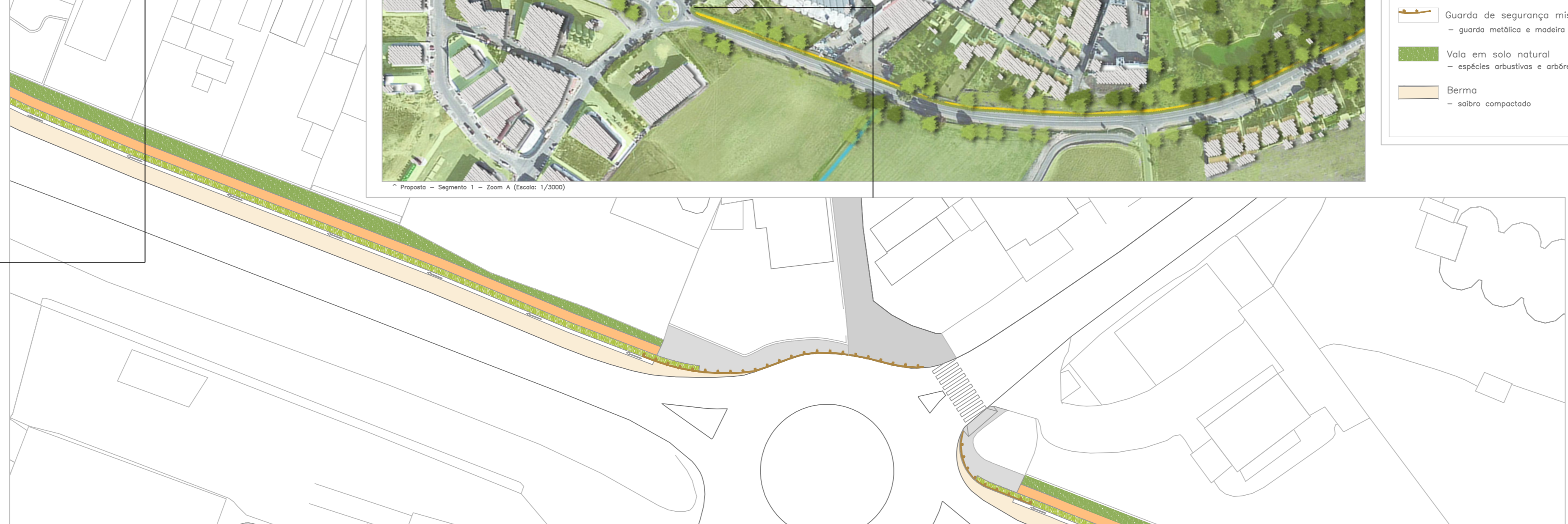
Segmento 1 - zona de ligação com o eixo envolvente à Igreja de N. S.ª de Conceição (Escala: 1/2000)