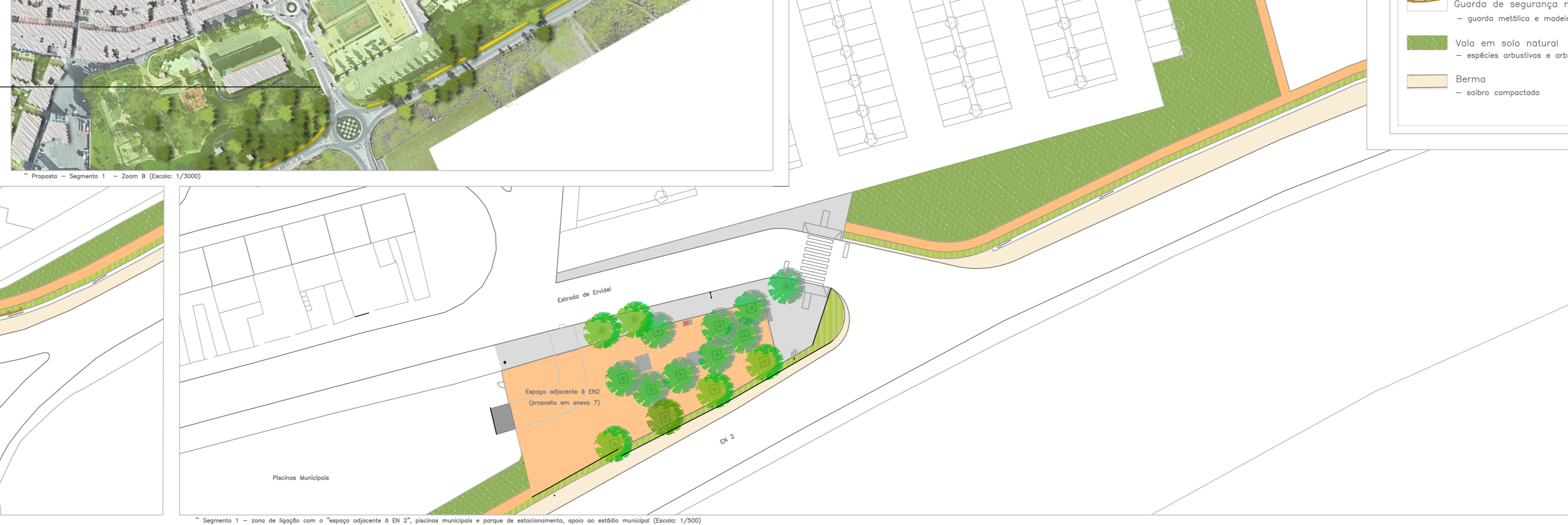
Segmento 1 - zona de ligação com o "passadiço" adjacente à DK 27, próximo municipal e parque de estacionamento, junto ao estádio municipal (Escala: 1/2000)