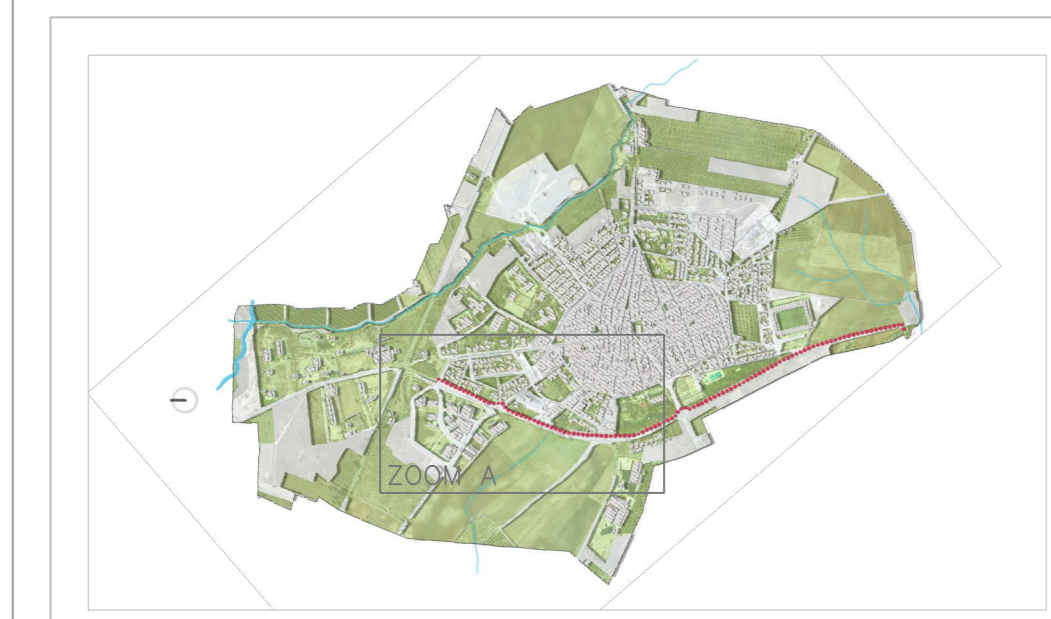
Planta de Localização Segmento 1 - Zona A (Sem Escala)