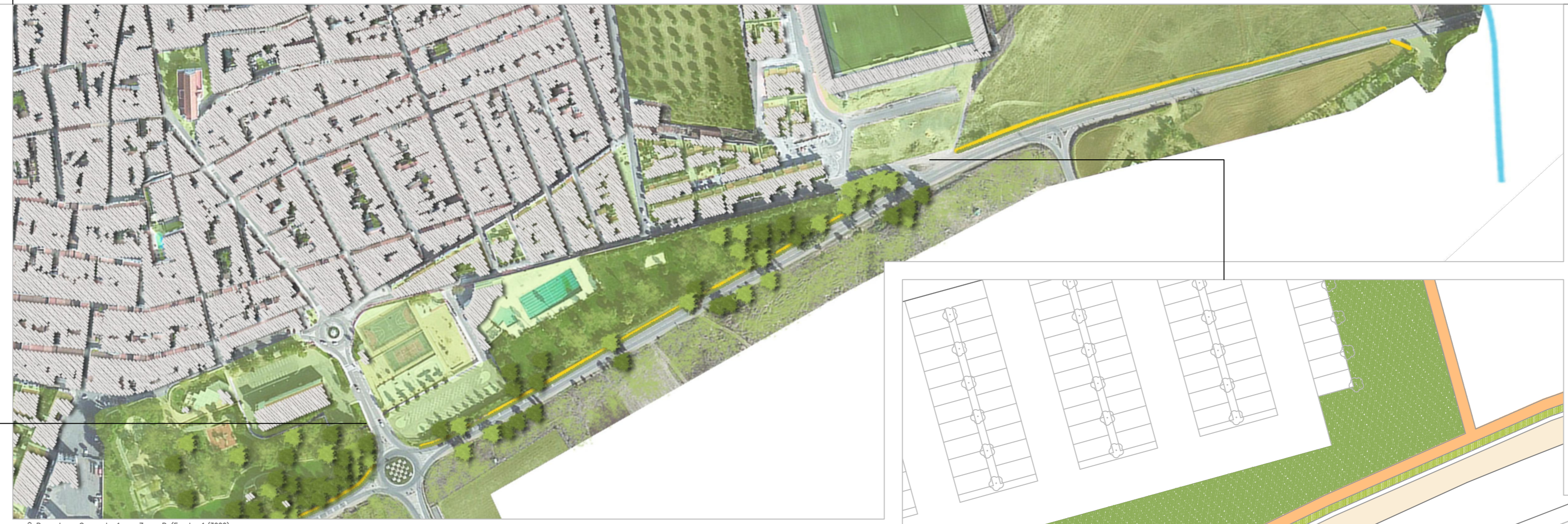
Proposta - Segmento 1 - Zona B (Escala: 1/2000)