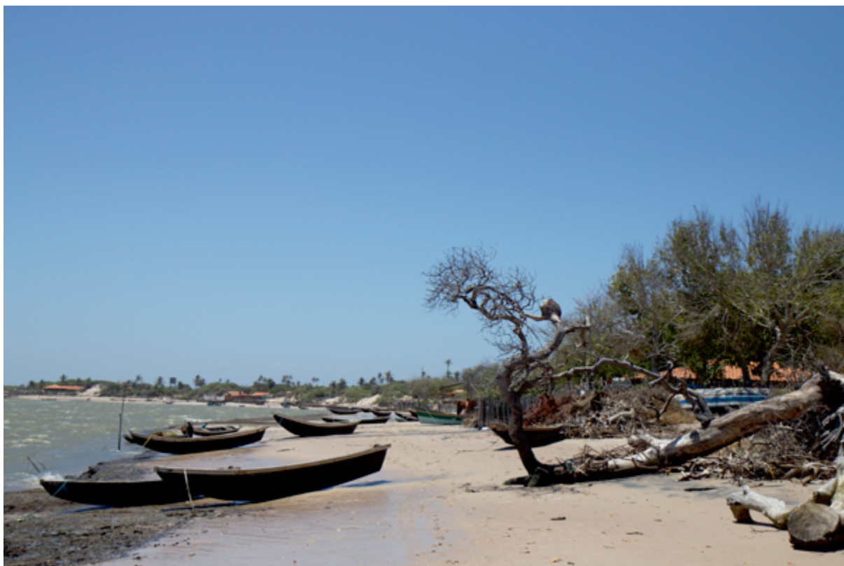
Fig. 4.1 – Vista panorâmica, Ilha das Canárias, 2015.

É preciso informar e formar, permitir que se traduza a realidade, que se reflita sobre o conhecer, percebendo erros e equívocos, ilusões na reconstrução das dinâmicas das relações humanas, das lógicas sociais; entender que o conhecimento é uma tradução e não o reflexo da realidade, que nos permite a reconstrução, a percepção de se reconstruir traduções, de se construir discursos sobre a realidade, tensa e conflituosa. O conhecimento do qual falamos deve ser pertinente de forma a que nos auxilie a compreender não apenas uma parte, mas o todo, perceber a riqueza e a complexidade das conexões no seu contexto.