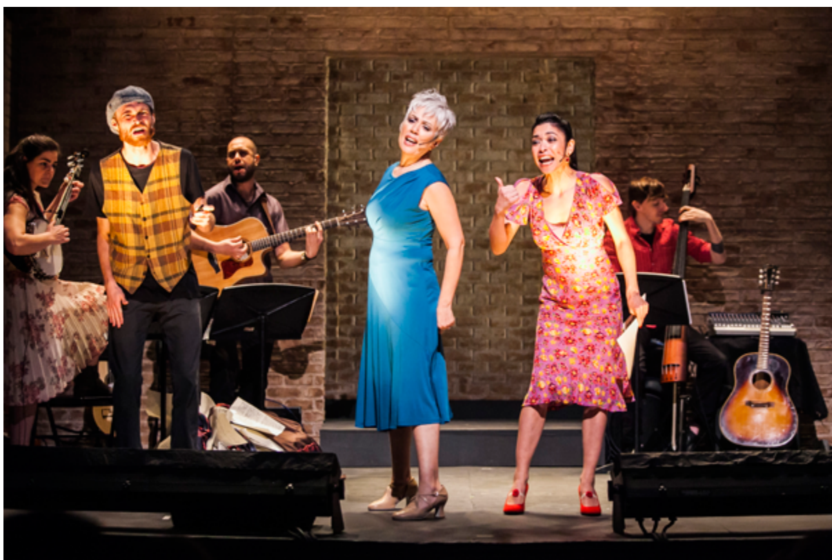
Fig. 14.1 – BETSY! , the Appalachian-Puerto Rican musical. Uma criação do Roadside Theater e do Pregones Theater que estreou em Abril de 2015.

A reflexão à volta dos projectos participativos desenvolvidos em instituições culturais intensificou-se nos últimos anos. No entanto, não se trata de uma reflexão ou prática recente e, por isso, não deve ser encarada ou