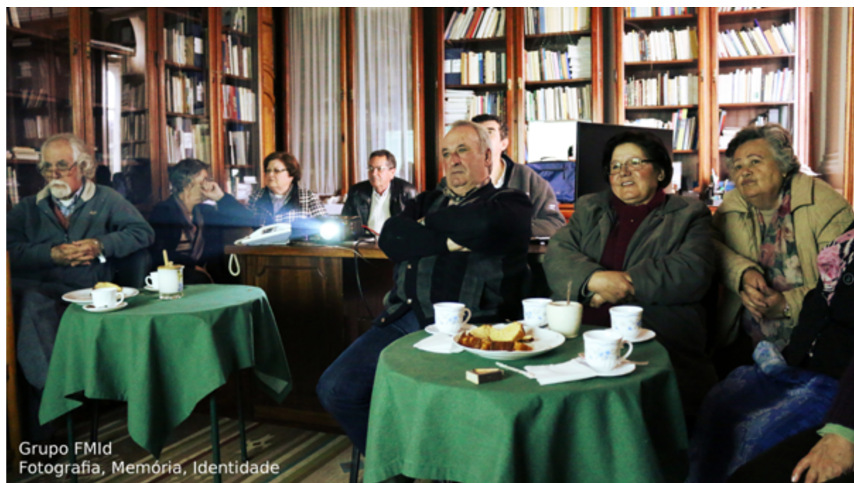
Fig. 10.2 – Grupo Fotografia, Memória e Identidade (FMId)