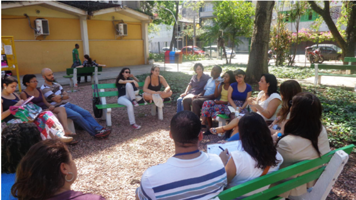
Fig. 5.2 – Roda de conversa no pátio da universidade.

De igual forma, os curadores-pesquisadores foram às instituições mapeadas na pesquisa preliminar e integraram-se nas suas programações como método de compreensão das suas vivências, representações, lutas, lugares na memória da cidade e na identificação de lacunas a preencher. Ressalte-se que a agenda de actividades destas instituições fez com que o grupo precisasse de estar em muitos lugares, tendo para isso de dividir-se entre tantos compromissos, relatando no Facebook estes acontecimentos. Esta rede social tornou-se um importante canal para reunir informação quase em tempo real, embora nem todos os membros do grupo a usassem com a agilidade que era necessário devido a uma série de factores, entre os quais a própria condição de acesso à internet, desigual entre os mesmos.