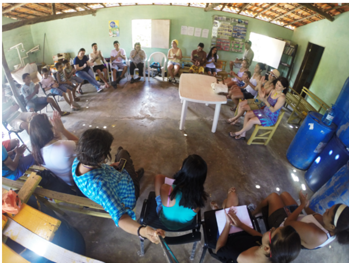
Fig. 4.3 – Roda de conversa, Ilha das Canárias, 2014.

Estamos a criar um espaço para conversas, cantorias, brincadeiras, histórias, lendas e mitos; um espaço onde a imaginação e a criatividade façam fluir aptidões e memórias escondidas, onde as pessoas se deixem envolver e transformar, se encantem e se encontrem com a arte-educação-formação; que contem e escutem as histórias e as lembranças daqueles que são os pescadores-as/artesãos-ãs, guardiões de um rico e complexo património legado pelos seus antepassados, populações indígenas que habitaram o delta, lugar marcado pela biodiversidade – fauna e flora, que desperta e revela uma sonoridade, uma visualidade, uma vontade de conhecer, desvendar, cuidar, preservar, salvaguardar para as gerações presentes e futuras.