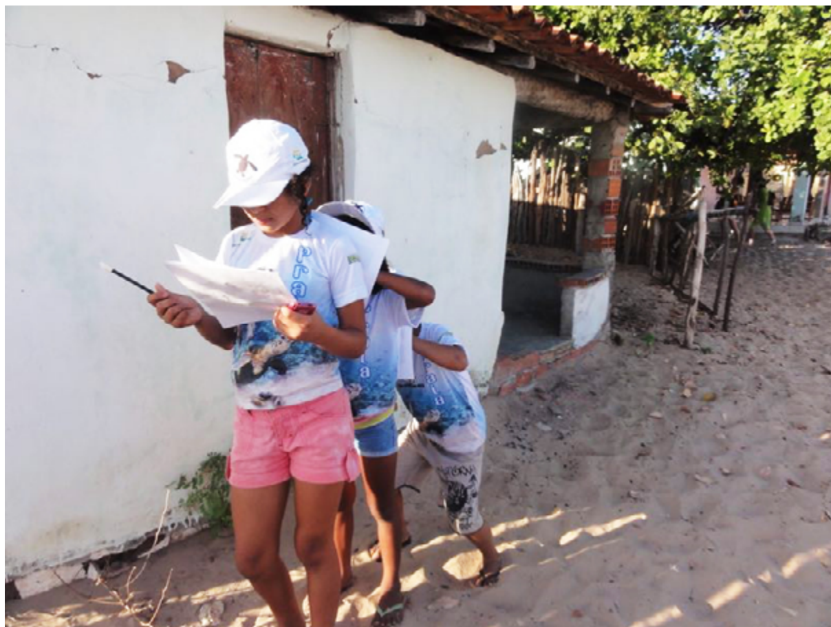
Fig. 4.2 – Oficina de educação para os patrimónios, Ilha das Canárias (delta do Parnaíba), 2012.

As rodas e as oficinas despertam memórias ancestrais, repletas de vivências e de experiências; são um convite à criação, a partir de um olhar atento e sensível sobre o ambiente e sobre os patrimónios, sobre as artes da pesca e os seus artefactos; despertam nas pessoas o desejo de imersão no mundo interior quotidiano da ilha, do rio e do delta, e que lhes permitem conhecer e reconhecer no território onde vivem, de beleza singular, mas também com problemas ambientais e de desenvolvimento económico e social; um lugar carente de equipamentos culturais, de lazer e de educação para o património.