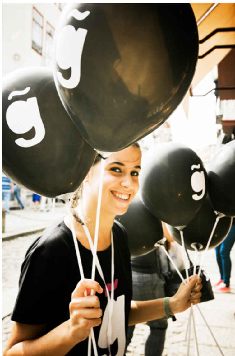
Fig. 12.2 – Guimarães noc noc © Marisa Cardoso