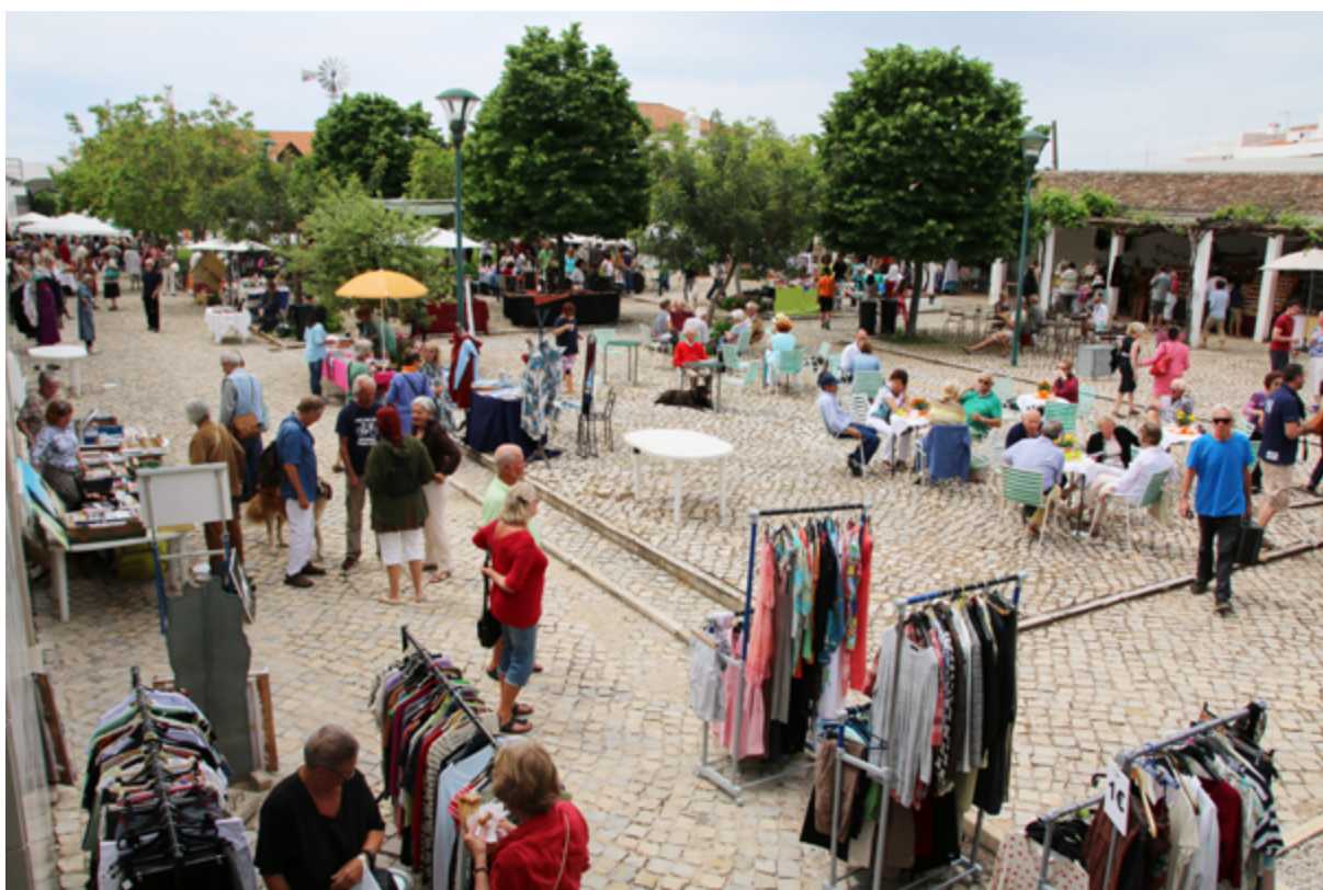
Fig. 10.1 – Feira de Primavera no museu