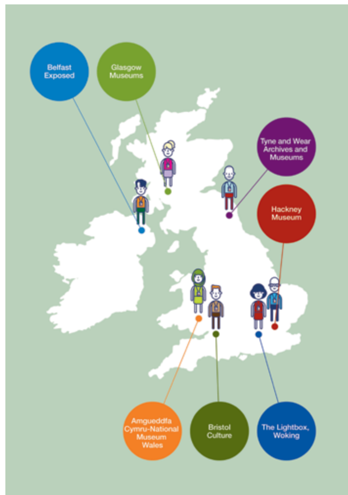
Fig. 15.2 – Mapa de museus do projecto Our Museum

Piotr Bienkowski – Nós estávamos muito interessados em apoiar uma participação profunda que desenvolvesse parcerias genuínas, a partilha da autoridade e do processo de decisão em todos os aspectos do trabalho em museus, não apenas em exposições e eventos. No essencial, trata-se de atribuir às comunidades um agenciamento efectivo no trabalho de um museu ou galeria, participando e colaborando regularmente no diálogo e no processo de decisão.