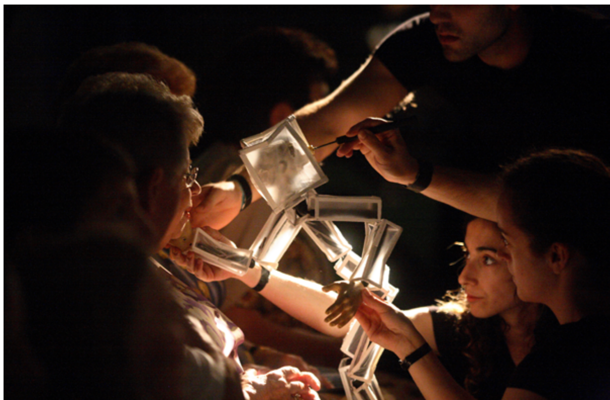
Fig. 11.1 – Estufa Fria , de Regina Guimarães, enc. Igor Gandra, Teatro de Ferro e Comédias do Minho, 2008

Falar do processo participativo num projecto como o das Comédias do Minho remete-nos para a contextualização do seu surgimento. As Comédias do Minho, Associação para a Promoção de Actividades Culturais no Vale do Minho, nasceram em 2003. Fruto do investimento e da colaboração dos cinco municípios do Vale do Minho (Melgaço, Monção, Paredes de Coura, Valença, Vila Nova de Cerveira) e da Caixa de Crédito Agrícola como membros associados de uma nova rede cultural.