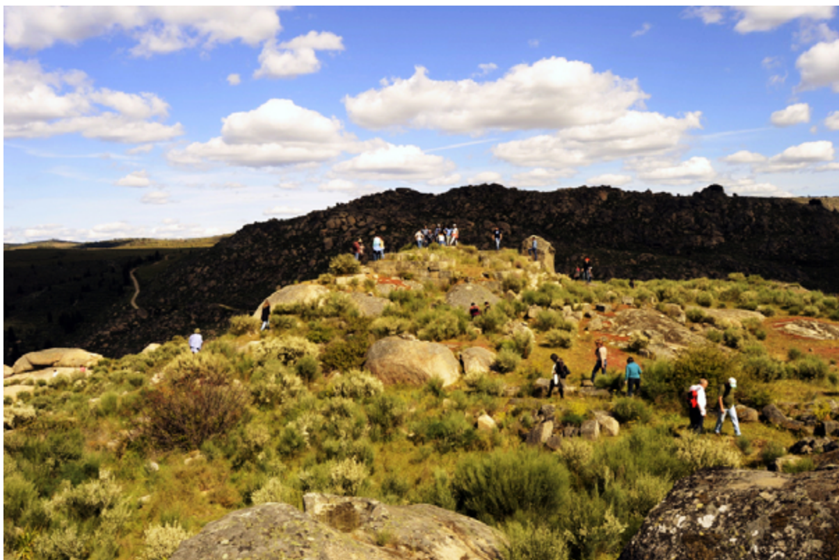
Fig. 13.1 – Visita ao Castelo de Monforte de Ribacôa com membros da comunidade. Visita organizada pela associação Ribacvdana, 19 de Abril de 2015