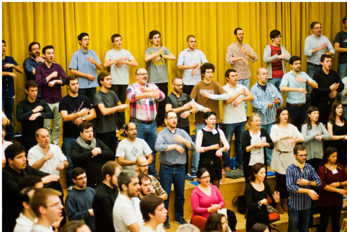
Fig. 8.2 – Concertos Participativos, 14 e 15 de Novembro de 2015.