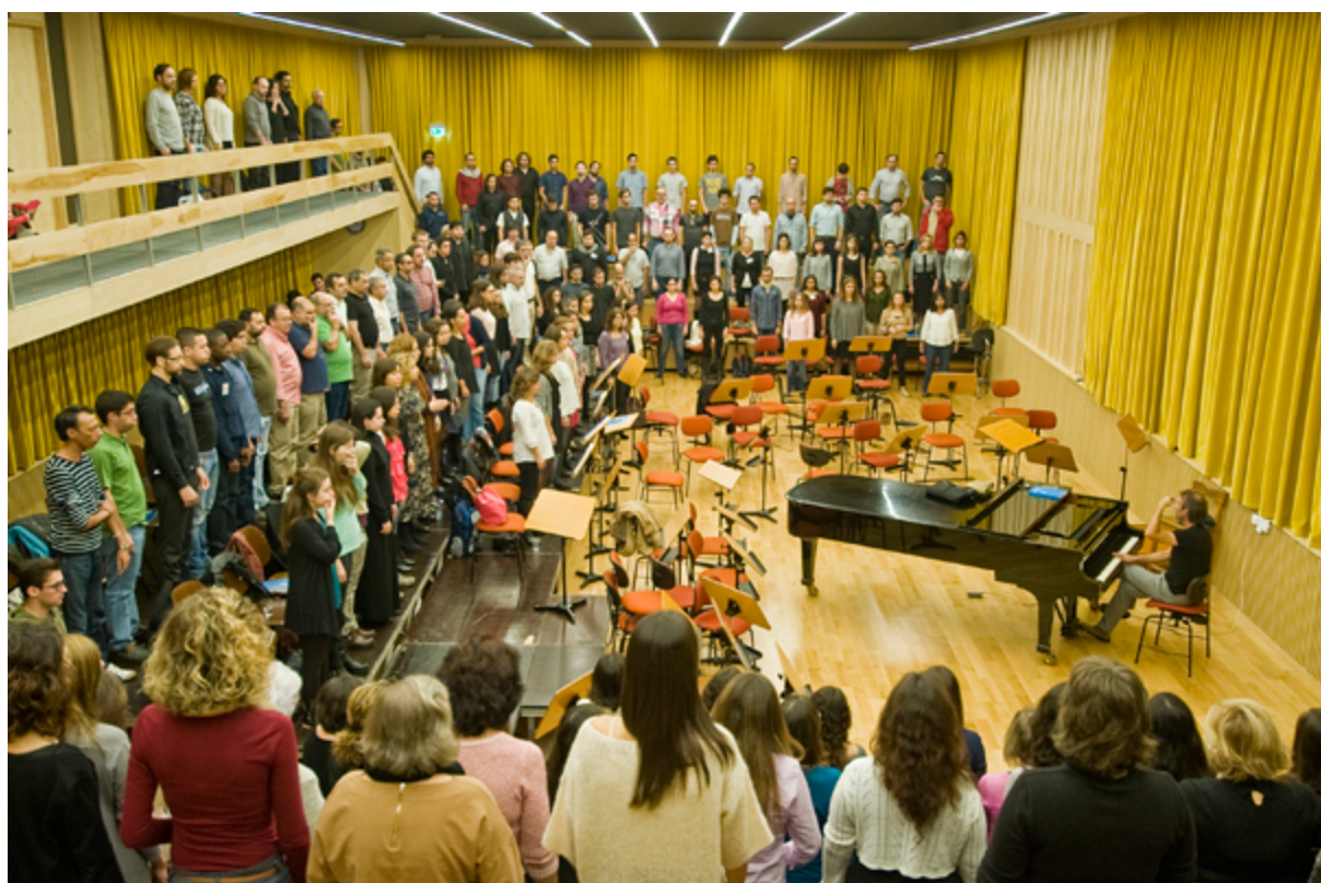
Fig. 8.1 – Concertos Participativos, 14 e 15 de Novembro de 2015.

A ideia que está na origem dos “Concertos Participativos”, projecto da Fundação Calouste Gulbenkian, que teve a sua primeira edição em 2014, diverge em parte da definição do termo “participativo” utilizado pelo projecto britânico Our Museum , particularmente no que diz respeito à “partilha de tomada de decisão e poder”. Sendo esta última a definição padrão sugerida na conferência Meu, Teu, Nosso: Modelos de Projectos Participativos (12 de Outubro de 2015), poder-se-ia questionar a apresentação deste projecto neste âmbito.