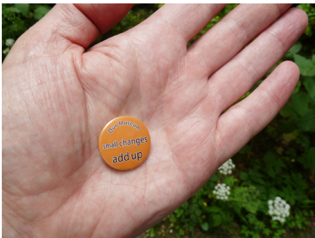
Fig. 15.1 – Slogan do projecto “ Our Museum ”: “As pequenas mudanças acrescentam”

O envolvimento de pessoas, grupos e comunidades no mundo dos museus constituiu a premissa fundamental para o desenvolvimento do projecto britânico “ Our Museum: Communities and Museums as Active Partners ” (2012–2016). “ Our Museum ” juntou oito museus de diferentes tipologias e geografias com um objectivo comum: iniciar um processo