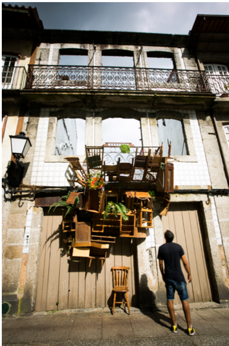
Fig. 12.1 – Guimarães noc noc

O projecto “Guimarães noc noc” é uma mostra informal de artistas portugueses e internacionais que decorre anualmente desde 2011 em Guimarães, no primeiro fim-de-semana de Outubro. É promovido pela associação cultural Ó da Casa!, organização sem fins lucrativos,