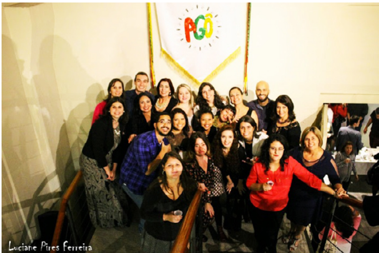
Fig. 5.1 – Inauguração da exposição.

Acreditava-se no potencial de cada um, na soma ali pactuada, na firme disposição de resolver os conflitos que estavam por vir – e não foram poucos, mas acima de tudo na perspectiva de forjar um modo de fazer acontecer a exposição Agô calcado na participação da comunidade negra – considerado o maior ganho que a exposição poderia ter.