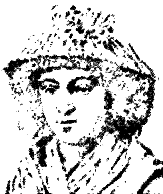
Marie-Olympe de Gouges, miniatura não localizada.

cerca de um metro e sessenta, medida média. Tinha o rosto redondo, cabelos castanhos, tal como as sobrancelhas, os olhos castanho escuros, um nariz ligeiramente aquilino, a fronte descoberta, o queixo redondo e a boca média. Esta descrição coincide bastante com os retratos que se conhecem dela, nomeadamente uma miniatura, um desenho que se encontra hoje no Louvre, (e que tive o gosto de ver) e um pastel pertencente a uma colecção particular.