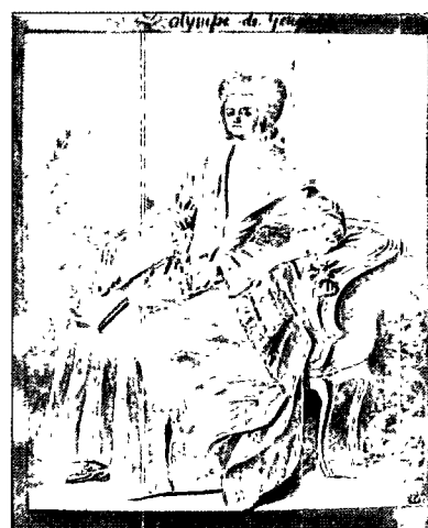
Marie-Olympe de Gouges, viúva Aubry, exposto no Museu do Louvre.

de Pompignam com quem ela se parecia imenso), a direcção do olhar à esquerda e até as sombras postas sob o botão esquerdo e sob o queixo da modelo. Este pastel, sobre pergaminho esticado sobre moldura, mede 45,5x37cm é de um fabrico que recorda o retratista polaco Alexandre Kucharski que trabalhou em Paris por volta de 1780 e que era apreciado pela sua capacidade de captar as semelhanças dos