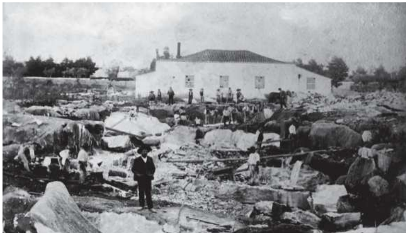
Figura 5 - Pedreira nova da cerca de S. António (vista sul), Estremoz, 1901 68

Quanto à transição desta paisagem agrária para a paisagem industrial, plena de pedreiras de mármore, localizadas em zona rural e rodeadas de campos agrícolas, a mesma ocorreu numa primeira fase de uma forma lenta, começando nos pequenos núcleos onde existia pedra com as qualidades mais apreciadas pelos exploradores, para logo receber um impulso a partir de meados do século com o aumento exponencial do número de explorações.