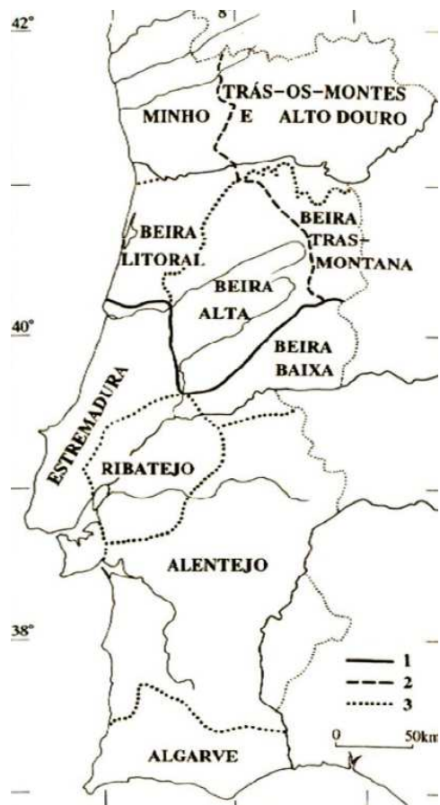
Figura 1 – As regiões geográficas 52

No domínio climático destacam-se a fraca pluviosidade, o ar seco e a oscilação entre verões muito quentes e invernos muito frios.