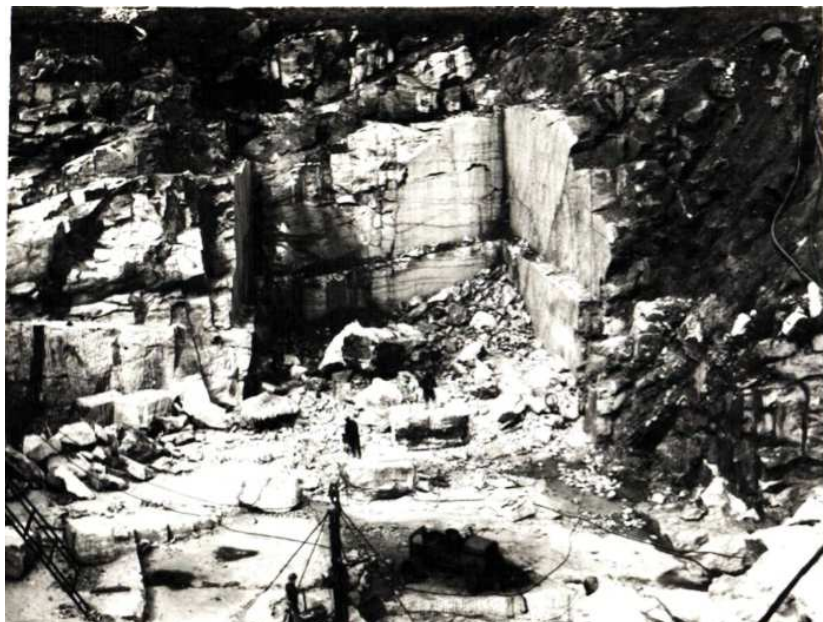
Figura 6 - Pedreira na zona de Estremoz – década de 1950 69

que acontece nestas pedreiras a partir da década de 1950, estarão aptas para incrementarem a produção e adquirirem novas máquinas, que permitirão o aprofundamento do poço da pedreira contribuindo para o surgimento de uma paisagem em cota negativa cada vez mais importante.