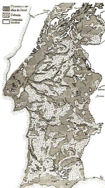
Figura 2 - Usos do solo em 1868 57

Simultaneamente, a maquinização das tarefas agrícolas começa também a tomar forma, com a difusão dos modernos instrumentos de trabalho, nos quais se incluem a ceifeira e a charrua a vapor, que trouxeram grandes progressos e permitiram uma significativa produtividade do solo.