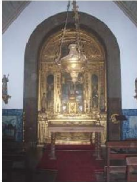
Fig.39 Ermida de Santa Teresa, Caldas de Monchique Retábulo principal FA