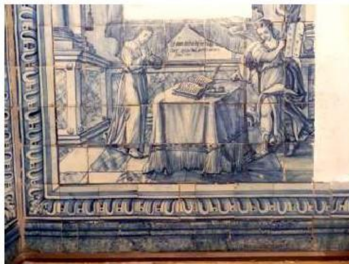
Fig. 428 Painel de azulejos do século XVII Sala do 1.º piso Convento de São José, Évora FA