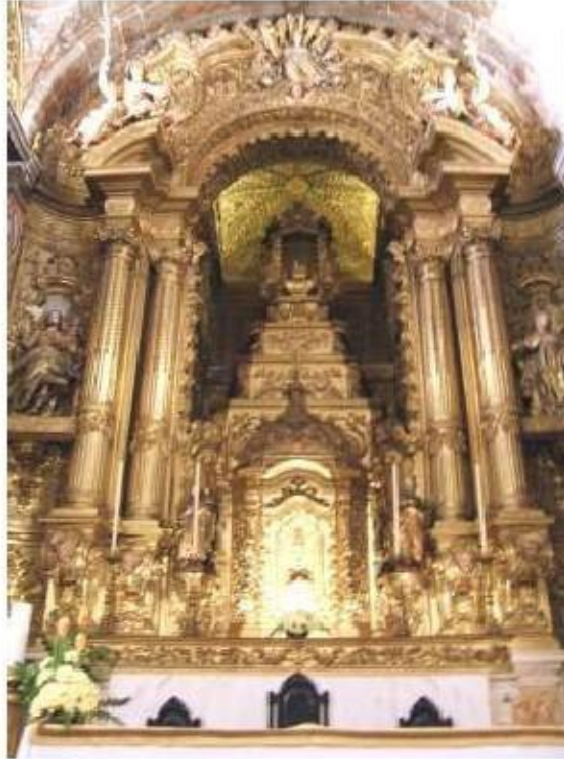
Fig.412 Retábulo da capela-mor Convento de São José, Évora FA