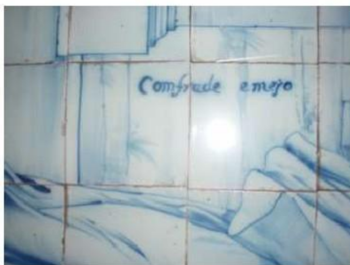
Fig.45 Ermida de Santa Teresa, Caldas de Monchique Parede lado do evangelho FA