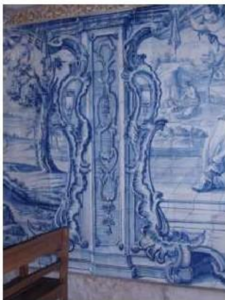
Fig. 267 Painel de azulejos do século XVIII, lado da epístola Convento de Santa Teresa de Jesus de Carnide, Lisboa FA