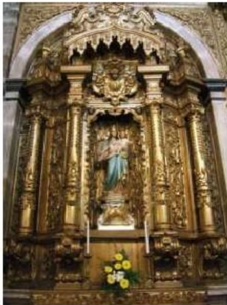
Fig.413 Retábulo, lado da epístola Convento de São José, Évora FA