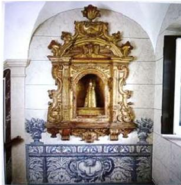
Fig.382 Azulejos da escadaria Convento dos Cardaes, Lisboa