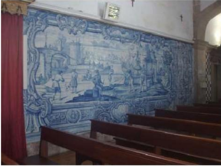
Fig. 32 Azulejos da nave da Igreja, lado da epístola Igreja da Ordem Terceira do Carmo de Viseu FA