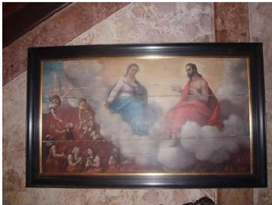
Fig.71 Convento de Nossa Senhora das Relíquias, Vidigueira Pintura FA