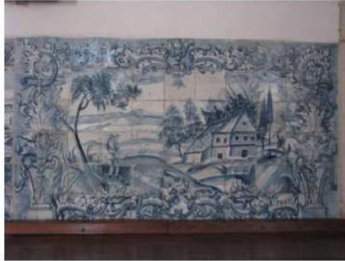
Fig.168 Convento de Santa Teresa de Jesus - Coimbra Azulejos Coro alto