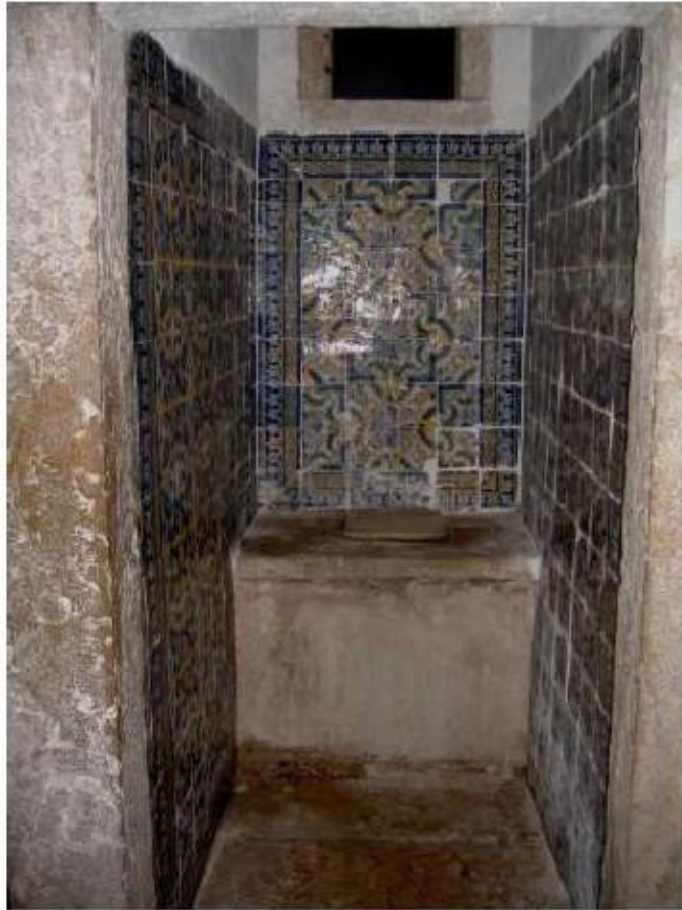
Fig.326 Azulejaria de padrão, piso térreo do complexo conventual Convento de Santa Teresa de Jesus de Carnide, Lisboa, FA