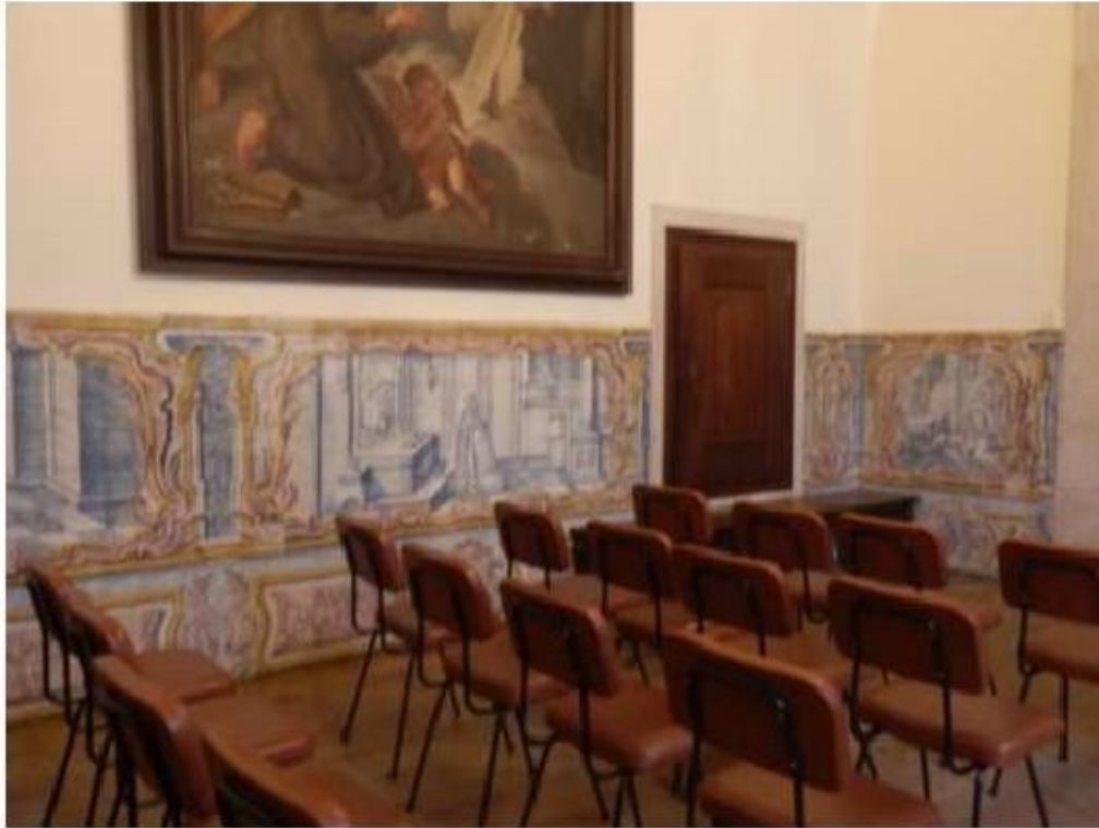
Fig.198 Convento do Santíssimo Coração de Jesus – Basílica da Estrela, Lisboa Sala de Santa Teresa Painel de Azulejos, lado do evangelho FA