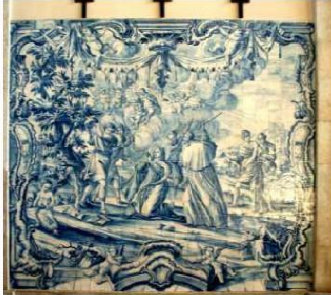
Fig.251 O sofrimento de Santa Teresa durante a fundação do seu primeiro mosteiro Transepto da igreja, lado da epístola Painel de azulejos do século XVIII Convento de Santa Teresa de Jesus de Carnide, Lisboa FA