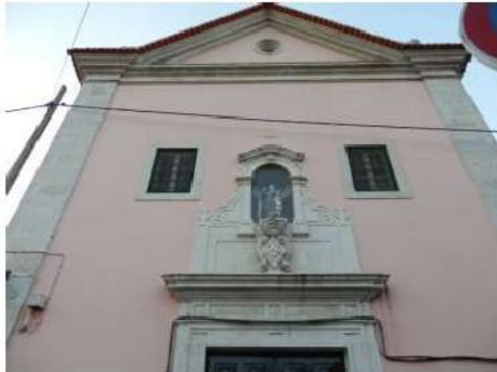
Fig.223 Fachada da igreja Convento de Santa Teresa de Jesus de Carnide, Lisboa FA