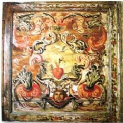
Figs.400, 401 Pintura das portas de um dos oratórios do claustro Convento dos Cardeais, Lisboa