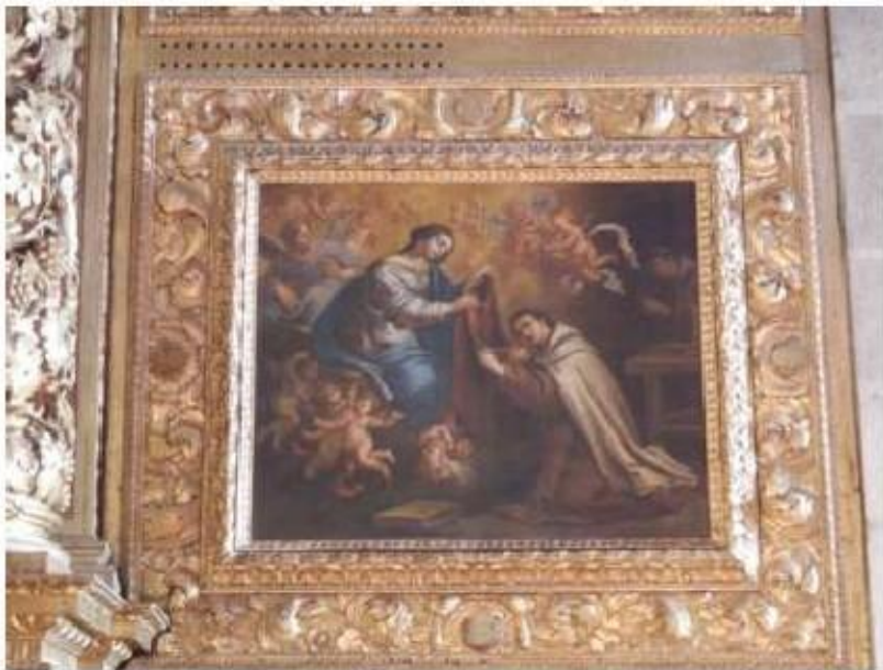
Fig.96 Pintura, Capela-mor, lado da epístola Convento de Nossa Senhora do Carmo de Viana do Castelo FA