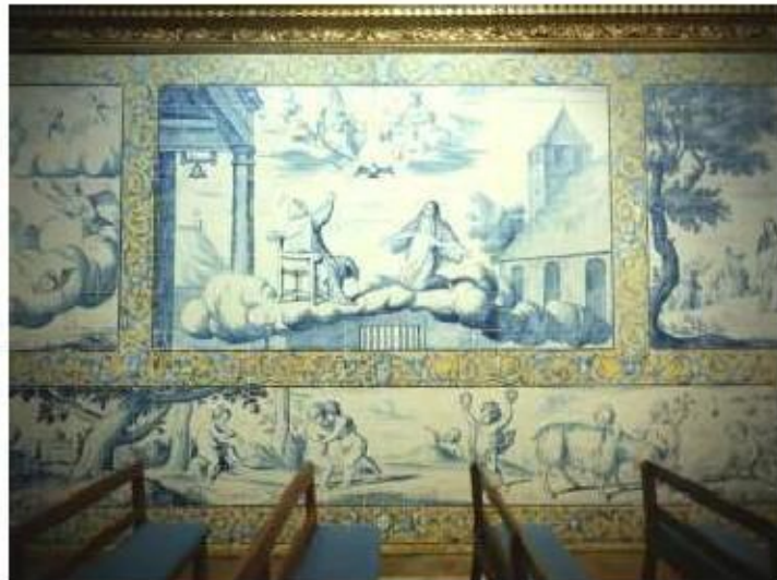
Fig.342 Santa Teresa de Jesus e São João da Cruz Convento dos Cardaes, Lisboa FA