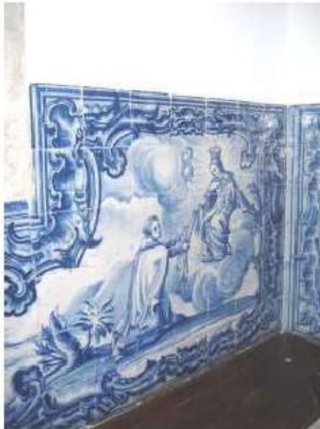
Fig.288 Aparição de Nossa Senhora do Carmo a São Simão Stock e dádiva do escapulário Sala do Capítulo Painel de azulejos do século XVIII Convento de Santa Teresa de Jesus de Carnide, Lisboa FA