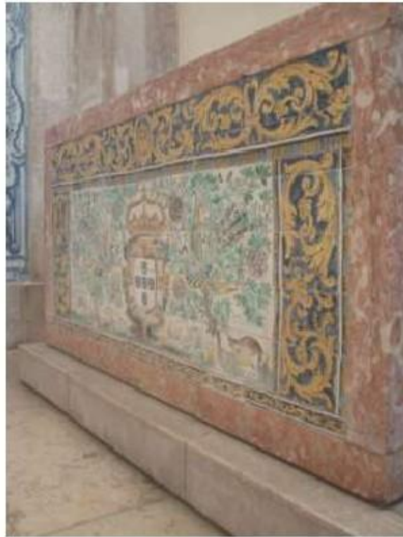
Fig.259 Transepto da igreja, mesa de altar com azulejos, lado do evangelho Convento de Santa Teresa de Jesus, Carnide, Lisboa, FA