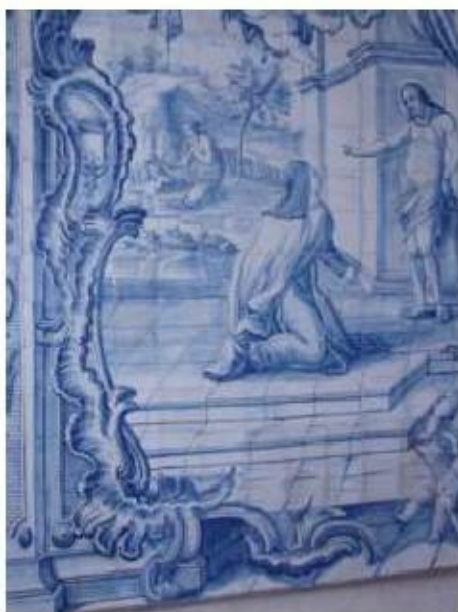
Fig. 268 Painel de azulejos do século XVIII, lado da epístola Convento de Santa Teresa de Jesus de Carnide, Lisboa FA