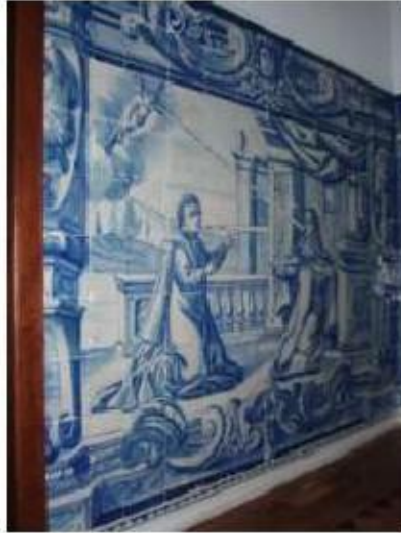
Fig.296 Dependência conventual Painel de azulejos do século XVIII Convento de Santa Teresa de Jesus, Carmide, Lisboa FA