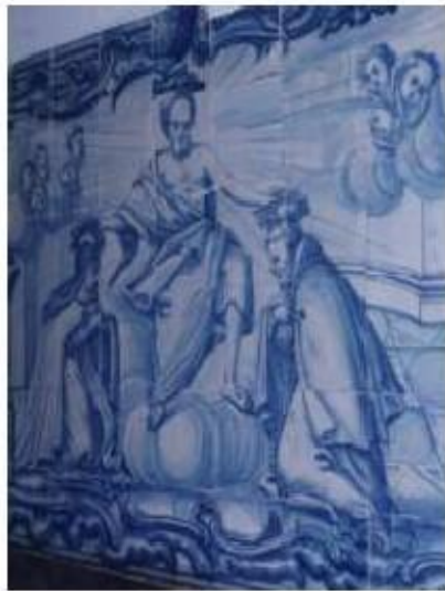
Fig.278 Sala do Capítulo Painel de azulejos do século XVIII Convento de Santa Teresa de Jesus de Carnide, Lisboa FA