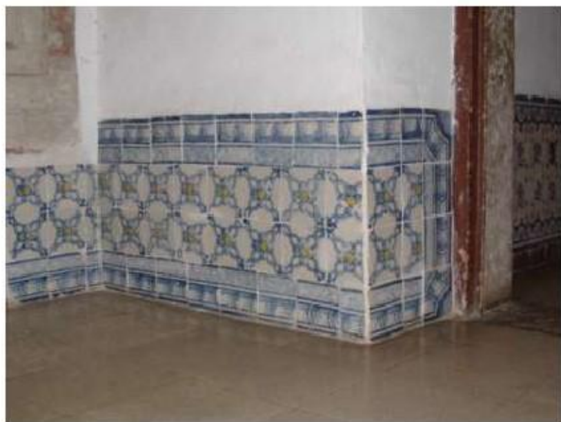
Fig.328 Azulejaria de padrão, piso térreo do complexo conventual Convento de Santa Teresa de Jesus de Carnide, Lisboa, FA