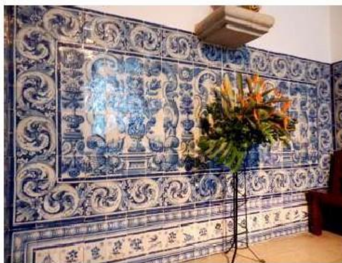
Fig.109 Capela de São Miguel Arcanjo Convento de Nossa Senhora do Carmo de Viana do Castelo FA