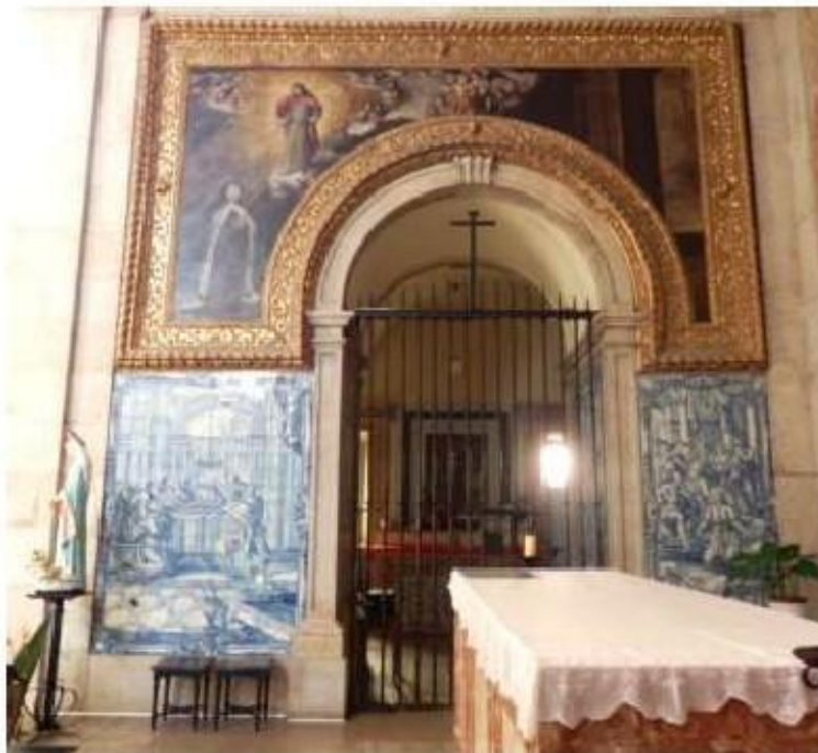
Fig.232 Capela-mor, lado do evangelho Convento de Santa Teresa de Jesus de Carnide, Lisboa FA