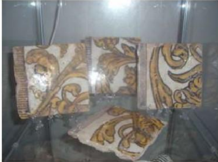
Fig.68 Convento de Nossa Senhora das Relíquias, Vidigueira Azulejos FA