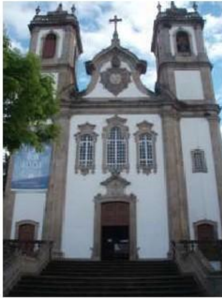
Fig. 28 Vista geral da fachada principal Igreja da Ordem Terceira do Carmo de Viseu FA