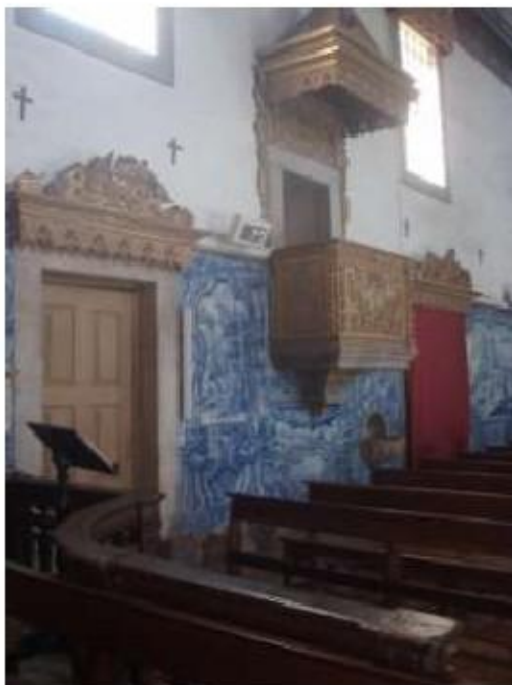
Fig. 34 Azulejos da nave da Igreja, lado da epístola Igreja da Ordem Terceira do Carmo de Viseu FA