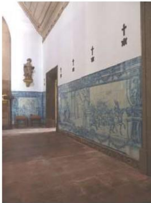
Fig.53 Ermita de Santa Teresa, Caldas de Monchique Parede do lado da epístola FA