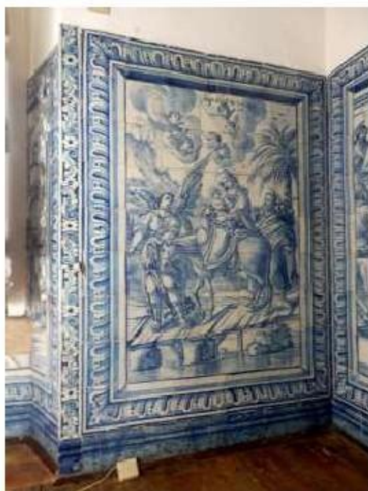
Fig.430 A Fuga para o Egipto Painel de azulejos do século XVII Sala do 1.º piso Convento de São José, Évora FA