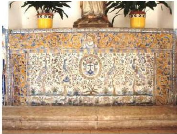
Fig. 322 Frontal de altar Claustro Convento de Santa Teresa de Jesus de Carnide, Lisboa FA