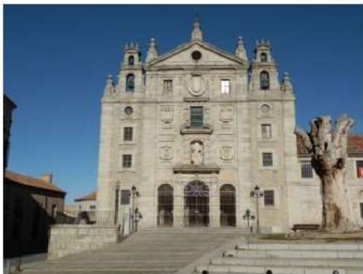
Fig. 2 Igreja da Santa, Casa Natal de Santa Teresa de Jesus, Ávila Fachada principal FA