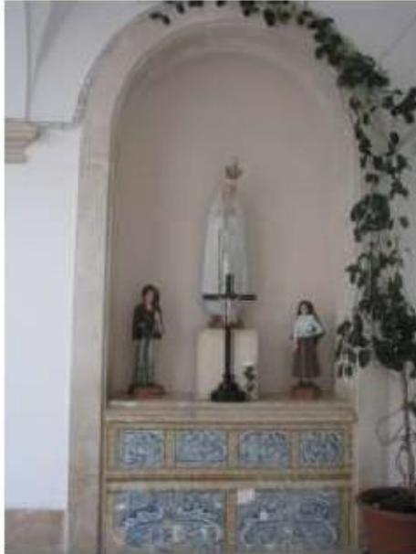
Fig.186 Convento de Santa Teresa de Jesus - Coimbra Azulejos Claustro