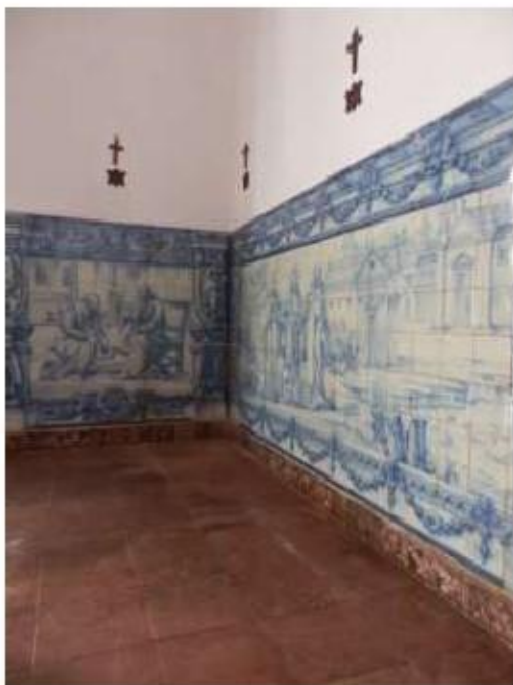
Fig.48 Ermida de Santa Teresa, Caldas de Monchique Parede do lado do evangelho FA