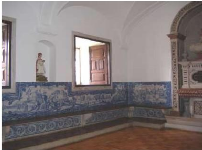
Fig. 284 Sala do Capítulo Painel de azulejos do século XVIII Convento de Santa Teresa de Jesus de Carnide, Lisboa FA