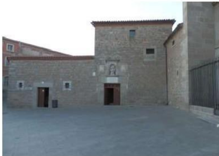
Fig.15 Mosteiro de São José, Ávila FA