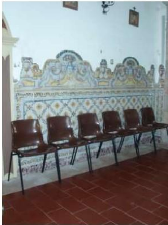
Fig.78 Igreja da Ordem Terceira de Nossa Senhora do Carmo de Setúbal Azulejaria neoclássica FA