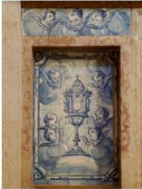
Fig.235 Santíssimo Sacramento Painel de azulejos do século XVIII, capela-mor, lado da epístola Convento de Santa Teresa de Jesus de Carnide, Lisboa FA