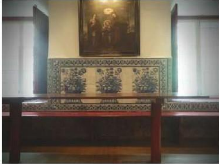
Fig.390 Vista geral dos azulejos do antigo refeitório conventual Convento dos Cardaes, Lisboa FA