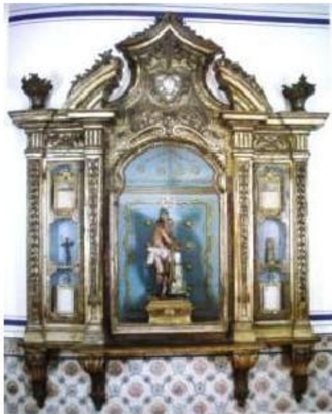
Fig.405 Azulejos da Sala do Capítulo Convento dos Cardaes