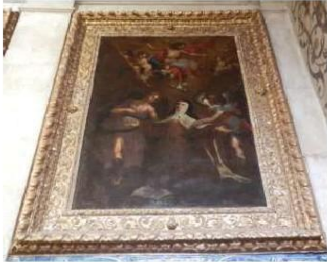
Fig. 255 Transverberação de Santa Teresa de Jesus Nave da igreja Convento de Santa Teresa de Jesus de Carnide, Lisboa FA