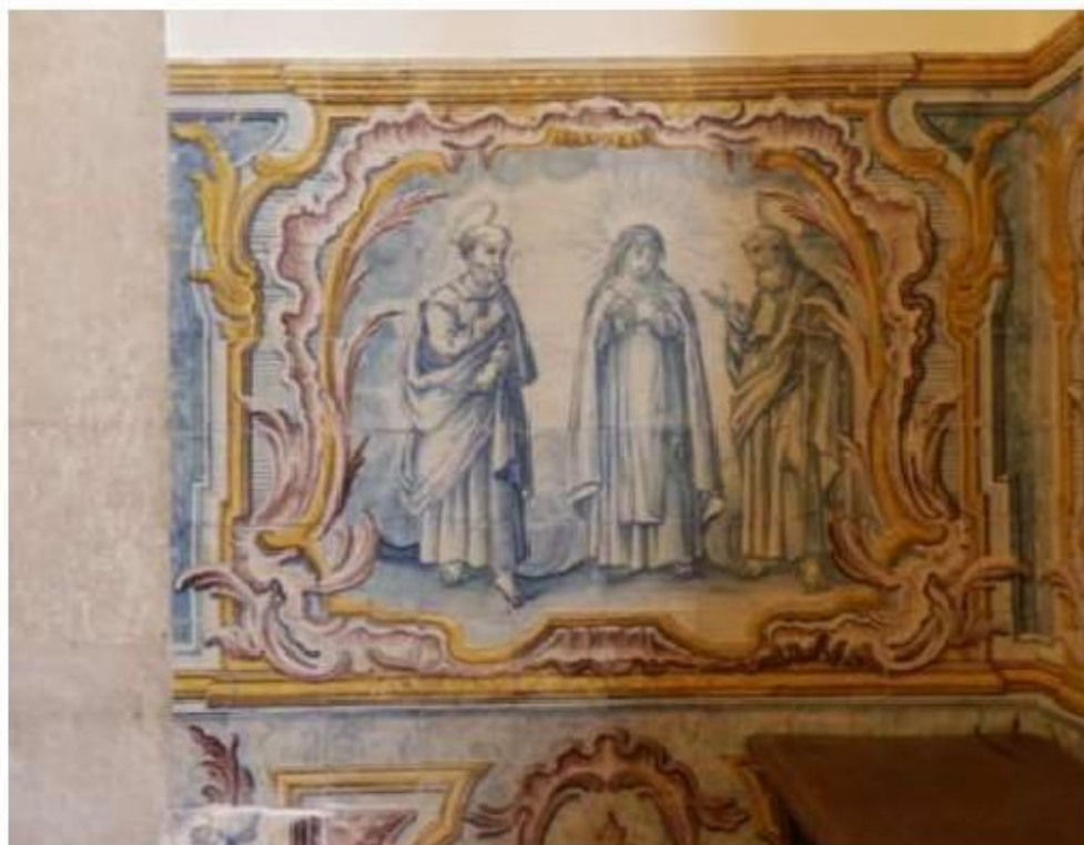
Fig.200 Convento do Santíssimo Coração de Jesus – Basilica da Estrela, Lisboa Sala de Santa Teresa Painel de Azulejos, lado da epístola FA