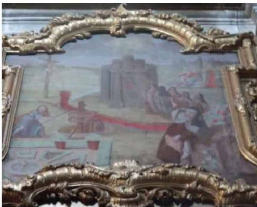
Fig.420 Pintura com temática teresiana, lado da epístola Convento de São José, Évora FA