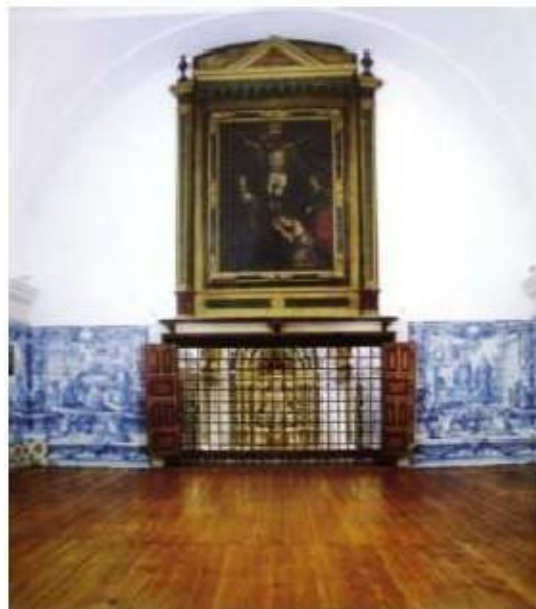
Fig.363 Coro alto Convento dos Cardaes de Lisboa