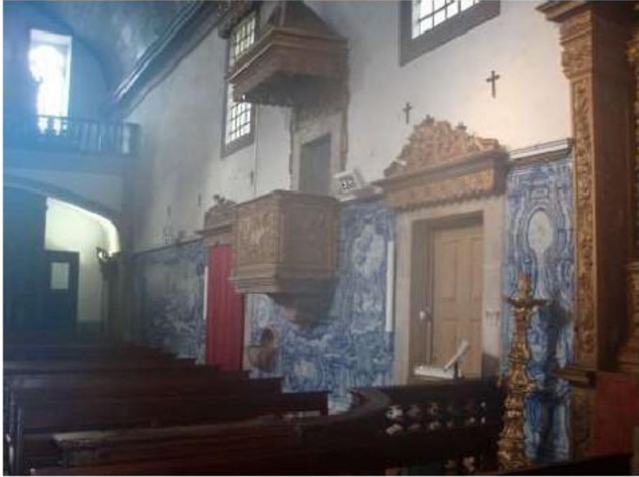
Fig. 30 Azulejos da nave da Igreja, lado do evangelho Igreja da Ordem Terceira do Carmo de Viseu FA