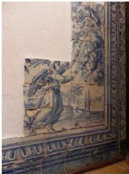
Fig.427 Pessoa em conversão Painel de azulejos do século XVII Sala do 1.º piso Convento de São José, Évora FA