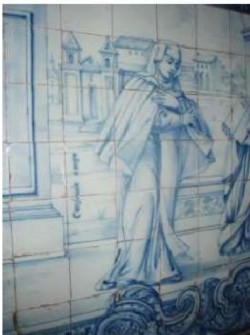
Fig.44 Ermida de Santa Teresa, Caldas de Monchique Parede do lado do evangelho FA