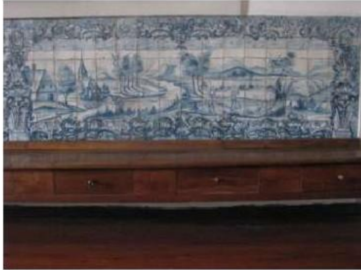
Fig.176 Convento de Santa Teresa de Jesus - Coimbra Azulejos Coro alto