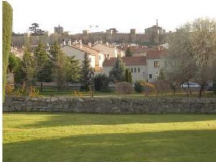
Fig. 1 Ávila, Espanha Vista geral da cidade FA