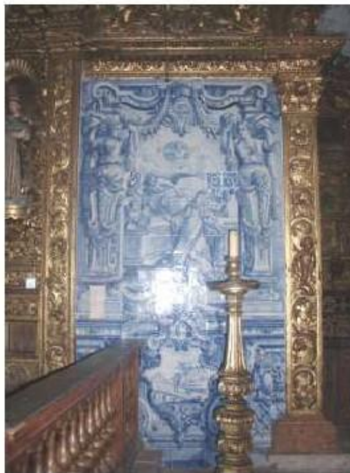
Fig.213 Transverberação de Santa Teresa de Jesus Lado da epístola Convento de Santo Alberto, Lisboa FA