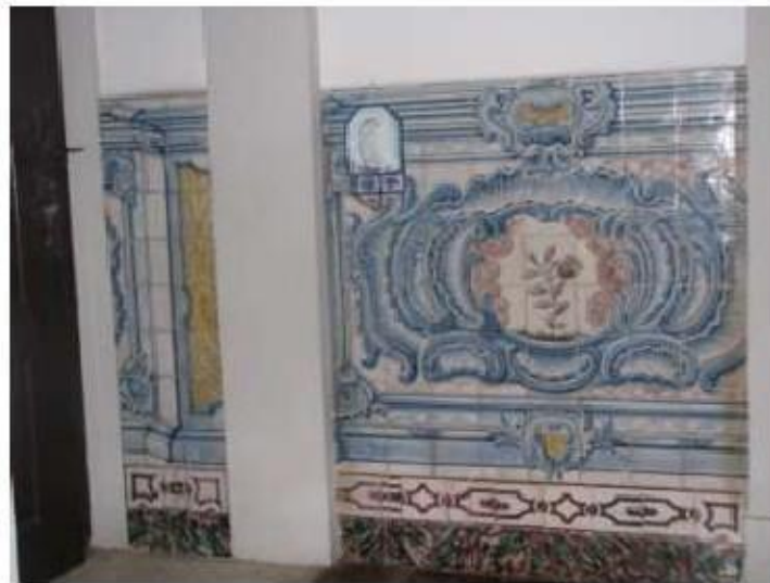
Fig.177 Convento de Santa Teresa de Jesus - Coimbra Azulejos Biblioteca