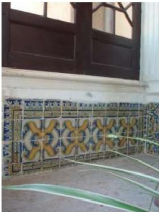
Fig.62 Convento de Nossa Senhora das Relíquias, Vidigueira Azulejos de Padrão FA