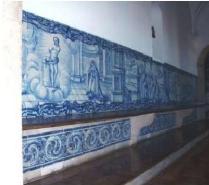
Fig.275 Sala do Capítulo Painel de azulejos do século XVIII Convento de Santa Teresa de Jesus de Carnide, Lisboa FA