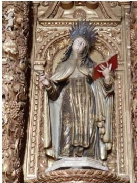
Fig.90 Santa Teresa de Jesus, retábulo da capela-mor Convento de Nossa Senhora do Carmo de Viana do Castelo FA