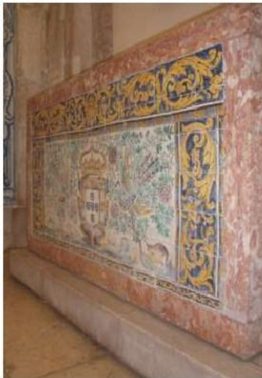
Fig.258 transepto da igreja, mesa de altar com azulejos, lado do evangelho Convento de Santa Teresa de Jesus, Carnide, Lisboa, FA