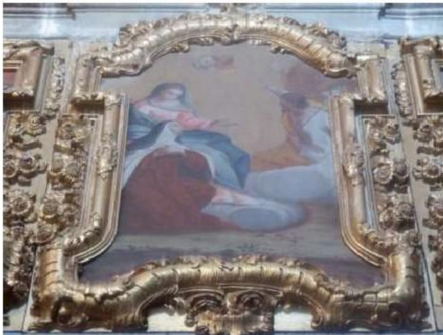
Fig.419 Pintura com temática teresiana, lado da epístola Convento de São José, Évora FA