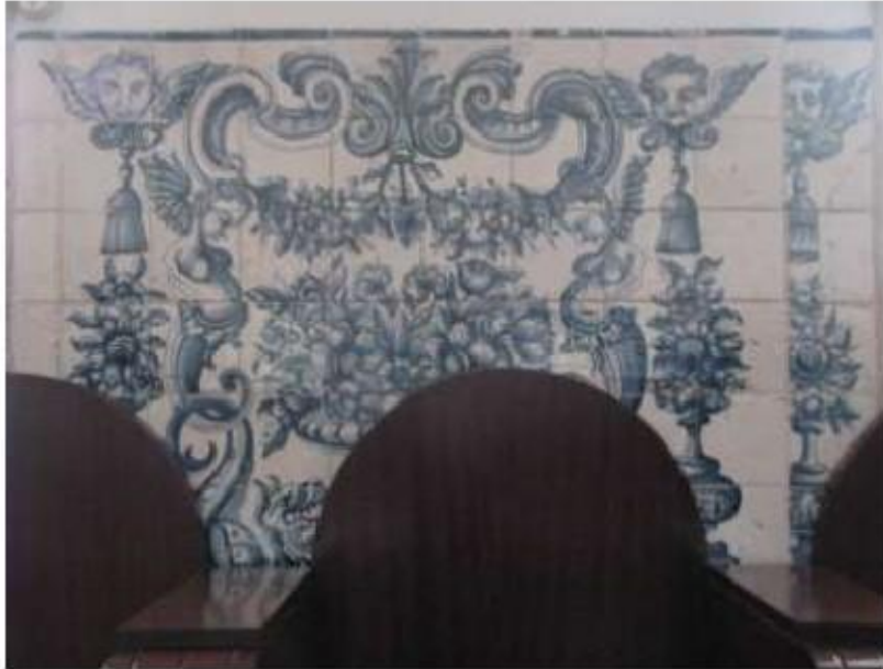
Fig.152 Convento de Santa Teresa de Jesus - Coimbra Azulejos Coro baixo