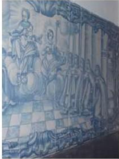
Fig.279 Sala do Capítulo Painel de azulejos do século XVIII Convento de Santa Teresa de Jesus de Carnide, Lisboa FA