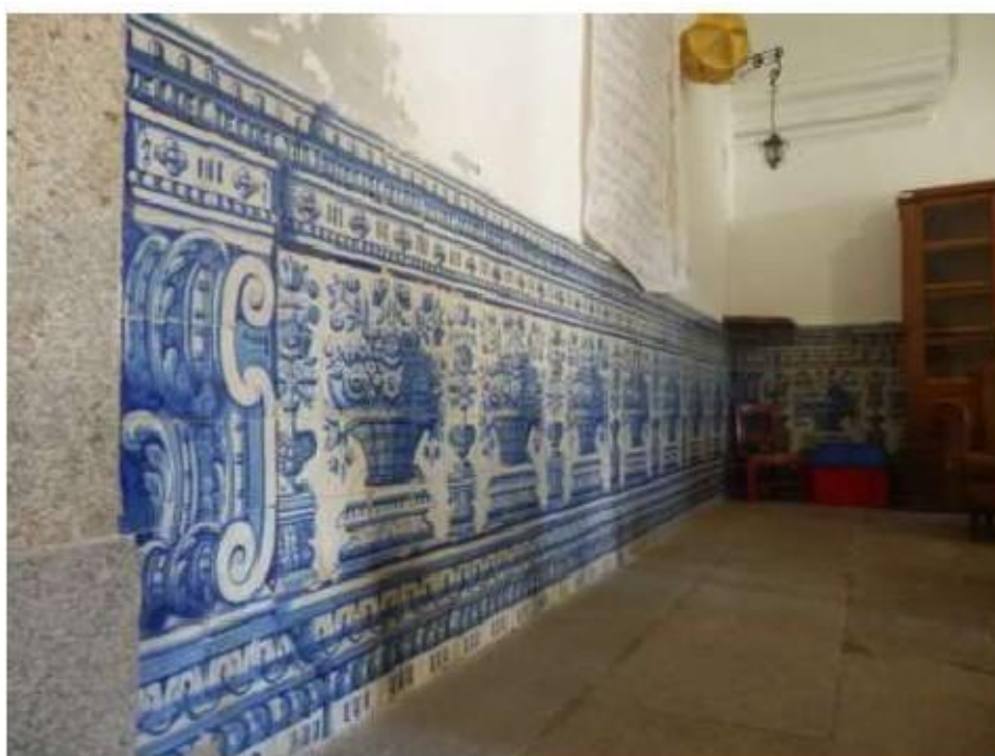
Fig. 433 Painel de azulejos Portaria Convento de São José, Évora FA