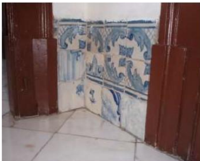
Fig.19 Igreja da Ordem Terceira de Nossa Senhora do Carmo de Lisboa Painel de azulejos FA