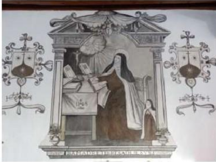
Fig.11 Mosteiro da Encarnação, Ávila Sala I FA