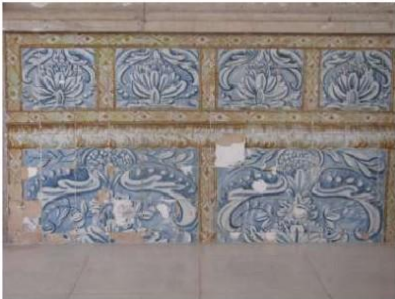
Fig.187 Convento de Santa Teresa de Jesus - Coimbra Azulejos Claustro