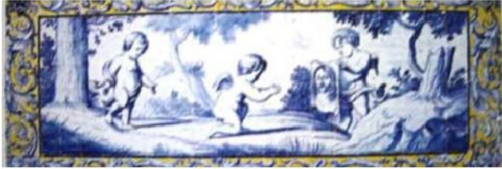
Fig.347 Meninos com símbolos da Paixão Parede fundeira Convento dos Cardaes, Lisboa