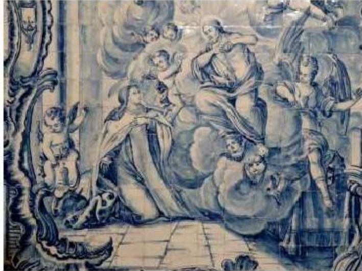
Fig.253 Santa Teresa de Jesus com Jesus Cristo Transepto da igreja, lado da epístola Painel de azulejos do século XVIII Convento de Santa Teresa de Jesus de Carnide, Lisboa FA