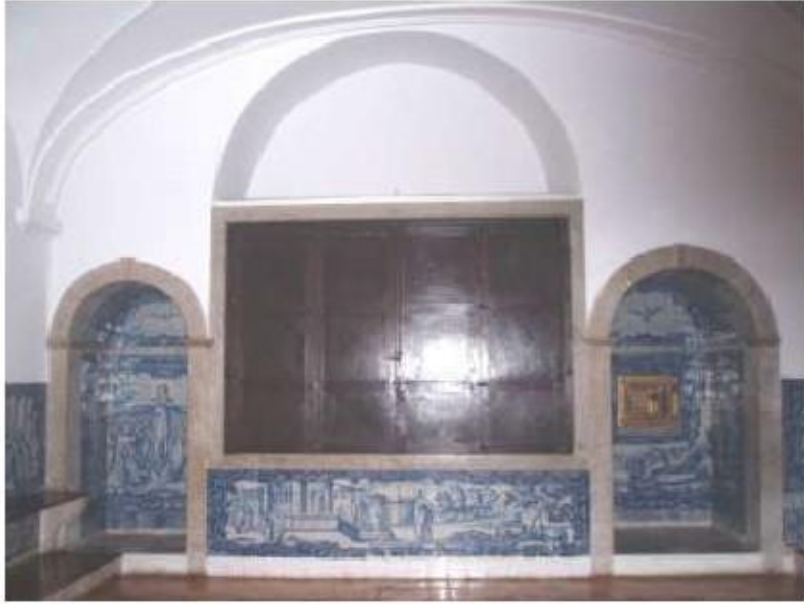
Fig.281 Sala do Capítulo Painel de azulejos do século XVIII Convento de Santa Teresa de Jesus, Carnide, Lisboa FA