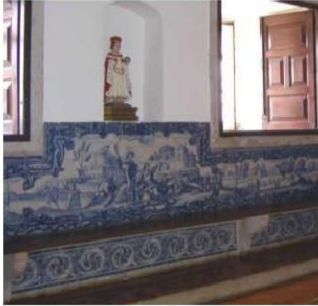
Fig.285 Sala do Capítulo Painel de azulejos do século XVIII Convento de Santa Teresa de Jesus, Carnide, Lisboa FA