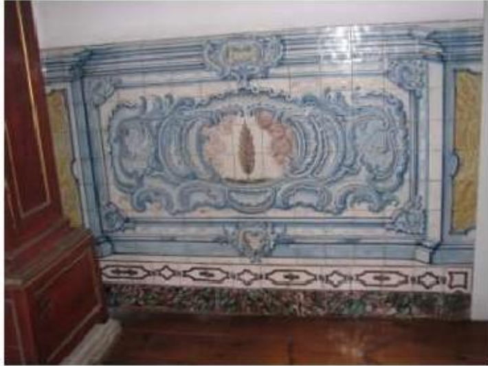
Fig.180 Convento de Santa Teresa de Jesus - Coimbra Azulejos Biblioteca