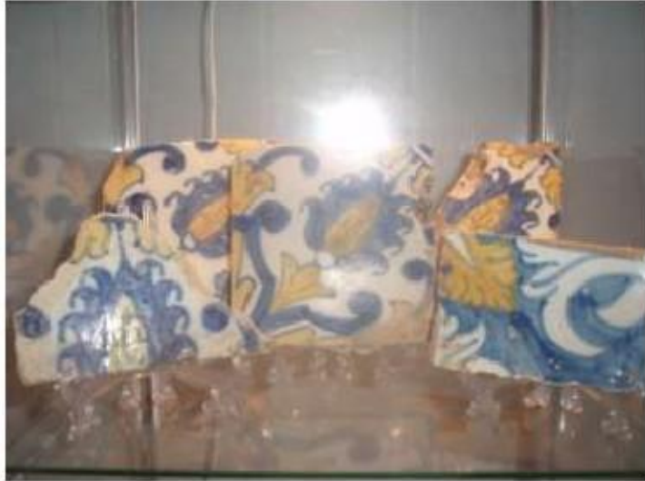
Fig.66 Convento de Nossa Senhora das Relíquias, Vidigueira Azulejos de Padrão FA