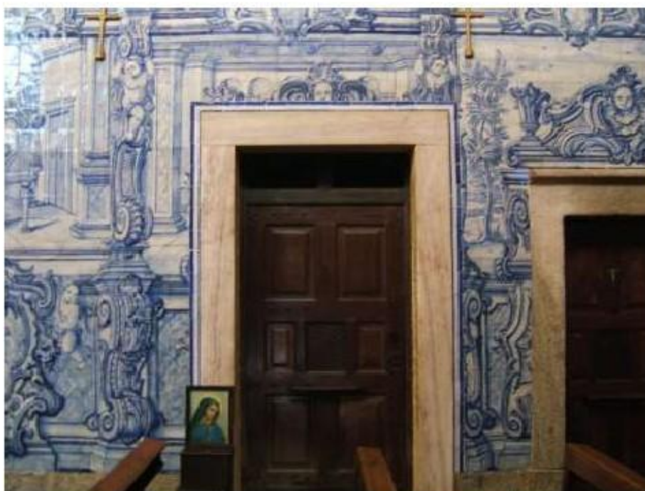
Fig.418 Revestimento parietal com azulejaria, lado da epístola Convento de São José, Évora FA