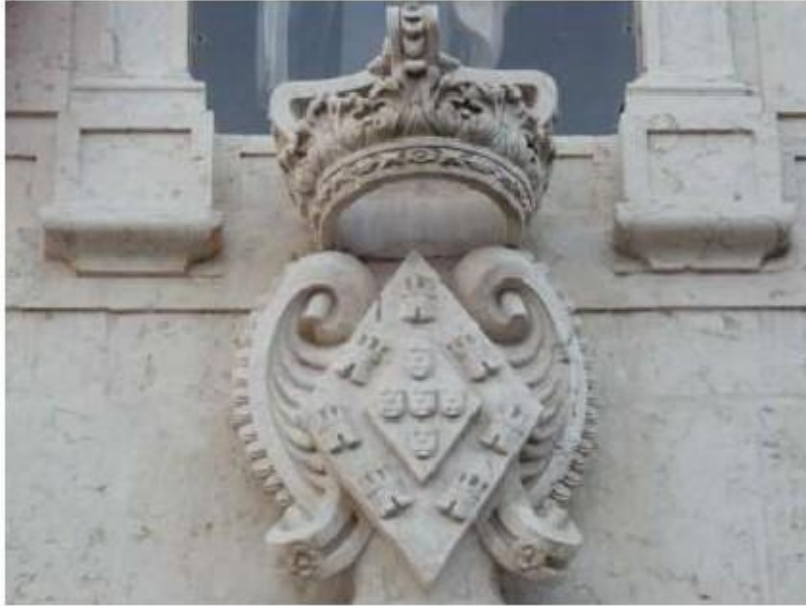
Fig.225 Fachada da igreja Convento de Santa Teresa de Jesus de Carnide, Lisboa FA