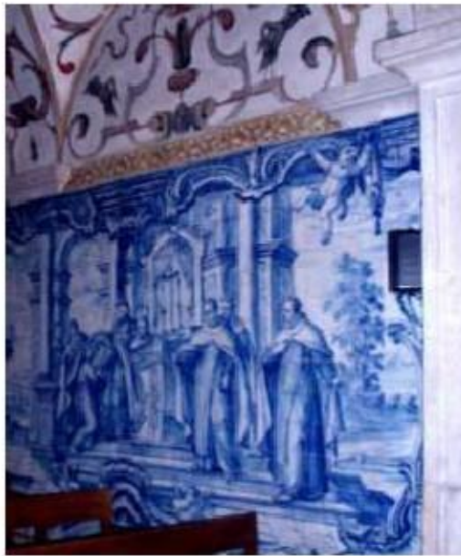
Fig.242 .A tomada de hábito de Santa Teresa de Jesus Nave da igreja, lado do evangelho Painel de azulejos do século XVIII Convento de Santa Teresa de Jesus de Carnide, Lisboa FA