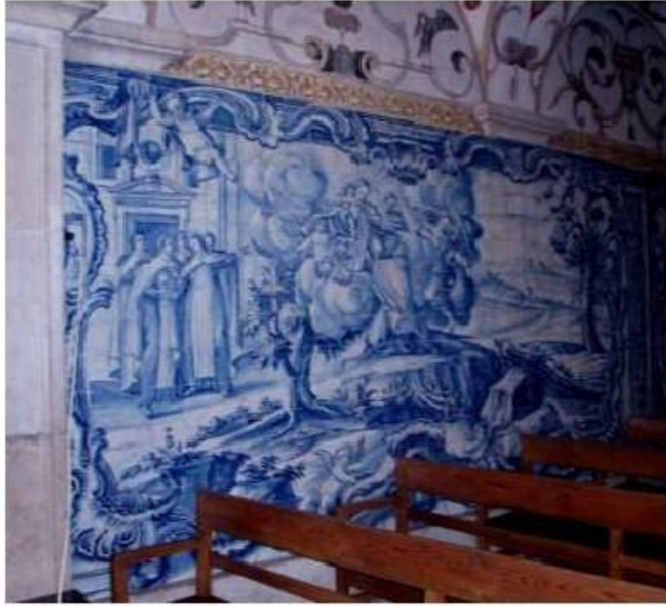
Fig.247 Santa Teresa de Jesus a falar sobre o escapulário, Nave da igreja, lado da epístola Painel de azulejos do século XVIII Convento de Santa Teresa de Jesus de Carnide, Lisboa FA