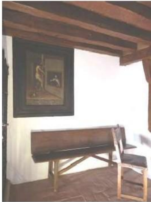
Fig.9 Mosteiro da Encarnação, Ávila Locutório onde apareceu Jesus Cristo apareceu a Santa Teresa de Jesus FA