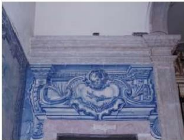
Fig.274 Painel de azulejos do século XVIII Convento de Santa Teresa de Jesus de Carnide, Lisboa FA