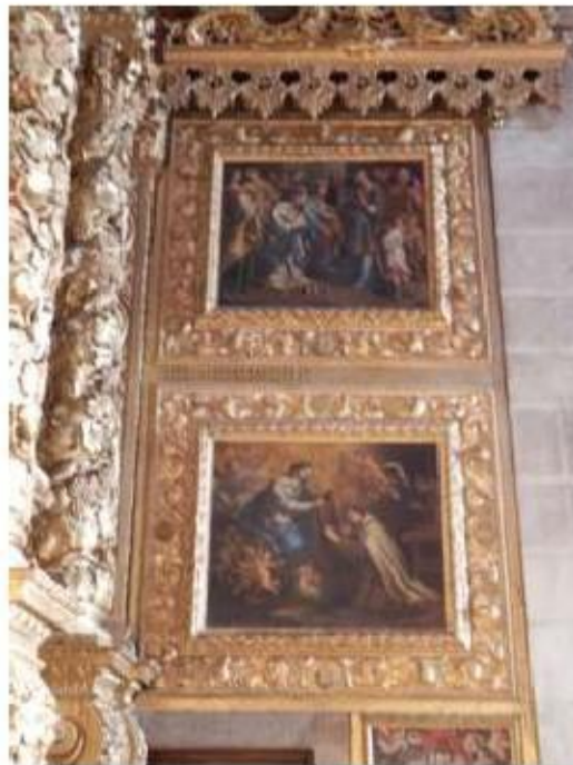
Fig.94 Pintura, Capela-mor, lado da epístola Convento de Nossa Senhora do Carmo de Viana do Castelo FA