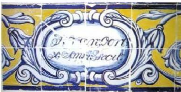
Fig.338 Painel de azulejos no rodapé da parede lateral direita na nave , assinatura do pintor: "J.van Oort/Amst.Fecit." Convento dos Cardaes, Lisboa