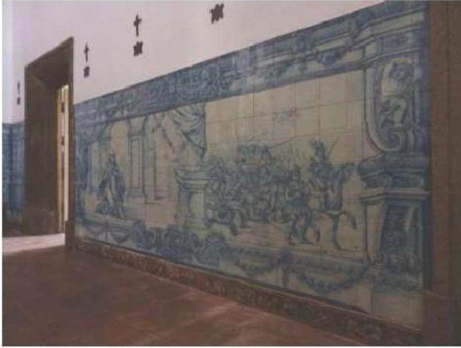
Fig.52 Ermita de Santa Teresa, Caldas de Monchique Parede do lado da epístola FA