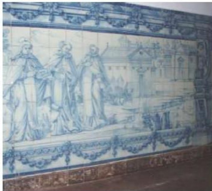
Fig.41 Ermida de Santa Teresa, Caldas de Monchique Parede lado evangelho FA