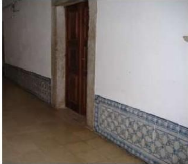
Fig.329 Azulejaria de padrão, piso térreo do complexo conventual Convento de Santa Teresa de Jesus de Carnide, Lisboa, FA