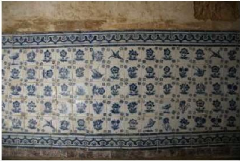
Fig. 449 Azulejaria no antigo corredor conventual Convento de Nossa Senhora da Conceição, Lagos