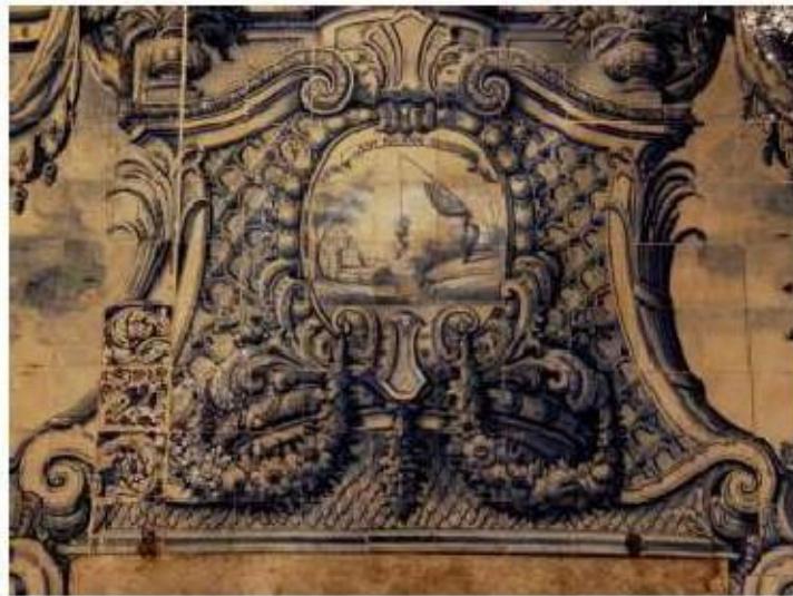
Fig.219 Emblema em azulejo, lado da epístola Convento de Santo Alberto, Lisboa