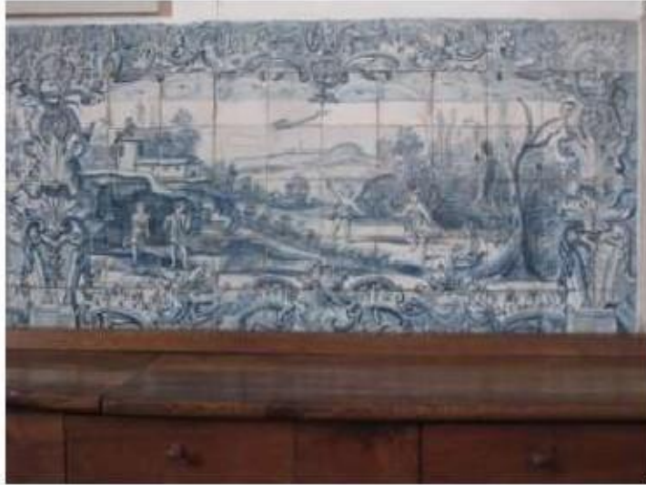
Fig.174 Convento de Santa Teresa de Jesus - Coimbra Azulejos Coro alto