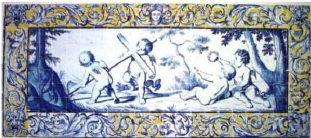
Fig.348 Meninos com símbolos da Paixão Parede fundeira Convento dos Cardaes, Lisboa