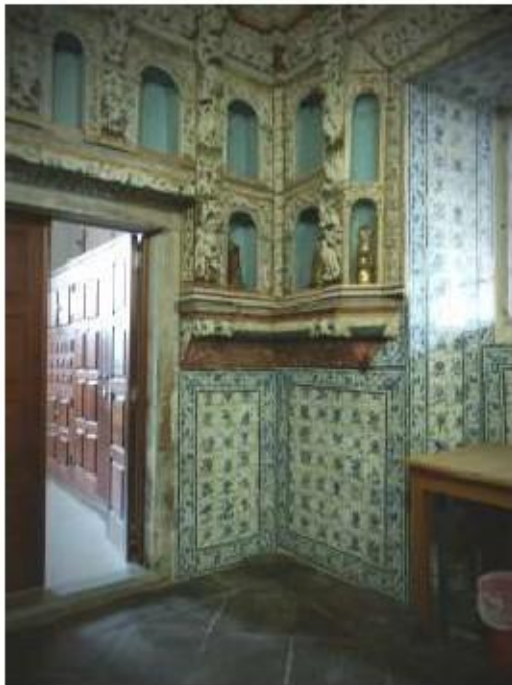
Fig.99 Azulejos da sacristia Convento de Nossa Senhora do Carmo de Viana do Castelo FA