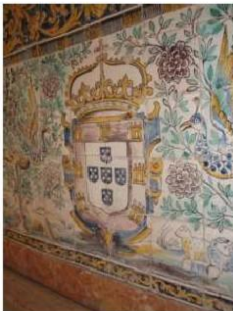
Fig.261 Transepto da igreja, mesa de altar com azulejos, lado do evangelho Convento de Santa Teresa de Jesus, Carnide, Lisboa, FA