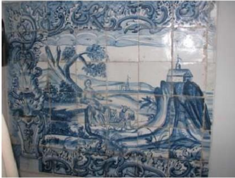
Fig.156 Convento de Santa Teresa de Jesus - Coimbra Azulejos Coro alto