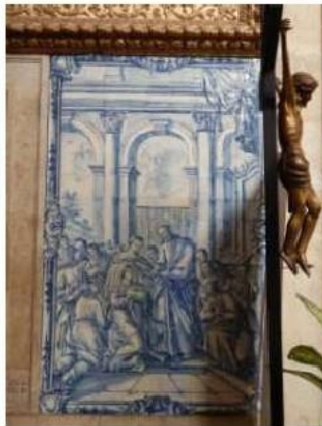
Fig.236 Tema não identificado. Jesus dá a comunhão a uma mulher (Sua Mãe?, Santa Maria Madalena?) Painel de azulejos do século XVIII, capela-mor, lado da epístola Convento de Santa Teresa de Jesus de Carnide, Lisboa