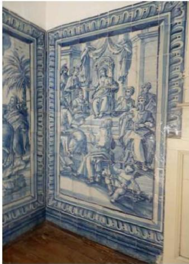
Fig.431 Jesus, no Templo de Jerusalém, entre os Doutores Painel de azulejos do século XVII Sala do 1.º Piso Convento de São José, Évora FA