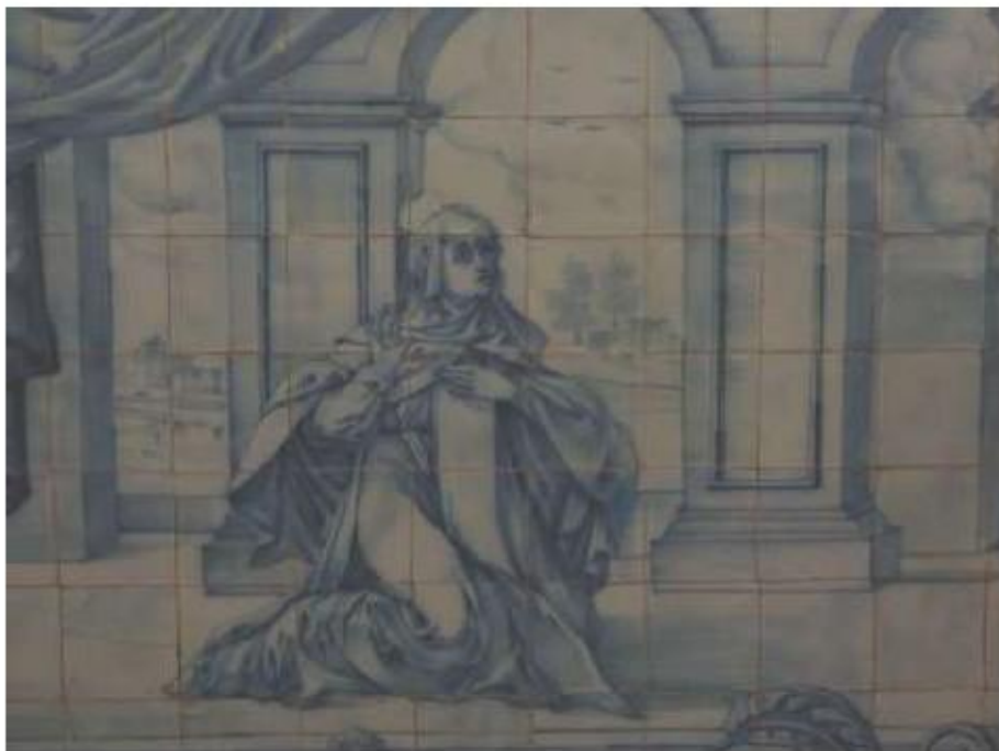
Fig.55 Ermida de Santa Teresa, Caldas de Monchique Parede do lado da epístola FA