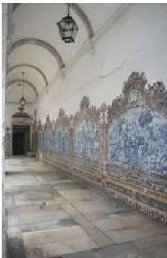
Fig.72 Vista geral do revestimento em azulejo do claustro Colégio de Nossa Senhora da Conceição do Carmo, Coimbra