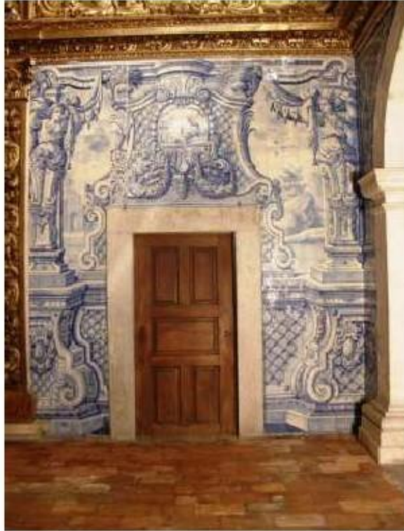
Fig.218 Revestimento parietal com azulejaria, lado da epístola Convento de Santo Alberto, Lisboa