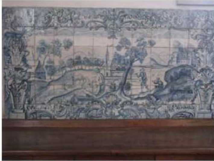
Fig.172 Convento de Santa Teresa de Jesus - Coimbra Azulejos Coro alto