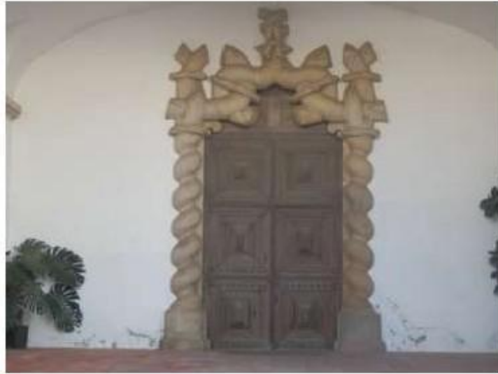
Fig.73 Convento de Nossa Senhora do Carmo de Évora Portal principal FA