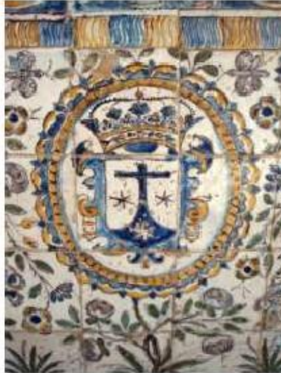
Fig.324 Frontal de altar Convento de Santa Teresa de Jesus de Carnide, Lisboa, FA