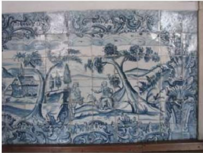
Fig.158 Convento de Santa Teresa de Jesus - Coimbra Azulejos Coro alto