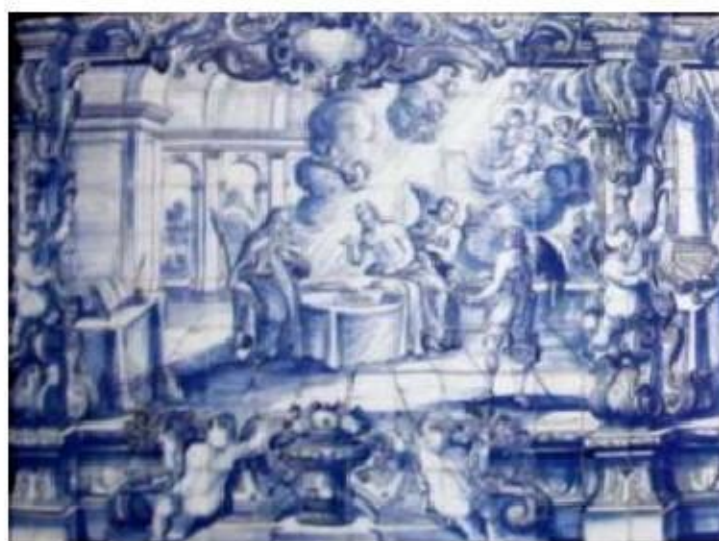
Fig.370 Refeição de Jesus Cristo a Santa Teresa Coro alto Convento dos Cardaes, Lisboa