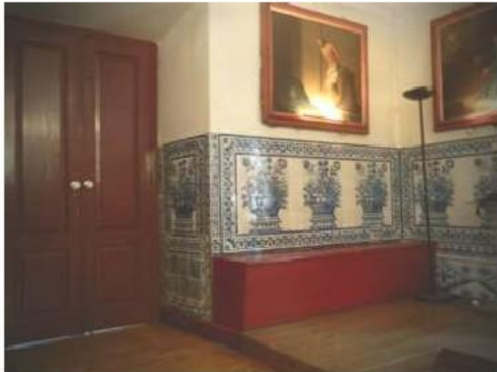
Fig.389 Vista geral dos azulejos do antigo refeitório conventual Convento dos Cardaes, Lisboa FA