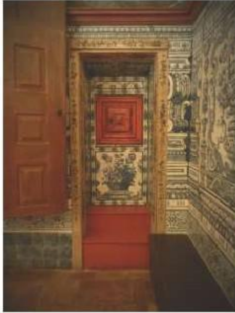
Fig.394 Vista geral do coro baixo Convento dos Cardaes, Lisboa FA