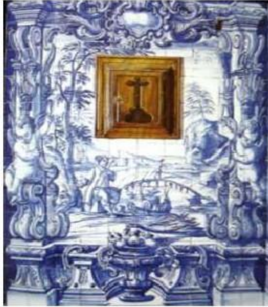
Fig.376 Cena bucólica Coro alto Convento dos Cardaes, Lisboa