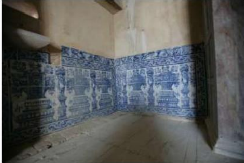
Fig. 444 Azulejaria na antiga sacristia conventual Convento de Nossa Senhora da Conceição, Lagos