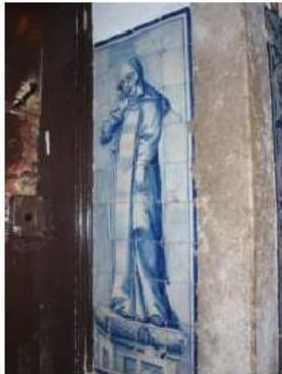
Fig.314 Portaria conventual Painel de azulejos Convento de Santa Teresa de Jesus de Carnide, Lisboa FA