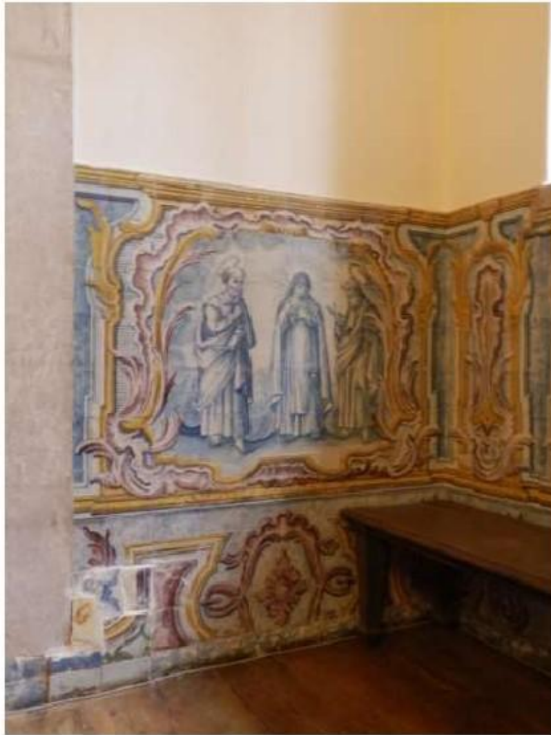
Fig.199 Convento do Santíssimo Coração de Jesus – Basílica da Estrela, Lisboa Sala de Santa Teresa Painel de Azulejos, lado da epístola FA