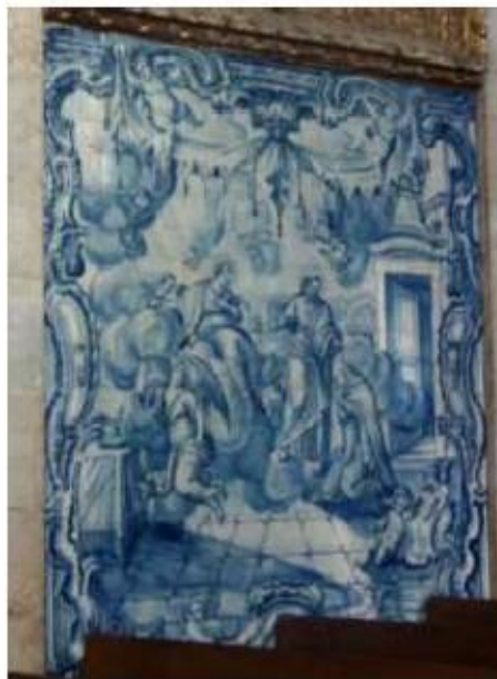
Fig.248 A coroação de Santa Teresa de Jesus por Jesus Cristo como recompensa pelos sofrimentos por que passou durante a fundação do seu primeiro mosteiro Nave da igreja, lado da epístola Painel de azulejos do século XVIII Convento de Santa Teresa de Jesus de Carnide, Lisboa FA