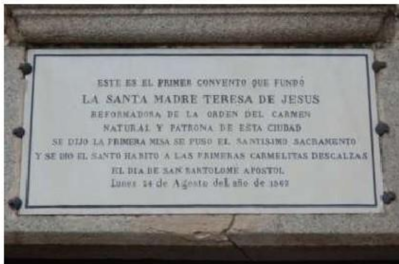
Fig.17 Mosteiro de São José, Ávila FA