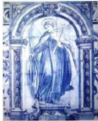
Fig.379 e 380 Santa Teresa e São João da Cruz antiga sacristia conventual Convento dos Cardaes, Lisboa