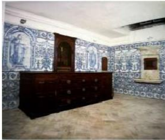
Fig.378 Vista geral da antiga sacristia conventual Convento dos Cardaes, Lisboa