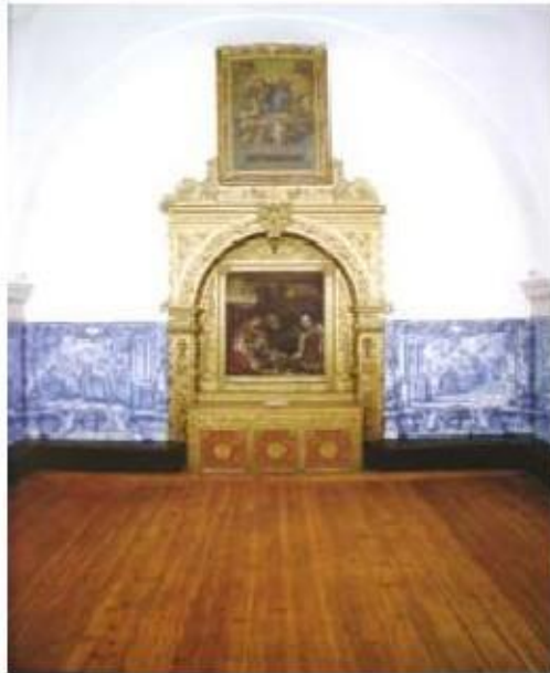
Fig.362 Coro alto Convento dos Cardaes de Lisboa