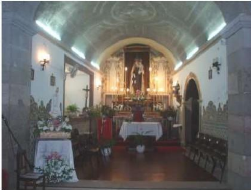
Fig.75 Igreja da Ordem Terceira de Nossa Senhora do Carmo de Setúbal Vista geral do interior FA