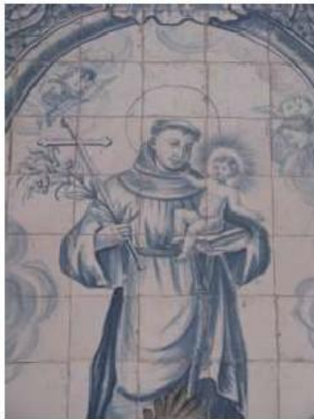
Fig.191 Convento de Santa Teresa de Jesus - Coimbra Azulejos com Santo António