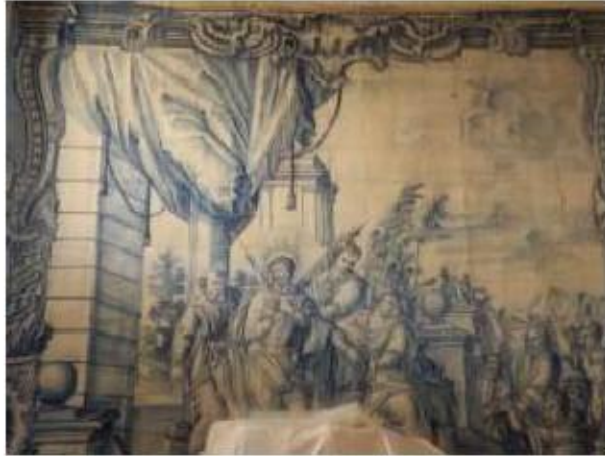
Fig.271 Jesus diante de Pilatos Painel de azulejos do século XVIII Convento de Santa Teresa de Jesus de Carnide, Lisboa FA