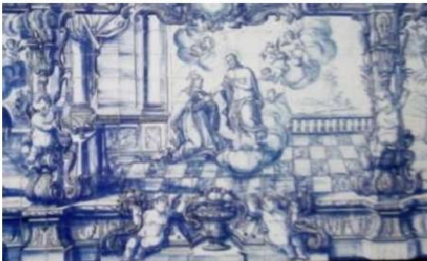
Fig.369 Casamento místico de Santa Teresa de Jesus Coro alto, Convento dos Cardaes, Lisboa