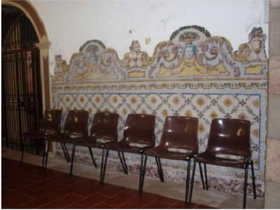
Fig.77 Igreja da Ordem Terceira de Nossa Senhora do Carmo de Setúbal Azulejaria neoclássica FA