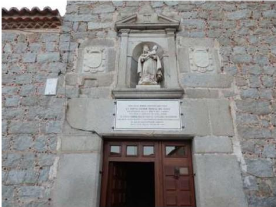
Fig.16 Mosteiro de São José, Ávila FA