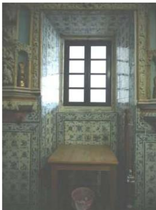
Fig.105 Azulejos da sacristia Convento de Nossa Senhora do Carmo de Viana do Castelo FA