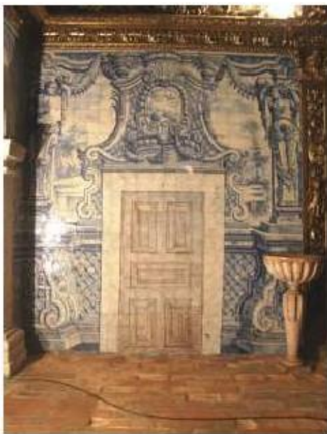
Fig.220 Revestimento parietal com azulejaria, lado do evangelho Convento de Santo Alberto, Lisboa