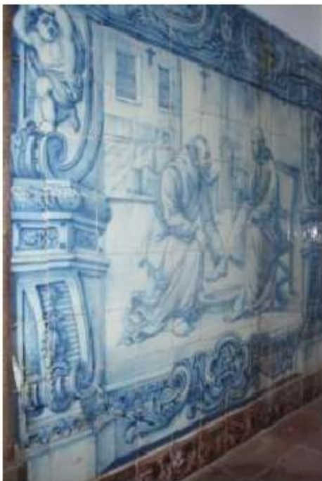
Fig.49 Ermida de Santa Teresa, Caldas de Monchique Parede fundeira, lado do evangelho FA