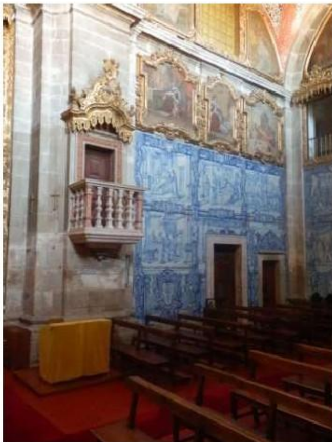
Fig.415 Igreja conventual, lado da epístola Convento de São José, Évora FA