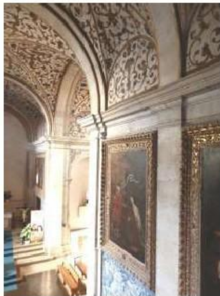
Fig.230 Vista da igreja Convento de Santa Teresa de Jesus de Carnide, Lisboa FA