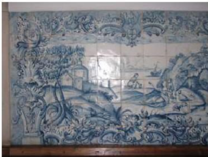
Fig.159 Convento de Santa Teresa de Jesus - Coimbra Azulejos Coro alto