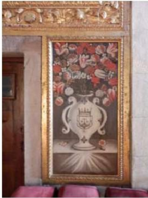
Fig.97 Pintura, Capela-mor, lado da epístola Convento de Nossa Senhora do Carmo de Viana do Castelo FA