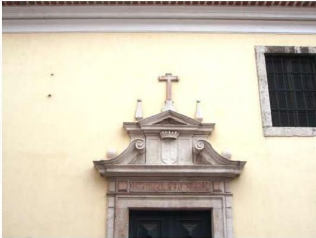
Fig.206 Portal Convento de Santo Alberto, Lisboa FA