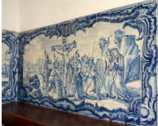
Fig.309 Crucificação de Jesus Cristo Coro alto Painel de azulejos do século XVIII Convento de Santa Teresa de Jesus de Carnide, Lisboa FA