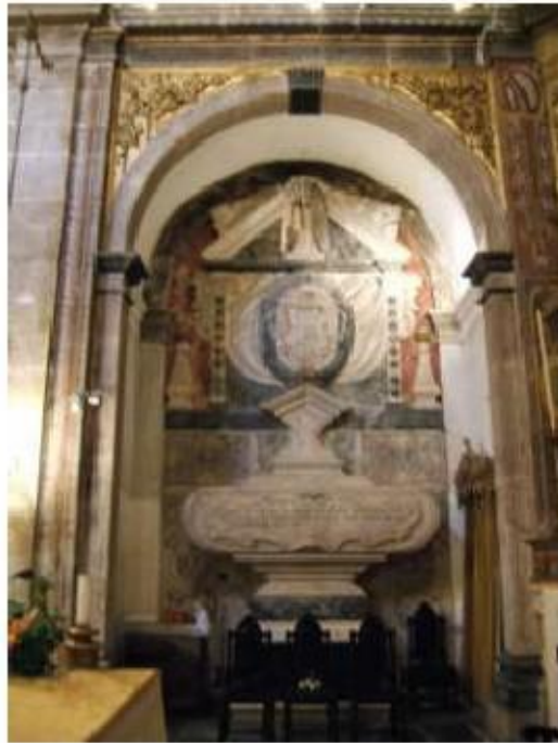
Fig.410 Capela-mor Convento de São José, Évora FA