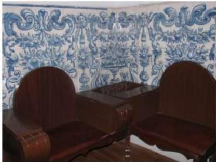
Fig.153 Convento de Santa Teresa de Jesus - Coimbra Azulejos Coro baixo