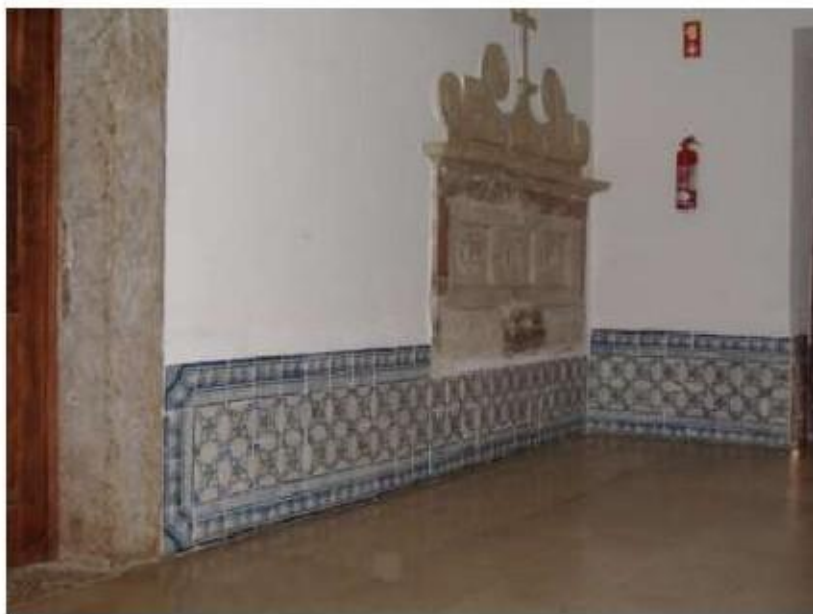
Fig.327 Azulejaria de padrão, piso térreo do complexo conventual Convento de Santa Teresa de Jesus de Carnide, Lisboa FA