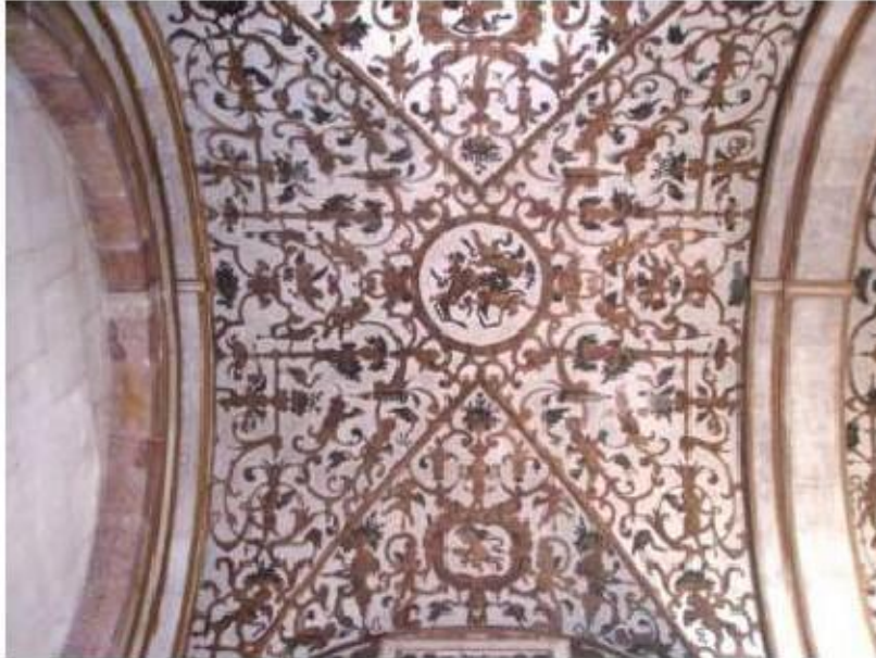
Fig.257 Capela-mor, pintura Convento de Santa Teresa de Jesus de Carnide, Lisboa FA