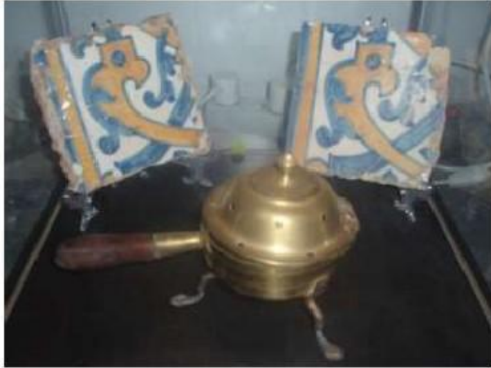
Fig.64 Convento de Nossa Senhora das Relíquias, Vidigueira Azulejos de Padrão FA