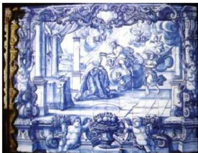
Fig.372 Santa Teresa de Jesus a ser coroada por Jesus Coro alto Convento dos Cardaes, Lisboa