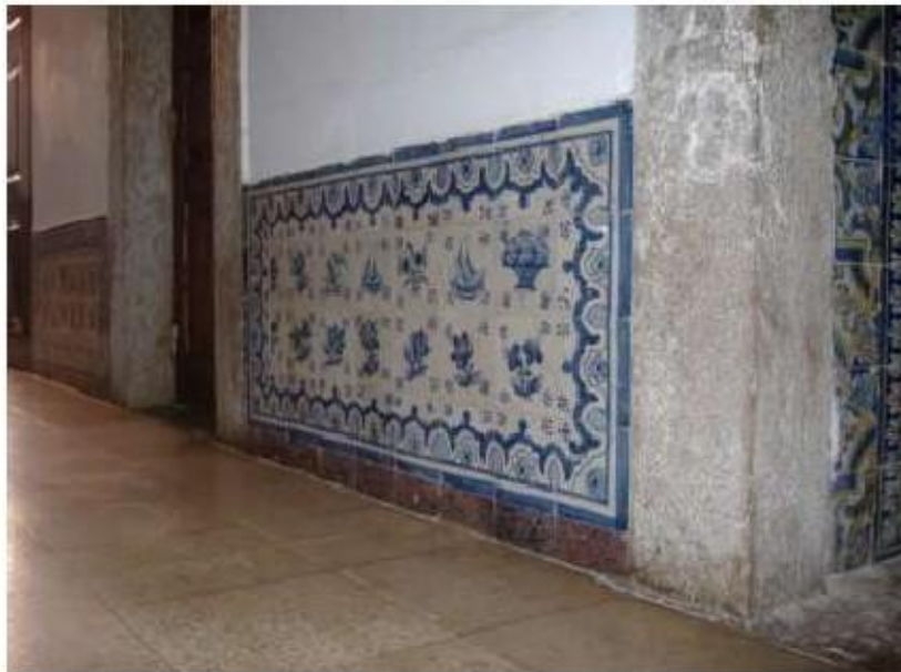
Fig.325 Painel de azulejos, piso térreo do complexo conventual Convento de Santa Teresa de Jesus de Carnide, Lisboa, FA