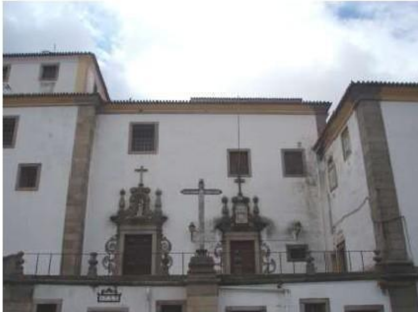
Fig.407 Convento de São José, Évora Fachada principal FA