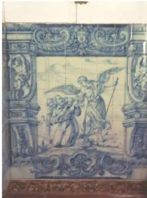
Fig.47 Ermida de Santa Teresa, Caldas de Monchique Parede da frente, lado do evangelho FA