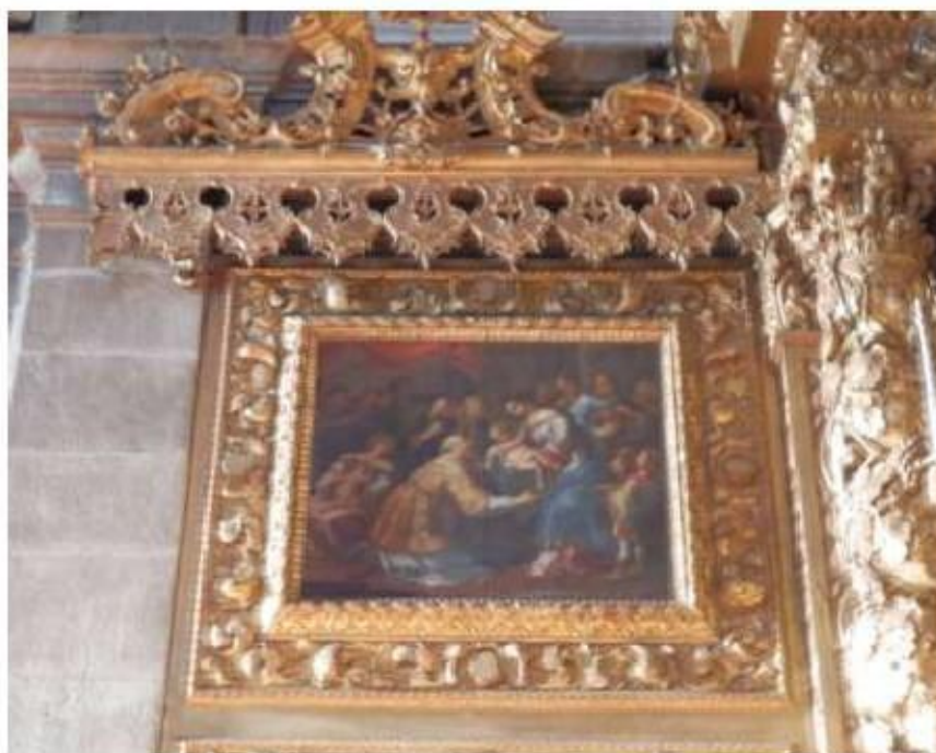
Fig.92 Capela-mor, pintura Convento de Nossa Senhora do Carmo de Viana do Castelo FA