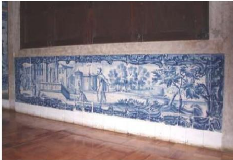
Fig.282 Sala do Capítulo Painel de azulejos do século XVIII Convento de Santa Teresa de Jesus, Carnide, Lisboa, FA