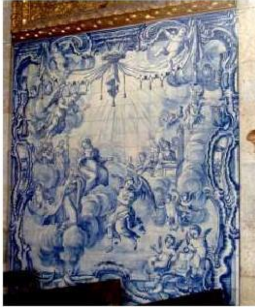
Fig.241 Santa Teresa de Jesus a contemplar a glória dos santos Nave da igreja, lado do evangelho Painel de azulejos do século XVIII Convento de Santa Teresa de Jesus de Carnide, Lisboa FA