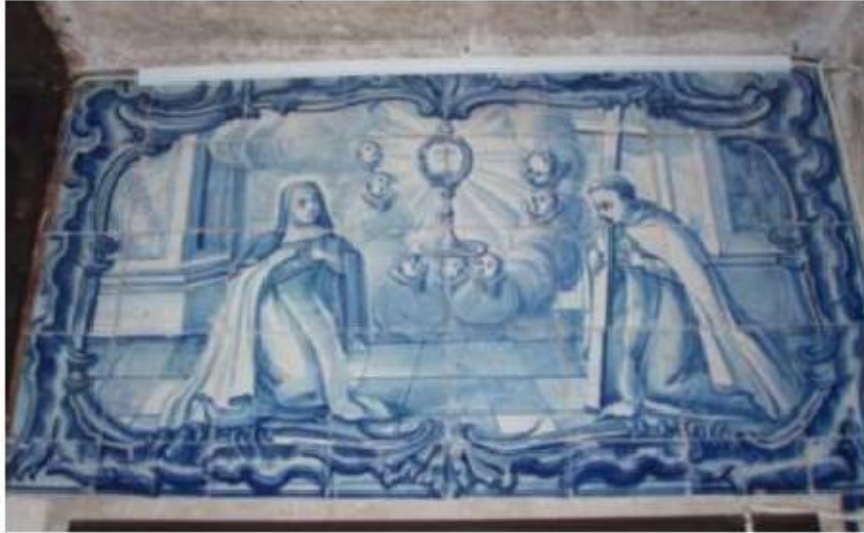
Fig.315 Santa Teresa e São João da Cruz Painel de azulejos do século XVIII Convento de Santa Teresa de Jesus de Carnide, Lisboa FA