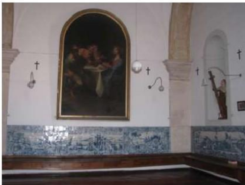
Fig.155 Convento de Santa Teresa de Jesus - Coimbra Azulejos Coro alto