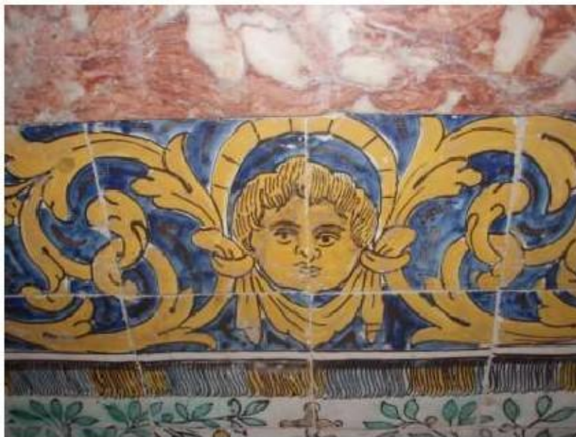
Fig.260 Transepto da igreja, mesa de altar com azulejos, lado do evangelho Convento de Santa Teresa de Jesus, Carnide, Lisboa, FA