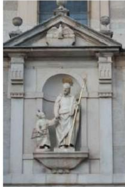
Figs. 13 e 14 Mosteiro de São José, Ávila Fachada principal e pormenor de São José com o Menino Jesus FA