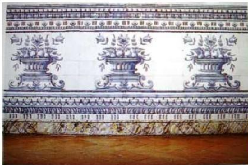
Fig. 399 Silhar de albarradas Átlio do claustro Convento dos Cardaes, Lisboa