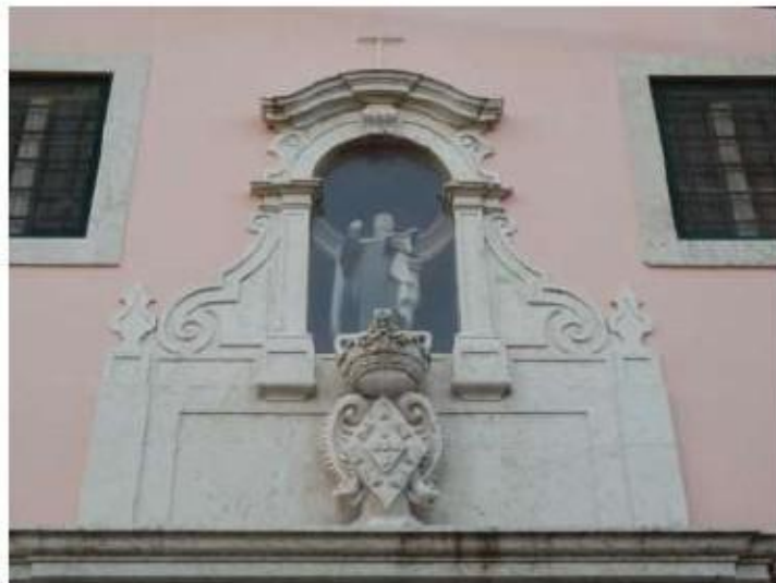
Fig.224 Convento de Santa Teresa de Jesus de Carnide, Lisboa Fachada da Igreja FA