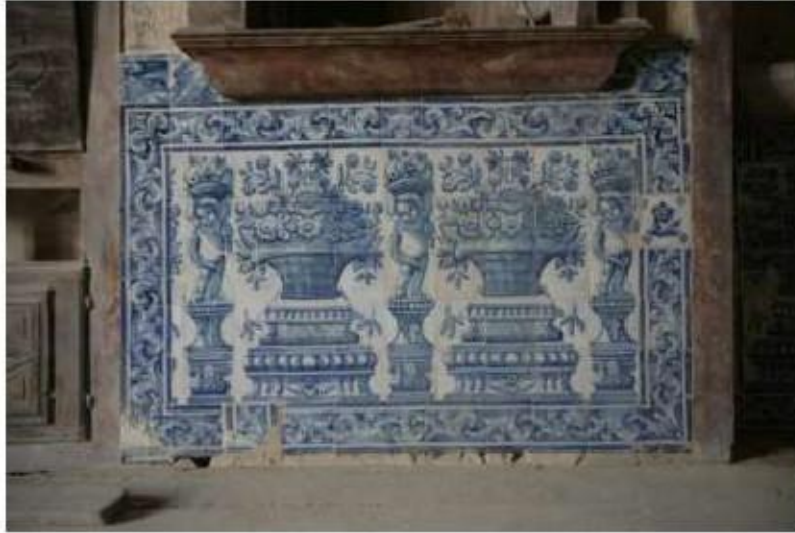
Fig. 446 Azulejaria na antiga sacristia conventual Convento de Nossa Senhora da Conceição, Lagos