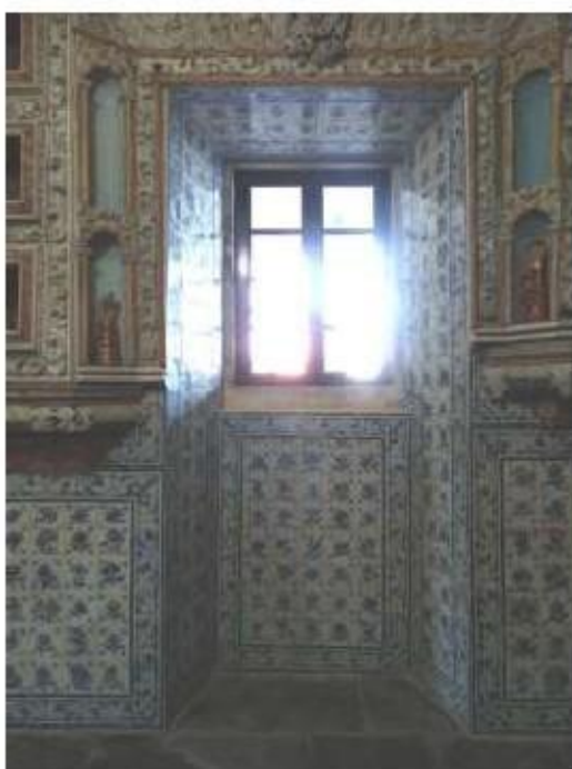
Fig.106 Azulejos da sacristia Convento de Nossa Senhora do Carmo de Viana do Castelo FA