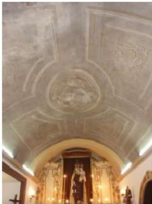
Fig.76 Igreja da Ordem Terceira de Nossa Senhora do Carmo de Setúbal Vista geral do interior FA