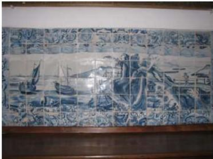
Fig.167 Convento de Santa Teresa de Jesus Azulejos Coro alto