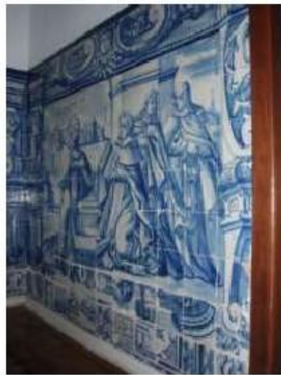
Fig.295 Dependência conventual Painel de azulejos do século XVIII Convento de Santa Teresa de Jesus, Carnide, Lisboa FA