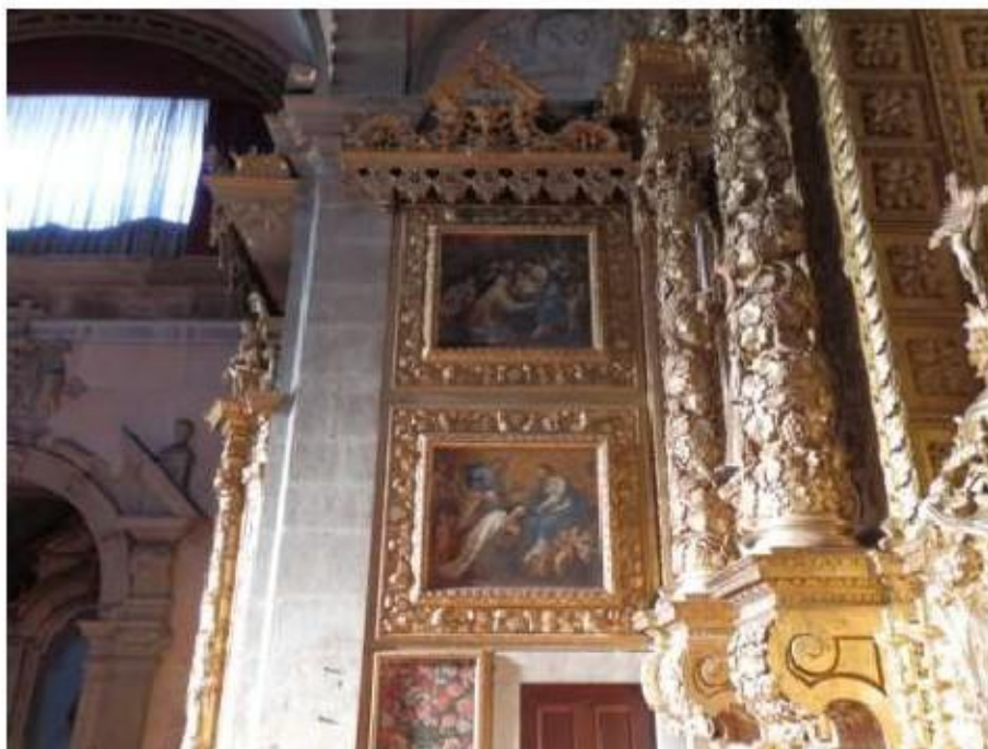
Fig.91 Capela-mor Convento de Nossa Senhora do Carmo de Viana do Castelo FA