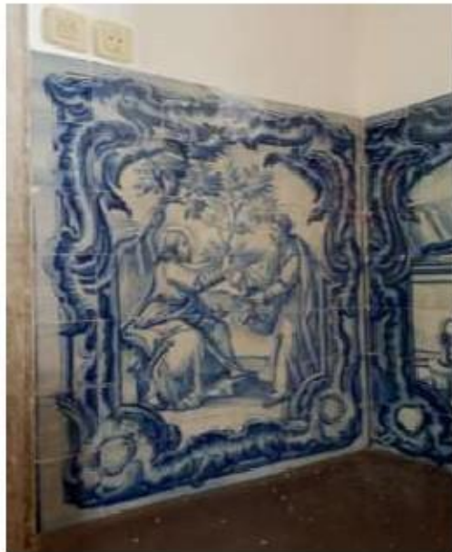
Fig.304 Encontro de Jesus com Nicodemos Coro alto Convento de Santa Teresa de Jesus de Carnide, Lisboa