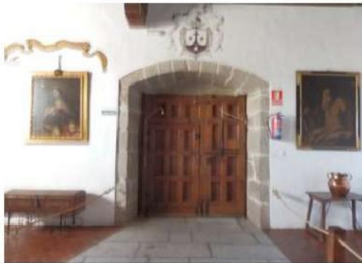
Fig.10 Mosteiro da Encarnação, Ávila Sala I FA