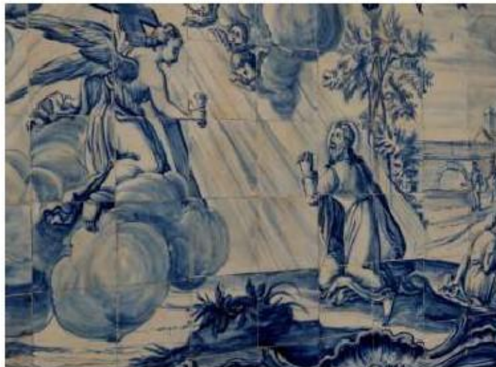
Fig.312 Agonia de Jesus Coro alto Painel de azulejos do século XVIII Convento de Santa Teresa de Jesus de Carnide, Lisboa FA