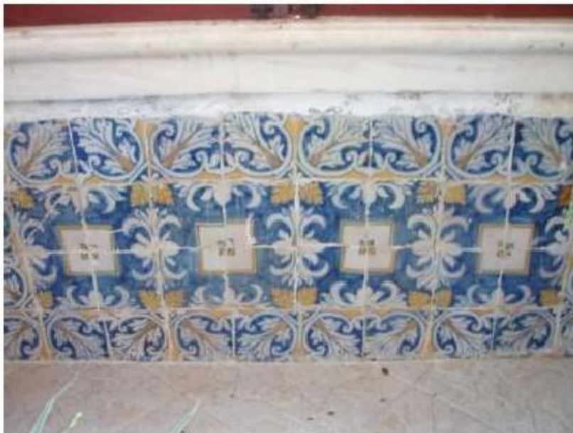
Fig.61 Convento de Nossa Senhora das Relíquias, Vidigueira Azulejos de Padrão FA