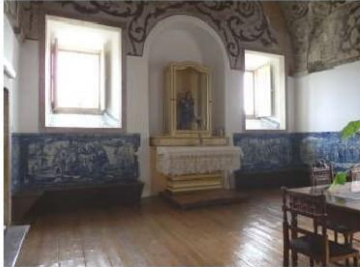
Fig.303 Vista geral Coro alto Convento de Santa Teresa de Jesus de Carnide, Lisboa