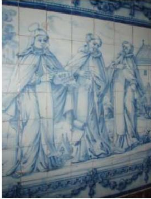
Fig.42 Ermida de Santa Teresa, Caldas de Monchique Parede lado do evangelho FA