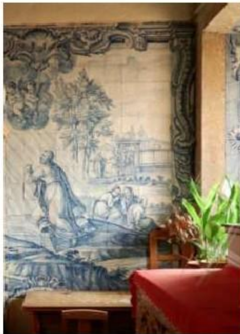
Fig.272 A Agonia de Jesus Painel de azulejos do século XVIII Convento de Santa Teresa de Jesus de Carnide, Lisboa FA