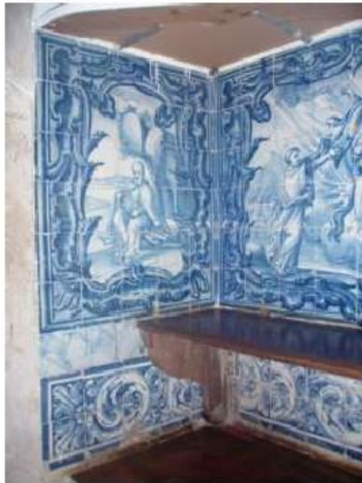
Fig.286 Santo Elias Sala do Capítulo Painel de azulejos do século XVIII Convento de Santa Teresa de Jesus, Carnide, Lisboa FA