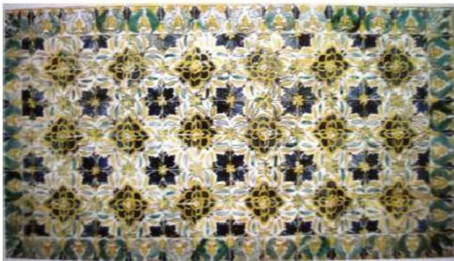
Fig.403 Azulejos de padrão do terceiro quartel do século XVII Convento dos Cardaes, Lisboa