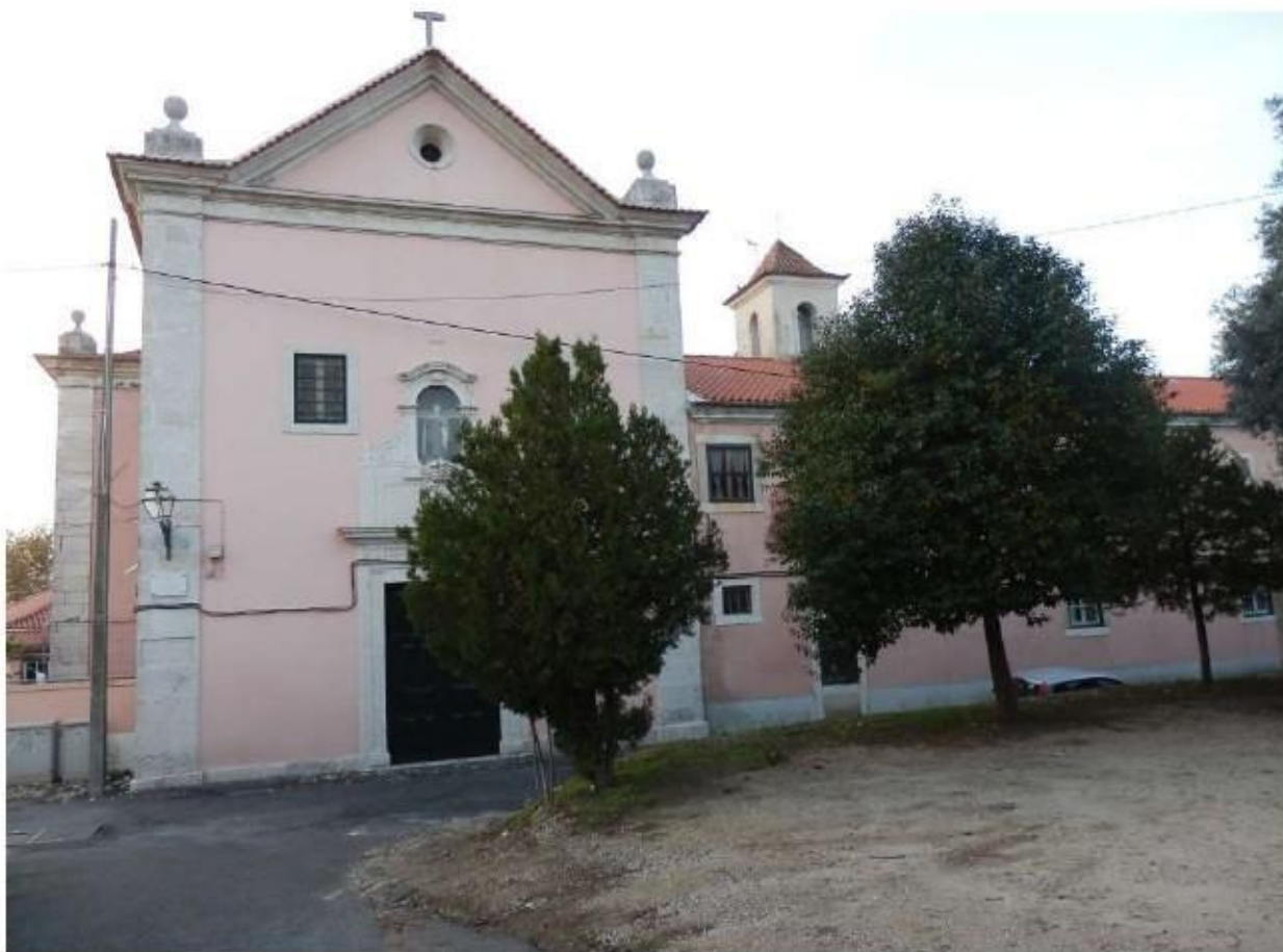
Fig.222 Fachada principal Convento de Santa Teresa de Jesus de Carnide, Lisboa FA