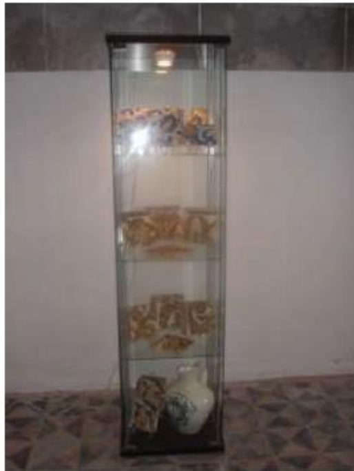
Fig.65 Convento de Nossa Senhora das Relíquias, Vidigueira Expositor com azulejos FA