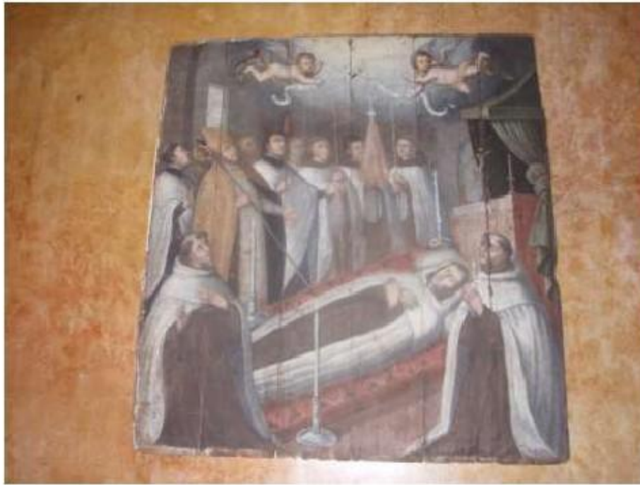
Fig.70 Convento de Nossa Senhora das Relíquias, Vidigueira Pintura FA