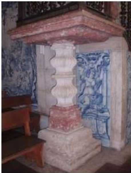
Fig.240 Painel de azulejos do século XVIII Nave da igreja, lado do evangelho Convento de Santa Teresa de Jesus de Carnide, Lisboa FA