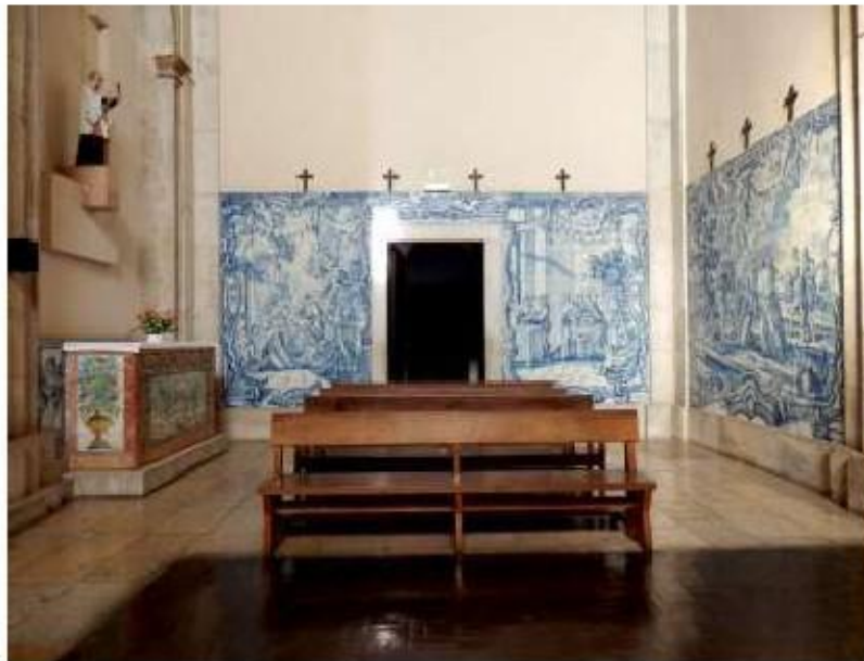
Fig.250 Azulejos do transepto, lado da epístola Convento de Santa Teresa de Jesus de Carnide, Lisboa FA