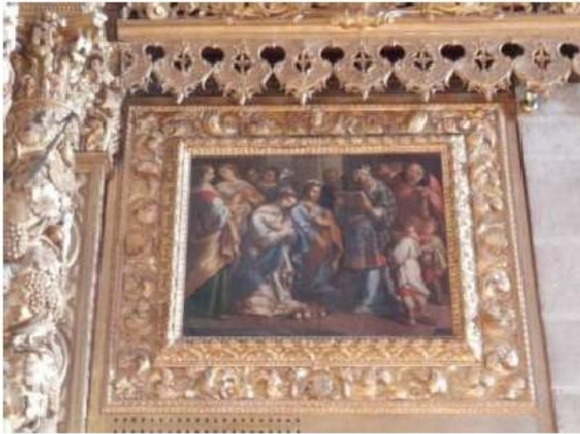
Fig.95 Pintura, Capela-mor, lado da epístola Convento de Nossa Senhora do Carmo de Viana do Castelo FA