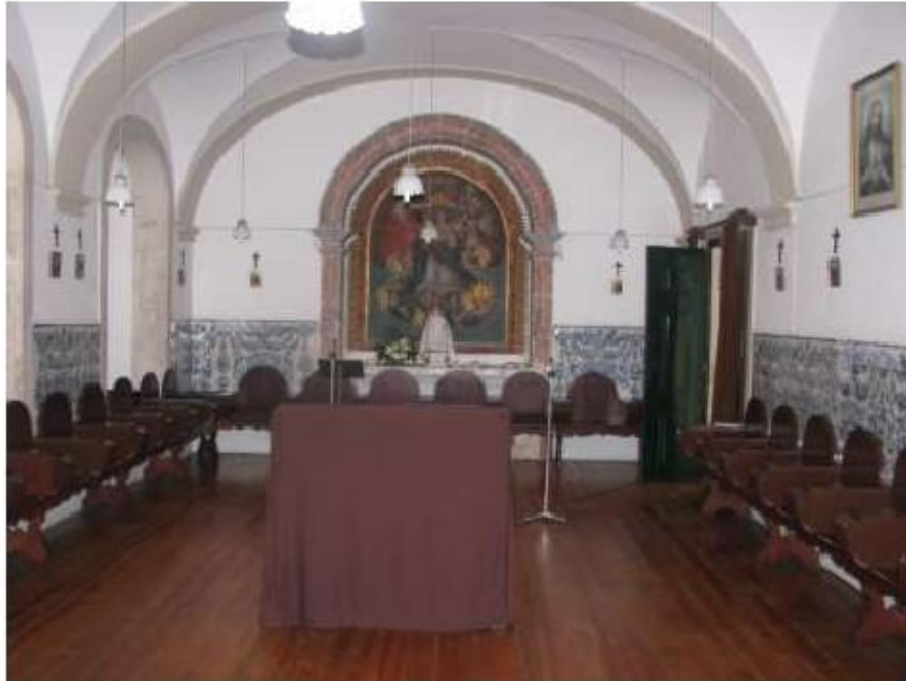
Fig.150 Convento de Santa Teresa de Jesus - Coimbra Azulejos Coro baixo

-Convento de Santa Teresa de Jesus -Coimbra