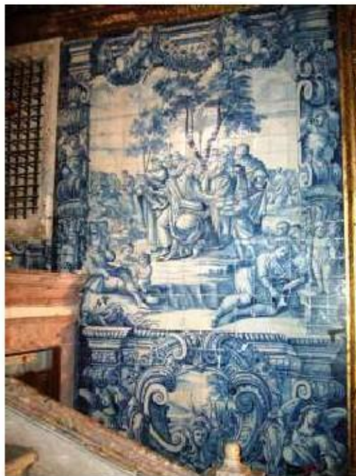
Fig.211 Multiplicação dos Pães Capela-mor, lado da epístola Convento de Santo Alberto, Lisboa