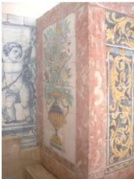
Fig.263 Transepto da igreja, mesa de altar com azulejos, lado do evangelho Convento de Santa Teresa de Jesus, Carnide, Lisboa, FA