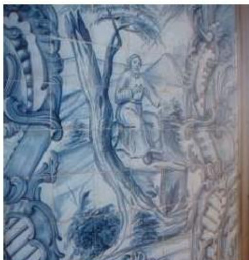
Fig. 35 Azulejos da sacristia Igreja da Ordem Terceira do Carmo de Viseu FA