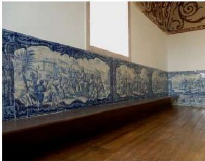
Fig.302 Coro alto, vista geral Painel de azulejos do século XVIII Convento de Santa Teresa de Jesus de Carnide, Lisboa FA