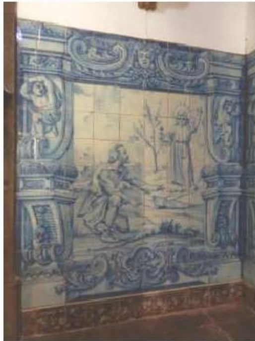
Fig.51 Ermida de Santa Teresa, Caldas de Monchique Parede de frente, lado da epístola FA