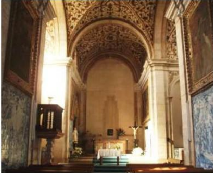
Fig.231 Vista geral da igreja Convento de Santa Teresa de Jesus de Carnide, Lisboa FA