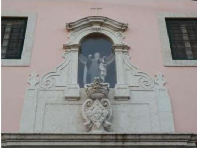
Fig.227 Fachada da igreja Convento de Santa Teresa de Jesus de Carnide, Lisboa FA