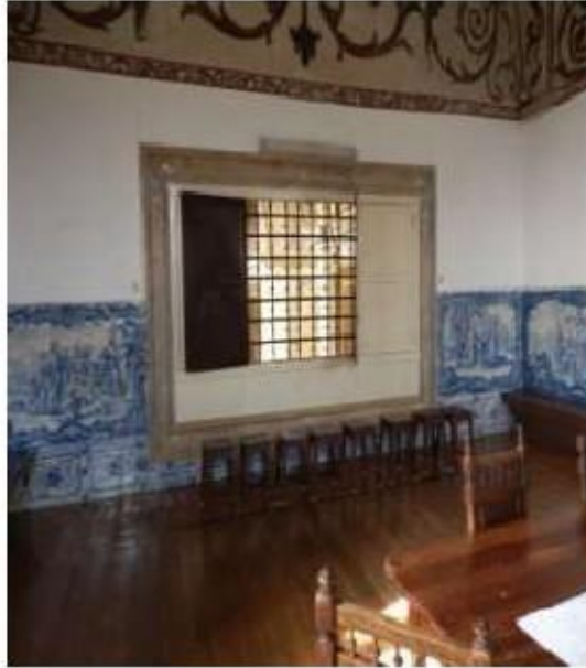
Fig.307 Coro alto Painel de azulejos do século XVIII Convento de Santa Teresa de Jesus de Carnide, Lisboa FA