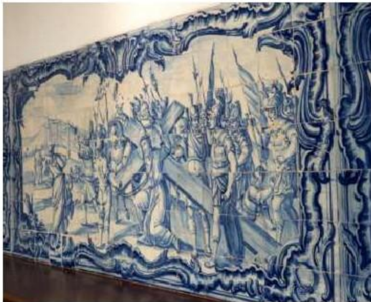
Fig.310 Subida de Jesus Cristo para Jerusalém Coro alto Painel de azulejos do século XVIII Convento de Santa Teresa de Jesus de Carnide, Lisboa FA