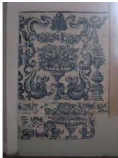
Fig.151 Convento de Santa Teresa de Jesus - Coimbra Azulejos Coro baixo