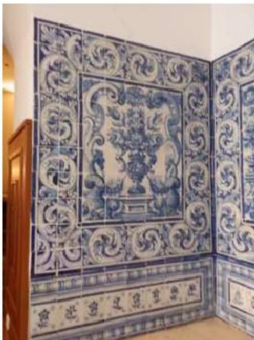
Fig.108 Capela de São Miguel Arcanjo Convento de Nossa Senhora do Carmo de Viana do Castelo FA