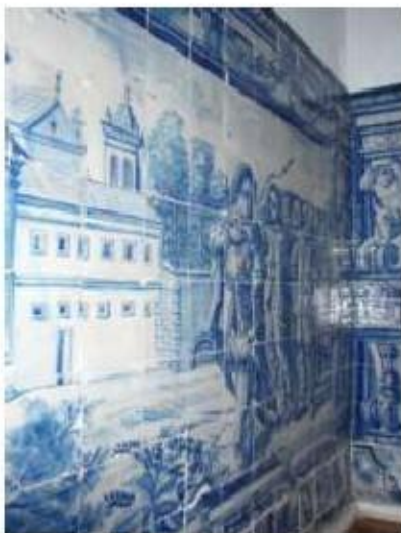
Fig.292 Dependência conventual Painel de azulejos do século XVIII Convento de Santa Teresa de Jesus, Carnide, Lisboa FA