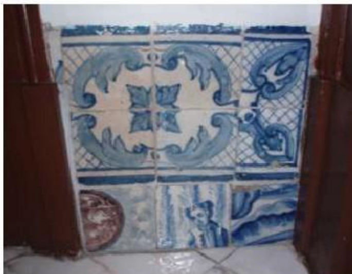
Fig.18 Igreja da Ordem Terceira de Nossa Senhora do Carmo de Lisboa Painel de azulejos FA