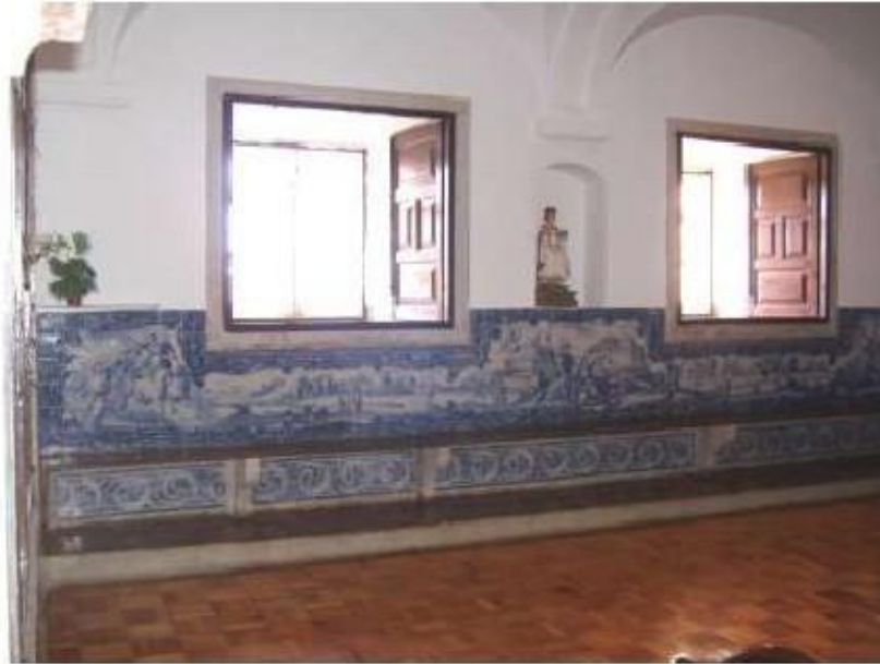
Fig.283 Sala do Capítulo Painel de azulejos do século XVIII Convento de Santa Teresa de Jesus, Carnide, Lisboa, FA