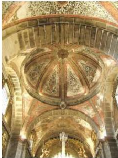
Fig.411 Convento de São José de Évora Abóbada do templo conventual FA