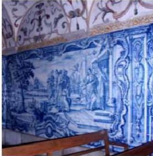
Fig.243 A entrada de Santa Teresa de Jesus no Mosteiro da Encarnação de Ávila, Nave da igreja, lado do evangelho Painel de azulejos do século XVIII Convento de Santa Teresa de Carnide, Lisboa FA