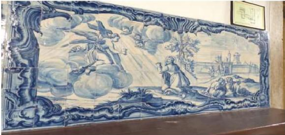
Fig.311 Agonia de Jesus Cristo Coro alto Painel de azulejos do século XVIII Convento de Santa Teresa de Jesus de Carnide, Lisboa FA