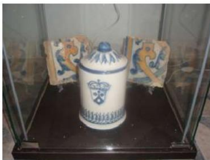
Fig.63 Convento de Nossa Senhora das Relíquias, Vidigueira Azulejos de Padrão FA