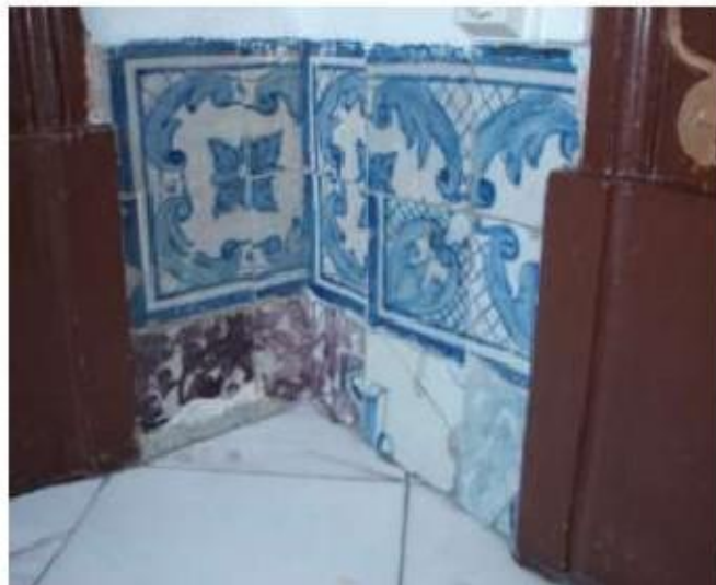
Fig.21 Igreja da Ordem Terceira de Nossa Senhora do Carmo de Lisboa Painel de azulejos FA