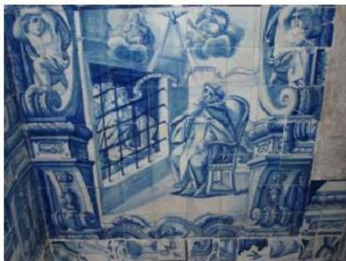
Fig.293 Dependência conventual Painel de azulejos do século XVIII Convento de Santa Teresa de Jesus, Carnide, Lisboa FA