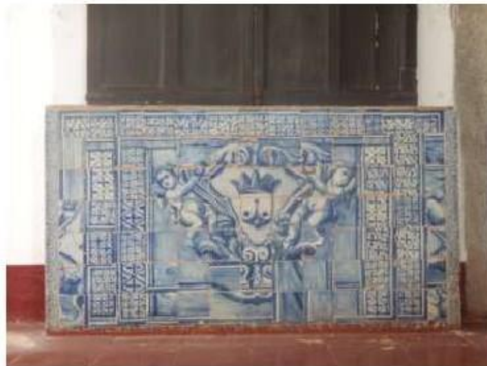
Fig. 437 Frontal de altar Claustro Convento de São José, Évora FA