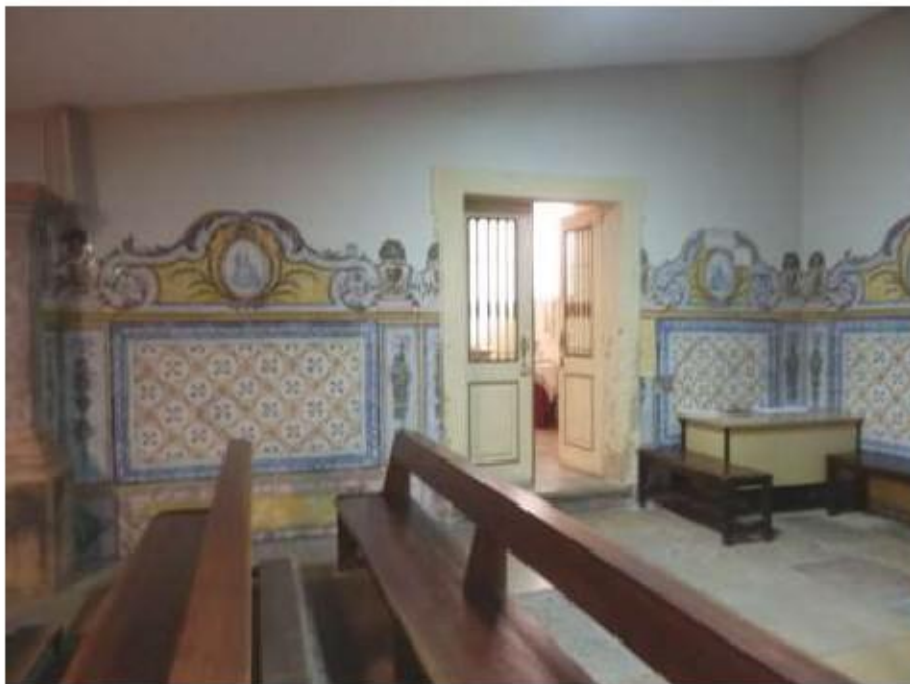
Fig.117 Azulejos da nave da igreja, lado da epístola Convento de Santa Teresa de Jesus de Setúbal FA