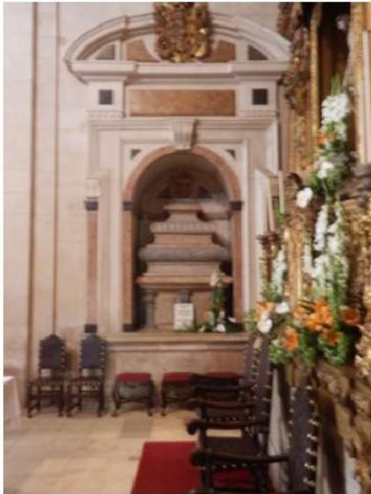
Fig.82 Convento de Nossa Senhora do Carmo, Aveiro Capela-mor, lado do evangelho FA