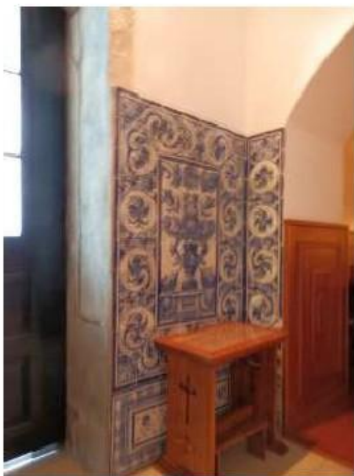
Fig.107 Capela de São Miguel Arcanjo Convento de Nossa Senhora do Carmo de Viana do Castelo FA