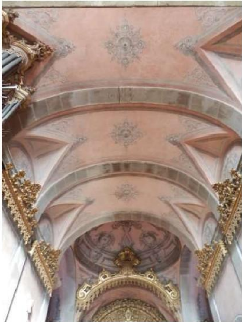
Fig.86 Tecto da nave e capela-mor Convento de Nossa Senhora do Carmo de Viana do Castelo FA