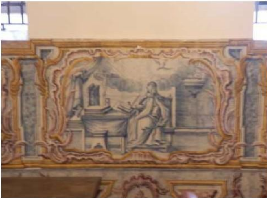
Fig.202 Convento do Santíssimo Coração de Jesus – Basílica da Estrela, Lisboa Sala de Santa Teresa Painel de Azulejos, lado da epístola FA