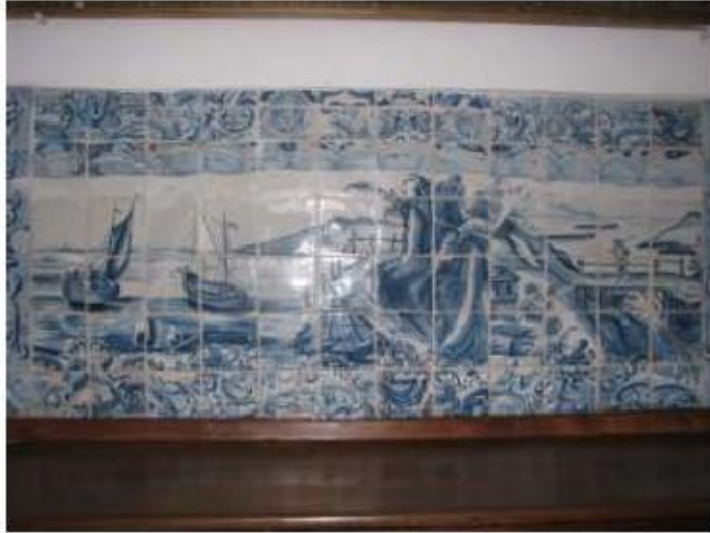
Fig.166 Convento de Santa Teresa de Jesus - Coimbra Azulejos Coro alto