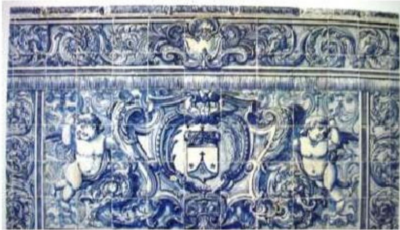
Fig.398 Frontal de altar do claustro Convento dos Cardaes, Lisboa