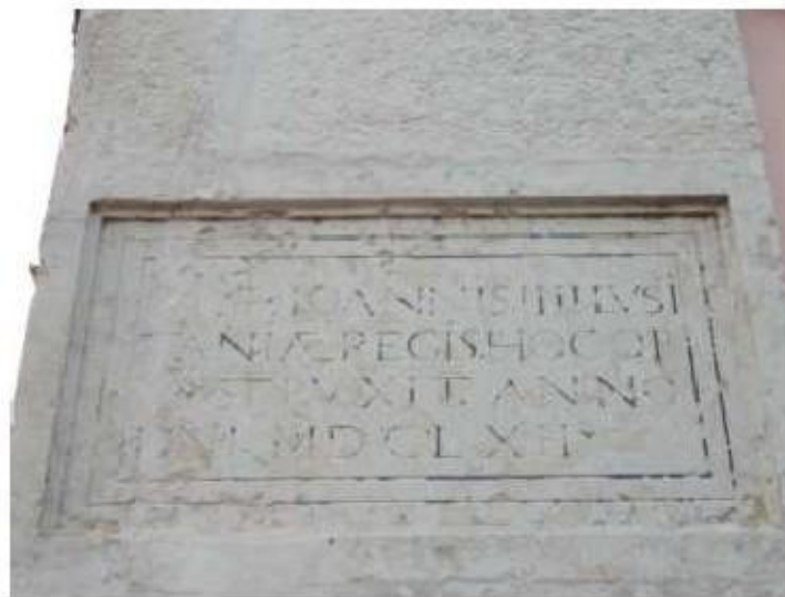
Fig.226 Fachada da igreja Convento de Santa Teresa de Jesus de Carnide, Lisboa FA