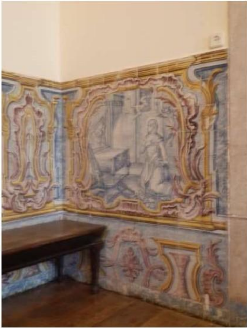
Fig.197 Convento do Santíssimo Coração de Jesus – Basilica da Estrela, Lisboa Sala de Santa Teresa Painel de Azulejos, lado do evangelho FA