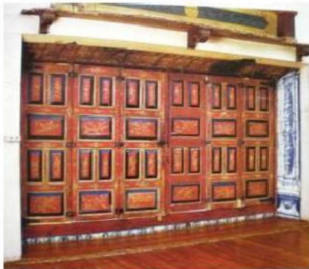
Fig.365 Decoração de chinoserie nas portas do coro alto Convento dos Cardaes de Lisboa