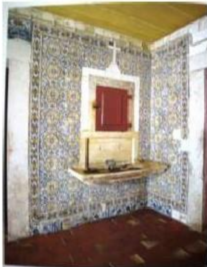
Fig.402 Azulejos de padrão da primeira metade do século XVII Convento dos Cardaes, Lisboa