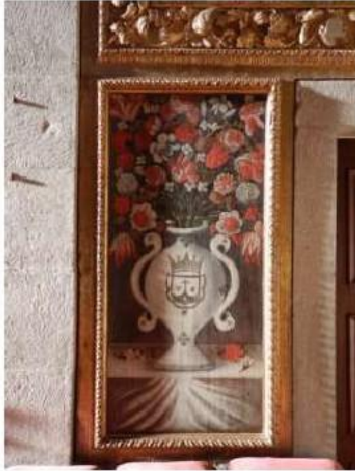
Fig.93 Pintura, Capela-mor, lado do evangelho Convento de Nossa Senhora do Carmo de Viana do Castelo FA