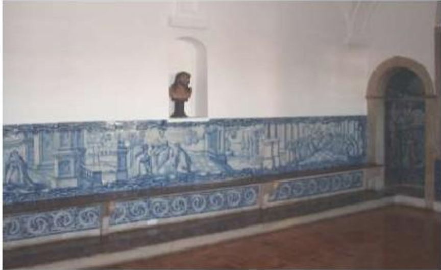
Fig.277 Sala do Capítulo Painel de azulejos do século XVIII Convento de Santa Teresa de Jesus de Carnide, Lisboa FA