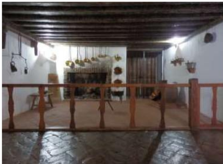
Fig.12 Mosteiro da Encarnação, Ávila Sala II, cozinha FA