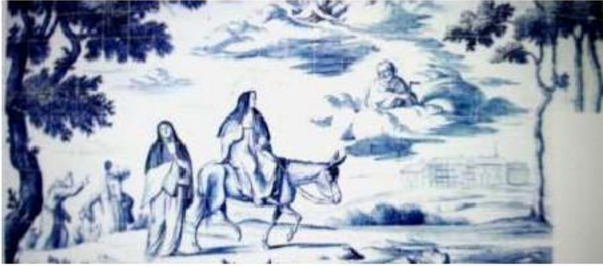
Fig.341 Viagem de Santa Teresa a Salamanca Convento dos Cardaes, Lisboa