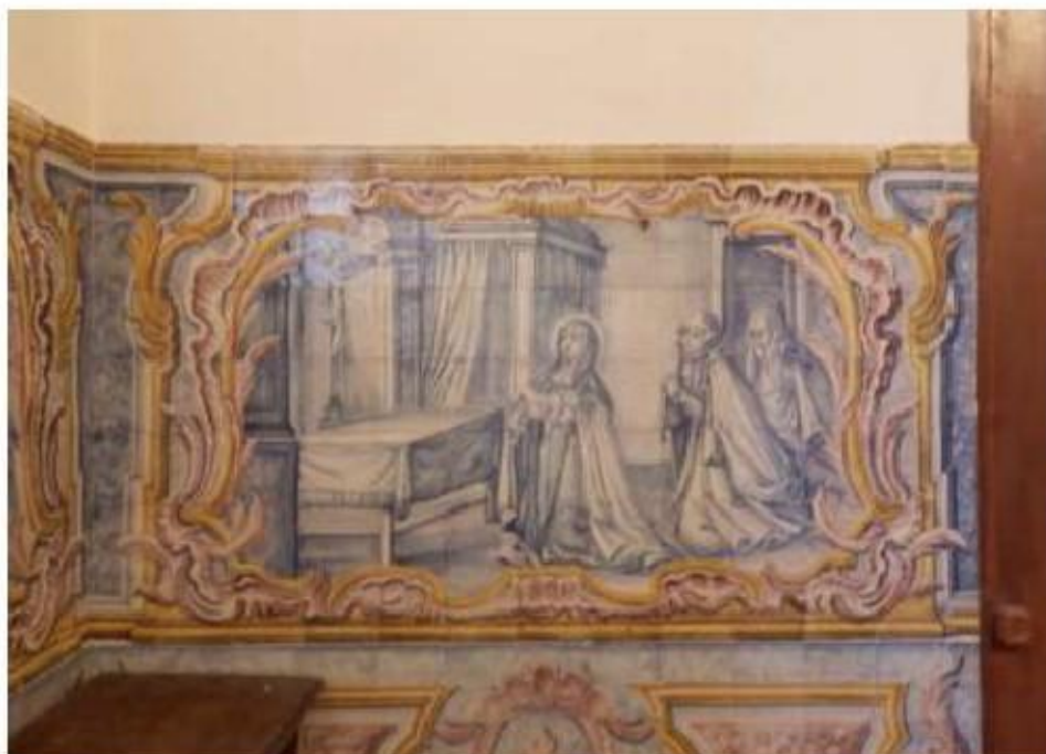
Fig.205 Convento do Santíssimo Coração de Jesus – Basilica da Estrela, Lisboa Sala de Santa Teresa Painel de Azulejos, parede fundeira, lado da epístola FA