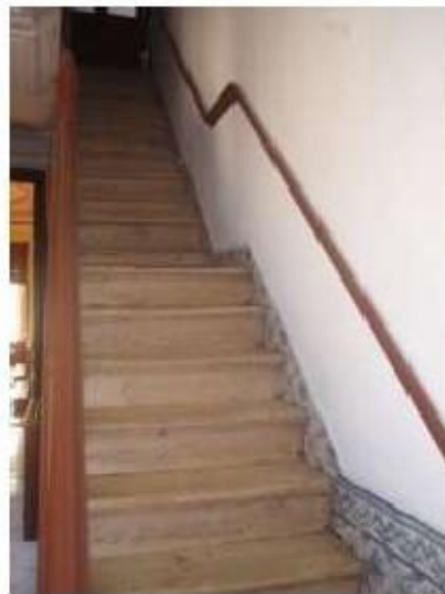
Fig.25 Igreja da Ordem Terceira de Nossa Senhora do Carmo de Lisboa Painel de azulejos FA