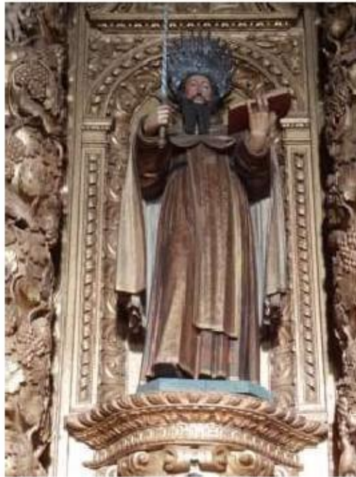
Fig.89 Santo Elias, retábulo da capela-mor Convento de Nossa Senhora do Carmo de Viana do Castelo FA