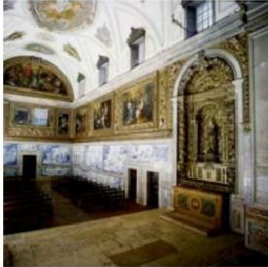
Fig. 339 Vista geral da igreja Lado do evangelho Convento dos Cardaes, Lisboa