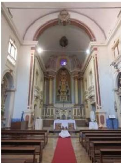
Fig.114 Convento de Santa Teresa de Jesus de Setúbal Vista geral da igreja FA