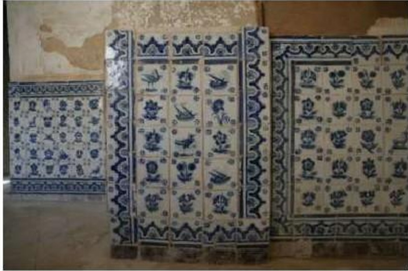
Fig. 448 Azulejaria no antigo corredor conventual Convento de Nossa Senhora da Conceição, Lagos