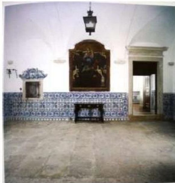
Fig.397 Azulejos da portaria Vista geral Convento dos Cardaes, Lisboa