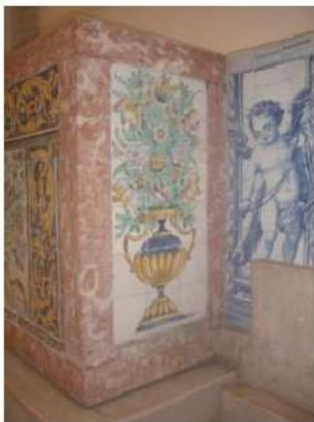
Fig.264 Transepto da igreja, mesa de altar com azulejos, lado do evangelho Convento de Santa Teresa de Jesus, Carnide, Lisboa, FA