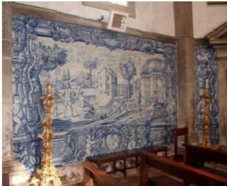
Fig. 29 Azulejos da capela-mor Igreja da Ordem Terceira do Carmo de Viseu FA