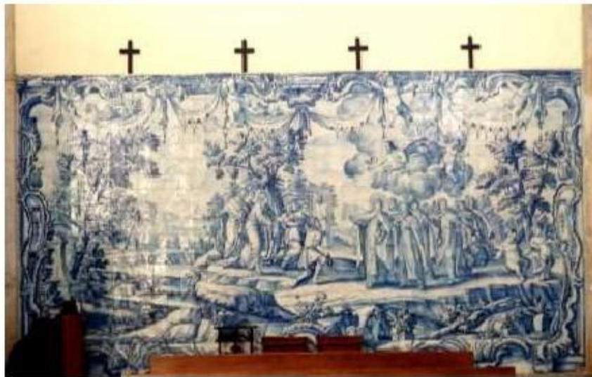
Figs.238 Transepto da igreja, lado do evangelho Painel de azulejos do século XVIII Convento de Santa Teresa de Jesus de Carnide, Lisboa FA