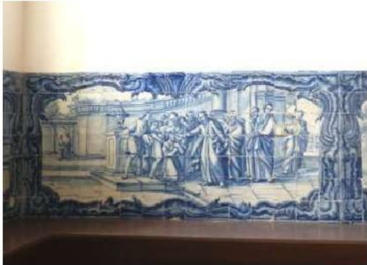
Fig.301 Cura do cego Coro alto Painel de azulejos do século XVIII Convento de Santa Teresa de Jesus de Carnide, Lisboa FA