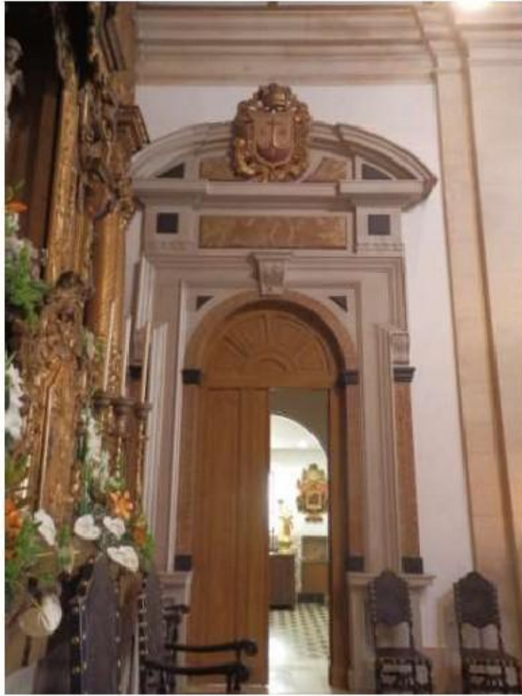
Fig.83 Convento de Nossa Senhora do Carmo, Aveiro Capela-mor, lado da epístola FA