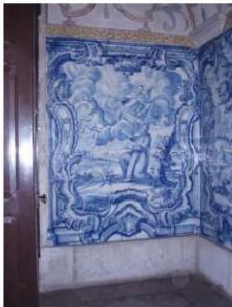
Fig.244 Arrebatamento de Santo Elias ao céu num carro de fogo Nave da igreja, parede fundeira Painel de azulejos do século XVIII Convento de Santa Teresa de Carnide, Lisboa FA