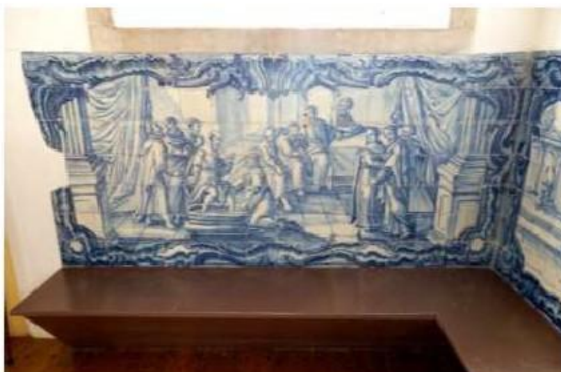
Fig.306 Lava-Pés Coro alto Painel de azulejos do século XVIII Convento de Santa Teresa de Jesus de Carnide, Lisboa FA