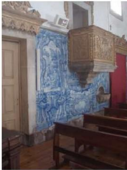
Fig. 33 Azulejos da nave da Igreja, lado da epístola Igreja da Ordem Terceira do Carmo de Viseu FA