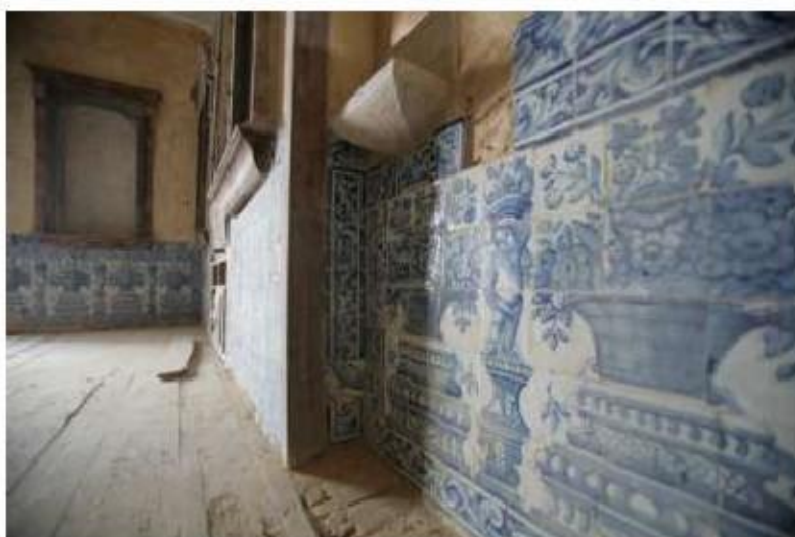
Fig. 443 Azulejaria na antiga sacristia conventual Convento de Nossa Senhora da Conceição, Lagos