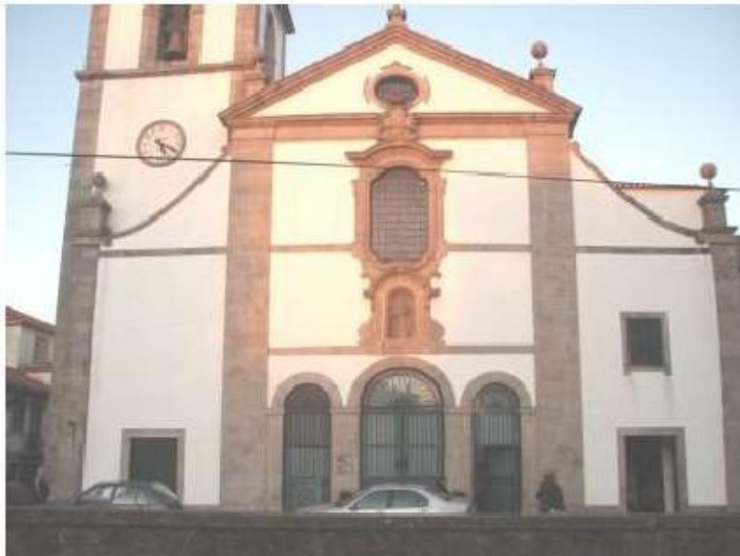
Fig.85 Convento de Nossa Senhora do Carmo, Viana do Castelo Fachada principal FA