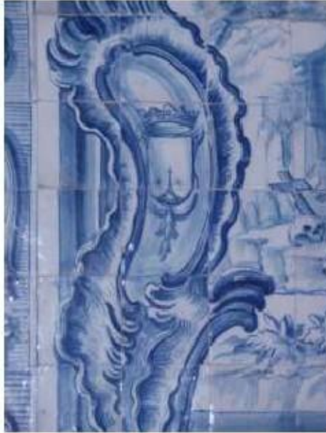
Fig. 269 Painel de azulejos do século XVIII, lado da epístola Convento de Santa Teresa de Jesus de Carnide, Lisboa FA