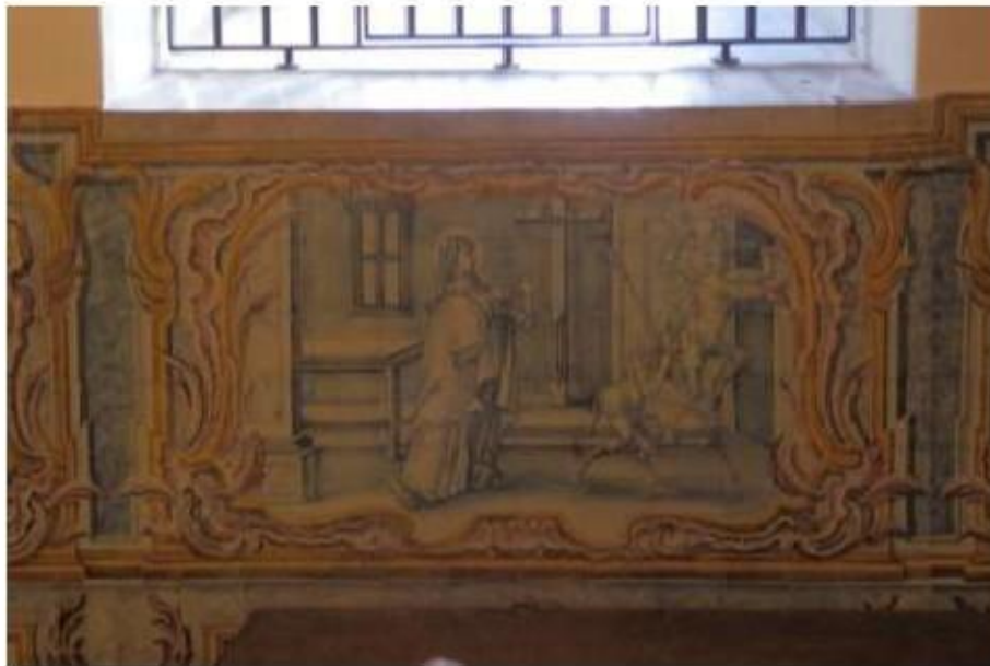
Fig.203 Convento do Santíssimo Coração de Jesus – Basílica da Estrela, Lisboa Sala de Santa Teresa Painel de Azulejos, lado da epístola FA