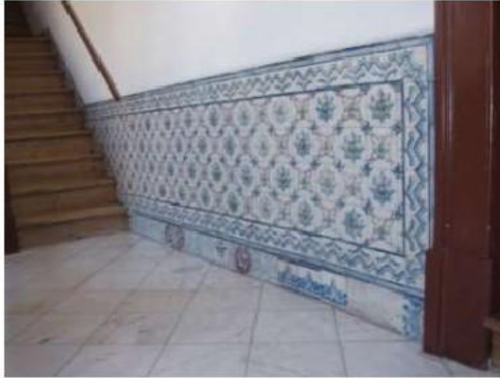
Fig.24 Igreja da Ordem Terceira de Nossa Senhora do Carmo de Lisboa Painel de azulejos FA