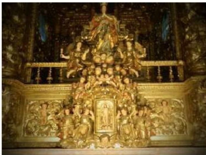
Fig. 337 Sacrário do retábulo-mor Convento dos Cardaes, Lisboa FA