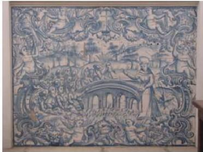
Fig.190 Convento de Santa Teresa de Jesus – Coimbra Azulejos com Santo António