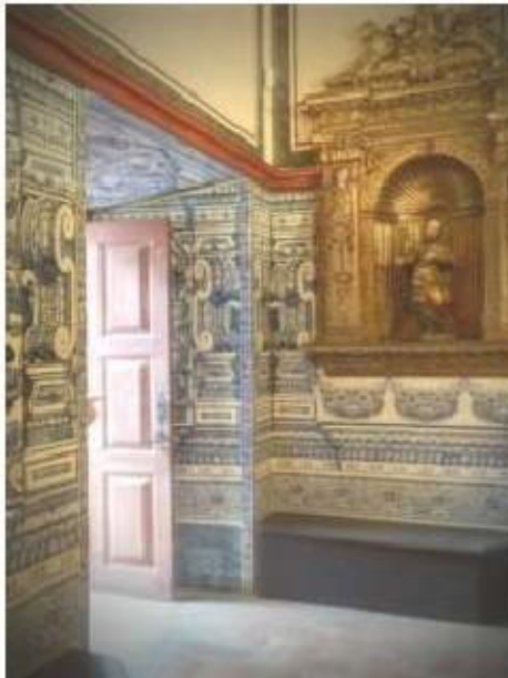
Fig.393 Vista geral do coro baixo Convento dos Cardaes, Lisboa FA