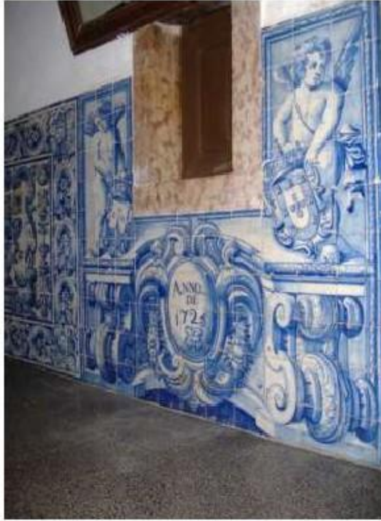
Fig. 317 Sacristia conventual Painel de azulejos com a data de 1725 Convento de Santa Teresa de Jesus de Carnide, Lisboa FA