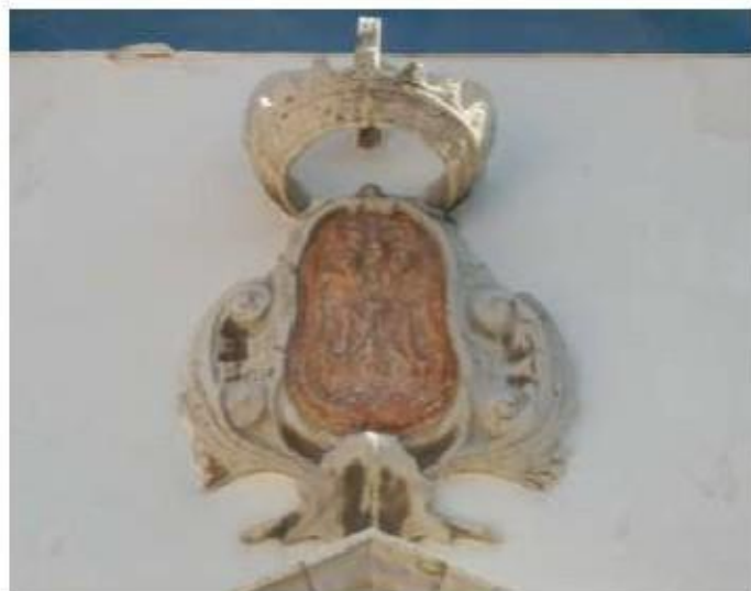
Fig.113 Convento de Santa Teresa de Jesus de Setúbal Pormenor do portal FA