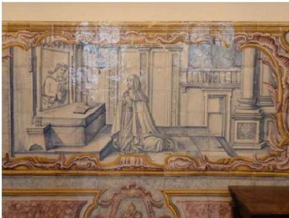
Fig.196 Convento do Santíssimo Coração de Jesus – Basilica da Estrela, Lisboa Sala de Santa Teresa Painel de Azulejos FA