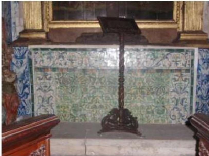
Fig.217 Capela do Santo Cristo da Fala Frontal de altar, final do século XVI Convento de Santo Alberto, Lisboa FA