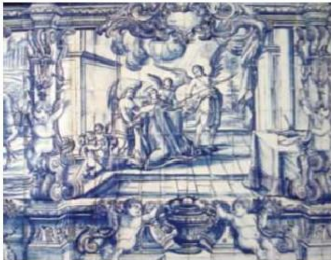
Fig.374 Transverberação de Santa Teresa de Jesus Coro alto Convento dos Cardaes, Lisboa