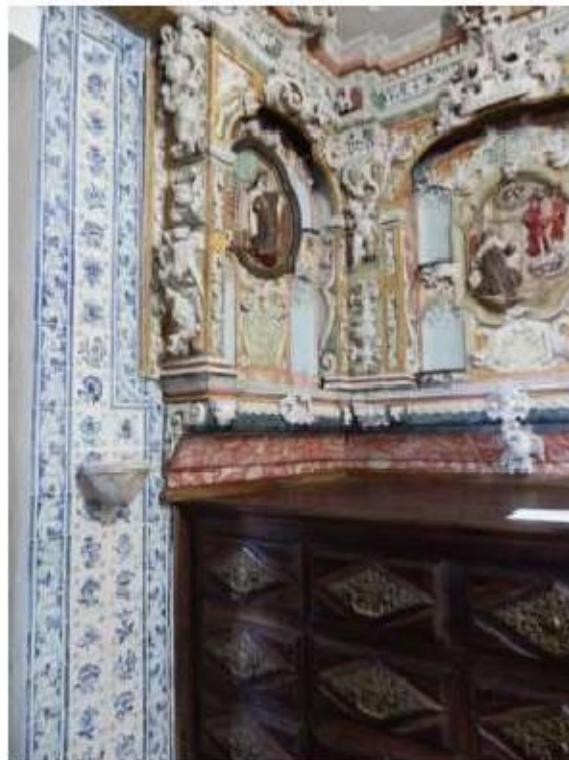
Fig.98 Azulejos da sacristia Convento de Nossa Senhora do Carmo de Viana do Castelo FA