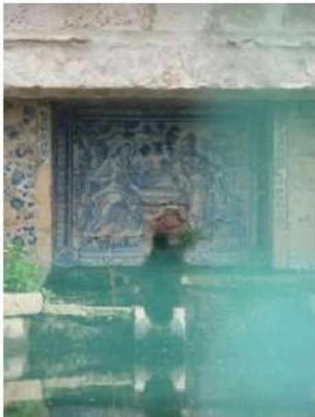
Fig. 330 Jesus Cristo com a Samaritana Jardim Painel de azulejos do século XVIII Convento de Santa Teresa de Jesus de Carnide, Lisboa