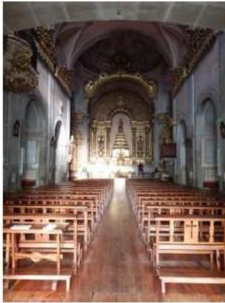
Fig.88 Convento de Nossa Senhora do Carmo, Viana do Castelo Vista geral do interior da igreja FA