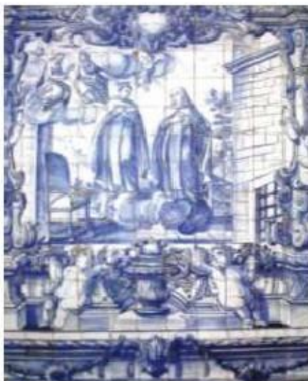
Fig.371 Encontro de Santa Teresa de Jesus e São João da Cruz Coro alto Convento dos Cardaes, Lisboa