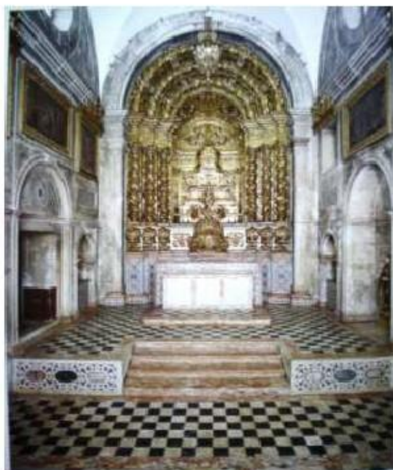
Fig. 336 Vista geral da capela-mor Convento dos Cardaes, Lisboa