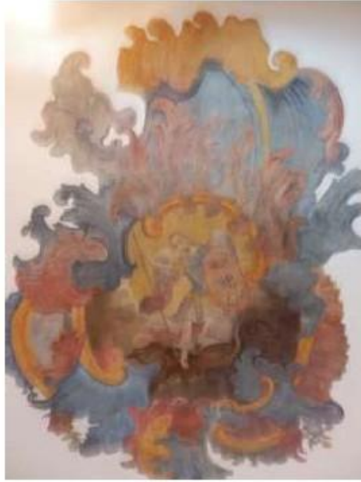
Fig.112 Capela de São Miguel Arcanjo Convento de Nossa Senhora do Carmo de Viana do Castelo FA