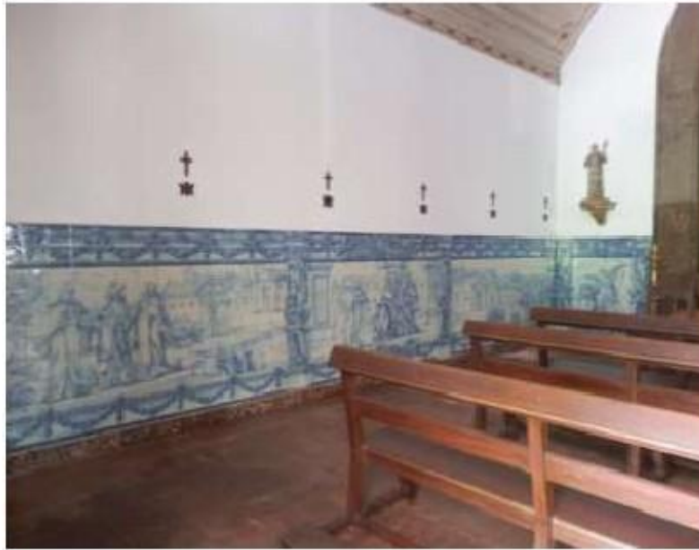
Fig.40 Ermida de Santa Teresa, Caldas de Monchique Parede do lado do evangelho FA