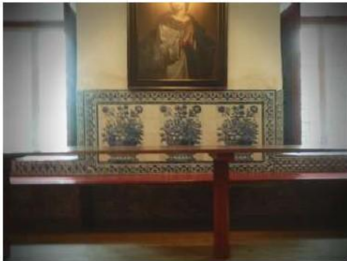
Fig.391 Vista geral dos azulejos do antigo refeitório conventual Convento dos Cardaes, Lisboa FA