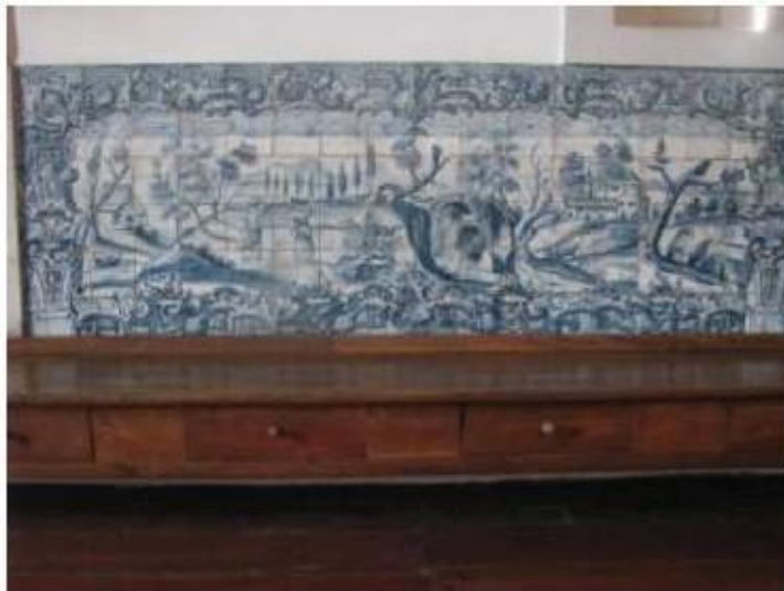
Fig.175 Convento de Santa Teresa de Jesus - Coimbra Azulejos Coro alto