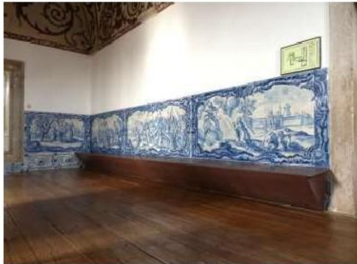
Fig.308 Coro alto Painel de azulejos do século XVIII Convento de Santa Teresa de Jesus de Carnide, Lisboa FA