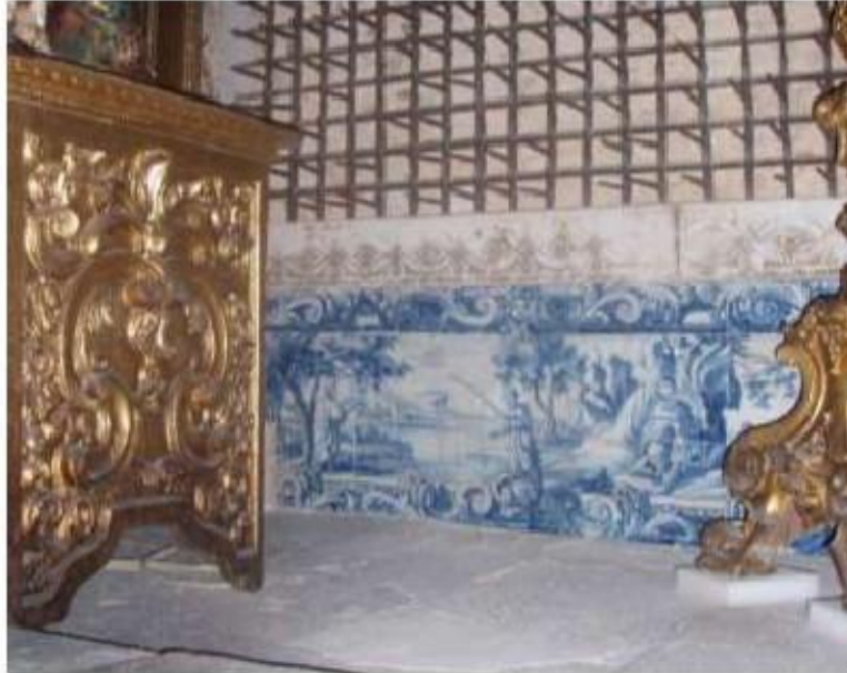
Fig.212 Azulejos da Capela-mor, lado da epístola Convento de Santo Alberto, Lisboa FA