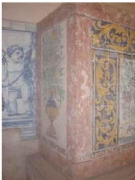
Fig.262 Transepto da igreja, mesa de altar com azulejos, lado do evangelho Convento de Santa Teresa de Jesus, Carnide, Lisboa, FA