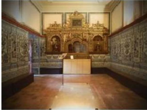
Fig.392 Vista geral do coro baixo Convento dos Cardaes, Lisboa FA