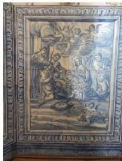
Fig.424 O Nascimento de Jesus em Belém Painel de azulejos do século XVIII Sala do 1.º piso Convento de São José, Évora FA