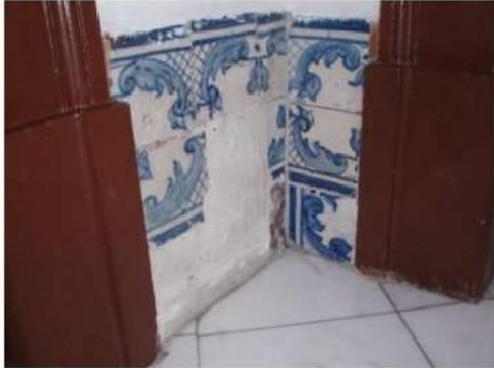
Fig.20 Igreja da Ordem Terceira de Nossa Senhora do Carmo de Lisboa Painel de azulejos FA