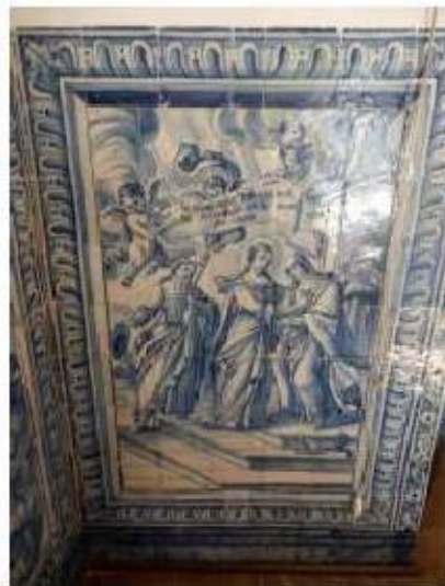
Fig.422 A Partida de Nossa Senhora da sua casa paterna Painel de azulejos do século XVIII Sala do 1.º piso Convento de São José, Évora FA