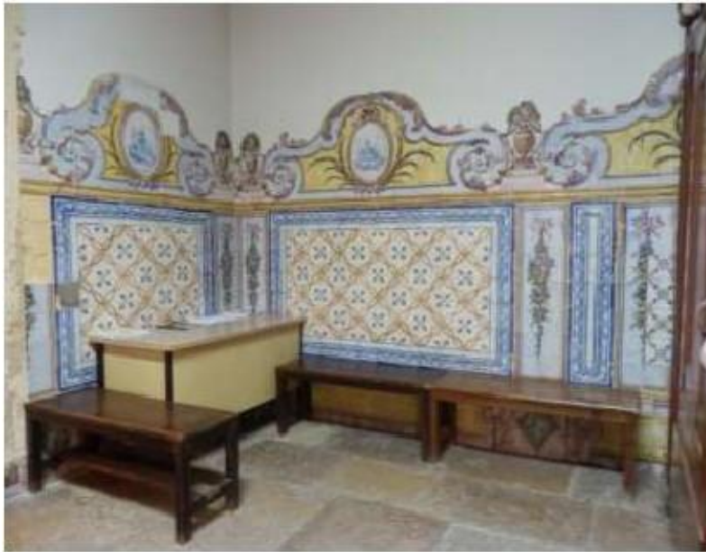
Fig.116 Azulejos da nave da igreja, lado da epístola Convento de Santa Teresa de Jesus de Setúbal FA