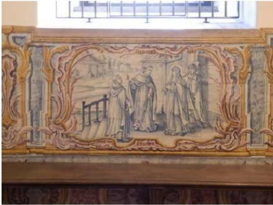
Fig.201 Convento do Santíssimo Coração de Jesus – Basílica da Estrela, Lisboa Sala de Santa Teresa Painel de Azulejos, lado da epístola FA