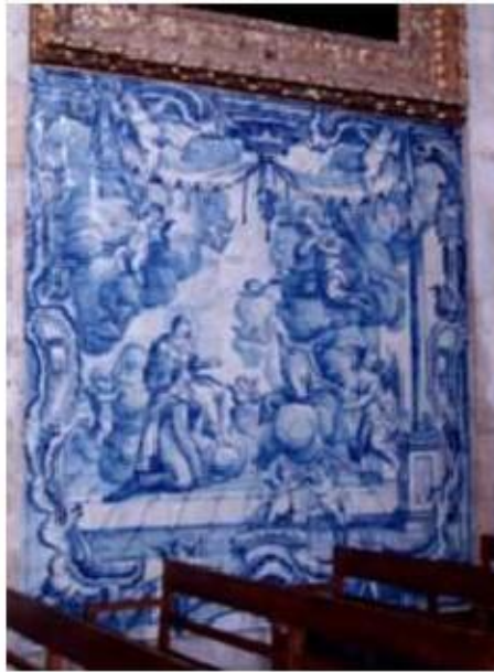
Fig.249 Nossa Senhora aconselha Santa Teresa a escolher São José como Protector da Reforma Nave da igreja, lado da epístola Painel de azulejos do século XVIII Convento de Santa Teresa de Jesus de Carnide, Lisboa FA