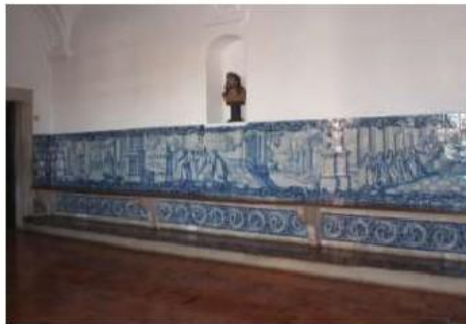
Fig.276 Sala do Capítulo Painel de azulejos do século XVIII Convento de Santa Teresa de Jesus de Carnide, Lisboa FA