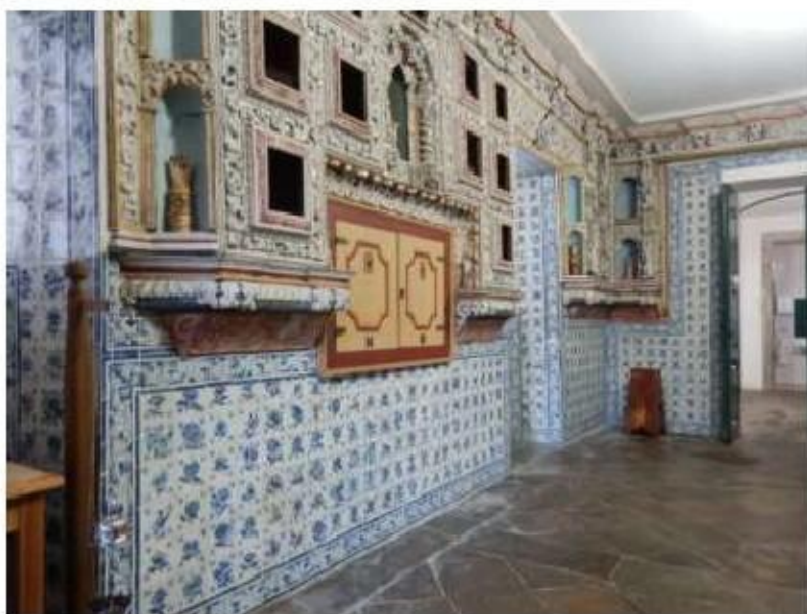
Fig.102 Convento de Nossa Senhora do Carmo, Viana do Castelo Sacristia FA