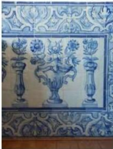
Fig. 436 Painel de azulejos do século XVIII Dependência conventual Convento de São José, Évora FA