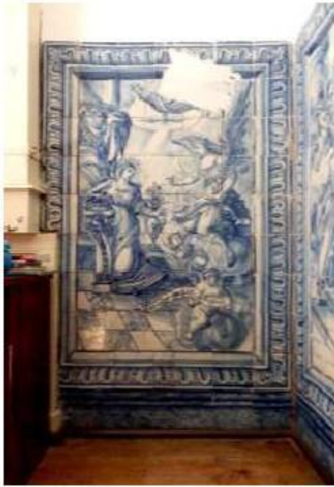
Fig.421 A Anunciação Painel de azulejos do século XVIII Sala do 1.º piso Convento de São José, Évora FA