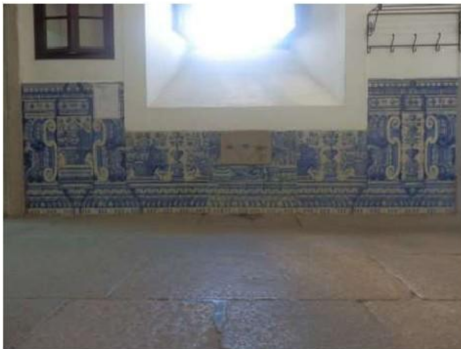
Fig. 432 Painel de azulejos Portaria Convento de São José, Évora FA