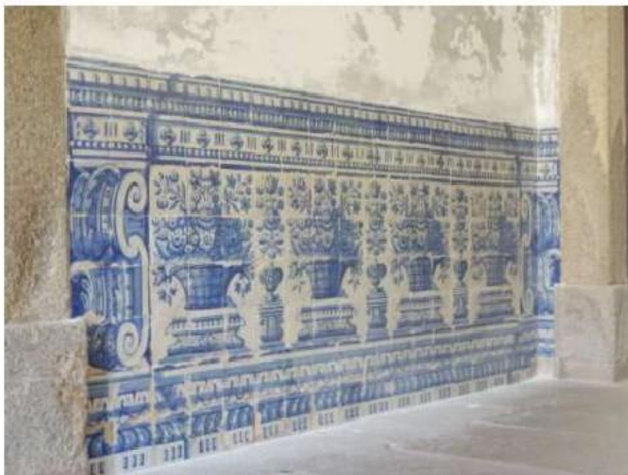
Fig. 434 Painel de azulejos Portaria Convento de São José, Évora FA