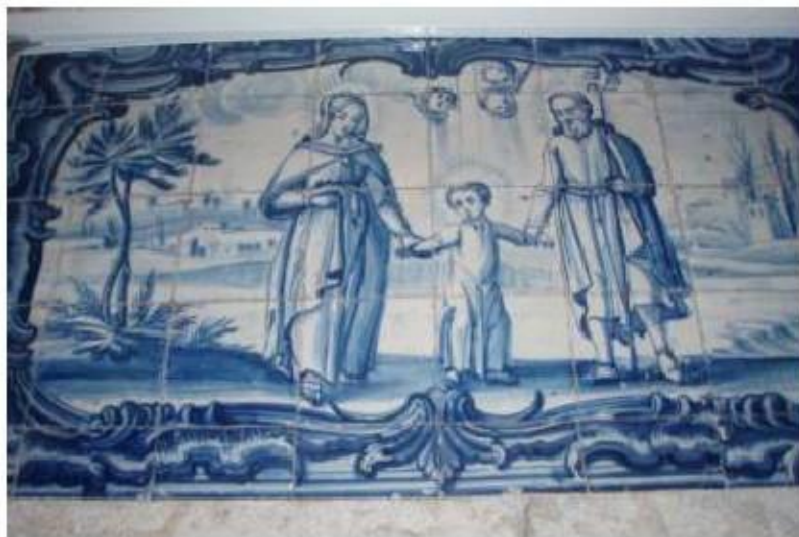
Fig.316 Sagrada Família de Nazaré Painel de azulejos do século XVIII Convento de Santa Teresa de Jesus de Carnide, Lisboa FA