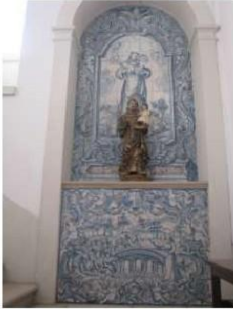
Fig.188 Convento de Santa Teresa de Jesus – Coimbra Azulejos com Santo António