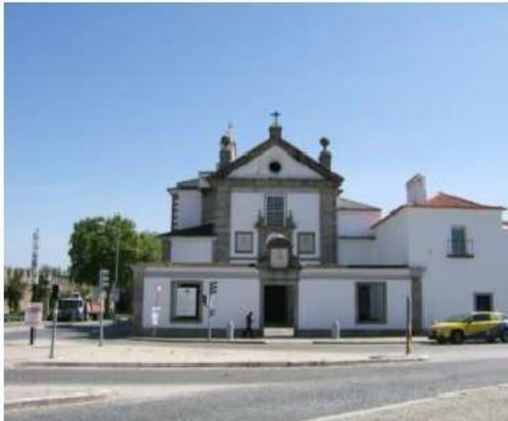
Fig.121 Convento de Nossa Senhora dos Remédios, Évora Fachada principal FA