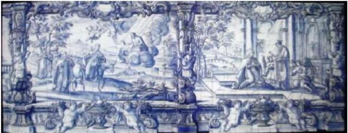
Figs.367 e 368

Viagem de Santa Teresa de Jesus a Salamanca e Comunhão de Santa Teresa no Convento de Medina