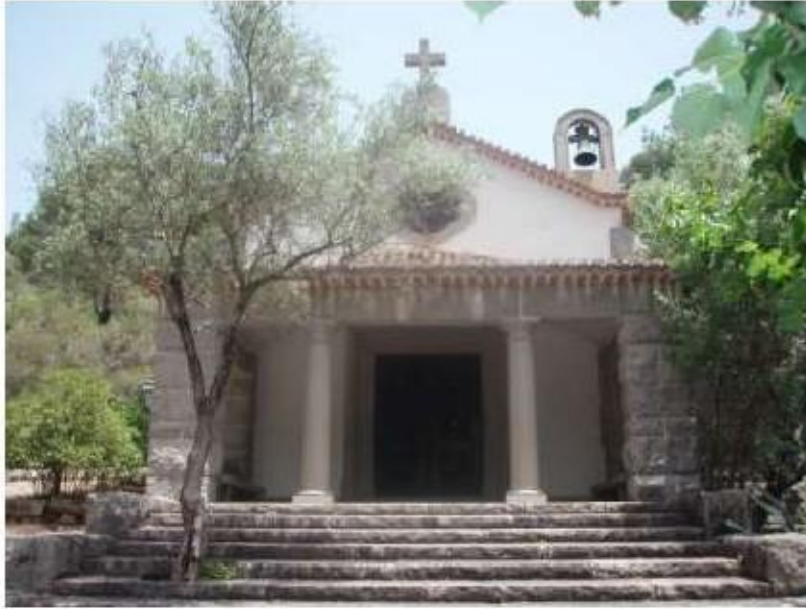
Fig.38 Ermida de Santa Teresa, Caldas de Monchique Fachada principal FA