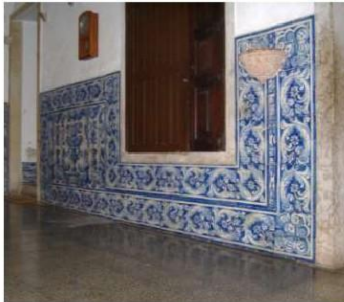
Fig. 318 Sacristia conventual Painel de azulejos do século XVIII Convento de Santa Teresa de Jesus de Carnide, Lisboa FA