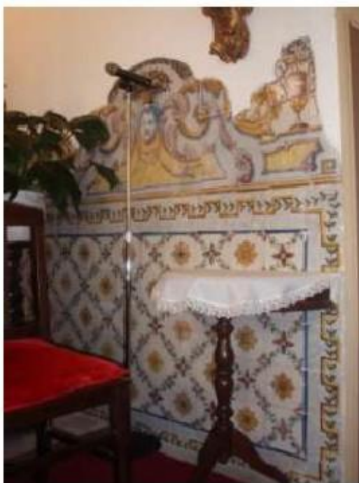
Fig.79 Igreja da Ordem Terceira de Nossa Senhora do Carmo de Setúbal Azulejaria neoclássica FA