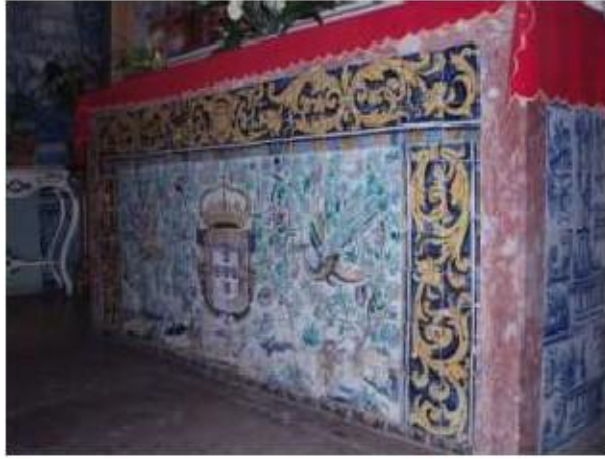
Fig.273 Frontal de altar Convento de Santa Teresa de Jesus de Carnide, Lisboa FA