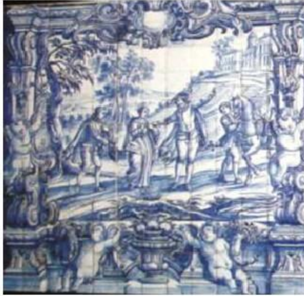
Fig.373 A fuga de Santa Teresa de Jesus e do irmão Coro alto Convento dos Cardaes, Lisboa