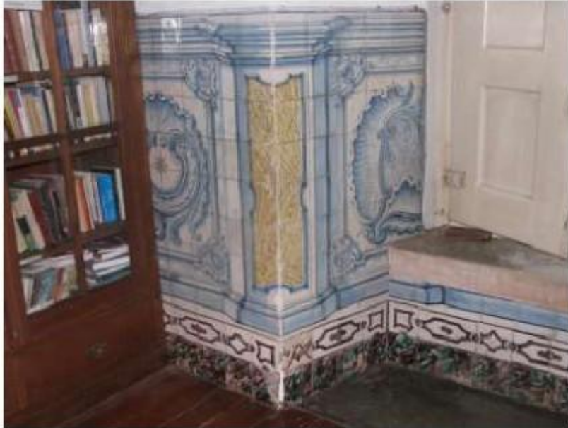
Fig.182 Convento de Santa Teresa de Jesus - Coimbra Azulejos Biblioteca