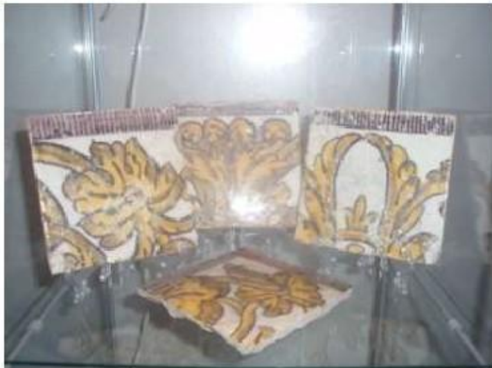
Fig.67 Convento de Nossa Senhora das Relíquias, Vidigueira Azulejos FA