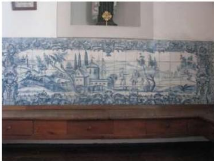
Fig.171 Convento de Santa Teresa de Jesus - Coimbra Azulejos Coro alto