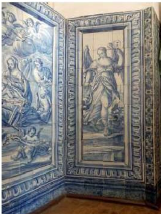
Fig.425 Painel de azulejos do século XVIII Sala do 1.º piso Convento de São José, Évora FA