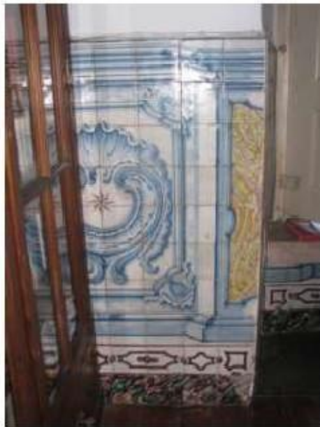
Fig.181 Convento de Santa Teresa de Jesus – Coimbra Azulejos Biblioteca