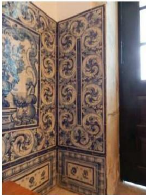
Fig.111 Capela de São Miguel Arcanjo Convento de Nossa Senhora do Carmo de Viana do Castelo FA