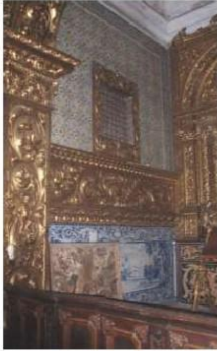
Fig.214 Capela de Santa Teresa Painel de azulejos Convento de Santo Alberto, Lisboa FA