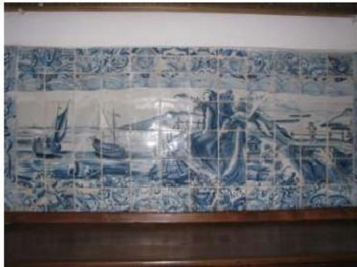
Fig.169 Convento de Santa Teresa de Jesus - Coimbra Azulejos Coro alto