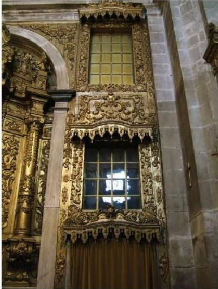
Fig.414 Igreja conventual, lado da epístola Convento de São José, Évora FA