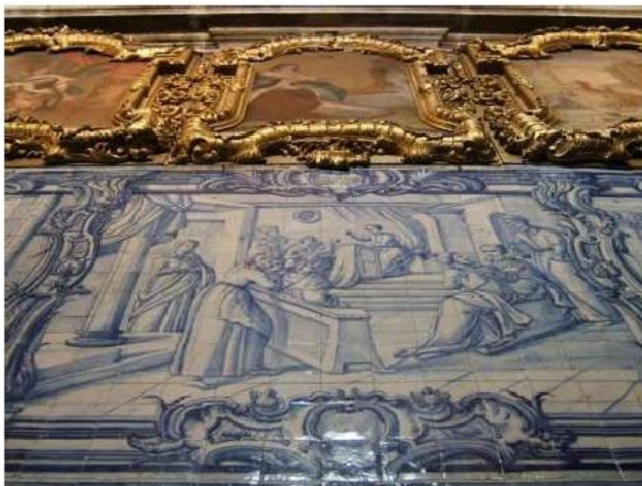
Fig.417 Painel de azulejos, lado da epístola Convento de São José, Évora FA