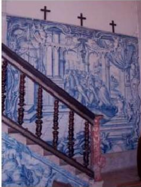
Figs.239 Transepto da igreja, lado do evangelho Painel de azulejos do século XVIII Convento de Santa Teresa de Jesus de Carnide, Lisboa FA