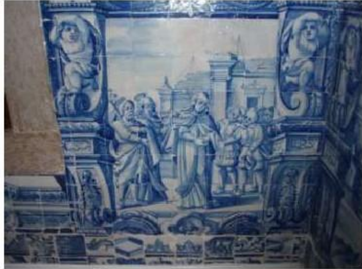
Fig.294 Dependência conventual Painel de azulejos do século XVIII Convento de Santa Teresa de Jesus, Carnide, Lisboa FA