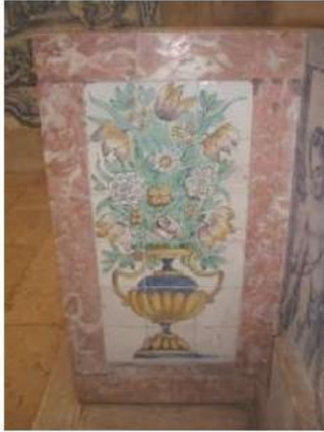
Fig.265 Transepto da igreja, mesa de altar com azulejos, lado do evangelho Convento de Santa Teresa de Jesus, Carnide, Lisboa, FA