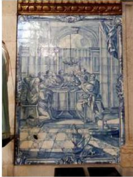
Fig.233 Última Ceia Painel de azulejos do século XVIII Convento de Santa Teresa de Carnide, Lisboa FA