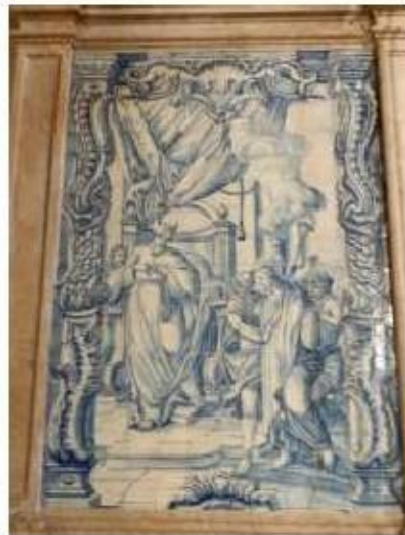
Fig. 270 Jesus Cristo diante de Caifás Painel de azulejos do século XVII Convento de Santa Teresa de Jesus de Carnide, Lisboa FA