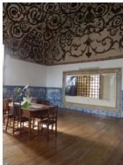
Fig.297 Coro alto Vista geral do interior Convento de Santa Teresa de Jesus de Carmide, Lisboa FA