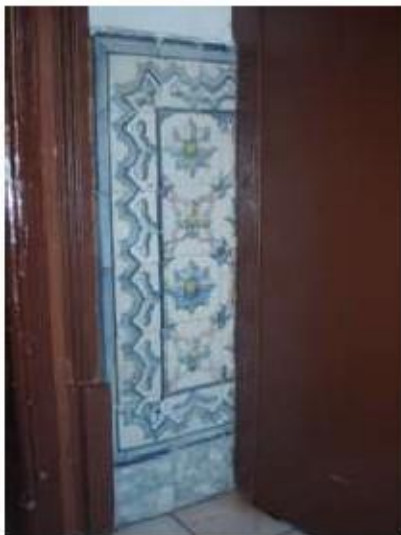
Fig.26 Igreja da Ordem Terceira de Nossa Senhora do Carmo de Lisboa Painel de azulejos FA