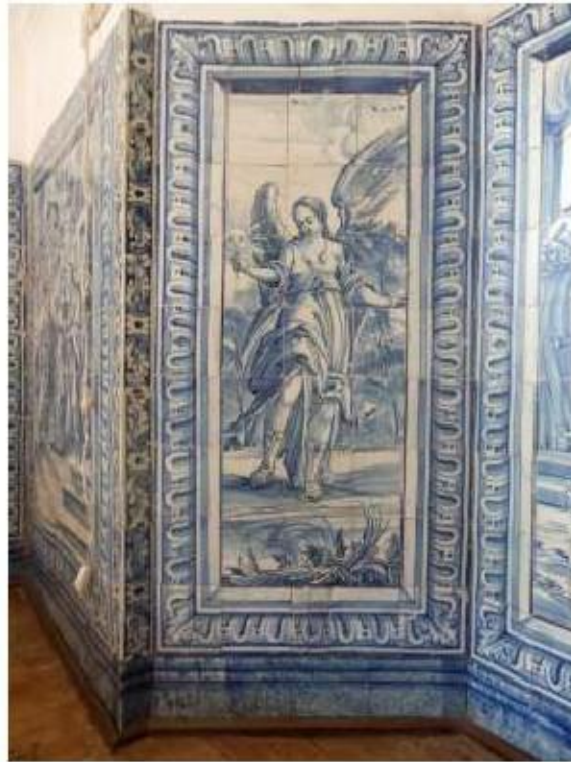
Fig.423 Painel de azulejos do século XVIII Sala do 1.º piso Convento de São José, Évora FA