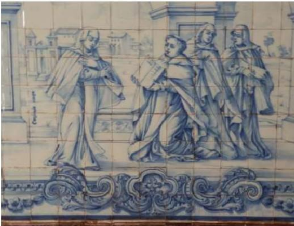
Fig.43 Ermida de Santa Teresa, Caldas de Monchique Painel de azulejos, lado do evangelho FA