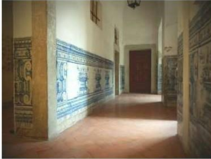
Fig.404 Azulejos junto à portaria Convento dos Cardaes, Lisboa FA