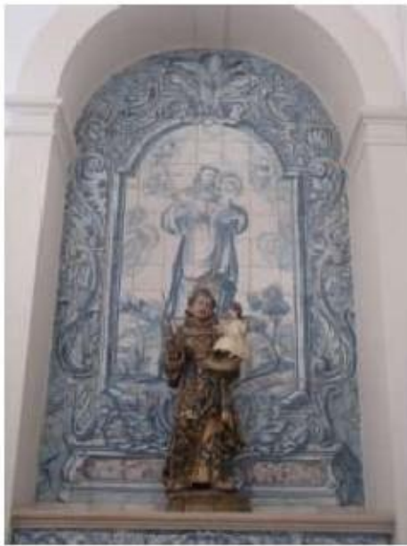
Fig.189 Convento de Santa Teresa de Jesus - Coimbra Azulejos com Santo António