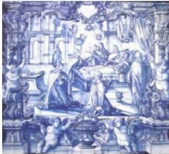
Fig. 377 Morte de Santa Teresa de Jesus Coro alto Convento dos Cardaes de Lisboa