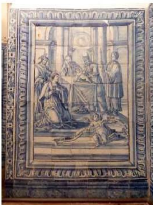
Fig.426 Apresentação e circuncisão de Jesus no Templo Painel de azulejos do século XVIII Sala do 1.º piso Convento de São José, Évora FA