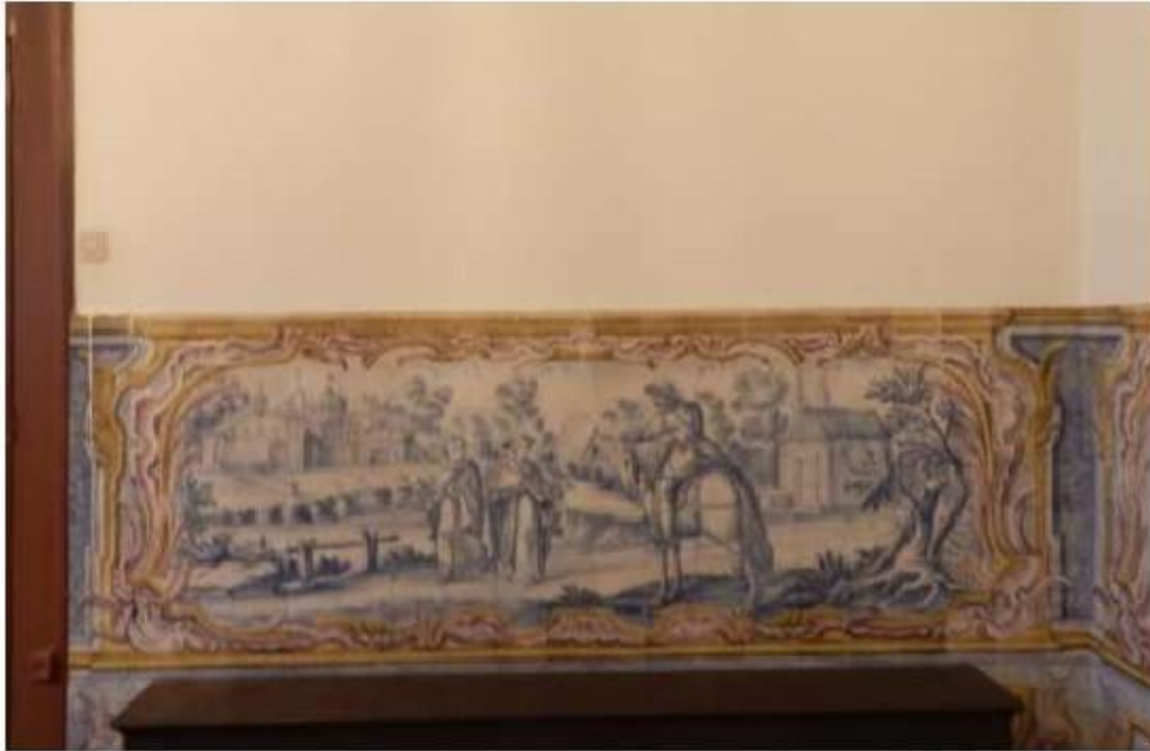
Fig.194 Convento do Santíssimo Coração de Jesus – Basílica da Estrela, Lisboa Sala de Santa Teresa Painel de Azulejos, parede fundeira FA

-Convento do Santíssimo Coração de Jesus – Basílica da Estrela - Lisboa