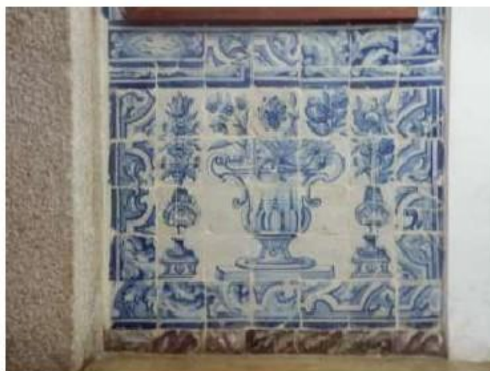
Fig. 435 Painel de azulejos do século XVIII Dependência conventual Convento de São José, Évora FA