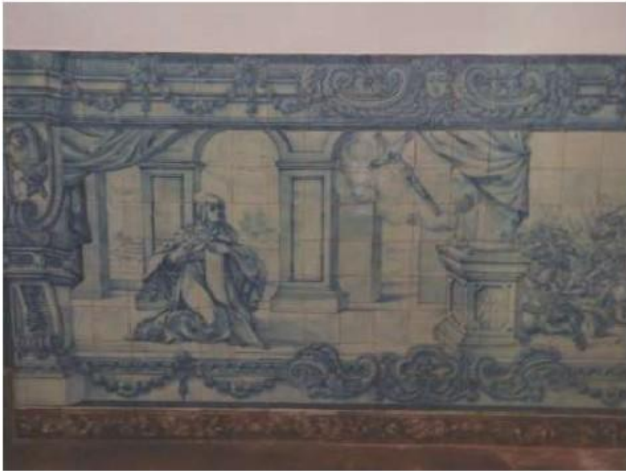
Fig.54 Ermida de Santa Teresa, Caldas de Monchique Parede do lado da epístola FA