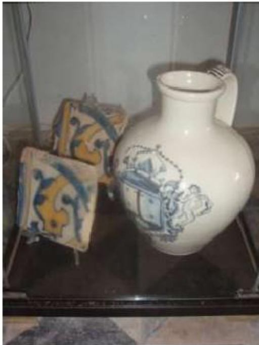
Fig.69 Convento de Nossa Senhora das Relíquias, Vidigueira Azulejos de Padrão FA