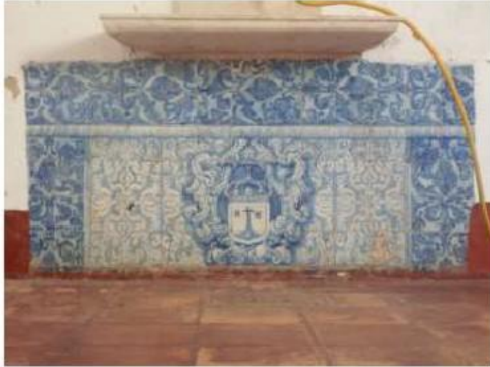
Fig. 438 Frontal de altar Claustro Convento de São José, Évora FA