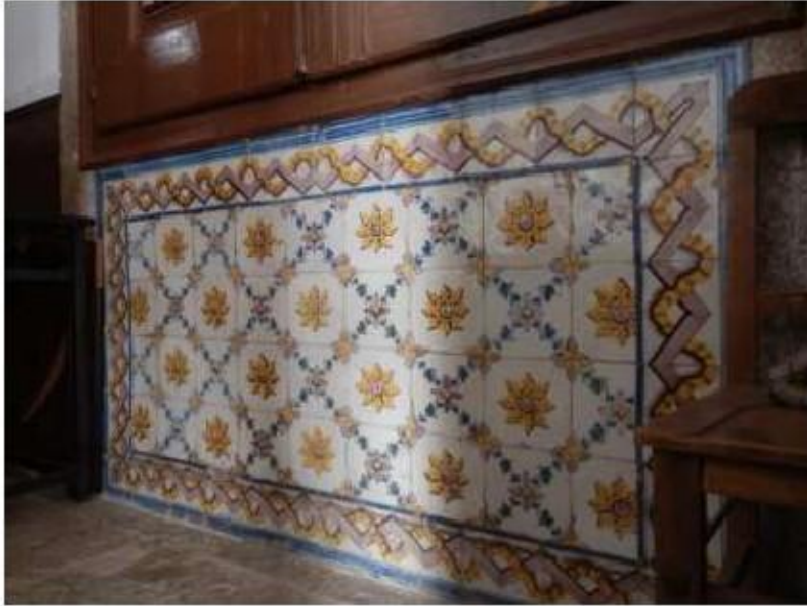
Fig.120 Convento de Santa Teresa de Jesus de Setúbal Azulejos FA