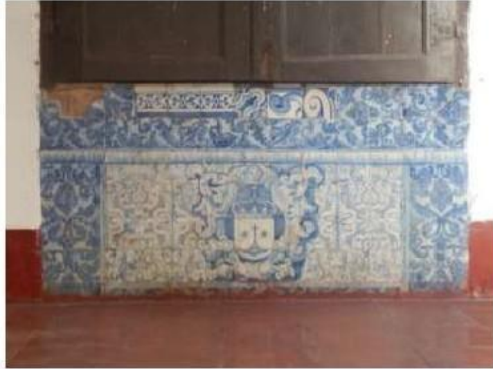
Fig. 440 Frontal de altar Claustro Convento de São José, Évora FA