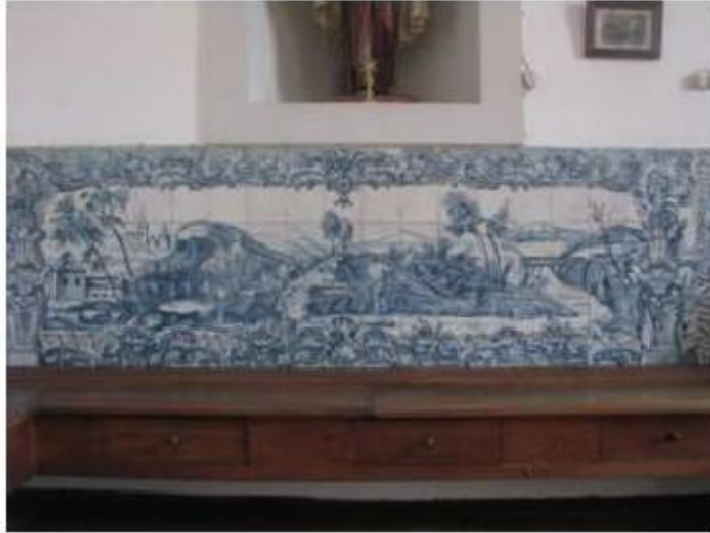
Fig.170 Convento de Santa Teresa de Jesus - Coimbra Azulejos Coro alto