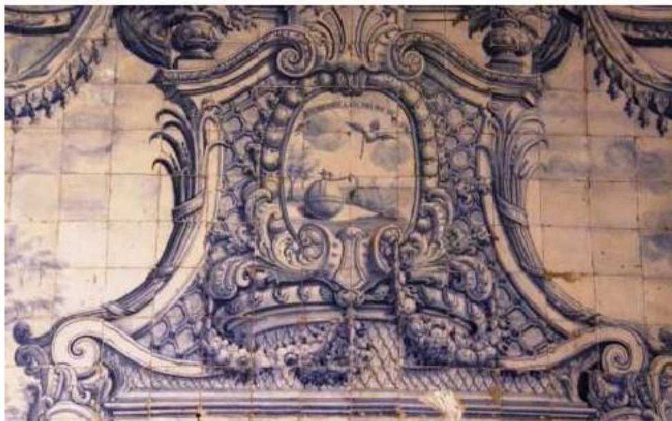
Fig.221 Emblema em azulejo, lado do evangelho Convento de Santo Alberto, Lisboa