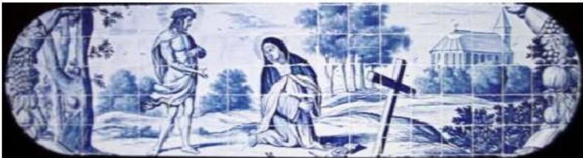
Fig.352 Santa Teresa de Jesus perante o Ecce Homo Lado da epístola Convento dos Cardaes, Lisboa