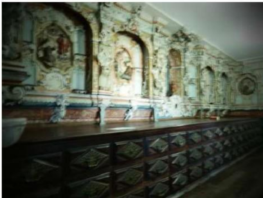
Fig.100 Azulejos da sacristia Convento de Nossa Senhora do Carmo de Viana do Castelo FA