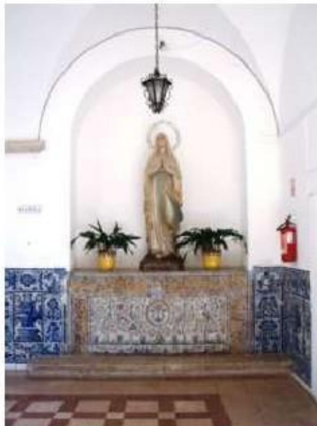
Fig. 321 Frontal de altar Claustro Convento de Santa Teresa de Jesus de Carnide, Lisboa FA