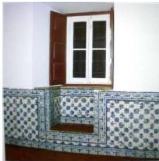
Fig.385 Silhar de azulejos de figura avulsa Locutório Convento dos Cardaes, Lisboa