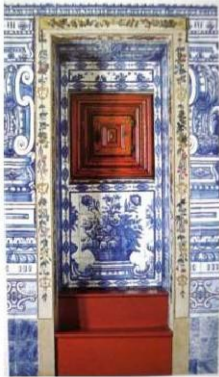
Fig.396 Vista geral do coro baixo Convento dos Cardaes, Lisboa