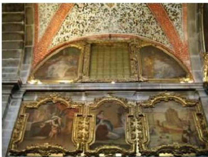
Fig.416 Pinturas da igreja, lado da epístola Convento de São José, Évora FA