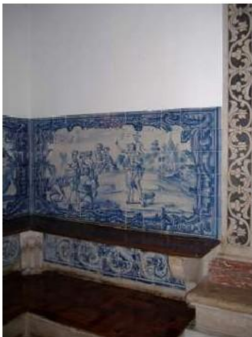
Fig.289 A pregação de São João Baptista no Rio Jordão Sala do Capítulo Painel de azulejos do século XVIII Convento de Santa Teresa de Jesus, Carnide, Lisboa FA