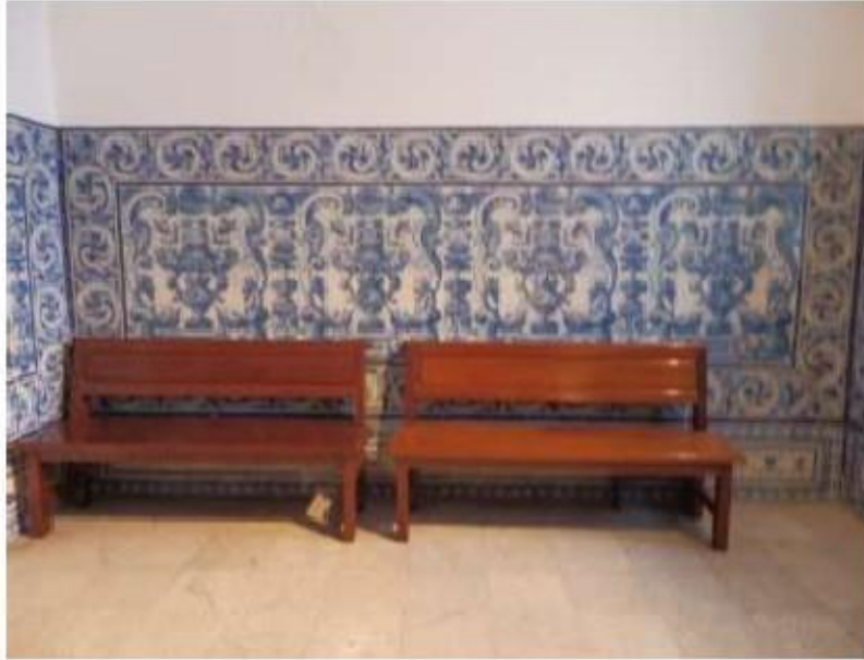
Fig.110 Capela de São Miguel Arcanjo Convento de Nossa Senhora do Carmo de Viana do Castelo FA