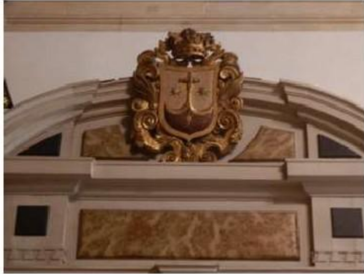
Fig.84 Convento de Nossa Senhora do Carmo, Aveiro Capela mor, lado da epístola FA