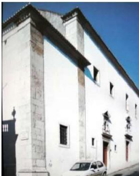
Fig. 335 Vista geral do exterior Convento dos Cardaes, Lisboa