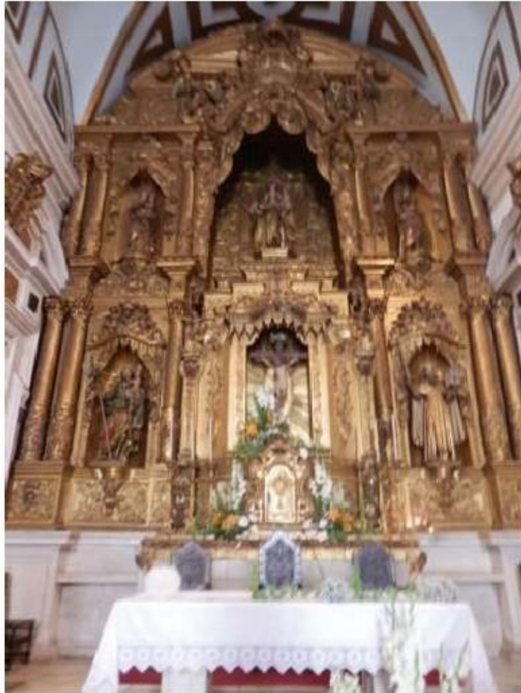
Fig.81 Convento de Nossa Senhora do Carmo, Aveiro Retábulo mor FA