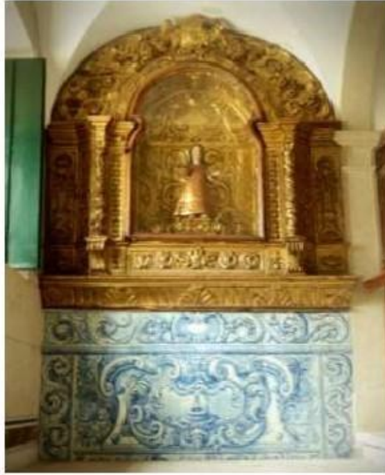
Fig.381 Azulejos da escadaria Convento dos Cardaes, Lisboa FA