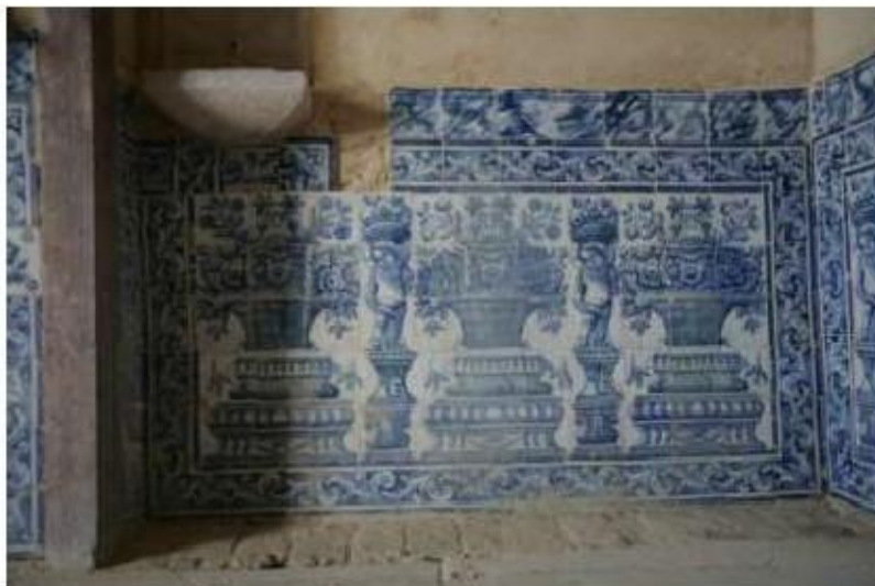
Fig. 445 Azulejaria na antiga sacristia conventual Convento de Nossa Senhora da Conceição, Lagos