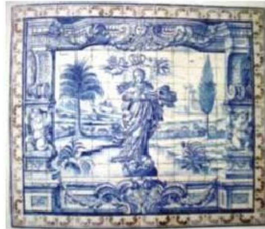
Figs.383 e 384 Vista geral do antecoro e Painel da Imaculada Conceição Convento dos Cardaes, Lisboa