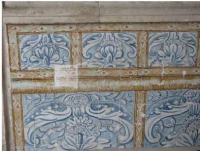
Fig.185 Convento de Santa Teresa de Jesus - Coimbra Azulejos Claustro