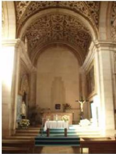
Fig. 228 Vista geral da capela-mor Convento de Santa Teresa de Jesus de Carnide, Lisboa FA