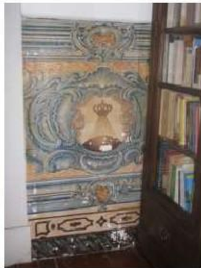
Fig.179 Convento de Santa Teresa de Jesus - Coimbra Azulejos Biblioteca