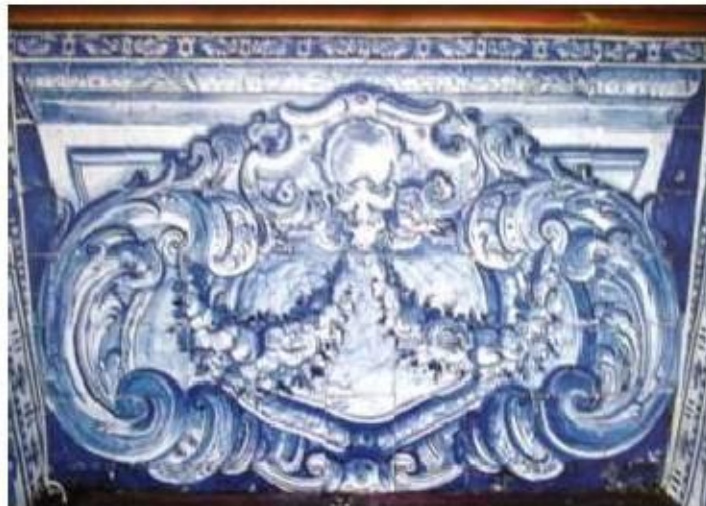
Fig.395 Vista geral do coro baixo Convento dos Cardaes, Lisboa