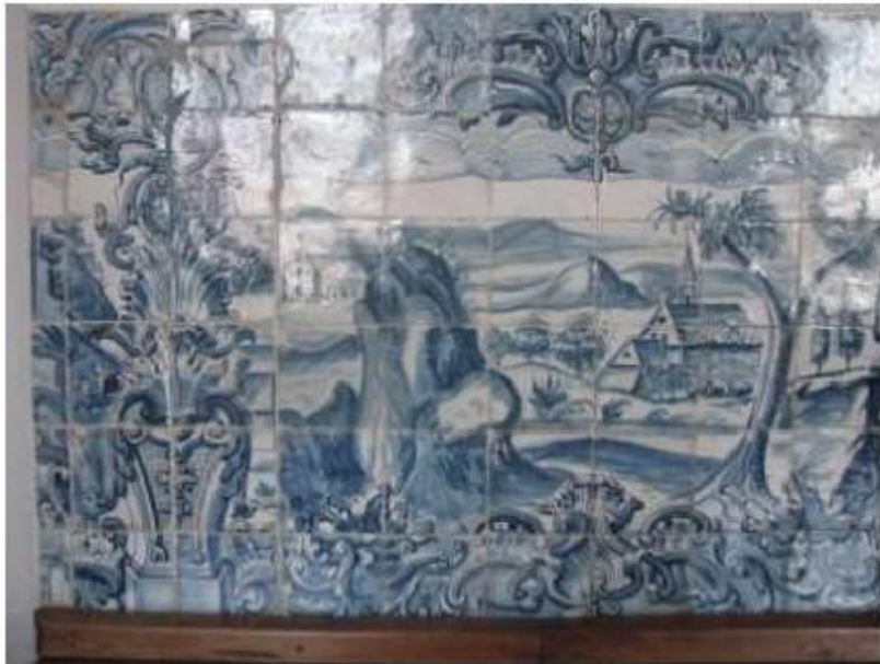
Fig.157 Convento de Santa Teresa de Jesus - Coimbra Azulejos Coro alto