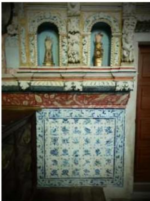
Fig.101 Convento de Nossa Senhora do Carmo, Viana do Castelo Sacristia FA