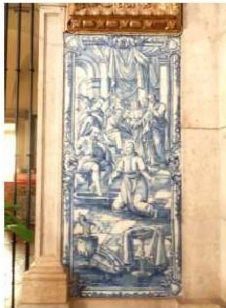
Fig.234 Lava Pés Painel de azulejos do século XVIII Convento de Santa Teresa de Carnide, Lisboa FA