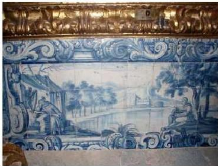
Fig.210 Azulejos da capela-mor, lado do evangelho Convento de Santo Alberto, Lisboa FA