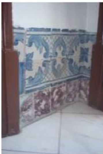
Fig.27 Igreja da Ordem Terceira de Nossa Senhora do Carmo de Lisboa Painel de azulejos FA