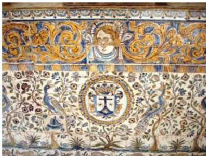
Fig. 323 Frontal de altar Claustro Convento de Santa Teresa de Jesus de Carnide, Lisboa FA