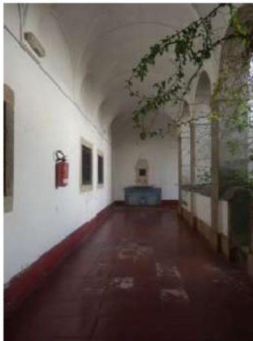
Fig. 439 Frontal de altar Claustro Convento de São José, Évora FA