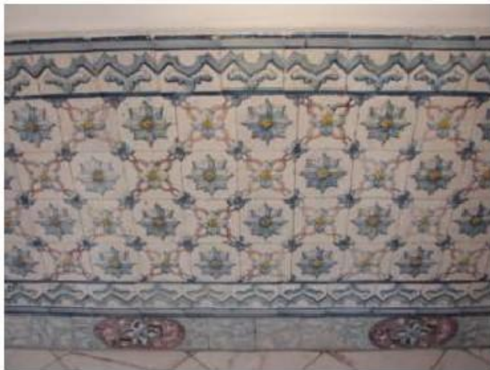
Fig.23 Igreja da Ordem Terceira de Nossa Senhora do Carmo de Lisboa Painel de azulejos FA