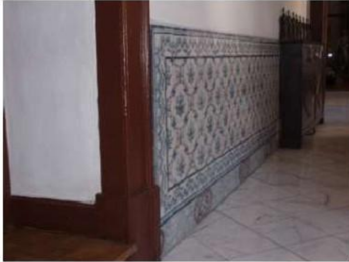
Fig.22 Igreja da Ordem Terceira de Nossa Senhora do Carmo de Lisboa Painel de azulejos FA