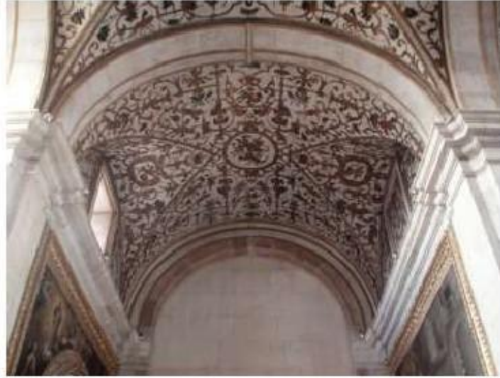
Fig.229 Abóbada da capela-mor Convento de Santa Teresa de Jesus de Carnide, Lisboa FA