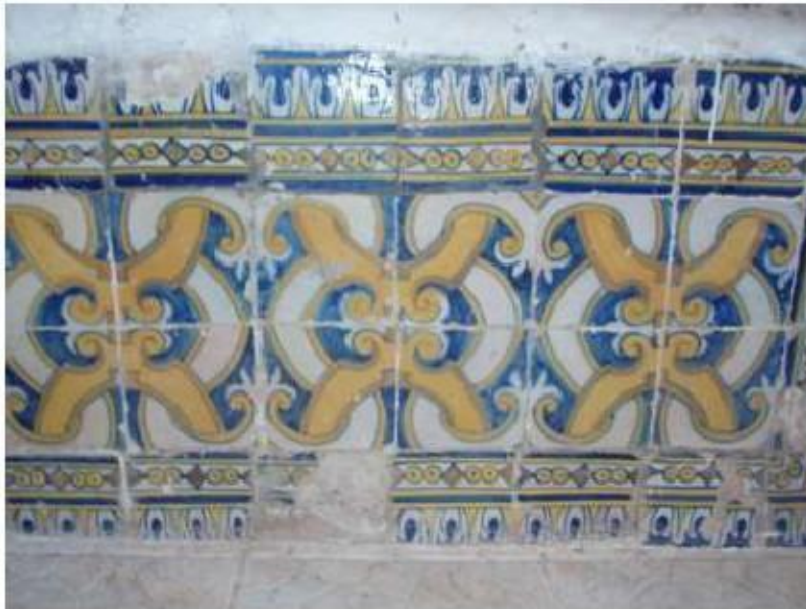
Fig.60 Convento de Nossa Senhora das Relíquias, Vidigueira Azulejos de Padrão FA