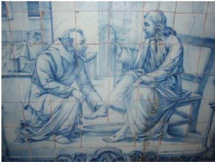
Fig.50 Ermida de Santa Teresa, Caldas de Monchique Parede fundeira, lado do evangelho FA