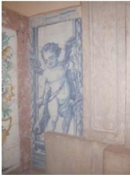
Fig.266 Transepto da igreja, lado do evangelho Convento de Santa Teresa de Jesus, Carnide, Lisboa, FA