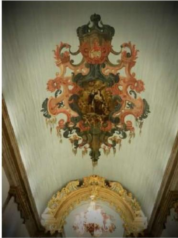
Fig.193 Convento de Santa Teresa de Jesus - Braga Pintura do tecto da Igreja FA