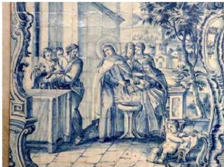
Fig.252 Santa Teresa de Jesus queima o seu livro Transepto da igreja, lado da epístola Convento de Santa Teresa de Jesus de Carnide, Lisboa FA