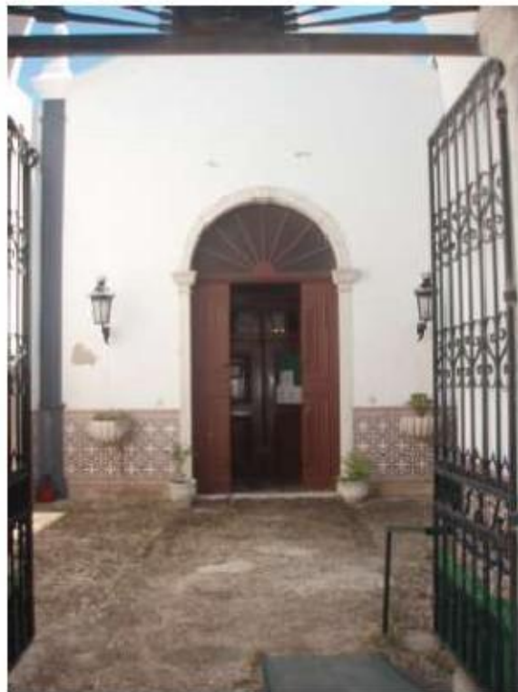
Fig.74 Igreja da Ordem Terceira de Nossa Senhora do Carmo de Setúbal