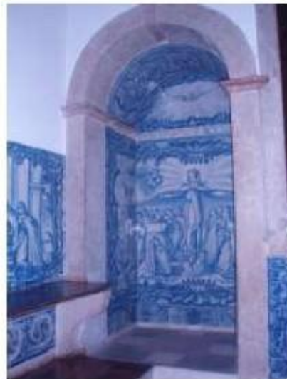
Fig.280 Sala do Capítulo Painel de azulejos do século XVIII Convento de Santa Teresa de Jesus de Carnide, Lisboa FA