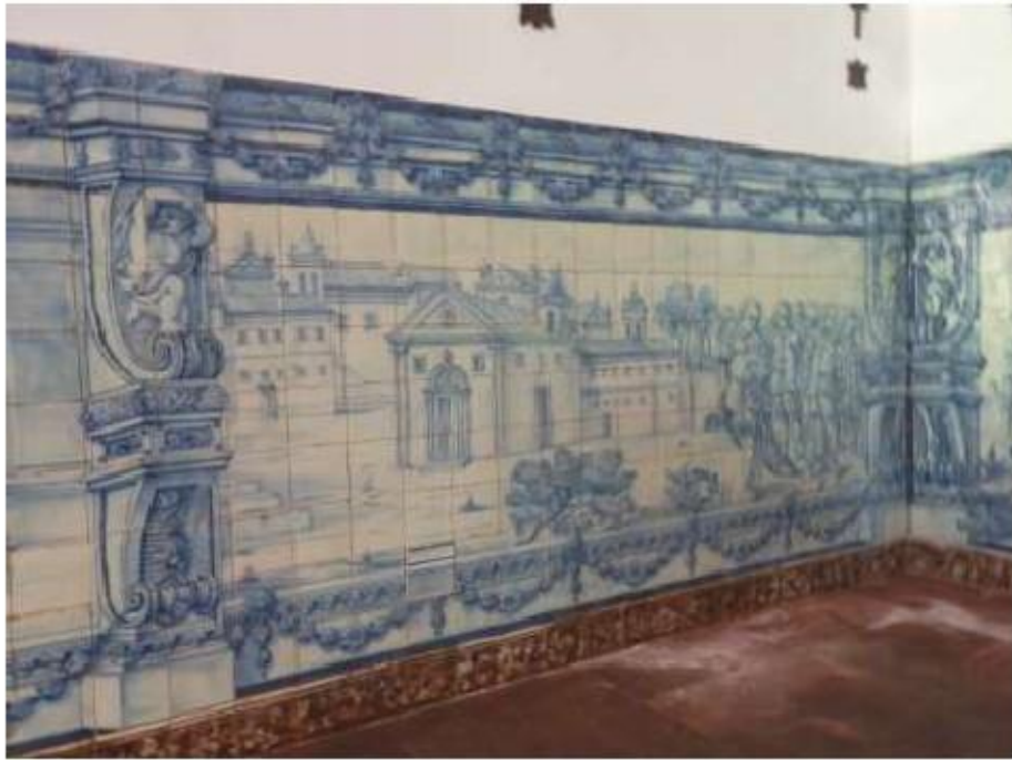
Fig.46 Ermida de Santa Teresa, Caldas de Monchique Parede do lado do evangelho FA