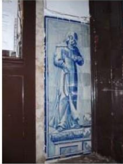
Fig.313 Portaria conventual Painel de azulejos Convento de Santa Teresa de Jesus de Carnide, Lisboa FA