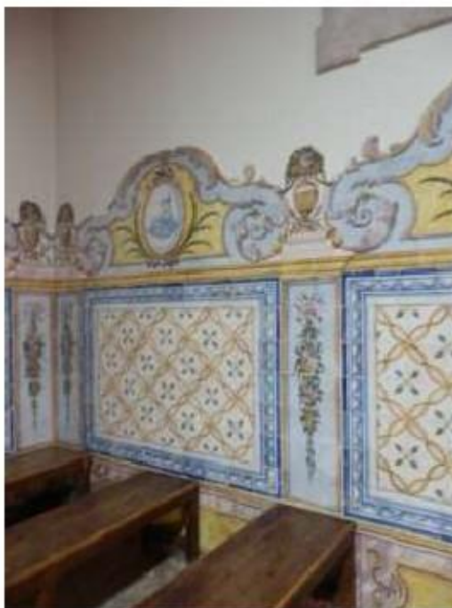
Fig.115 Azulejos da nave da igreja, lado do evangelho Convento de Santa Teresa de Jesus de Setúbal FA