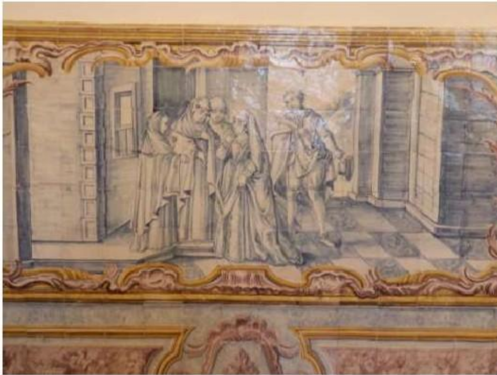
Fig.195 Convento do Santíssimo Coração de Jesus – Basilica da Estrela, Lisboa Sala de Santa Teresa Painel de Azulejos, parede do lado do evangelho FA