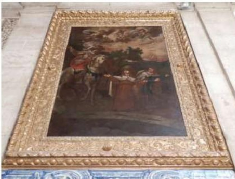
Fig.254 Encontro de Santa Teresa de Jesus e o irmão Rodrigo com tio de ambos, no momento das crianças fuga para a terra de mouros Nave da igreja Convento de Santa Teresa de Jesus de Carnide, Lisboa FA