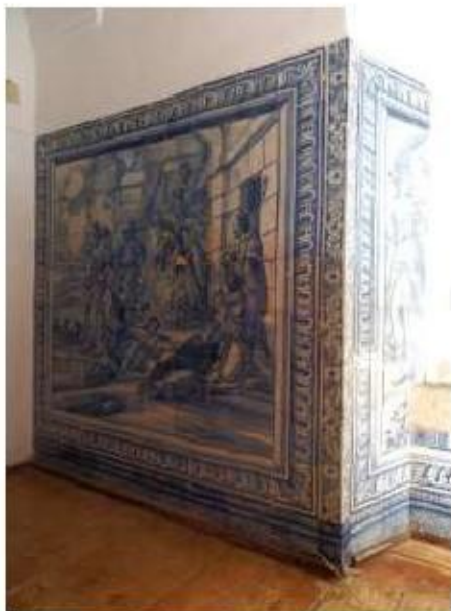
Fig.429 Adoração dos Magos do Oriente Painel de azulejos do século XVII Sala do 1.º piso Convento de São José, Évora FA