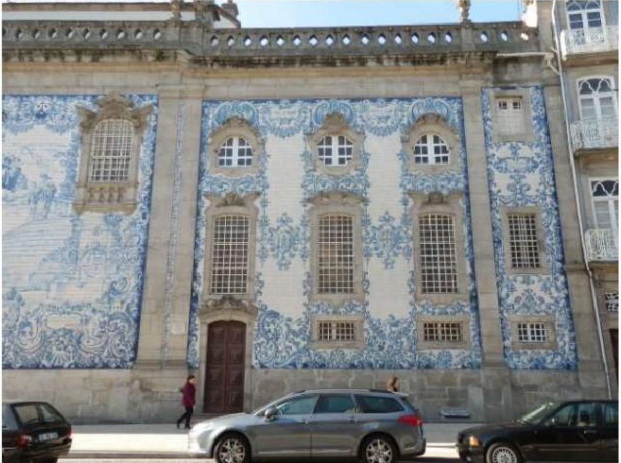
Fig.37 Igreja da Ordem Terceira do Carmo do Porto Fachada lateral FA