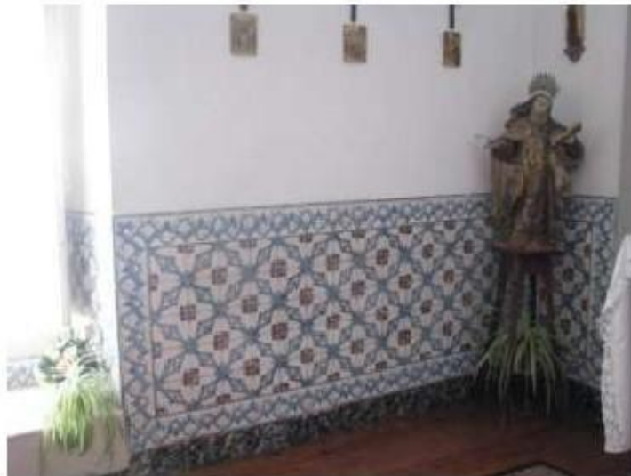
Fig.183 Convento de Santa Teresa de Jesus - Coimbra Azulejos Sala do Noviciado