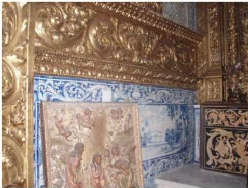
Fig.215 Capela de Santa Teresa Painel de azulejos Convento de Santo Alberto, Lisboa FA