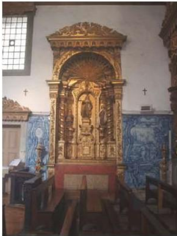
Fig. 31 Azulejos da nave da Igreja, lado do evangelho Igreja da Ordem Terceira do Carmo de Viseu FA