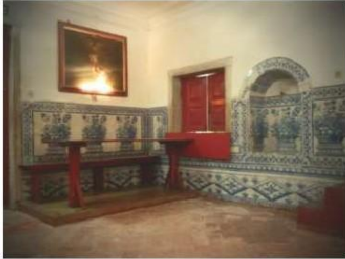
Fig.388 Vista geral dos azulejos do antigo refeitório conventual Convento dos Cardaes, Lisboa FA