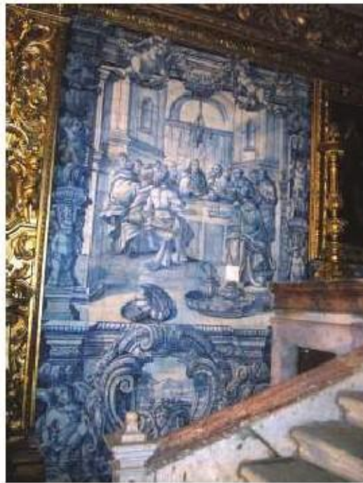
Fig.209 Última Ceia Capela-mor, lado do evangelho Convento de Santo Alberto, Lisboa