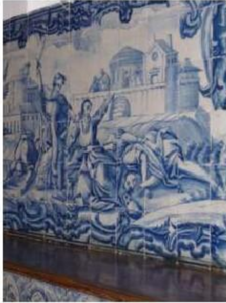
Fig.287 Chacina dos profetas pagãos Sala do Capítulo Painel de azulejos do século XVIII Convento de Santa Teresa de Jesus de Carnide, Lisboa FA