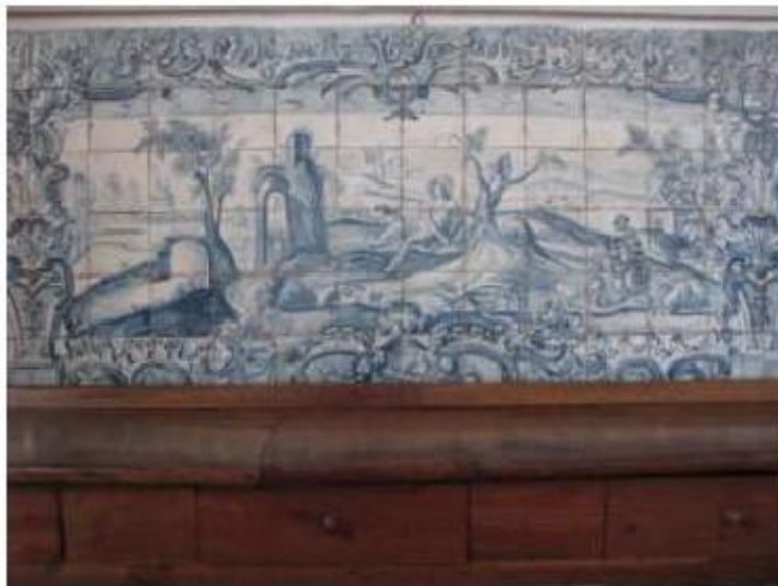
Fig.173 Convento de Santa Teresa de Jesus - Coimbra Azulejos Coro alto