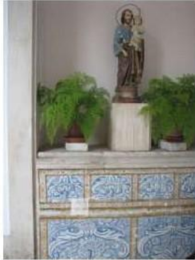
Fig.184 Convento de Santa Teresa de Jesus - Coimbra Azulejos Claustro