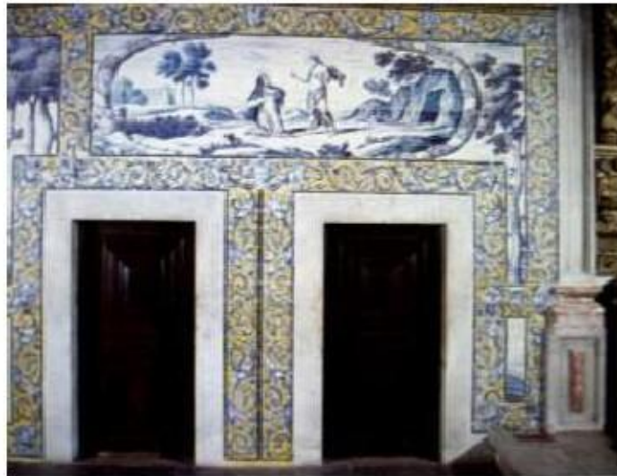
Fig.340 Casamento místico de Santa Teresa de Jesus Convento dos Cardaes, Lisboa