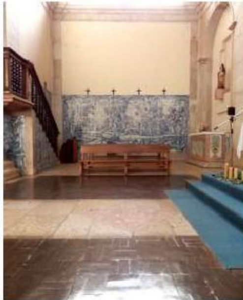
Figs.237 Transepto da igreja, lado do evangelho Painel de azulejos do século XVIII Convento de Santa Teresa de Jesus de Carnide, Lisboa FA