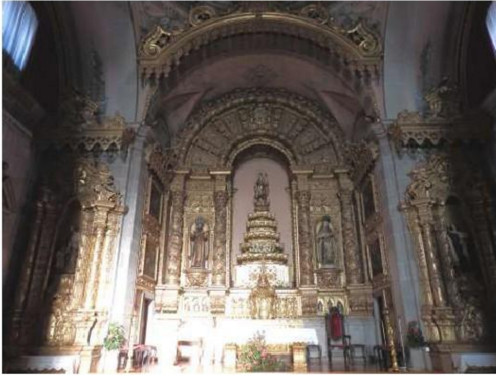
Fig.87 Capela-mor Convento de Nossa Senhora do Carmo de Viana do Castelo FA