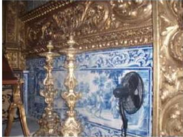
Fig.216 Capela de Santa Teresa Painel de azulejos Convento de Santo Alberto, Lisboa FA