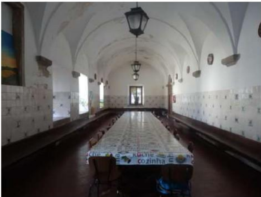
Fig. 441 Antigo refeitório Convento de São José, Évora FA