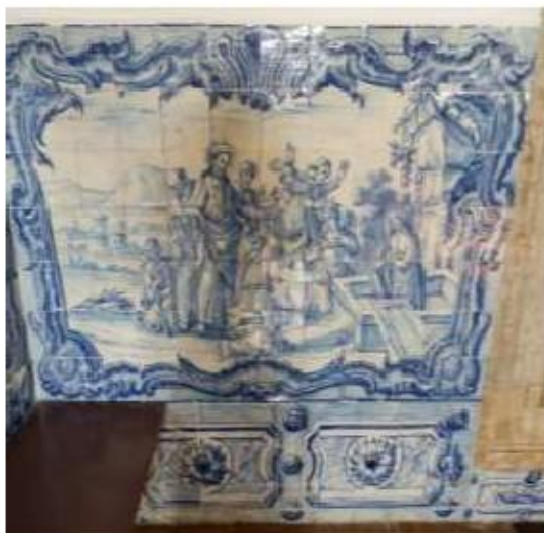
Fig.298 Ressurreição de Lázaro Coro Alto Painel de azulejos do século XVIII Convento de Santa Teresa de Jesus de Carnide, Lisboa FA