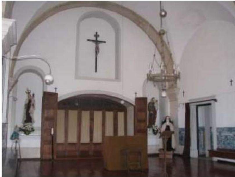
Fig.154 Convento de Santa Teresa de Jesus - Coimbra Azulejos Coro alto