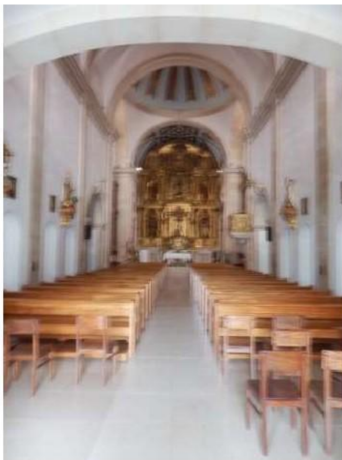
Fig.80 Convento de Nossa Senhora do Carmo, Aveiro FA