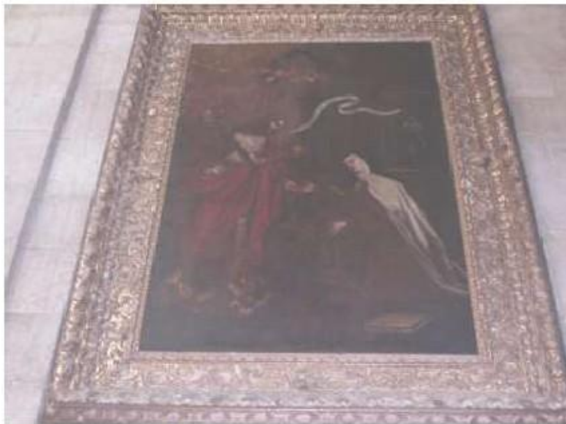
Fig.256 Pintura, lado da epístola Convento de Santa Teresa de Jesus de Carnide, Lisboa FA