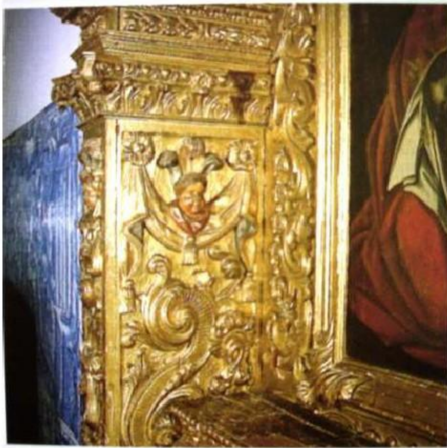
Fig.364 Talha do altar do coro alto Convento dos Cardaes de Lisboa