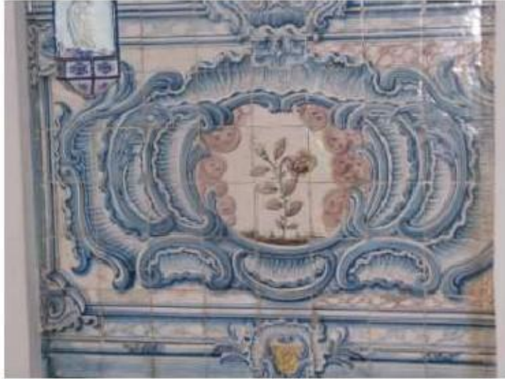
Fig.178 Convento de Santa Teresa de Jesus - Coimbra Azulejos Biblioteca