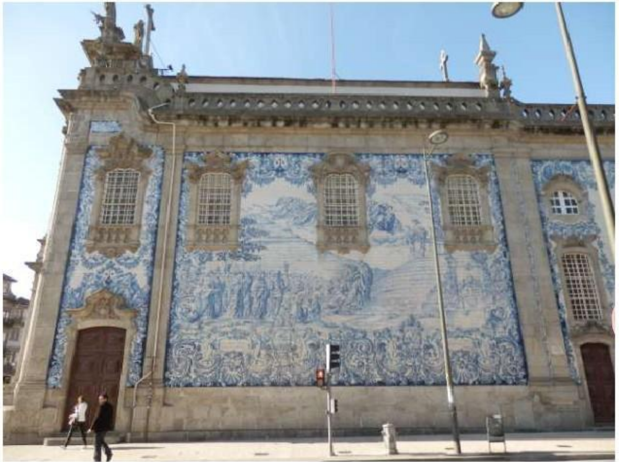
Fig.36 Igreja da Ordem Terceira do Carmo do Porto Fachada lateral FA