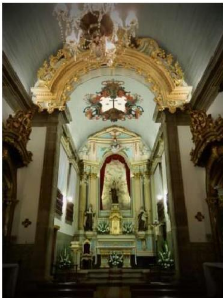
Fig.192 Convento de Santa Teresa de Jesus - Braga Capela-mor da Igreja FA