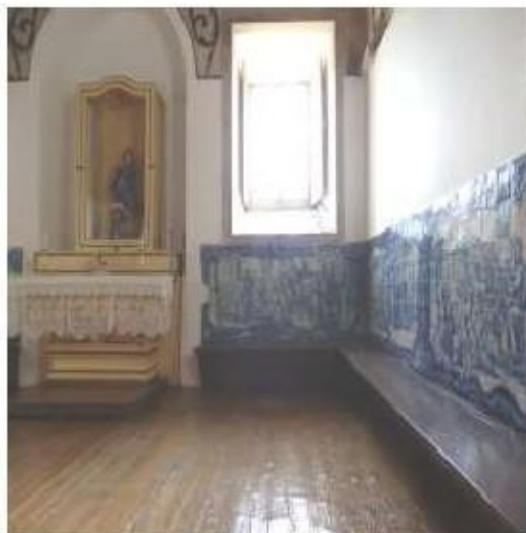
Fig.305 Coro alto, parede do oratório, Painel de azulejos do século XVIII Convento de Santa Teresa de Jesus de Carnide, Lisboa FA