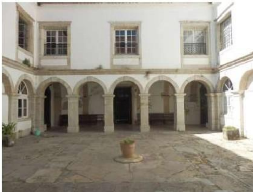
Fig.119 Convento de Santa Teresa de Jesus de Setúbal claustro FA