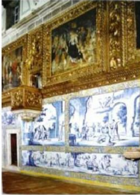
Fig.351 Vista geral da igreja, lado da epístola Convento dos Cardaes, Lisboa