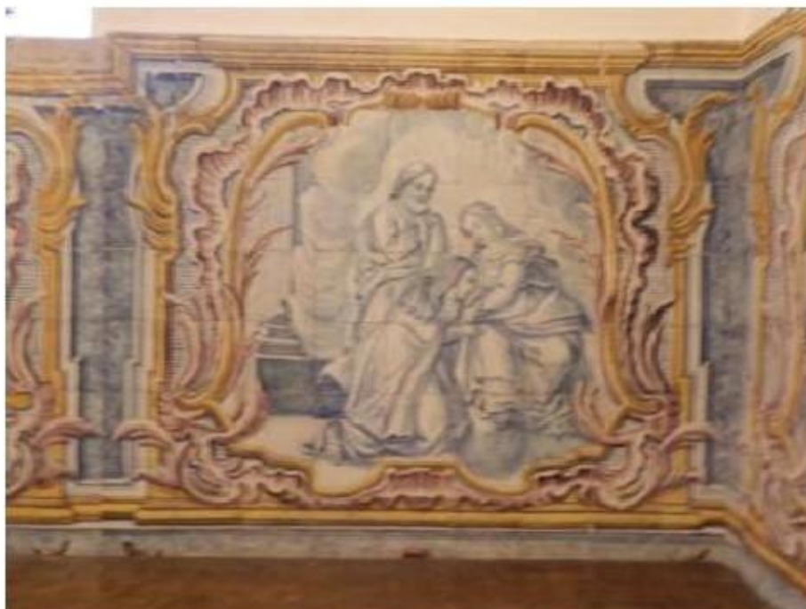
Fig.204 Convento do Santíssimo Coração de Jesus – Basílica da Estrela, Lisboa Sala de Santa Teresa Painel de Azulejos, lado da epístola FA