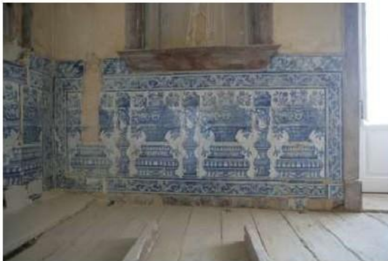
Fig. 447 Azulejaria na antiga sacristia conventual Convento de Nossa Senhora da Conceição, Lagos