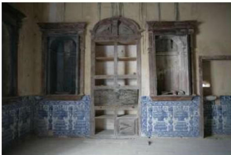
Fig. 442 Azulejaria na antiga sacristia conventual Convento de Nossa Senhora da Conceição, Lagos