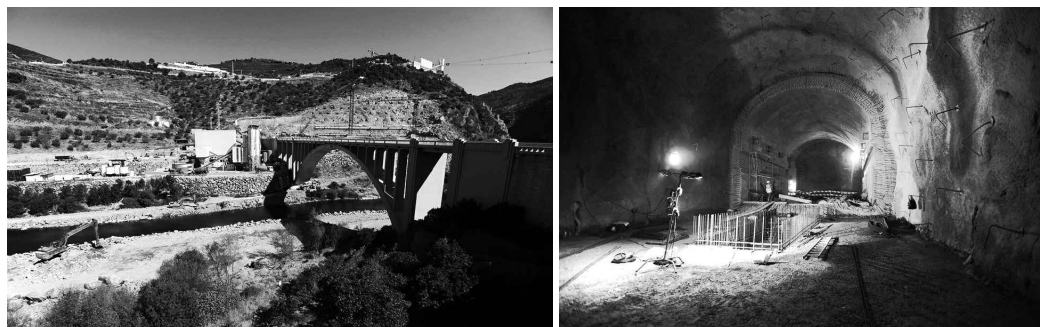
Fig. 32 e 33 Barragem de Foz do Tua