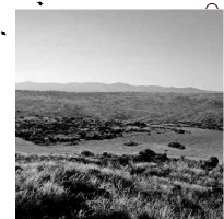
turão da ramila