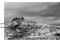
são gabriel (capela)