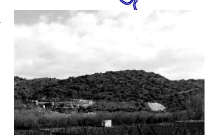
alto da lamigreira