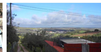
Vista para a paisagem envolvente