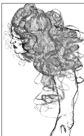
Figura 6 | EGON SCHIELE