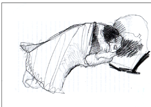
Figura 2 | JOSÉ LOURO