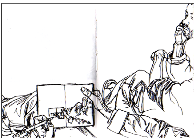
Figura 5 | CATARINA GARCIA