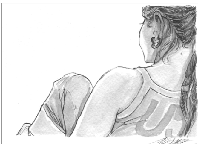
Figura 3 | ALLISON AFFONSO