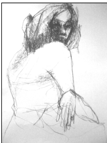
Figura 4 | CIARAN MCGILL