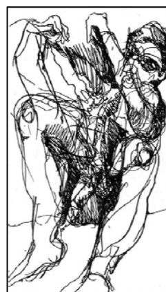
Figura 3 | TELMO CASTRO