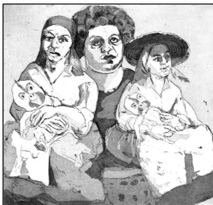
Figura 2 | PAULA REGO