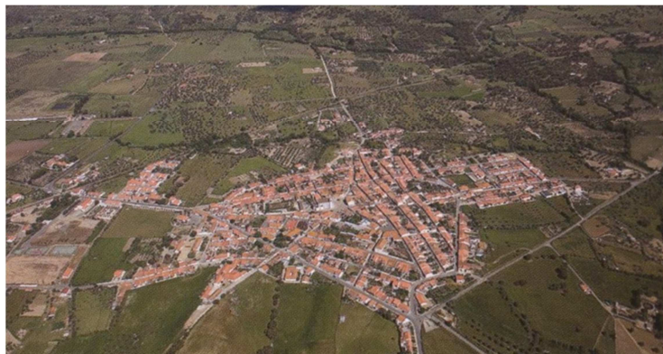
Figura 2 - Vila no Alentejo (Portugal). (Jorge, 2007)

Como antes referido, ainda que haja alguma especificidade quanto ao tipo de atividades associadas à paisagem com características mais urbanas ou rurais, a construção milenar da paisagem incluiu sempre uma certa diversidade de atividades e funções, com consideração das suas especificidades e valores – ao espaço urbano atribui-se um papel político-administrativo, socioeconómico e cultural; e ao espaço rural é atribuído o papel de produção de alimentos, que abastece o espaço urbano, em conjugação com outras funções, como as de proteção e de recreio. A essas paisagens multifuncionais tradicionais associa-se assim uma estrutura, um significado e uma certa ordem e equilíbrio. Uma combinação que é resultante de processos naturais, que configuram a estrutura ecológica que caracteriza um dado espaço (referimo-nos à matriz geológica, hidrológica e biológica) e da manipulação e adaptação operada pelo Homem nesse suporte, que configura a estrutura cultural (referimo-nos à matriz histórica, arqueológica, social e económica) (McHarg, 1969; Magalhães, 2001).