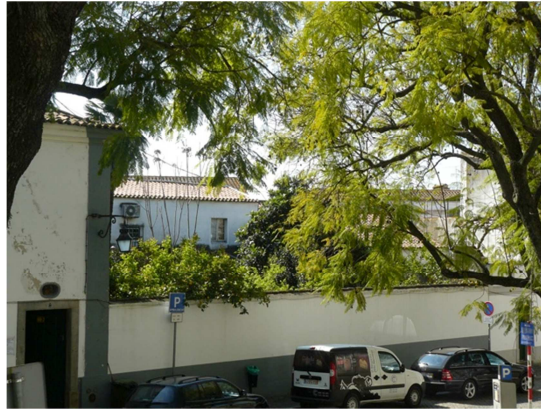
Figura 1 - Espaços abertos privados, do interior muralhado da cidade de Évora (Portugal)