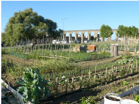
Figura 6 - Hortas urbanas no sector norte de Évora

estando previsto novo espaço agrícola no bairro da Malagueira, no sector oeste da cidade (onde já se verificam ocupações espontâneas junto às habitações) (Figura 5) (Figura 7). De realçar que todas estas hortas se localizam em terrenos baldios municipais e em solos cujas características não são integráveis nas áreas de RAN. Acresce o facto de não deterem carácter permanente, podendo a autarquia determinar a sua extinção caso necessite destas áreas para outros usos.