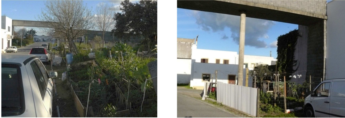
Figura 5 - Situações de apropriação do espaço aberto público para realização de hortas, uma circunstância que se repete em vários locais do bairro da Malagueira

Em Évora, esta prática recente começou a ser dinamizada em 2011 pelo município, dando resposta programada a iniciativas espontâneas que ocorrem um pouco por toda a cidade, em reduzidas faixas de terreno público, na proximidade ou adjacentes à habitação ou outros espaços vazios que o permitam (Figura 5).