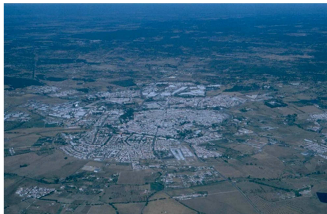
Figura 4 - Évora, núcleo e periferia

Como corolário, atualmente Évora apresenta um núcleo urbano antigo – denso e coeso mas em processo de despovoamento – em torno do qual se desenvolve a cidade contemporânea – uma cintura descontínua, fragmentada, de bairros e áreas industriais e de terciário que se expandiram em manchas isoladas (Figura 4), onde são particularmente evidentes as áreas de reserva e as expectantes ao uso e ao investimento, áreas quase todas agrícolas, abandonadas ou pouco cultivadas. A lógica da ocupação do espaço marcada pela definição em sectores funcionais impôs-se aos factores naturais e características próprias culturais da cidade.