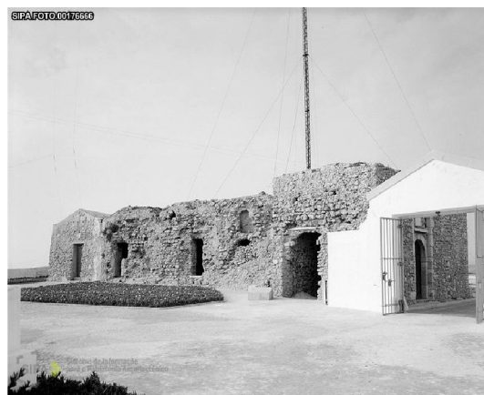
Interior da Fortificação - 1957