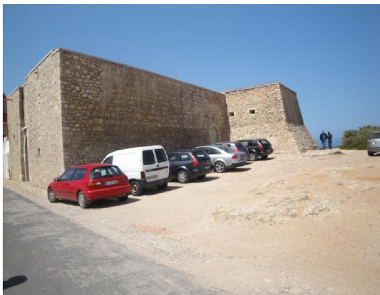
Entrada da Fortificação e Baluarte