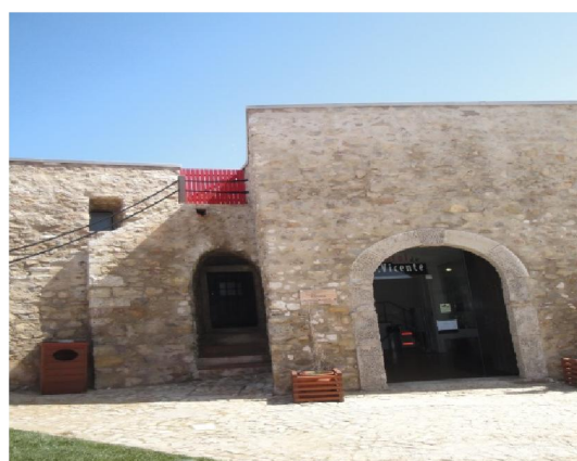
Interior da Fortificação