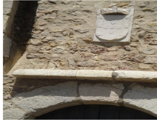
Escudo das Armas Portuguesas