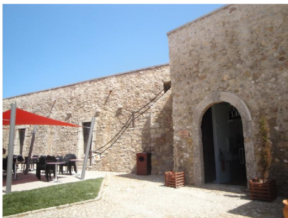
Interior da Fortificação