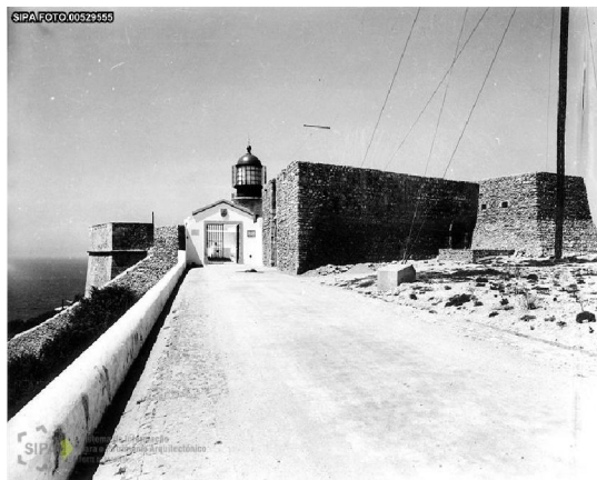
Entrada da fortificação - 1957