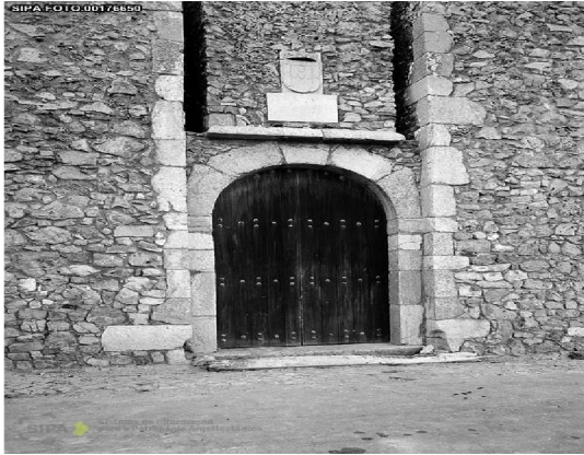
Entrada Principal - 1957