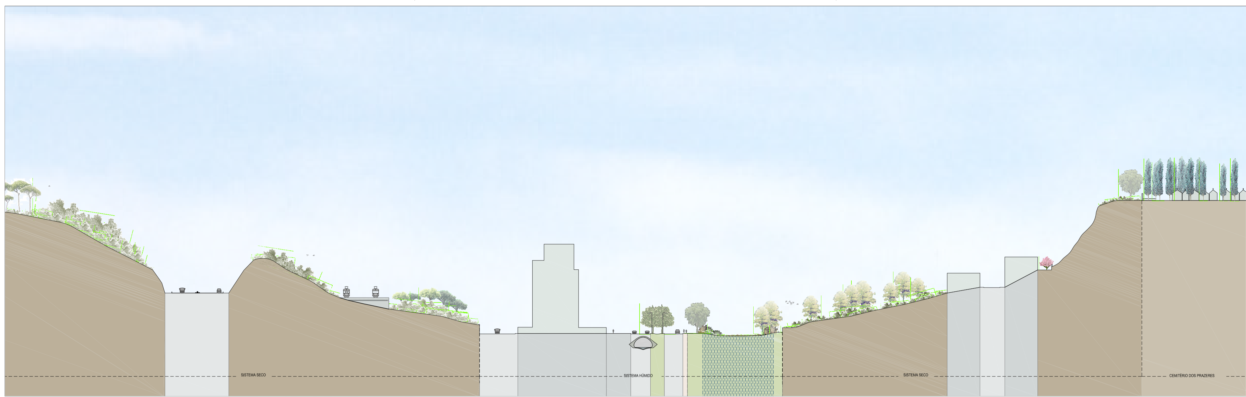
CORTE TIPO - A