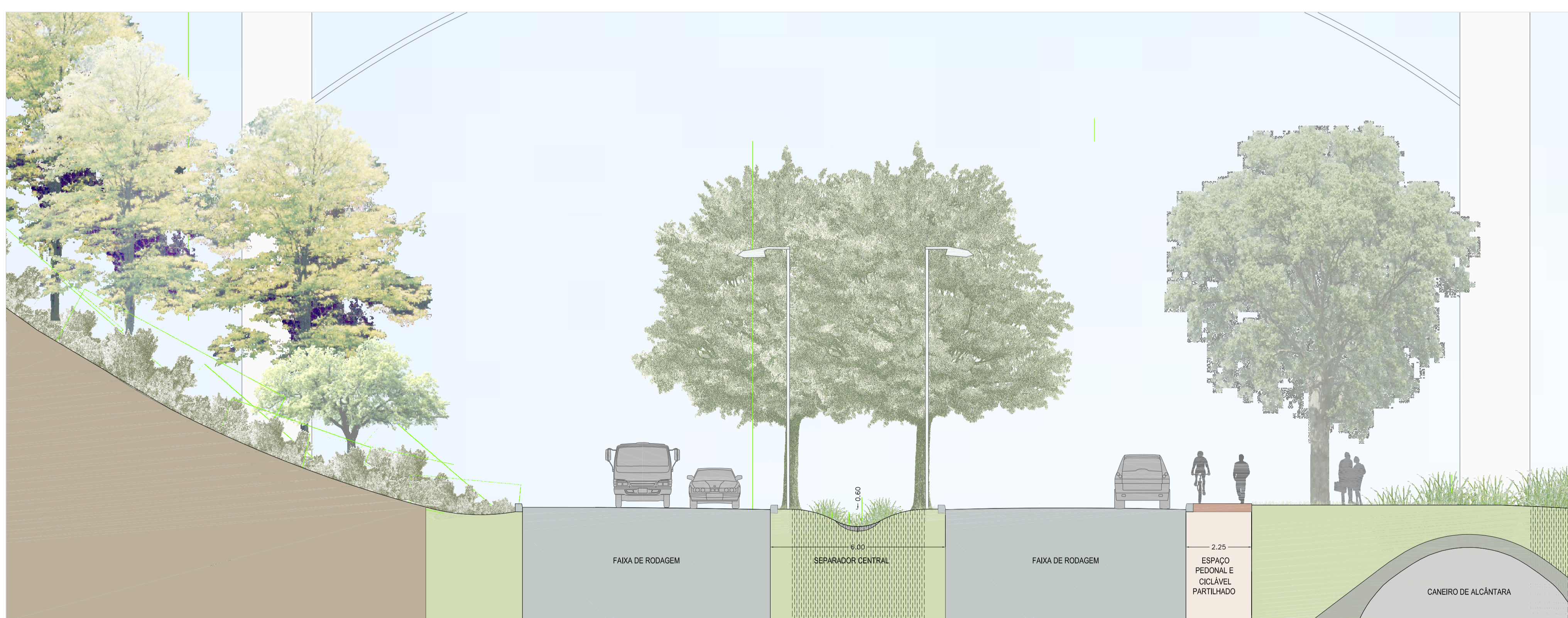
CORTE TIPO - SISTEMA VIÁRIO / JARDIM URBANO