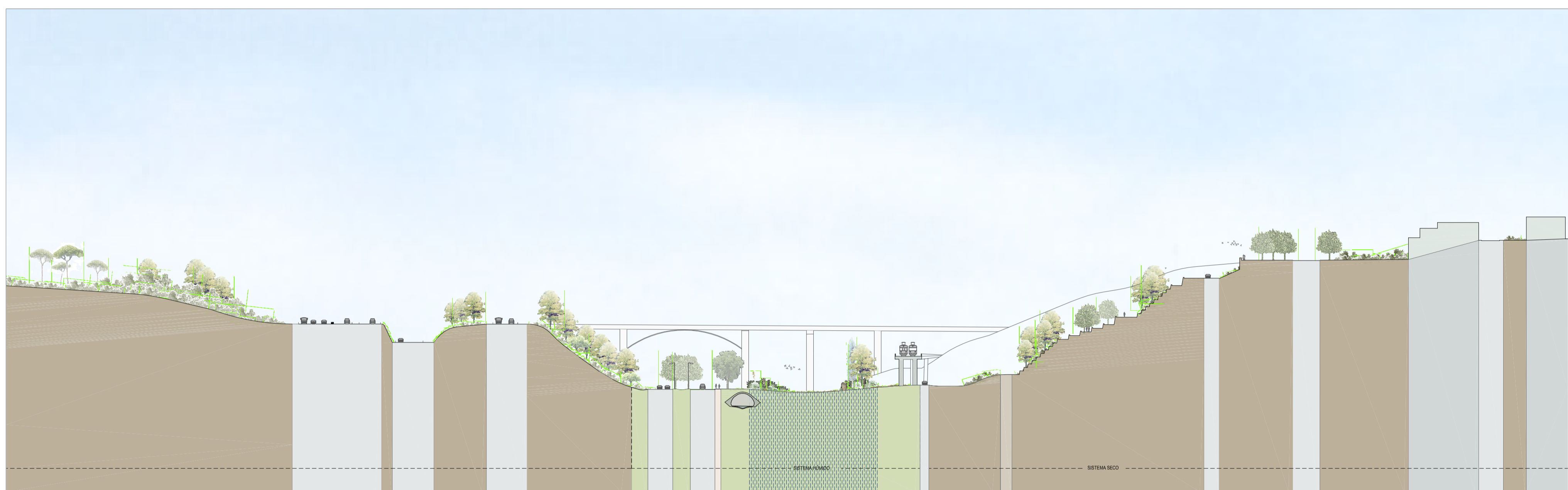
CORTE TIPO - B