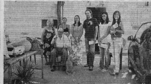
Aplicação de questionário - Juromenha

Uma das áreas que têm vindo a ser estudada com maior detalhe é o analfabetismo. As experiências têm sido muito interessantes.