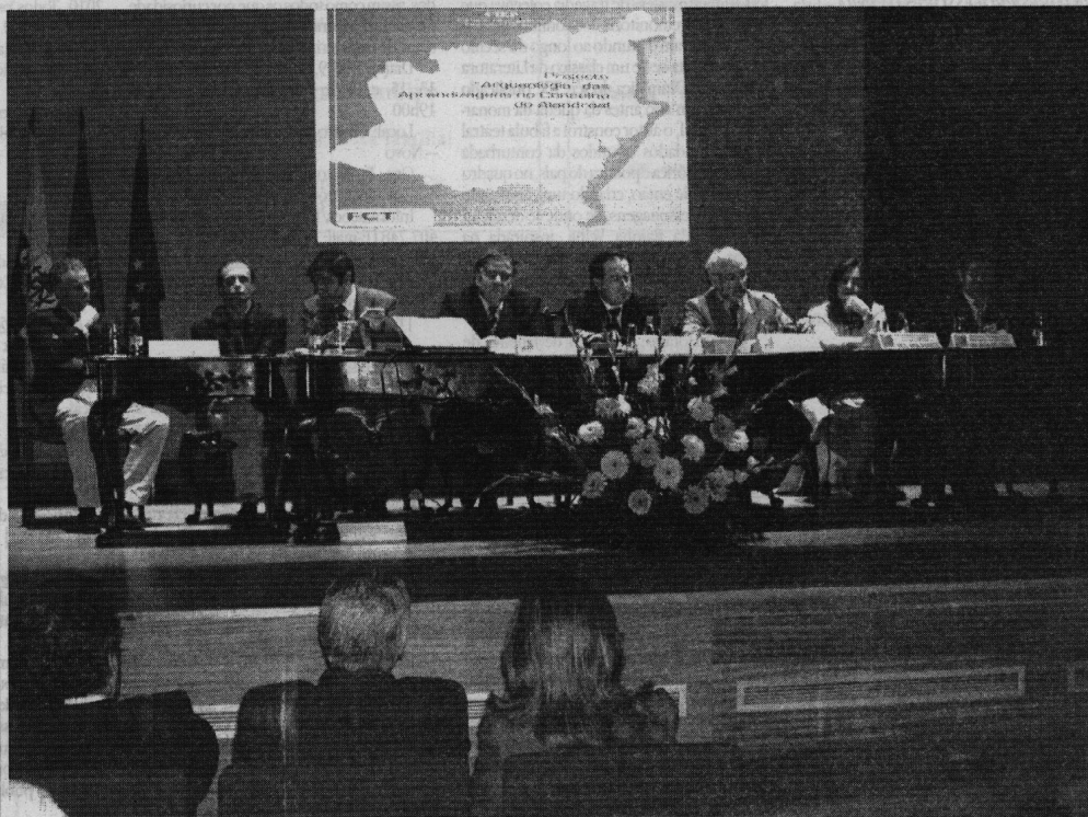
A sessão inaugural do Projecto

Na edição de hoje do Diário do SUL, começamos a descreveros a nossa caminhada investigativa, na expectativa de que a história deste nosso trabalho científico possa sensibilizar-vos para a Ciência e possa contribuir para a divulgação pública do que são e para que servem as chamadas Ciências da Educação.