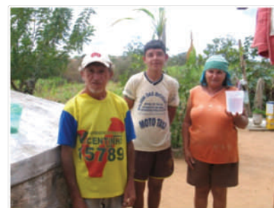
Utilização da água em situação de escassez Página 2

Esperemos ter despertado motivação para connosco, partilharem resultados, ideias e projectos dentro da temática da água e recursos hídricos, preferencialmente em países de língua portuguesa. O objectivo é que, de alguma forma, possamos contribuir para o desenvolvimento humano à escala global.