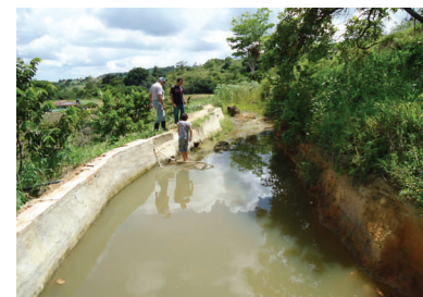
Qualidade e os usos da Água no assentamento Serra Grande Página 4