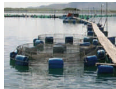
Avaliação da qualidade da água em reservatórios interligados com o rio S. Francisco Página 3