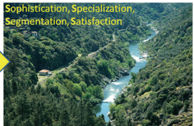
Sophistication, Specialization, Segmentation, Satisfaction