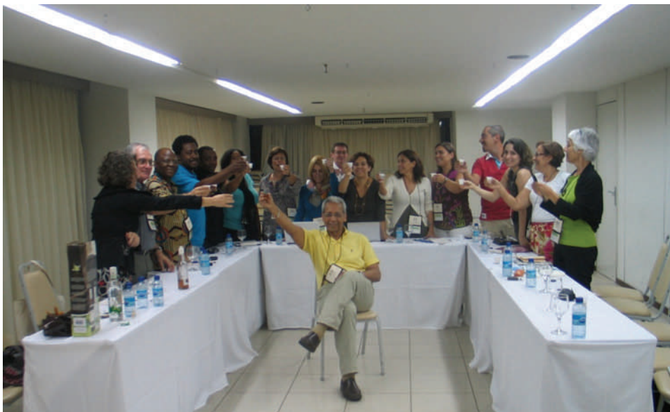
MEMBROS DA REAPLP NO ENCONTRO DE RECIFE, BRASIL - SETEMBRO 2011