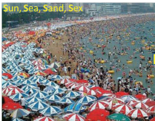
Sun, Sea, Sand, Sex

Em oposição ao turismo de massas tem-se vindo a cimentar o conceito de turismo de nicho que procura autenticidade, com responsabilidade ambiental e social. Este novo paradigma, com crescente procura por parte das classes com maior poder de compra, oriundas de mercados emissores com níveis económicos elevados, é considerado presentemente pela Organização Mundial de Turismo um vector estratégico. Os quatro S do turismo de massas são