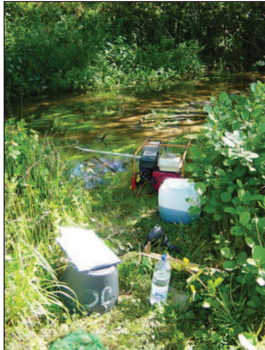
Figura 1. Aparelho de pesca eléctrica e material de amostragem.

familiarizadas com este tipo de amostragem aconselha-se a consulta de obras sobre pesca eléctrica, por exemplo Cowx (1990) ou Cowx & Lamarque (1990).