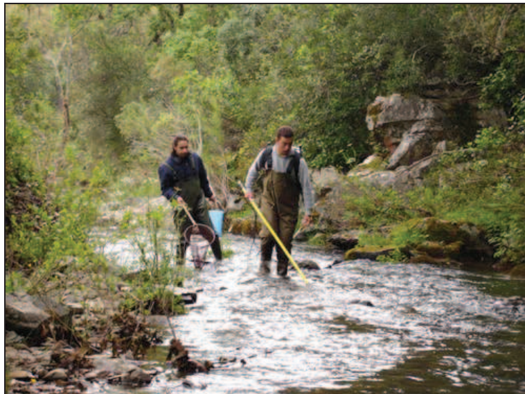
Figura 2. Pesca com aparelho dorsal em curso de água de baixa ordem: os operadores vadiam abrangendo a totalidade da largura do troço.

Nos cursos com água de grande transparência e com muito baixo valor de abrigo, o que se traduz num muito elevado comportamento de fuga por parte dos peixes, deverão os operadores proceder à descarga de corrente após período de imobilização (mínimo de 20 - 30 s) com os eléctrodos na água.