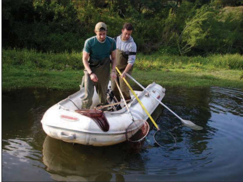
Figura 3. Pesca com barco em curso de profundidade superior a 0,8m.

Nos casos em que são vistos peixes mas não se efectuam capturas, apesar da adopção das estratégias de pesca mais eficazes, deverá ser registada nas fichas a ocorrência de peixes, discriminando-se os taxa (espécie ou família) se tal for possível.