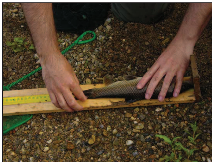
Figura 6. Medição de um exemplar.

Se numa determinada amostragem o número de exemplares capturados de uma espécie for muito elevado, só será medida uma subamostra de 50 indivíduos.