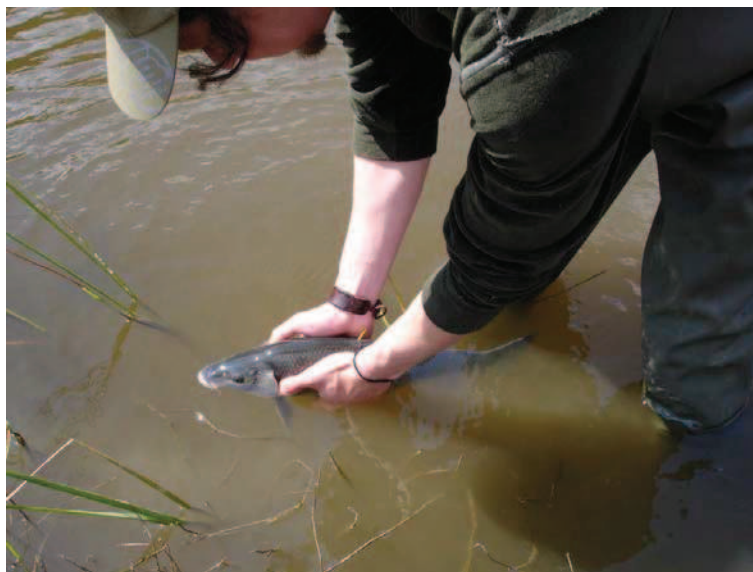
Figura 5. Devolução à água de exemplar.