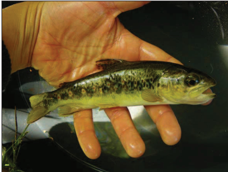
Figura 4. Exemplar de Salmo trutta .

oxigenar por meios mecânicos...). Após identificação e medição, os exemplares deverão ser devolvidos ao meio, cuidadosamente libertados em zonas sem corrente (Figura 5.).