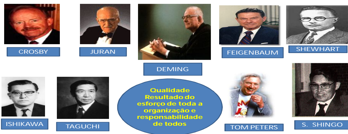
Tabela 2.1.1 – Gurus da Qualidade

É um conceito dinâmico e multifacetado que evoluiu ao longo do tempo em função dos vários domínios do saber, muitos teóricos deram o seu contributo para a melhoria do conceito da qualidade, destacando-se: