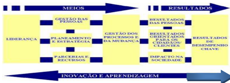
Figura 2.5.1 – Modelo Common Assessment Framework

Porque a CAF enquanto metodologia de autoavaliação da qualidade possibilita a aplicação a organizações públicas de inquéritos por questionário, utilizou-se essa possibilidade neste estudo, ainda que adaptados à situação em análise, como método de recolha de informação dos dados primários.