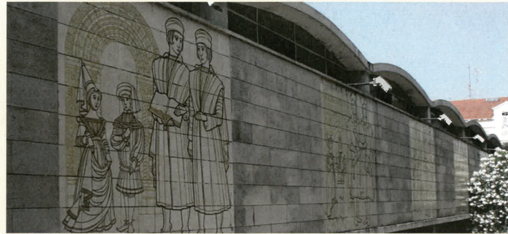
Manta, João Abel. Painel em pedra gravada, Associação Académica de Coimbra, Página oficial da Universidade de Coimbra

Vive em Londres e em 1981 publica novos trabalhos no Jornal de Letras . A sua atividade como cartoonista torna-se esporádica. Obteve vários prémios nacionais e estrangeiros; participou em inúmeras exposições individuais e coletivas, em Portugal e no estrangeiro, incluindo a publicação dos respetivos catálogos.