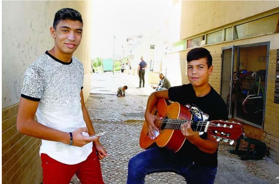
Figura 3 – Jovens do bairro Cida-Talha