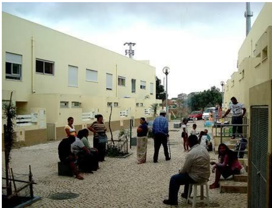
Figura 2 – Bairro Cida-Talha