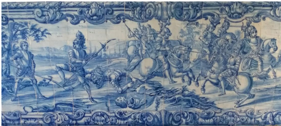
Figura 1 - Cena da Eneida, sala 118.

Quem ainda hoje entra na sala 118 e não tenha informação sobre a Eneida de Virgílio pode ficar com uma ideia das passagens marcantes dessa epopeia, incluindo a identificação das principais personagens. O herói Eneias está identificado, bem como o seu rival Turnus e o rei do Lácio, Latino e as suas filhas: Amata e Lavínia. Outras personagens centrais na obra estão também plasmadas nos azulejos: a deusa Vénus, a mítica figura de Troia e a lendária guerreira Camila. Ora o estudante de Latim e Retórica, que devia ler e reler a Eneida, tinha nesta sala aquilo que o manual não lhe oferecia: a imagem das personagens, a descrição das cenas principais, como o combate entre Eneias e Turnus, a visualização do horror, da violência e da crueldade da guerra; lá está representado um guerreiro a ser trespassado pela lança, outro jaz no chão já decepado, corpo para um lado e a cabeça para outro. A imagem ilustrava e completava as palavras magistrais do poema de Virgílio (Fig. 1).