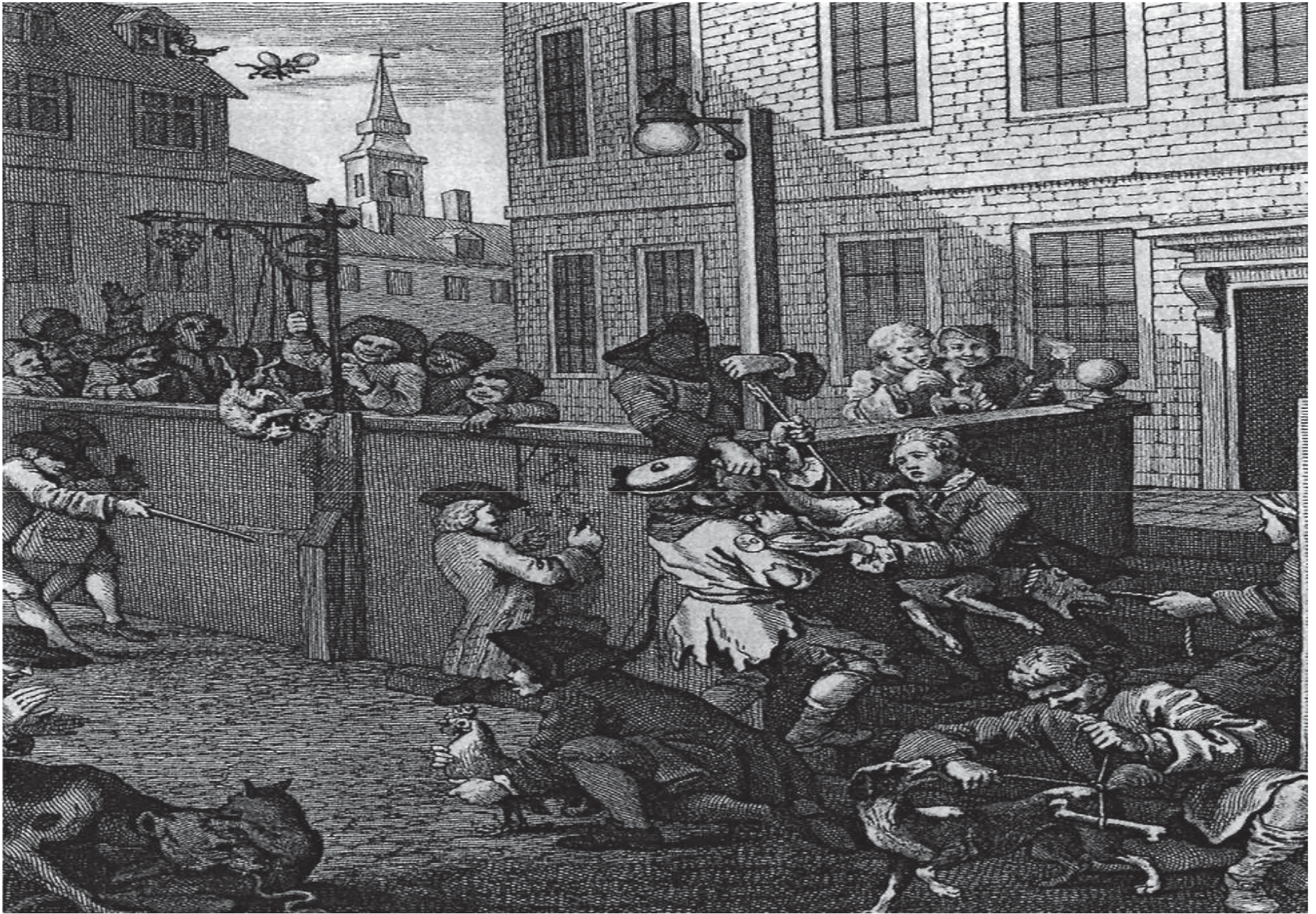
First Stage of Cruelty (1751) by Hogarth, William (1697–1764) - The Four Stages of Cruelty