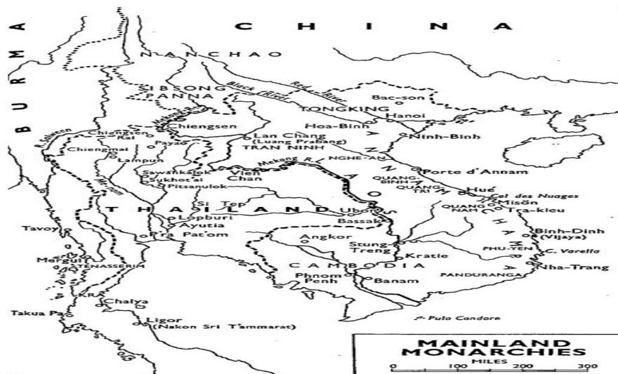
Mapa – “Mainland Monarchies”, in D.G.E. Hall – A History of Southeast Asia . London: Macmillan, 1981, p. 189.