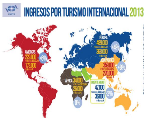
Figura 1: Chegadas com pernoitas no local de destino no turismo internacional em 2013