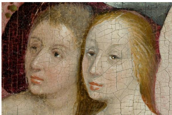
Figura 4: Second Canvas Museo del Prado : Jardim das delícias (detalhe), de Hieronymus Bosch