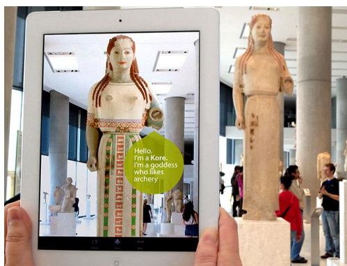
Figura 5: CHES

O programa piloto CHES ( Cultural Heritage Experiences through Socio-personal Interaction and Storytelling ), em desenvolvimento entre 2011 e fevereiro do corrente ano, foi oficialmente apresentado na Innovation Convention 2014 (Bruxelas, 10-11 março 2014) e, em seguida, na ICRI 2014 - International Conference on Research Infrastructures (Atenas, 2-4 abril 2014), durante a visita oficial ao Museu Acropolis, um dos parceiros da base experimental do projeto, juntamente com a Cité de l'Espace, de Toulouse. O projeto, de âmbito internacional, foi cofinanciado pela Comissão Europeia, no âmbito do Seventh Framework Programme (FP7), com o objetivo de criar uma aplicação potencializadora da experiência no museu, através de elaboração de storytellings interativas e personalizadas, em estruturas híbridas que se adaptam ao utilizador. “The principal objective of CHES is to research, implement and evaluate an innovative conceptual and technological framework that will enable both the experiencing of personalised interactive stories for visitors of cultural sites and their authoring by the cultural content experts.” (CHES, 2013) Para isso, propõe-se criar conteúdos digitais interativos através da articulação entre os modelos tecnológicos de storytelling digital, realidade aumentada e ferramentas de autor.