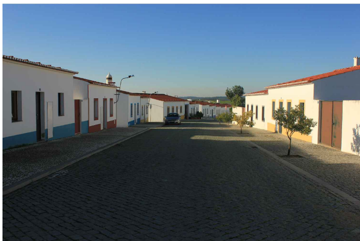
Fig.46 A Nova Aldeia da Luz

Outro tema bastante salientado foi o facto da albufeira submergir um vasto património com milhares de anos, como o Castelo Romano da Lousa, ter sido submerso pelas águas da albufeira, ficando apenas na memória de alguns, ou o exemplo do Cromleque do Xerês que foi transferido para outro local.